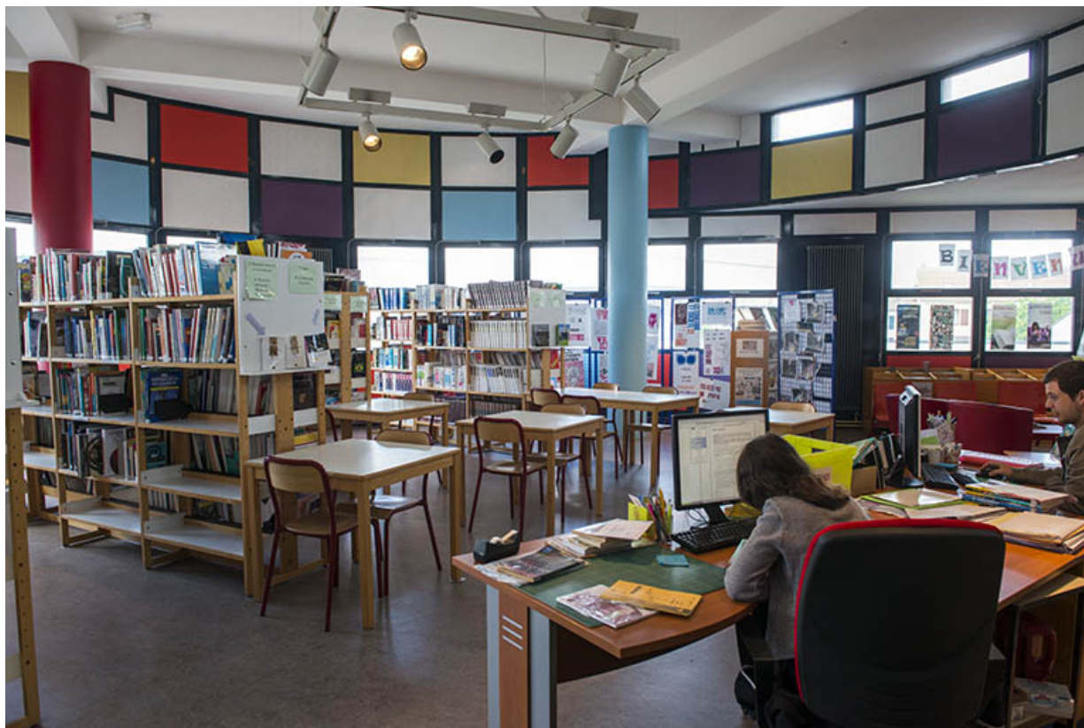
Vue intérieure du CDI dans la proue.