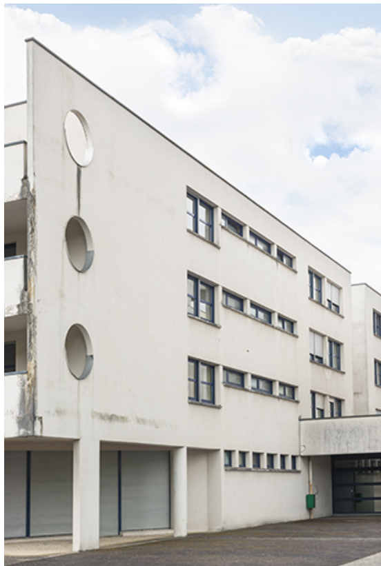
Angle nord-est de l'internat et sa façade nord-est sur cour postérieure. 62, Héricourt rue Pierre Mendès France