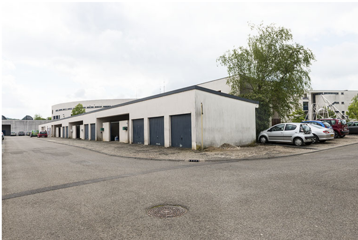
Les façades nord le long de la rue Mendès France.