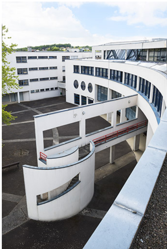
Sud-ouest de la cour postérieure, angle nord-est de l'internat et façade sud de l'externat semi-circulaire. 62, Héricourt rue Pierre Mendès France