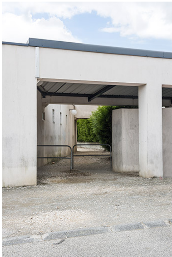
Détail du passage de la rue Mendès France vers la cour. 62, Héricourt rue Pierre Mendès France