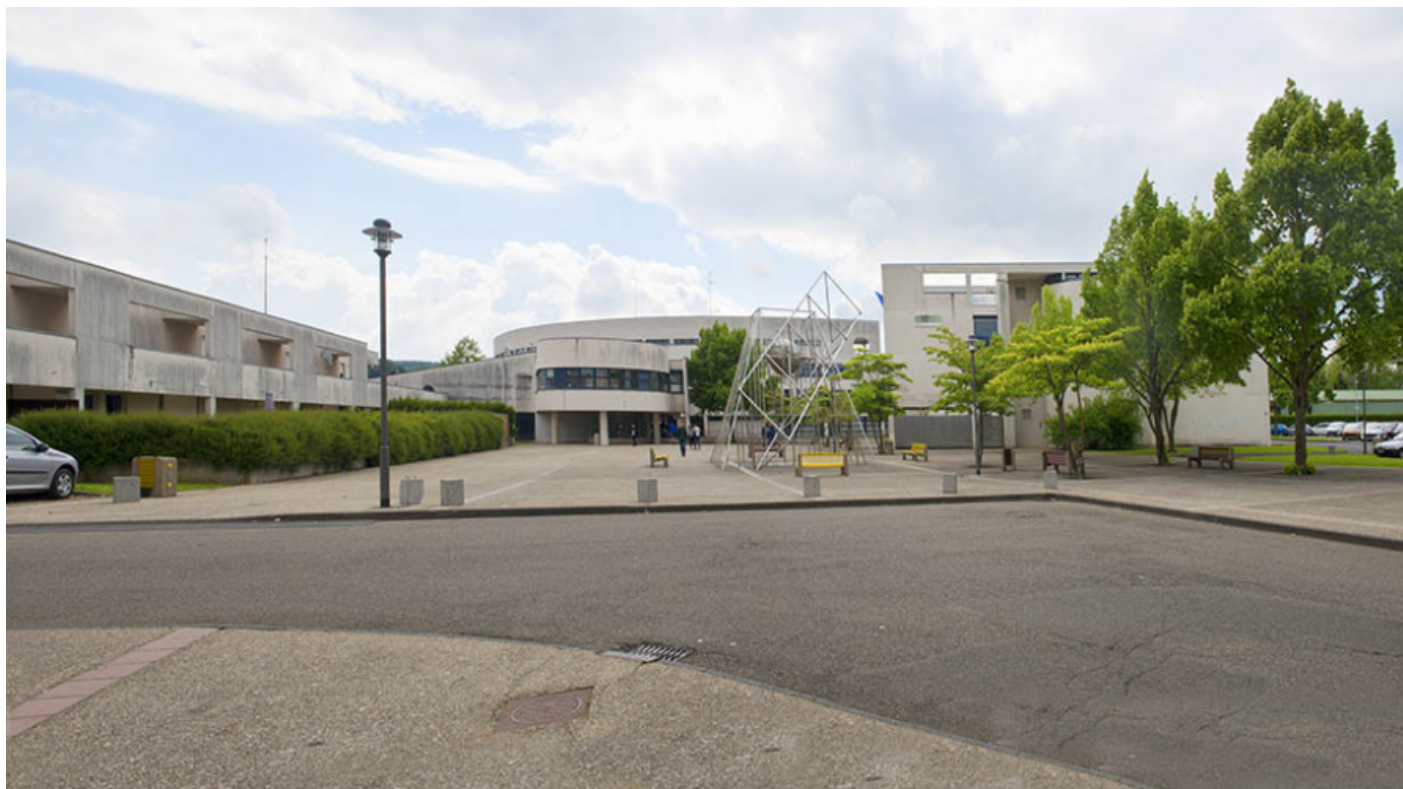
Vue de l'ouest de la place Elsa Triolet.