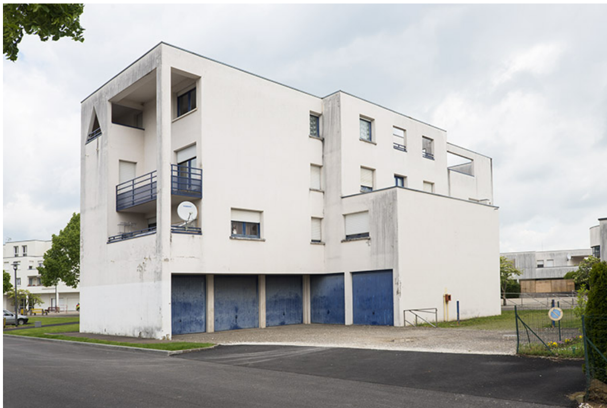
Angle sud-ouest des logements ouest. 62, Héricourt rue Pierre Mendès France