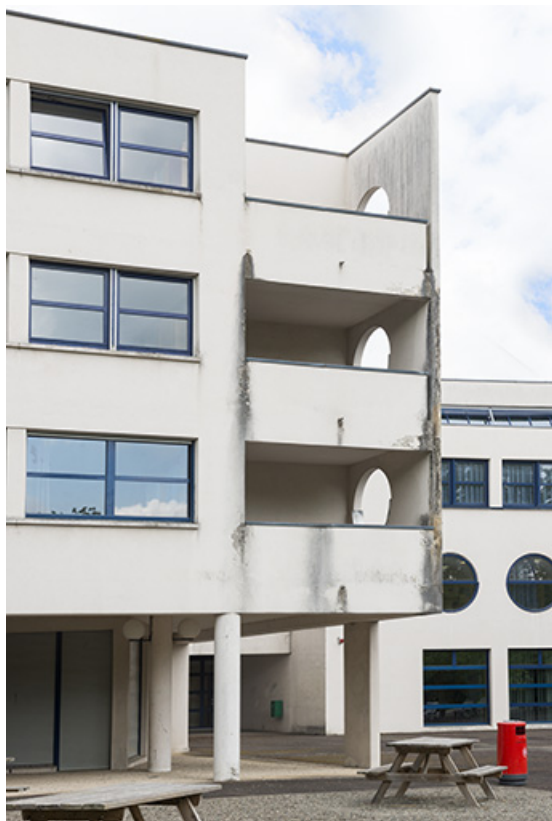
Détail de l'angle est de l'internat sur cour. 62, Héricourt rue Pierre Mendès France