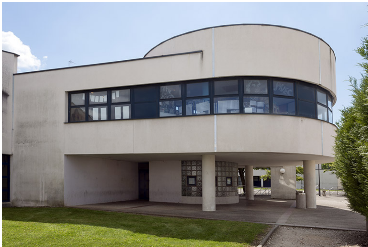
Détail de la façade nord de la proue de l'externat.