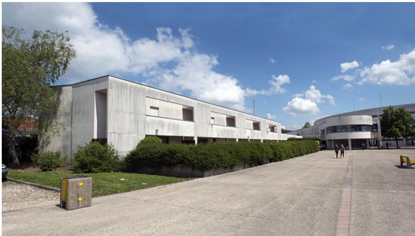
Façade sud des logements de fonction donnant sur la place municipale Elsa Triolet. 62, Héricourt rue Pierre Mendès France