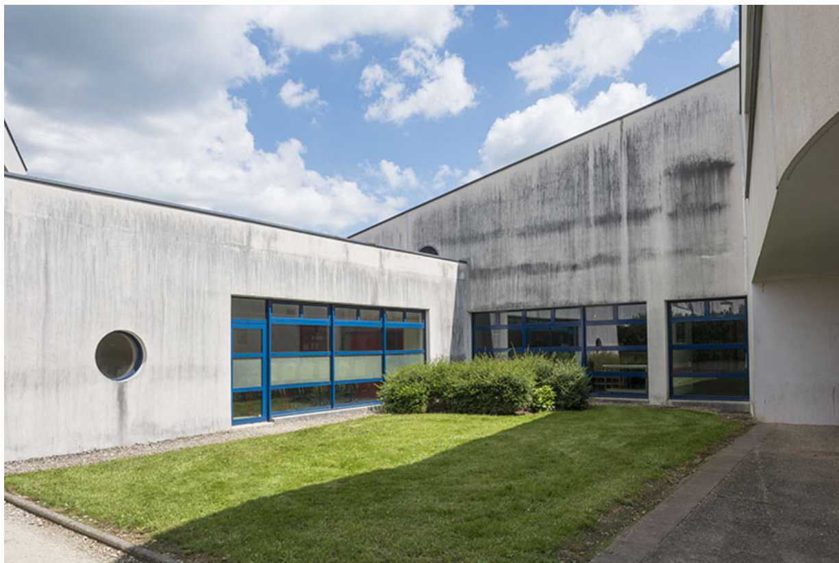
Jonction de l'externat avec logements, au nord-est de la proue de l'externat. 62, Héricourt rue Pierre Mendès France