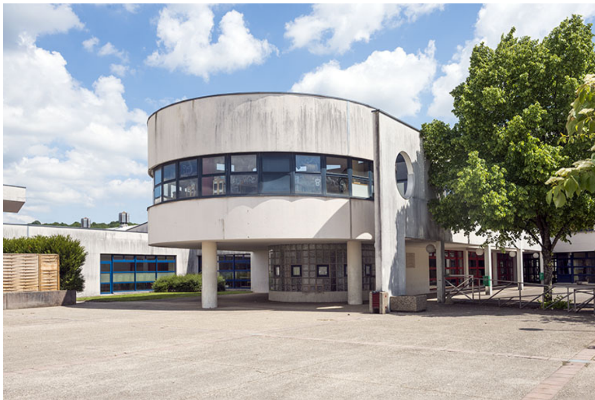
Détail de la façade antérieure nord de la proue de l'externat.