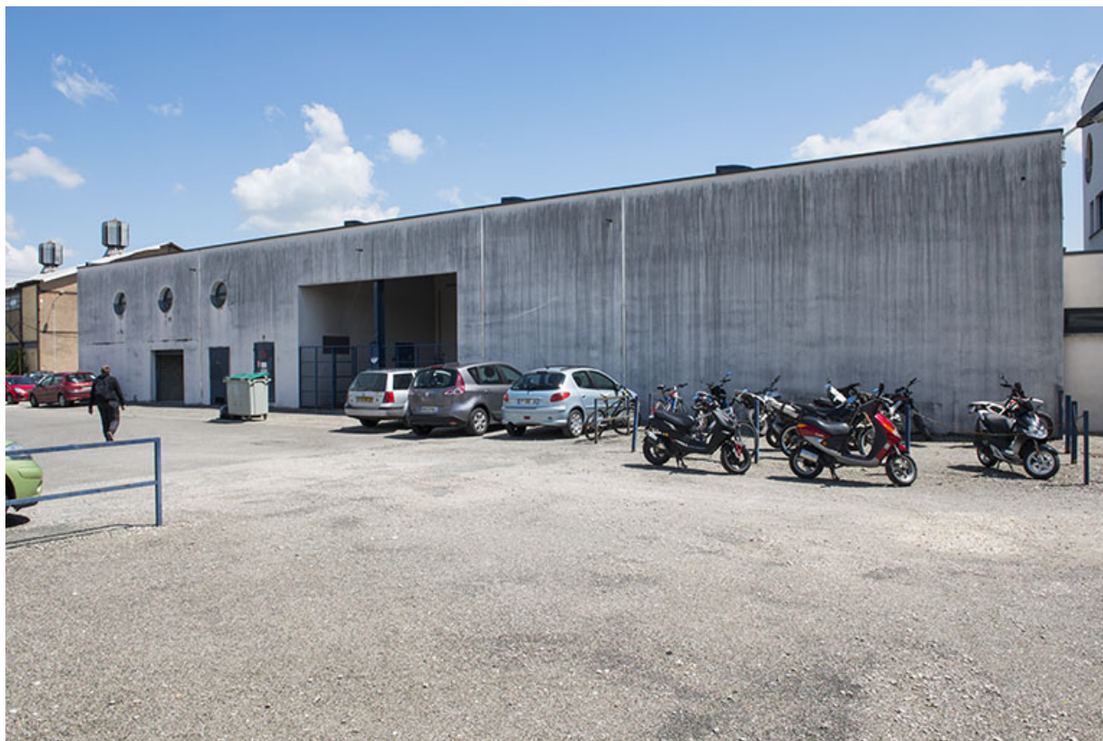
Façade ouest de l'atelier.