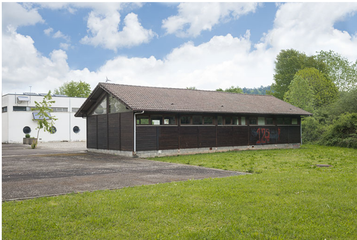
Angle sud-ouest du chalet dans la cour.