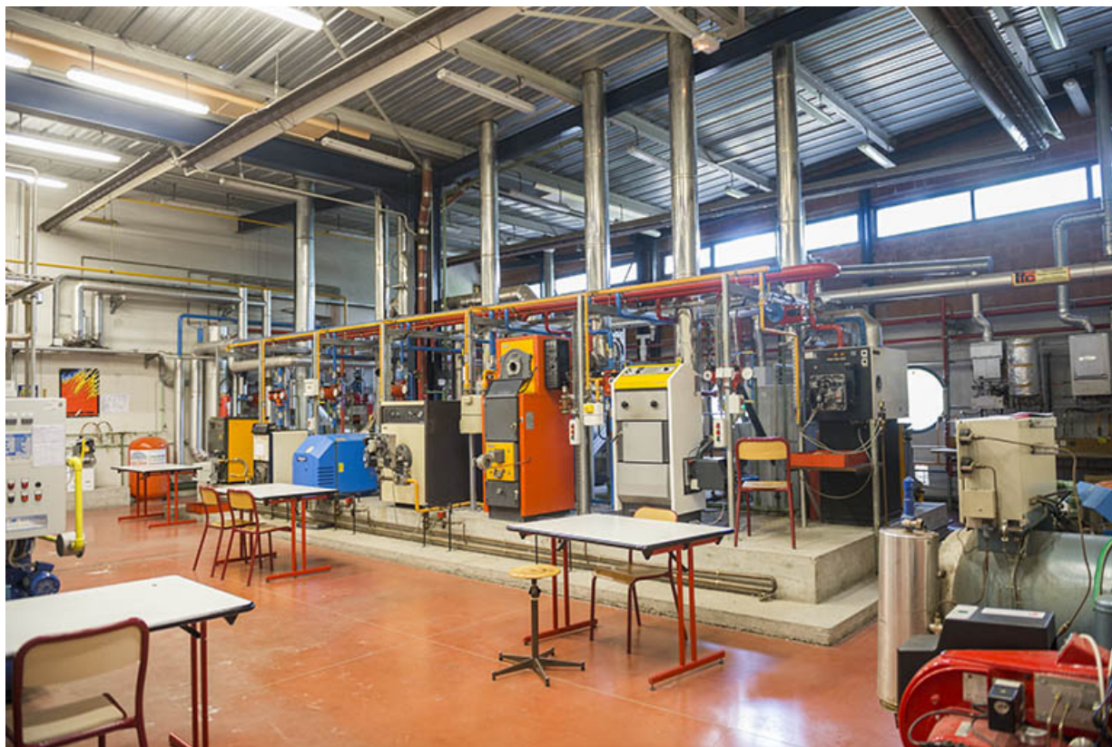
Vue intérieure des ateliers du pôle énergie. 62, Héricourt rue Pierre Mendès France