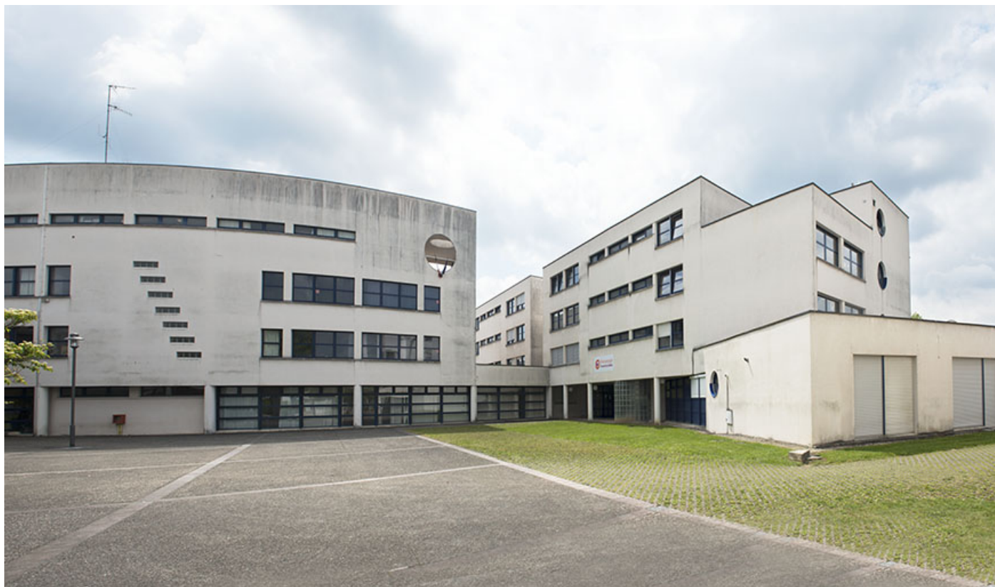
Cour et façade antérieure nord-ouest de l'externat et façade nord de l'internat. 62, Héricourt rue Pierre Mendès France