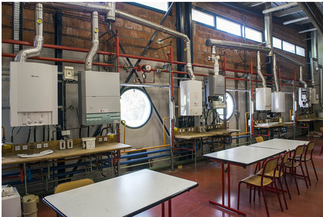
Vue intérieure des ateliers du pôle énergie. 62, Héricourt rue Pierre Mendès France