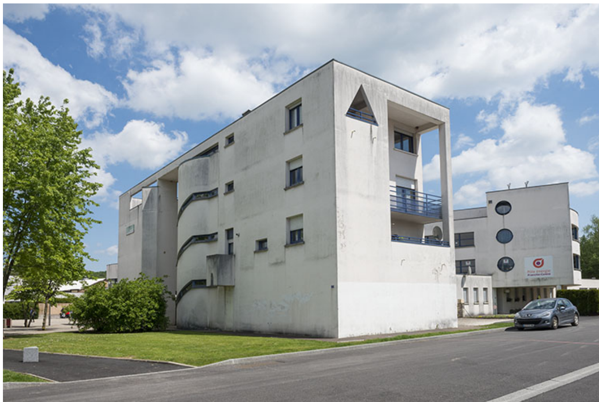
Vue depuis l'angle nord-ouest des logements sud-ouest. 62, Héricourt rue Pierre Mendès France