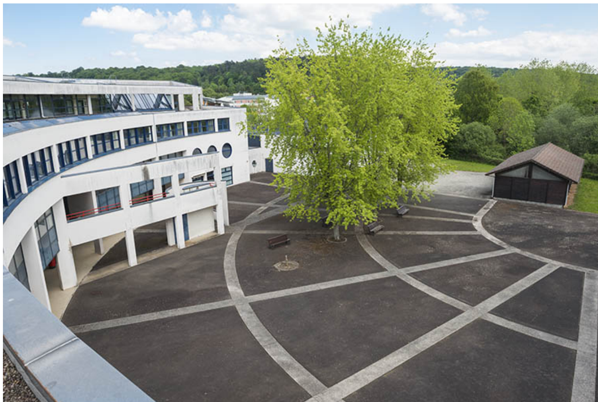
Cour et façade postérieure sud de l'externat. 62, Héricourt rue Pierre Mendès France