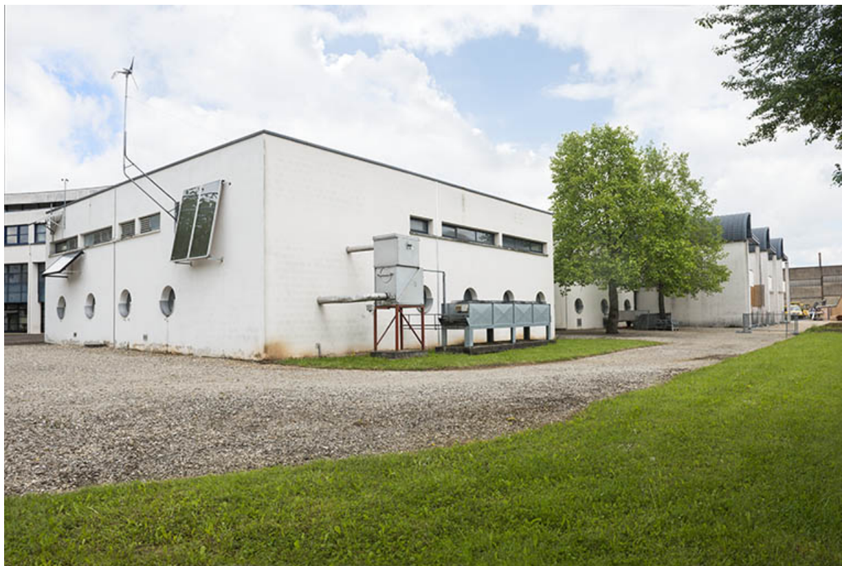
Angle sud de l'extension sud-ouest de l'atelier. 62, Héricourt rue Pierre Mendès France