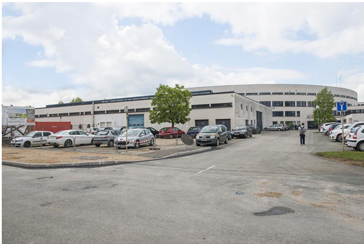
Les façades de l'externat et de l'atelier depuis le nord-est.