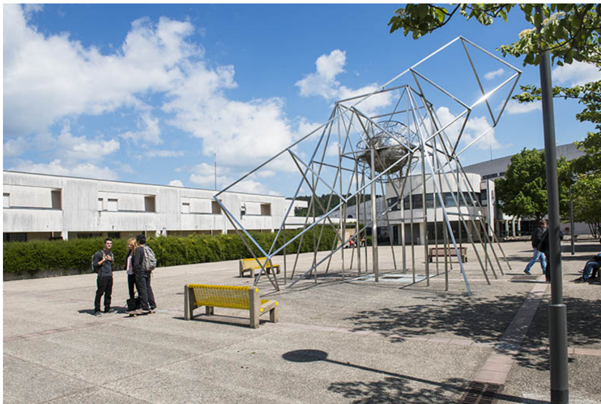
L'oeuvre sur sa place Elsa Triolet, vue de l'ouest. 62, Héricourt rue Pierre Mendès France