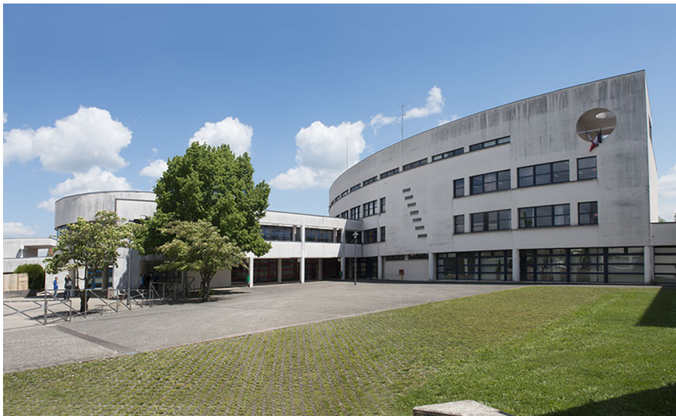
Cour et façade antérieure nord-ouest de l'externat.