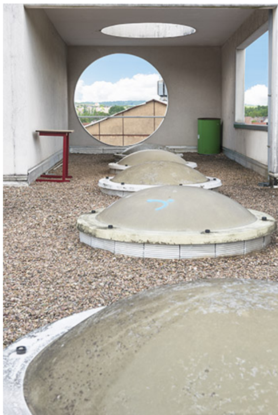
Sur la terrasse de l'externat semi-circulaire.