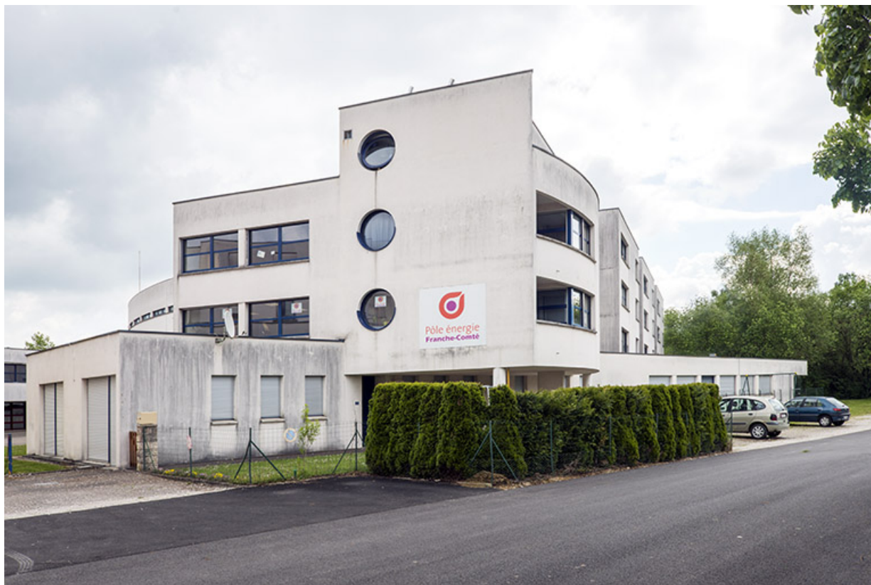
Façade ouest de l'infirmierie, angle nord-ouest de l'internat et du pôle énergie. 62, Héricourt rue Pierre Mendès France