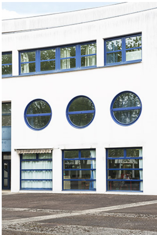
Détail de la façade postérieure sud de l'externat. 62, Héricourt rue Pierre Mendès France