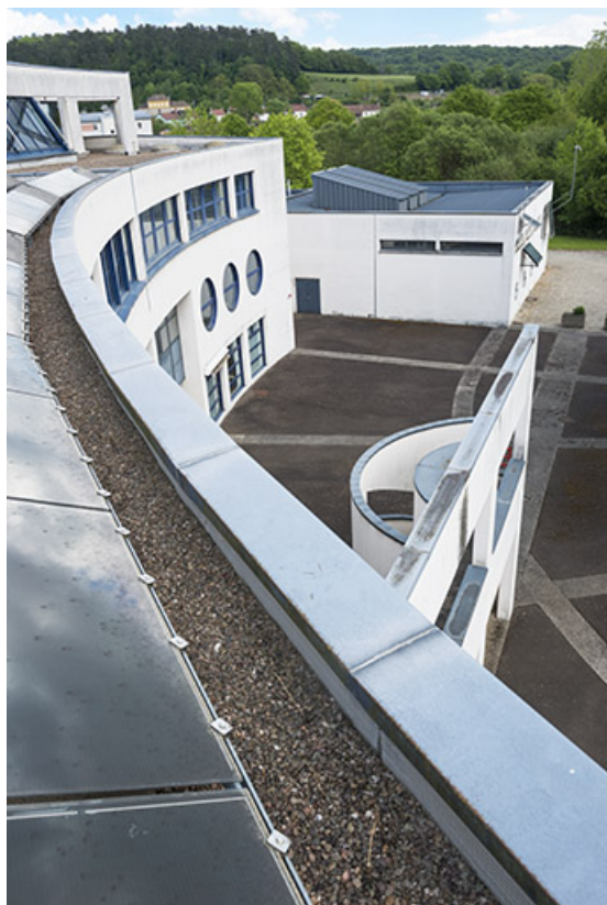
Détail de la toiture de l'externat sur cour et vue sur l'escalier.