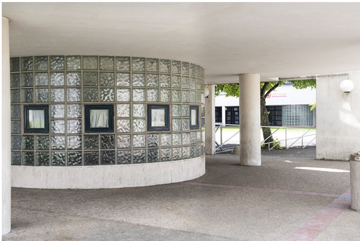
Détail de la rotonde vitrée de la proue de l'externat.