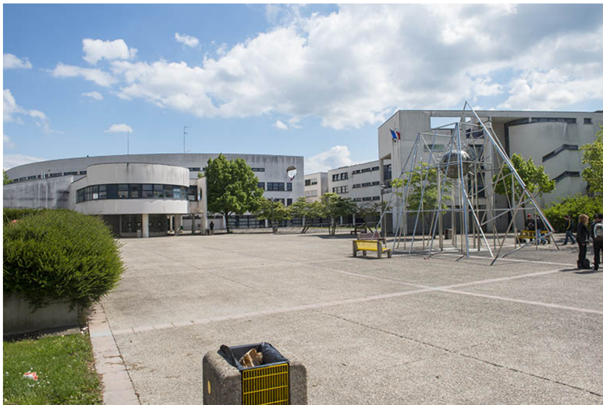
L'oeuvre sur sa place Elsa Triolet, vue du nord. 62, Héricourt rue Pierre Mendès France