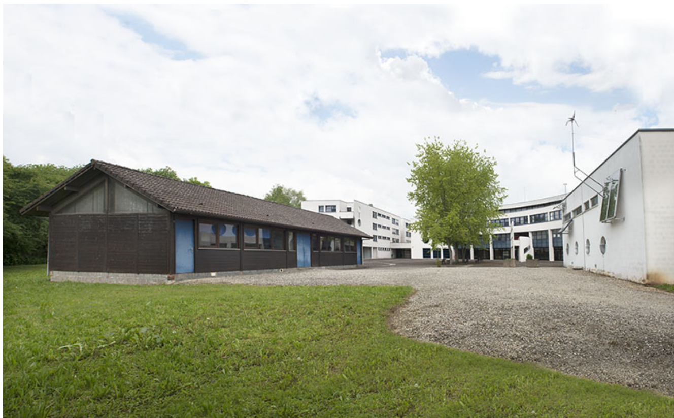
Angle sud-est du chalet et cour postérieure.