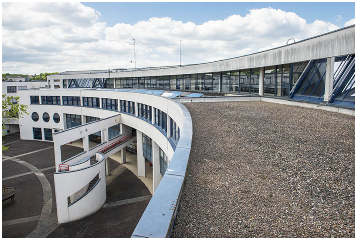
Détail de la terrasse de l'externat semi-circulaire.