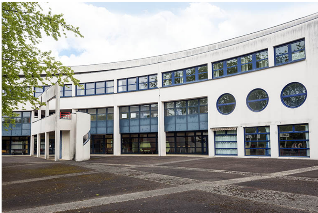
Cour et façade postérieure sud de l'externat. 62, Héricourt rue Pierre Mendès France