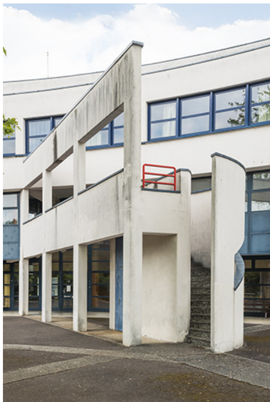
Détail de l'escalier hors-oeuvre dans la cour postérieure. 62, Héricourt rue Pierre Mendès France