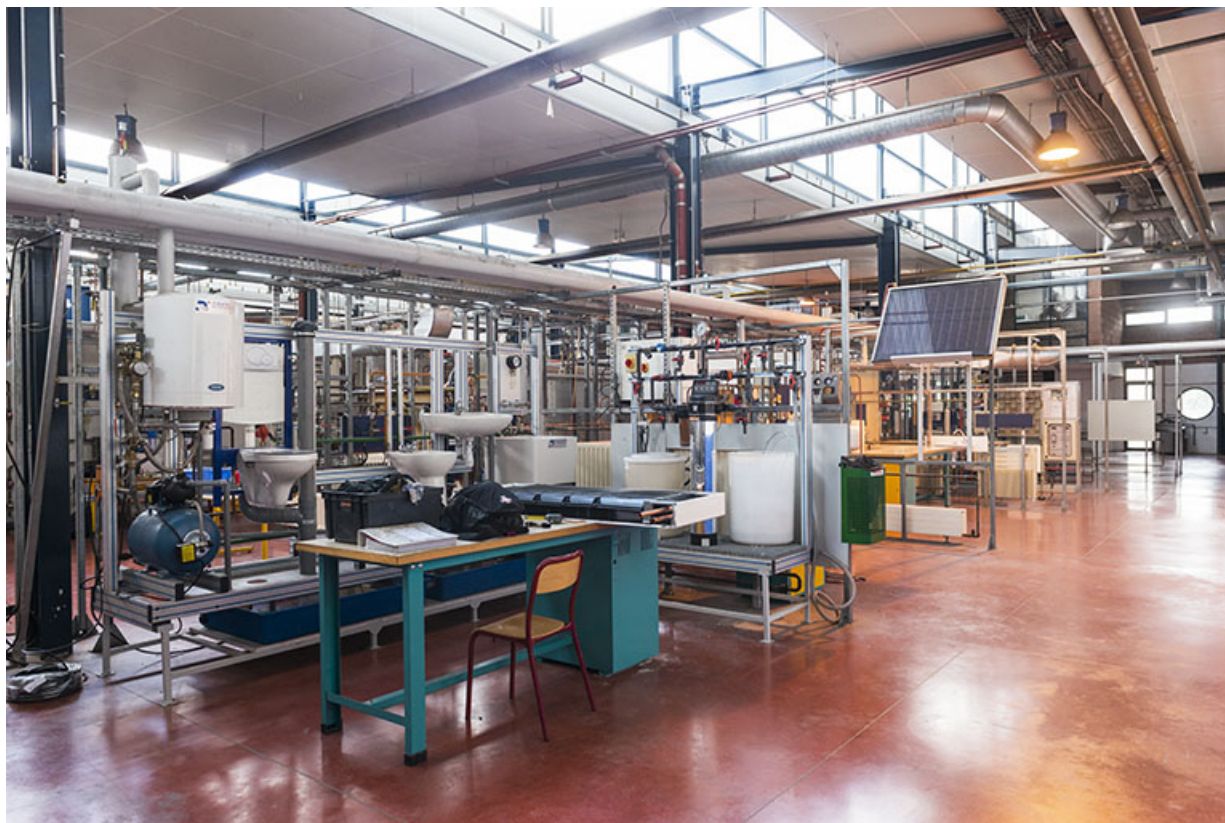
Vue intérieure des ateliers du pôle énergie.