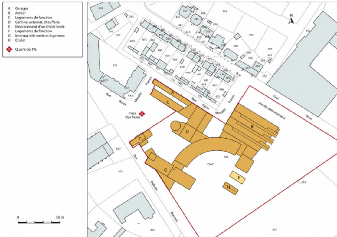
Plan-masse et de situation. Extrait du plan cadastral numérisé, section AR, échelle 1:1000. 62, Héricourt rue Pierre Mendès France