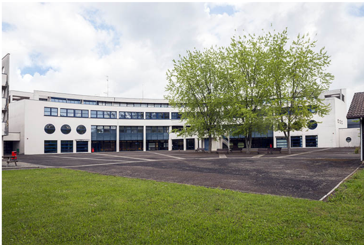
Cour postérieure et façade sud de l'externat semi-circulaire.