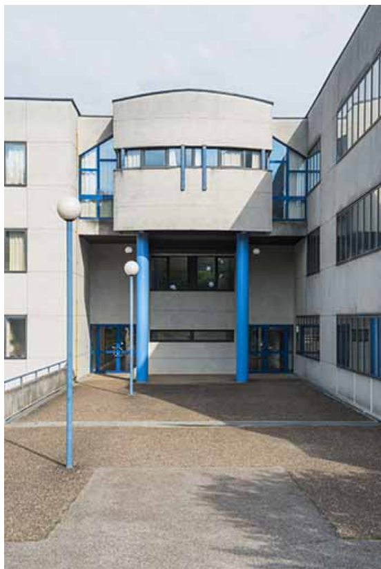
Détail de la façade sud-est, entrée postérieure.

70, Vesoul, 1 rue Jean Georges Girard, lieudit : le grand Miselot