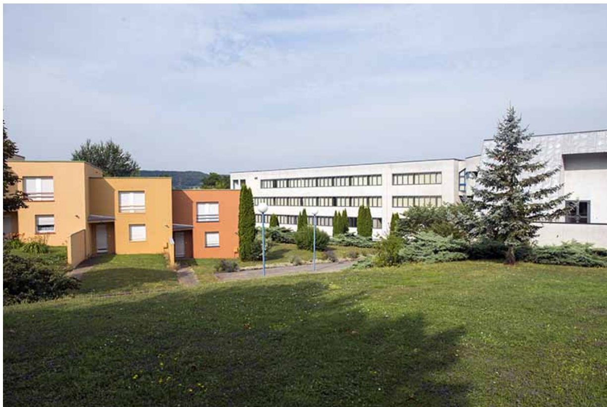
Façades antérieures est des logements et façade postérieure sud-est du lycée.

70, Vesoul, 1 rue Jean Georges Girard, lieudit : le grand Miselot