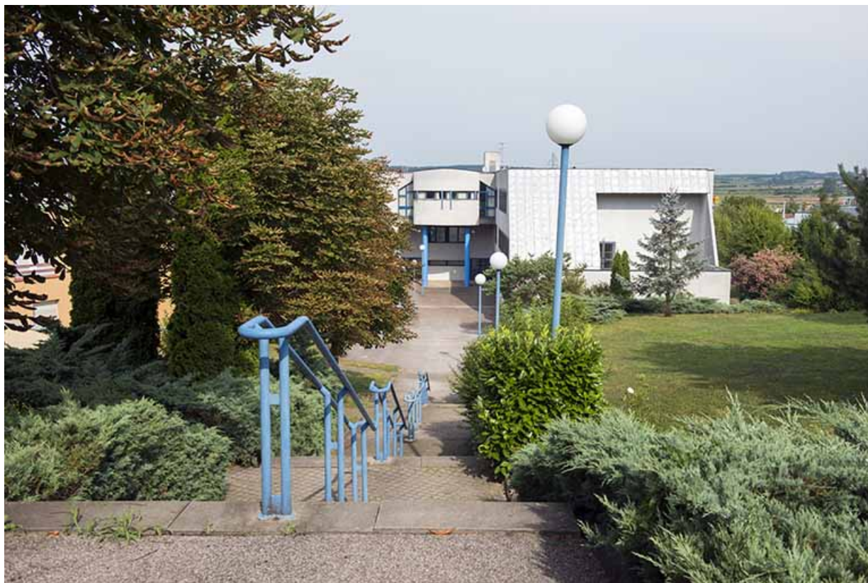
Escalier desservant les façades sud-est du lycée et les façades antérieures est des logements.

70, Vesoul, 1 rue Jean Georges Girard, lieudit : le grand Miselot