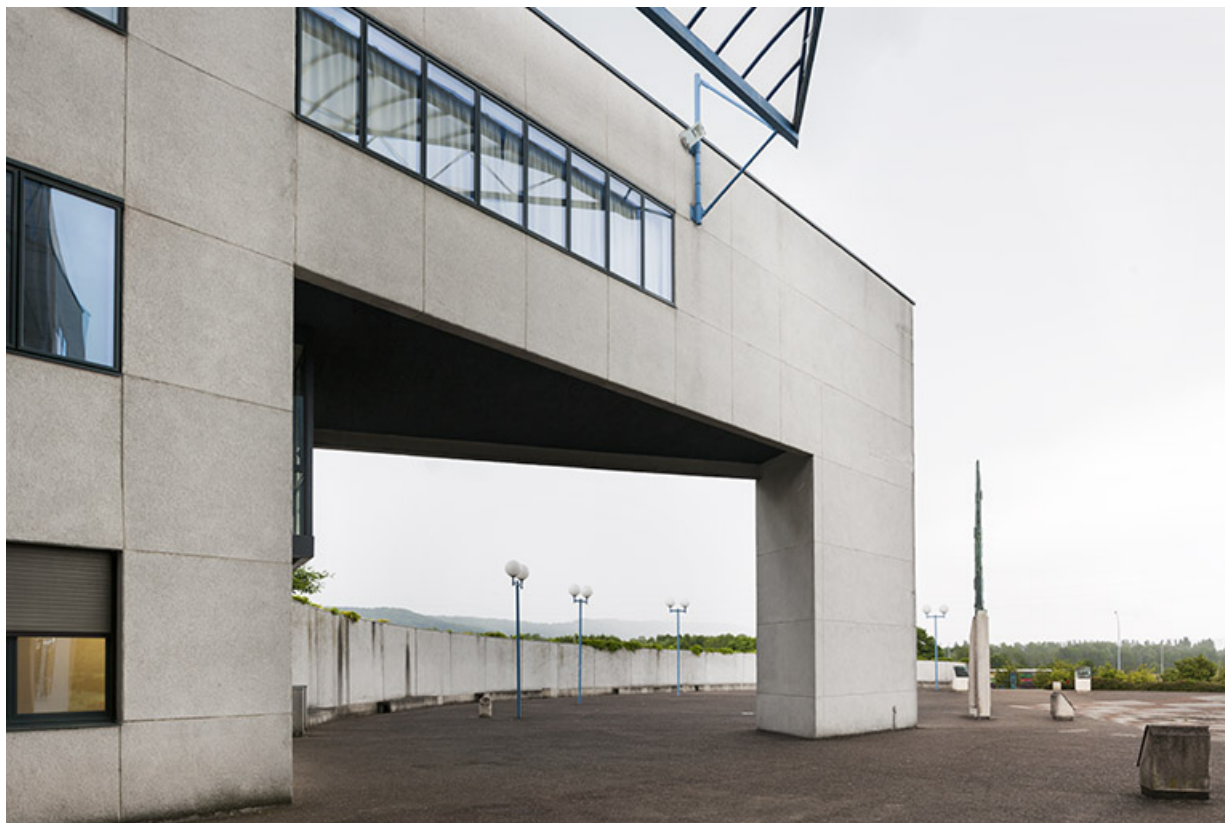
Vue sur la place parvis et son horloge solaire depuis l'entrée.

70, Vesoul, 1 rue Jean Georges Girard, lieudit : le grand Miselot