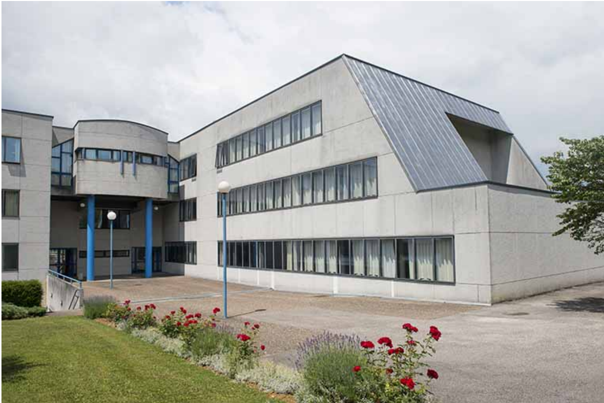
Entrée postérieure et angle sud de l'aile nord-est de l'externat.

70, Vesoul, 1 rue Jean Georges Girard, lieudit : le grand Miselot