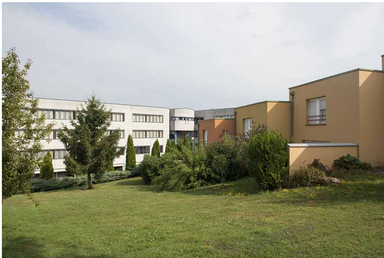
Façades postérieures ouest des logements et façade postérieure sud-est du lycée.

70, Vesoul, 1 rue Jean Georges Girard, lieudit : le grand Miselot