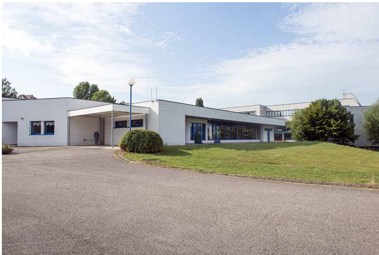
Angle nord-ouest et façade ouest de la restauration.

70, Vesoul, 1 rue Jean Georges Girard, lieudit : le grand Miselot