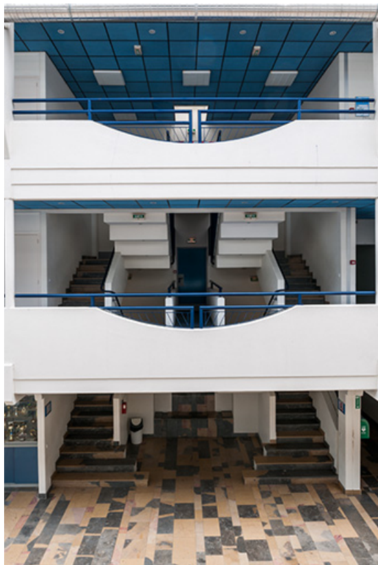
Détail d'escalier intérieur perpendiculaire à l'axe de la rue. 70, Vesoul, 1 rue Jean Georges Girard, lieudit : le grand Miselot