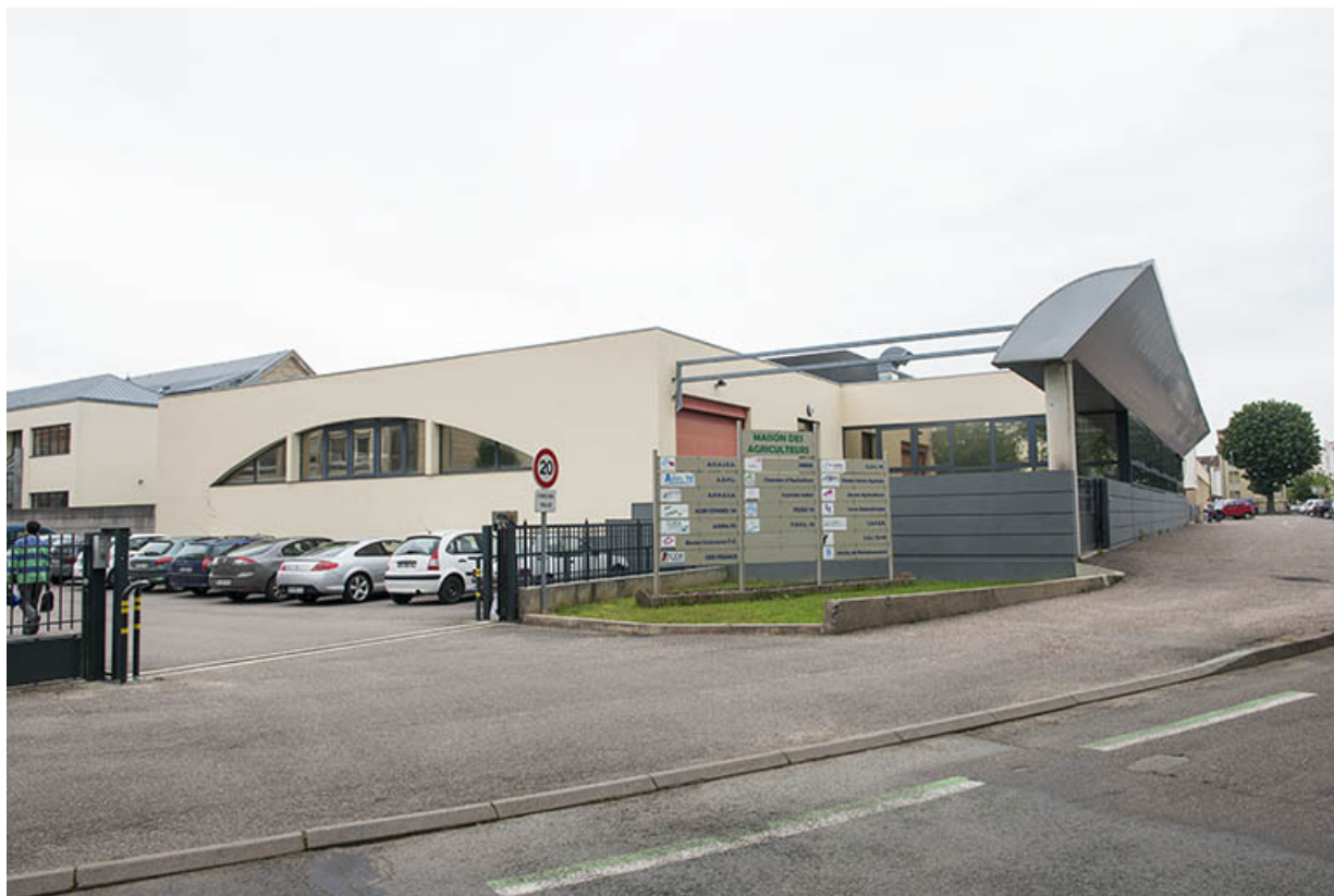
Angle sud-ouest, façade d'entrée sur le quai Barbier.