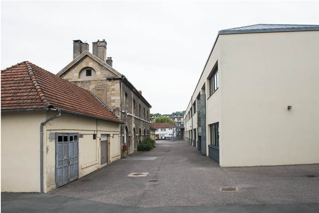
Pignons sud de l'atelier des agents, à l'ouest et de l'externat, à l'est.