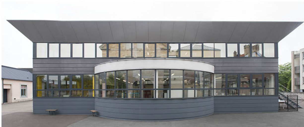
Façade sur cour de l'atelier froid et climatisation domotique.