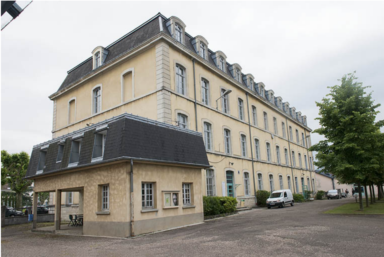
Pignon nord-ouest de l'administration-internat.