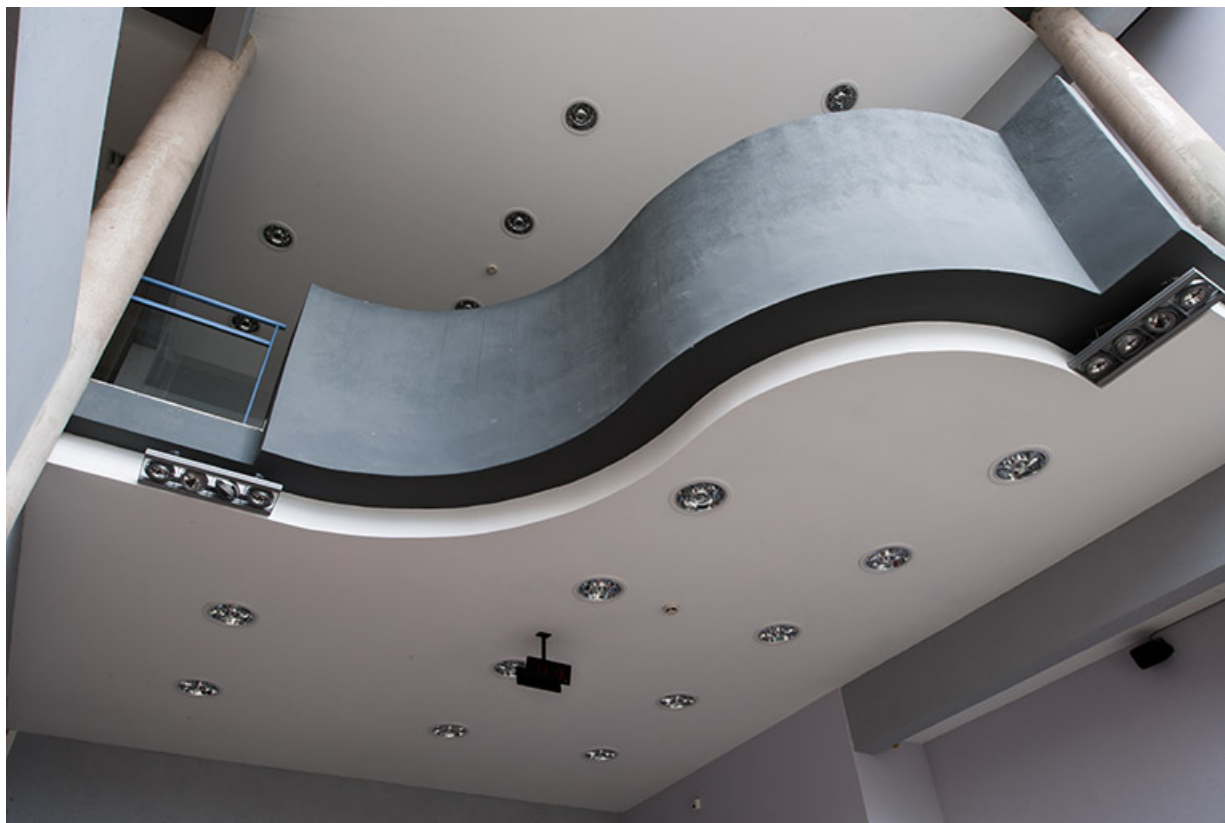
Vue intérieure de l'escalier de l'externat.