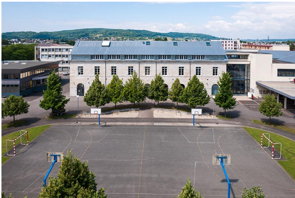
Cour, stade et façade est de l'externat.