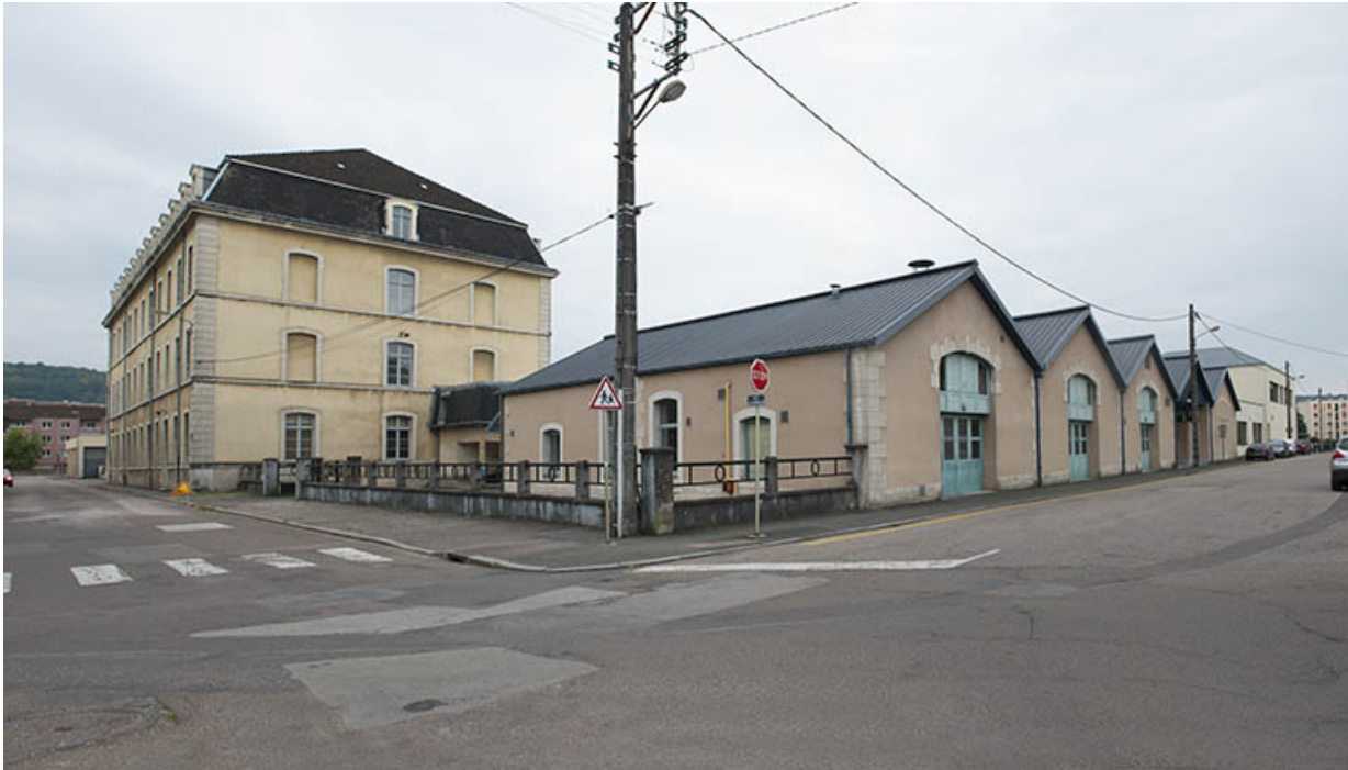
Angle nord-est sur rue, pignon est de l'administration-internat.