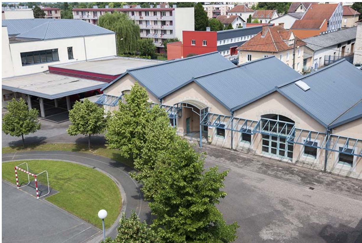
Nord-ouest de la cour et façade sud intérieure de la cantine.