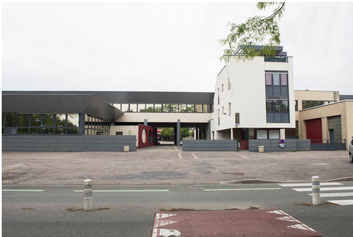
Façade sud, entrée sur le quai Barbier. 70, Vesoul, 16 place du 11 ème chasseur