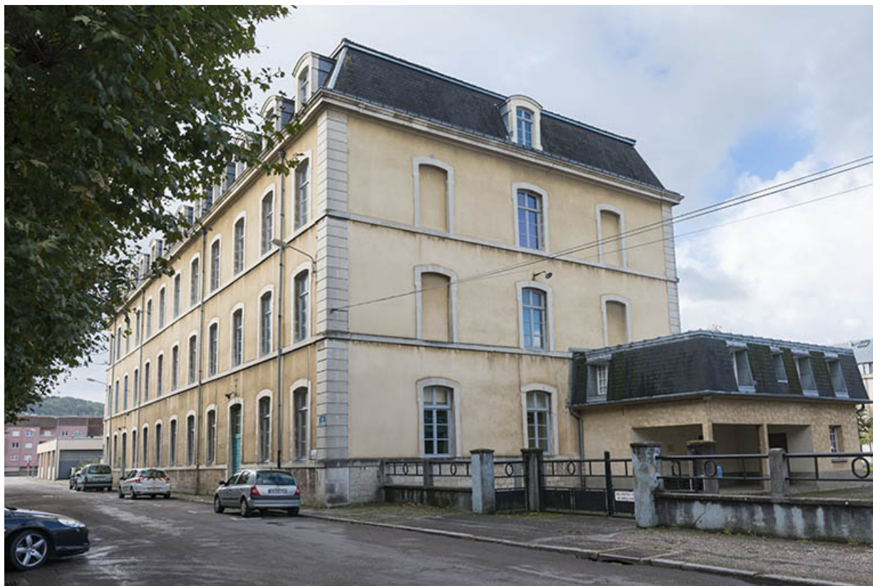
Façade est donnant sur la place du 11ème chasseur, pignon nord de l'administration-internat.