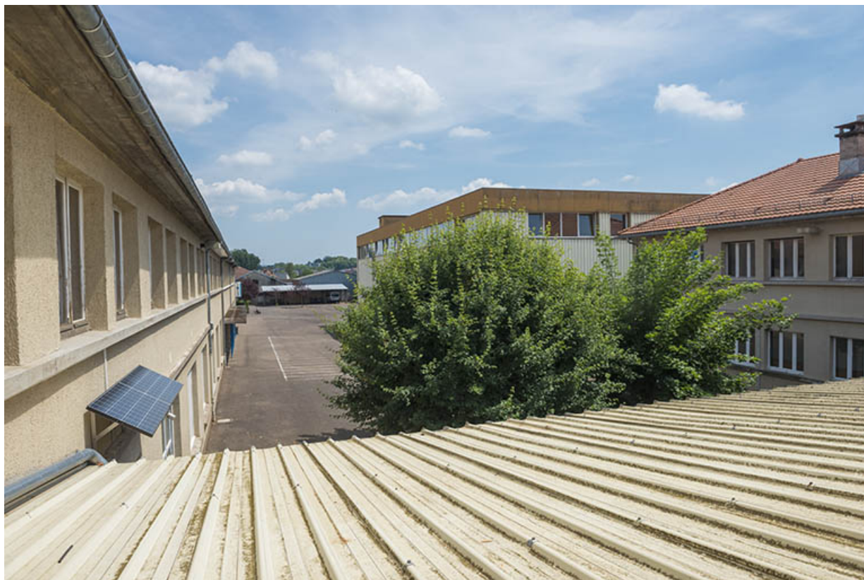
La cour vue de l'externat atelier.