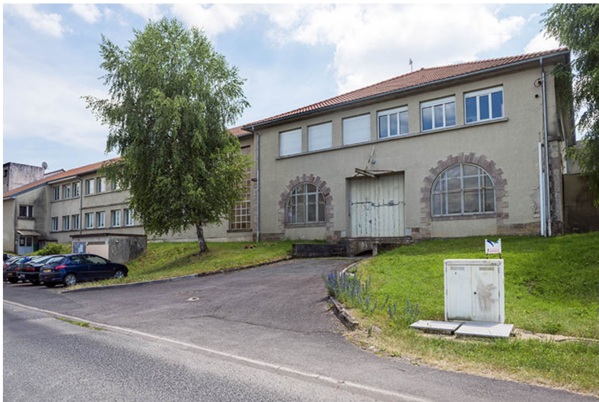
Aile ouest de la façade nord rue de Bourdieu.