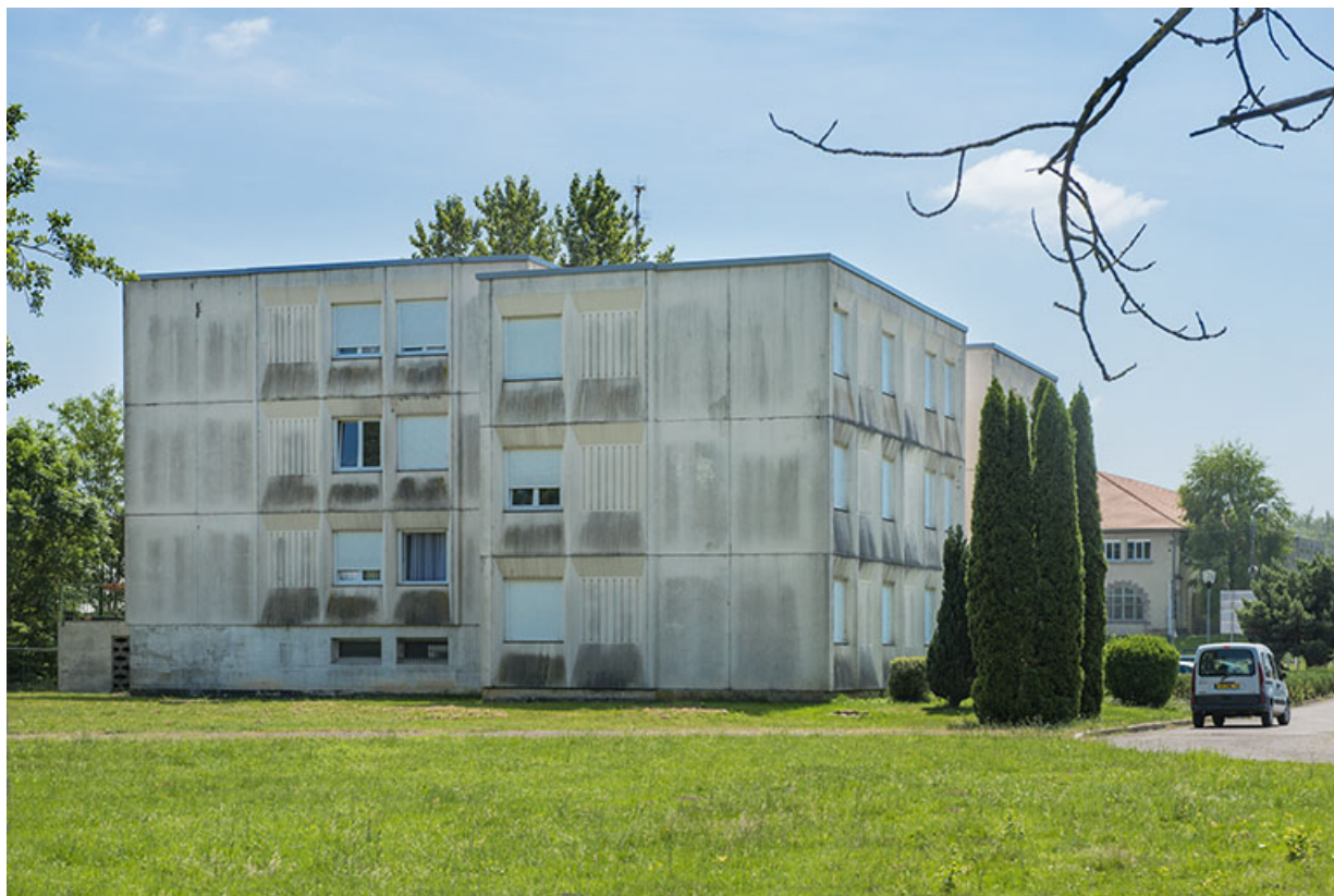
Angle nord-ouest des logements de fonction.