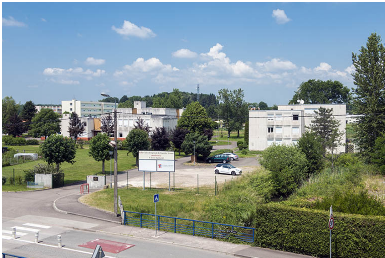
Vue d'ensemble du site nord.