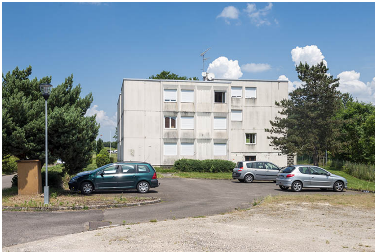
Façade sud des logements.