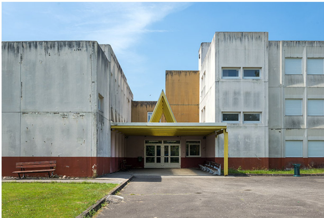
Détail de la façade orientale de la restauration.