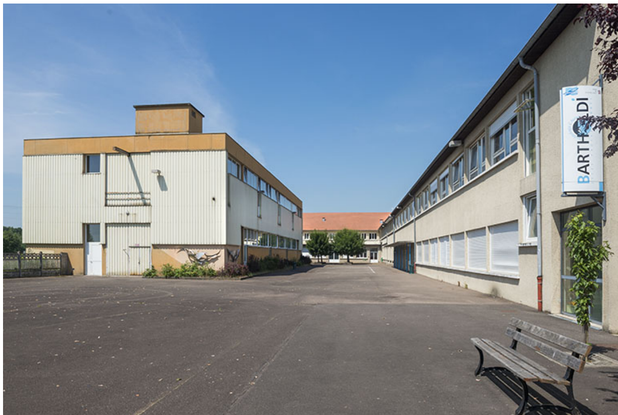
Vue de l'entrée depuis l'est.