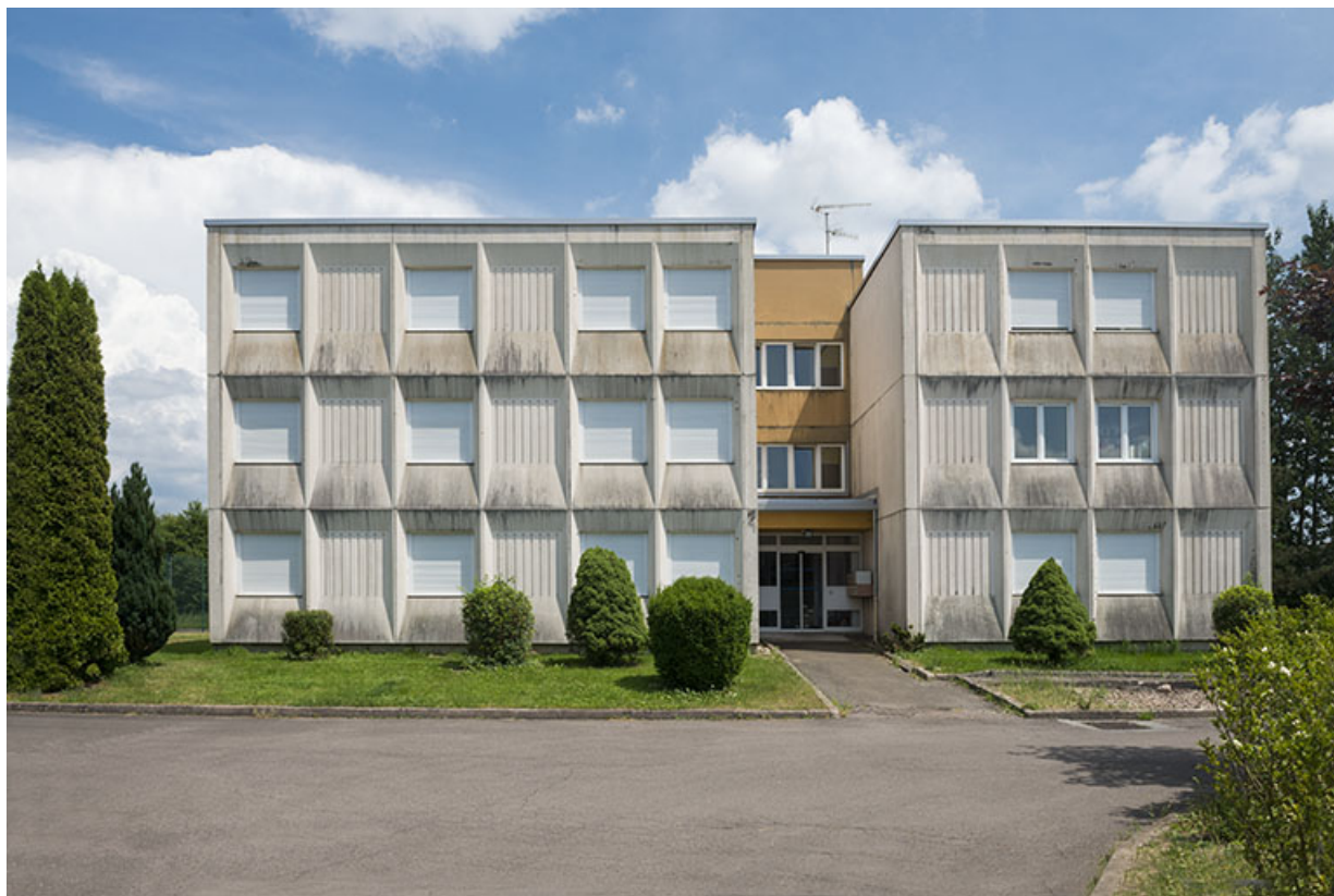
Façade ouest d'entrée des logements de fonction.