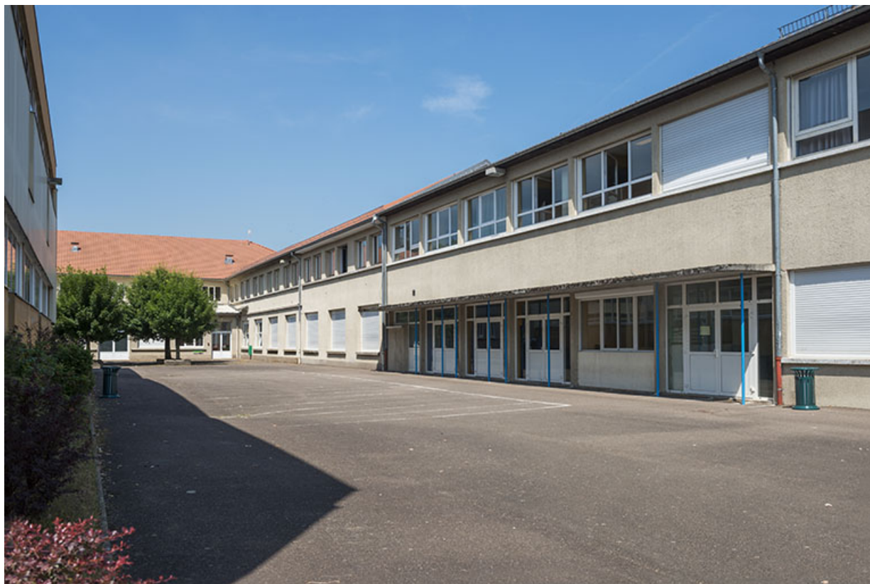
Partie ouest de la cour.