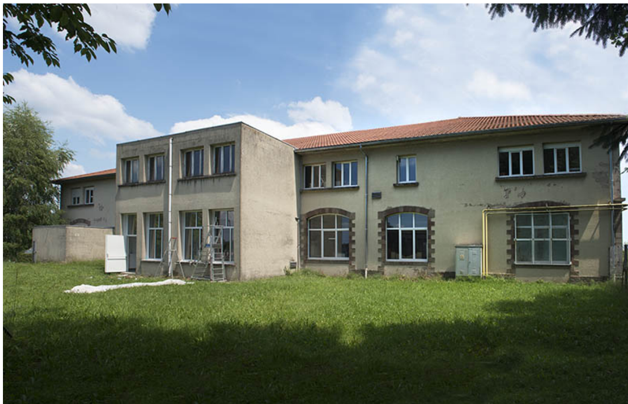
Façade ouest de l'externat atelier.