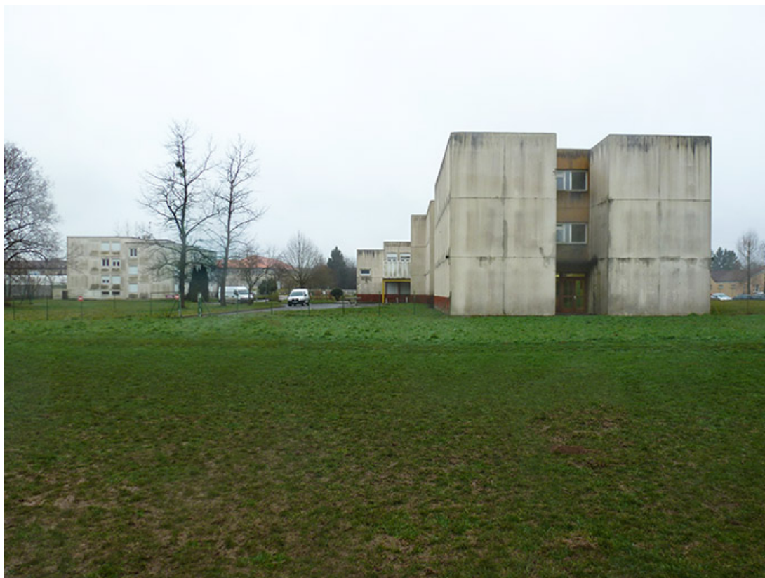
Façade nord de l'internat.