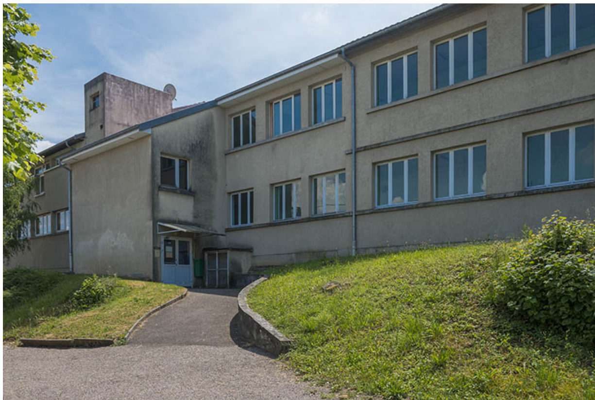
Détail de la façade nord, à l'ouest rue de Bourdieu.