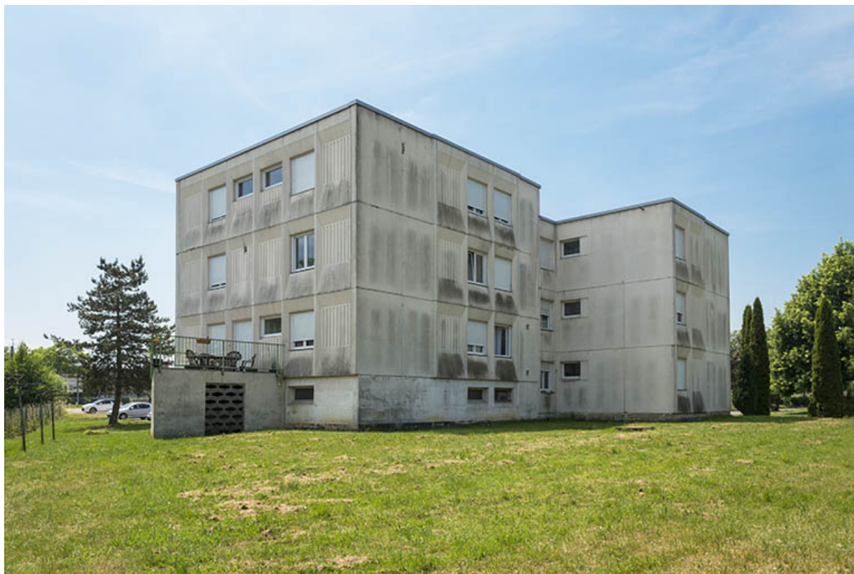
Angle nord-est des logements de fonction.