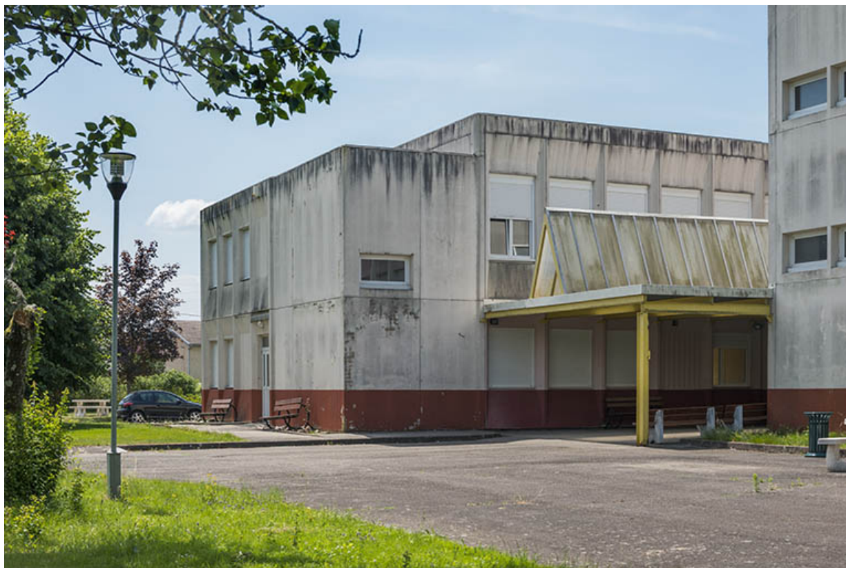
Détail de la façade orientale de la restauration.