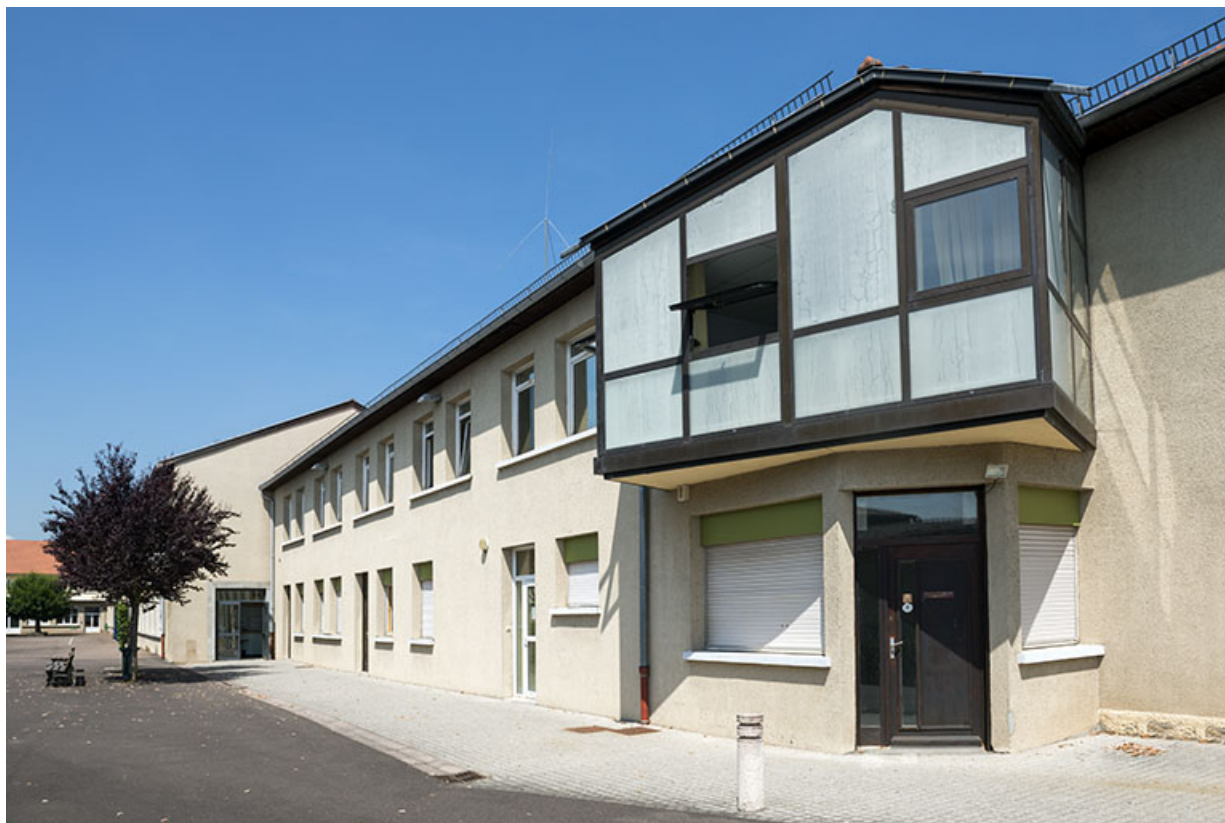
Angle sud-ouest à l'entrée de la cour.