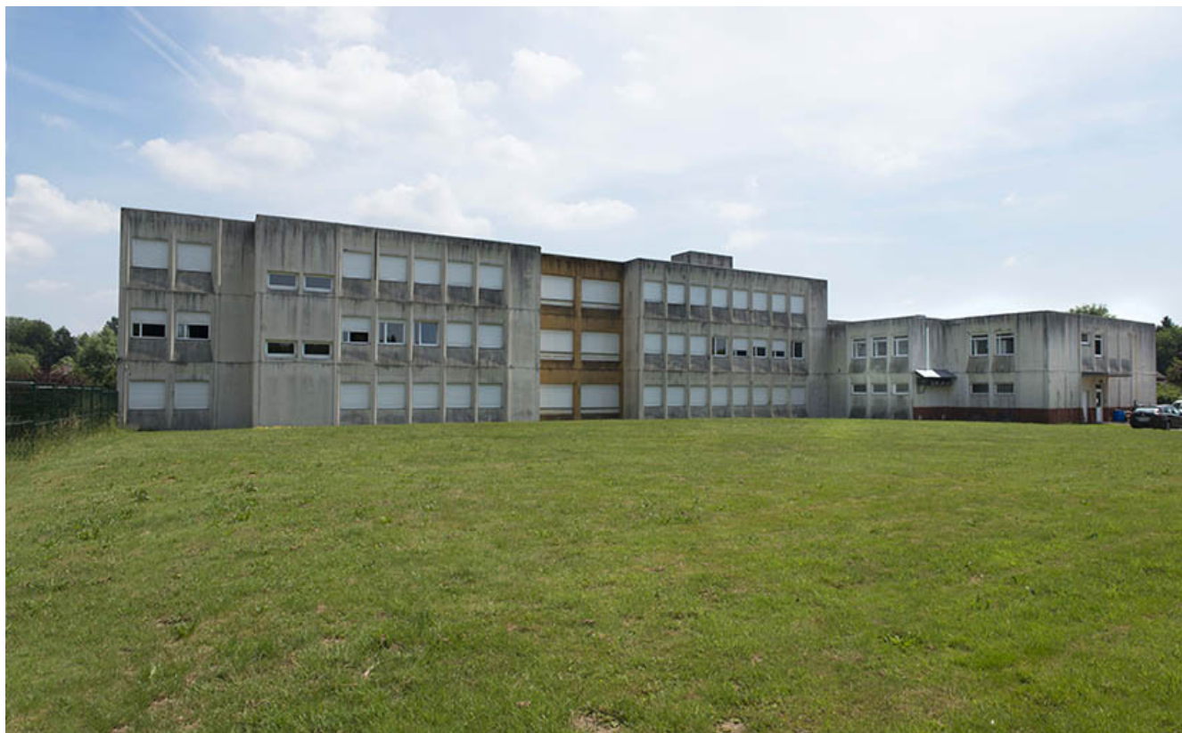
Façade occidentale de l'internat et de la restauration.