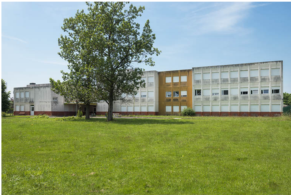
Façade orientale de la restauration.