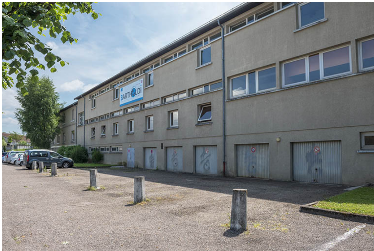
Façade nord rue de Bourdieu.