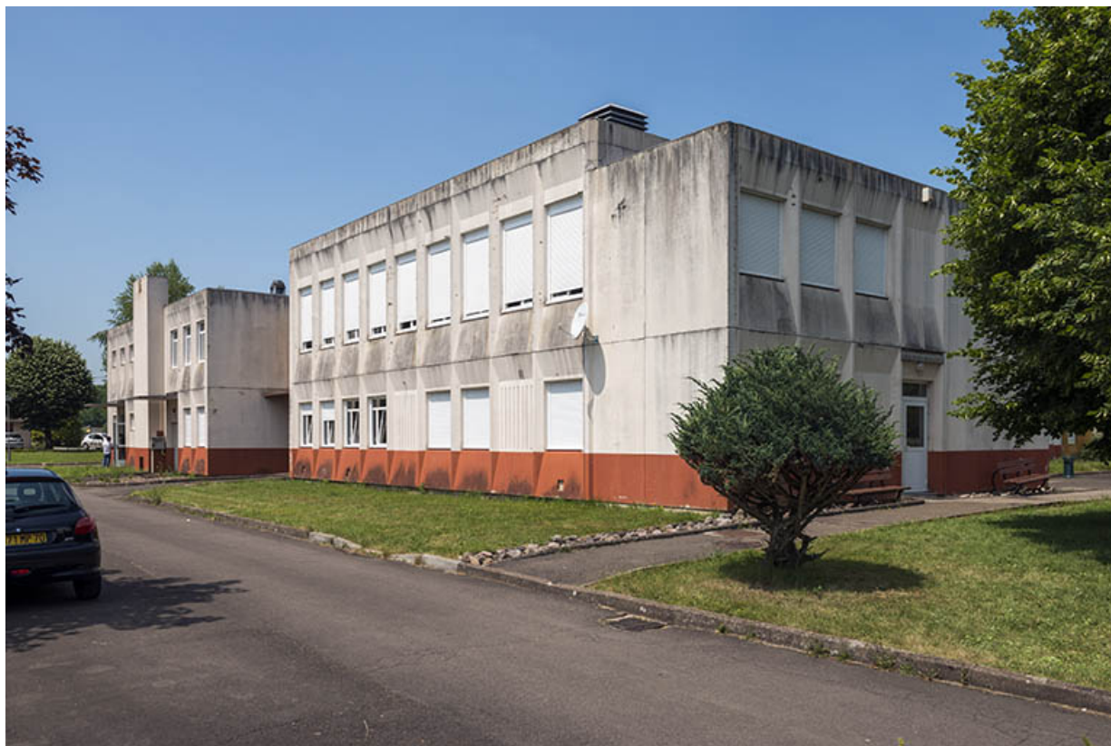
Façade d'entrée au sud et angle sud-est de la restauration.