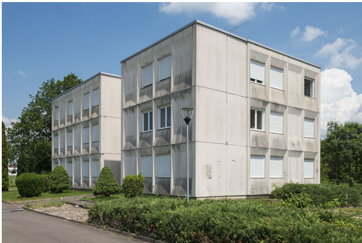
Angle sud-ouest des logements de fonction.