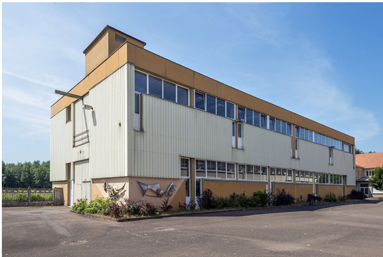
Angle nord-est de l'atelier.