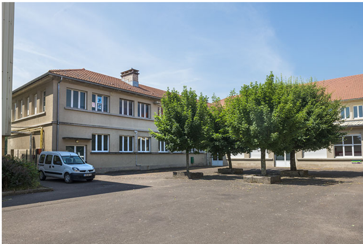
Angle sud-ouest de la cour.