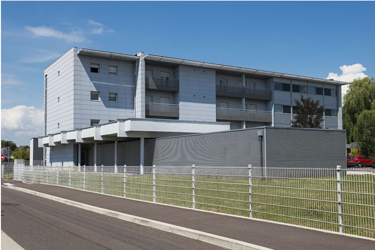
Depuis le sud-est, rue Colomb, vue sur le pignon nord-est des resserres et la façade des logements. 70, Lure, 1 rue Georges Colomb