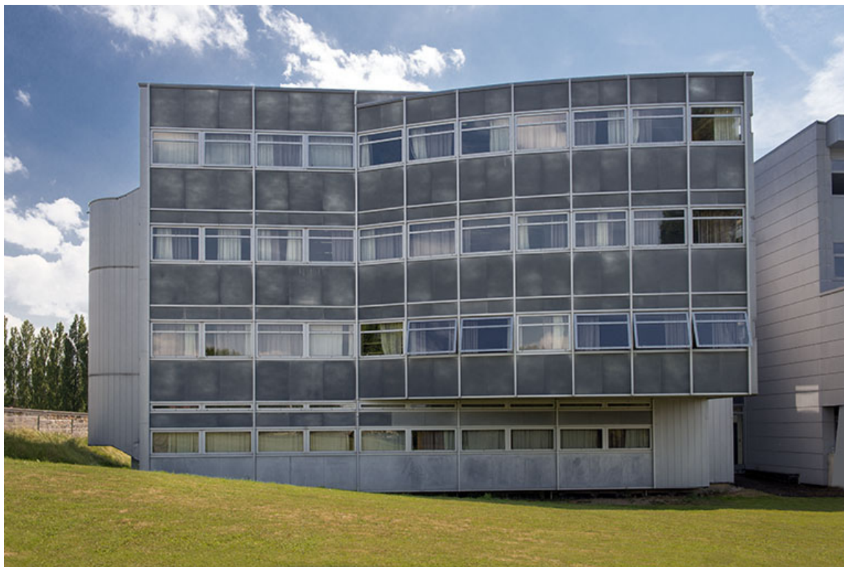
Façade occidentale de l'externat nord-ouest.