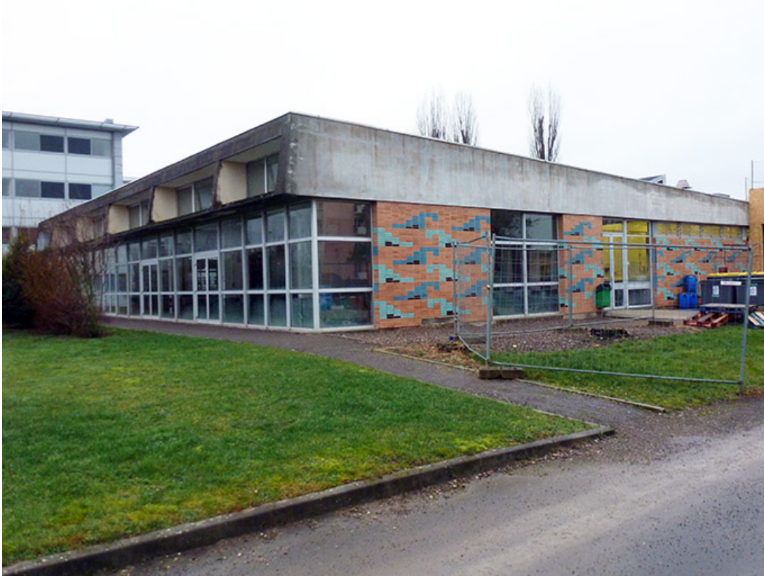
Angle sud-est de la cantine (en 2012)