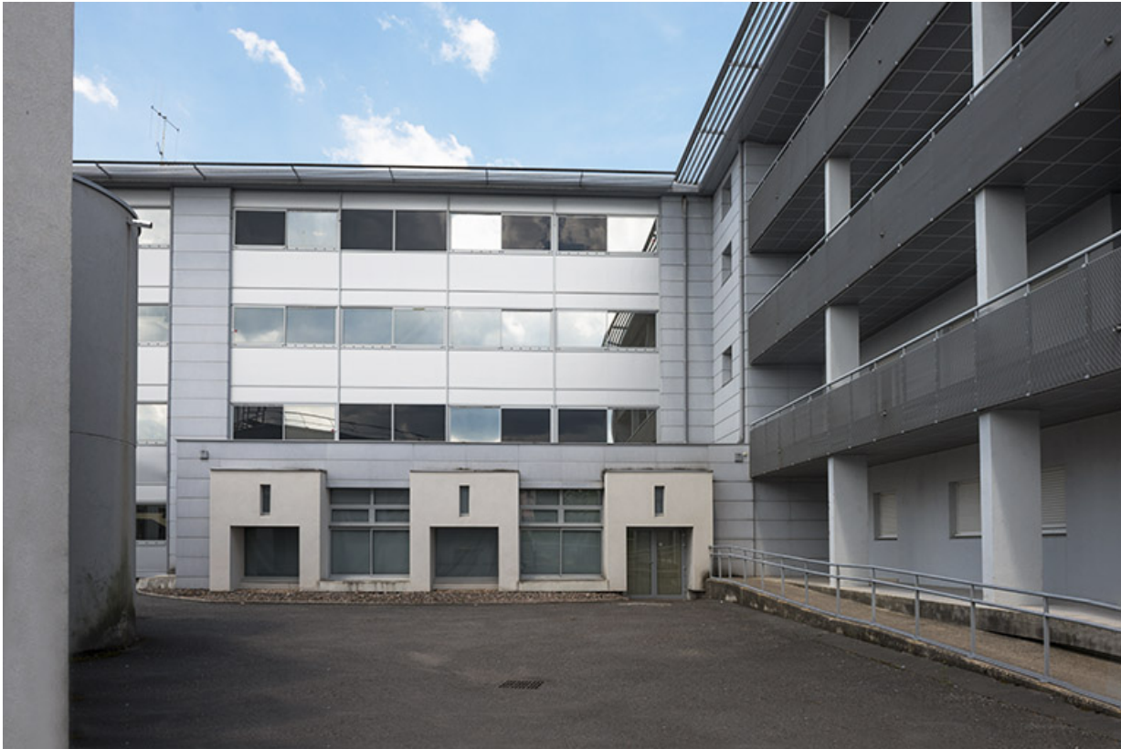
Façade postérieure ouest des logements et façade postérieure sud de l'internat-externat. 70, Lure, 1 rue Georges Colomb