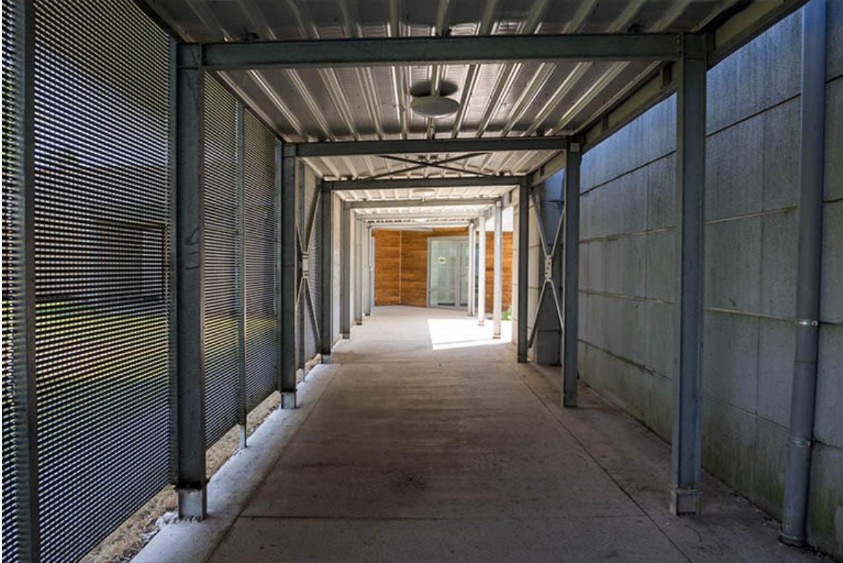
Passage abrité entre l'externat et la cantine.