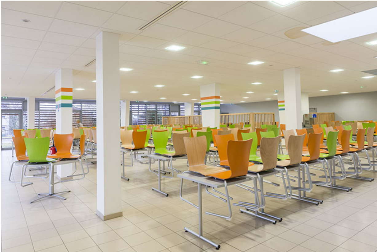
Vue intérieure de la cantine.