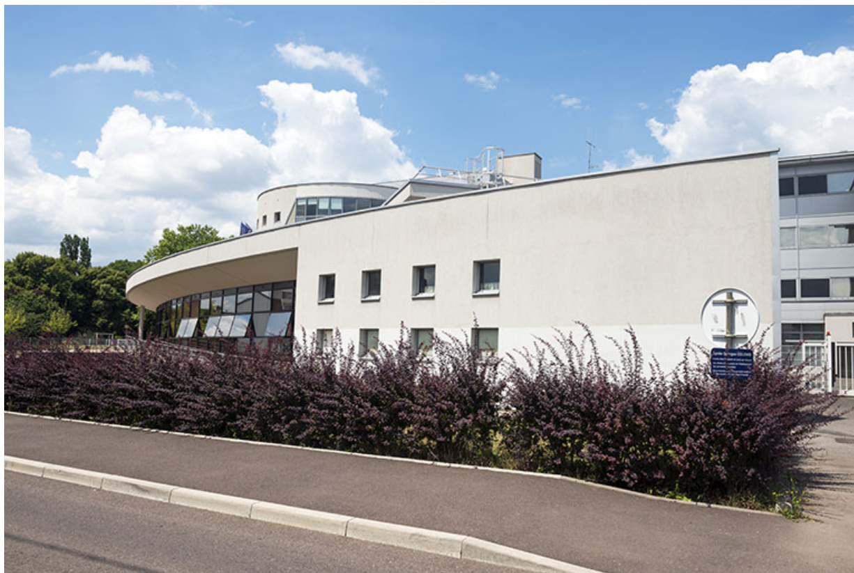
Extrémité est de la façade antérieure du bâtiment d'administration. 70, Lure, 1 rue Georges Colomb