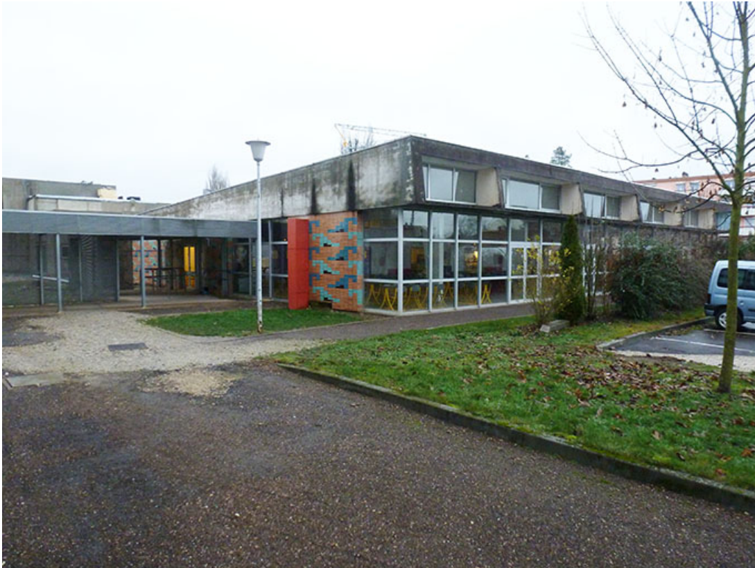
Angle sud-ouest de la cantine (en 2012)