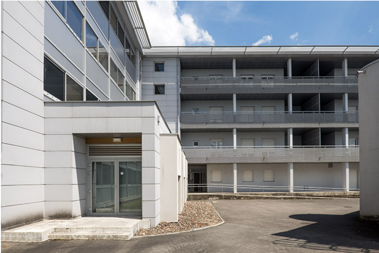
Vues de l'ouest, façade postérieure ouest des logements et façade postérieure sud de l'internat-externat. 70, Lure, 1 rue Georges Colomb