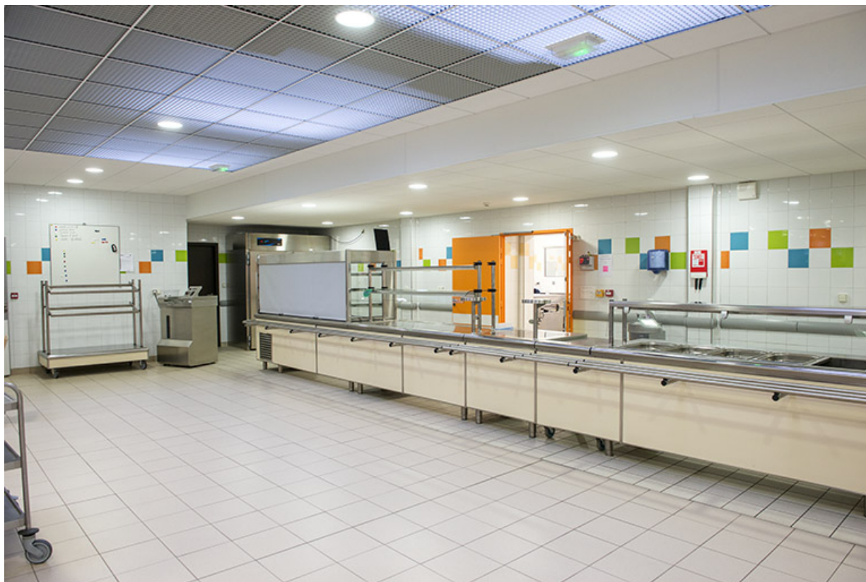
Vue intérieure de la cantine.