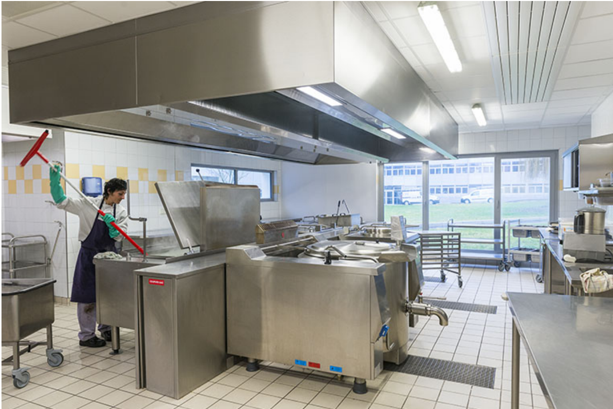
Vue intérieure de la cuisine de la cantine.