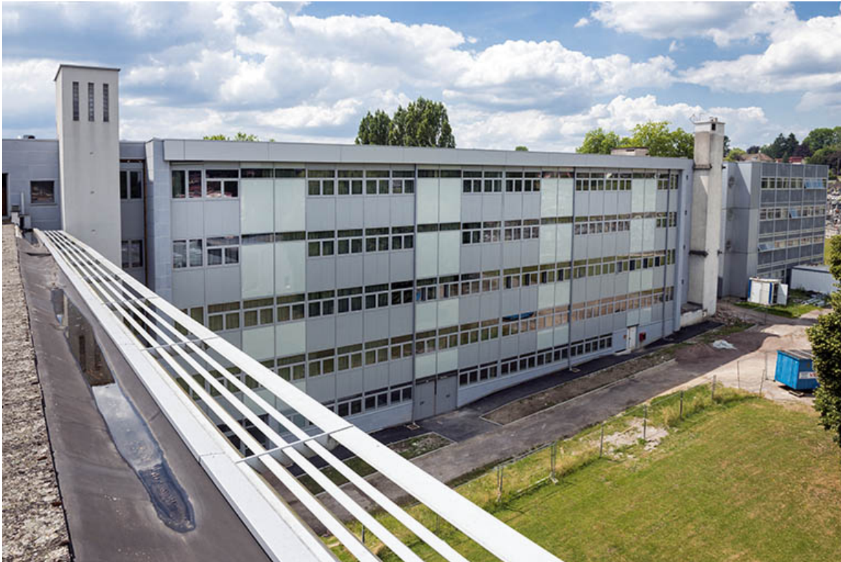
Vue des terrasses de l'internat-externat, la façade orientale de l'externat. 70, Lure, 1 rue Georges Colomb