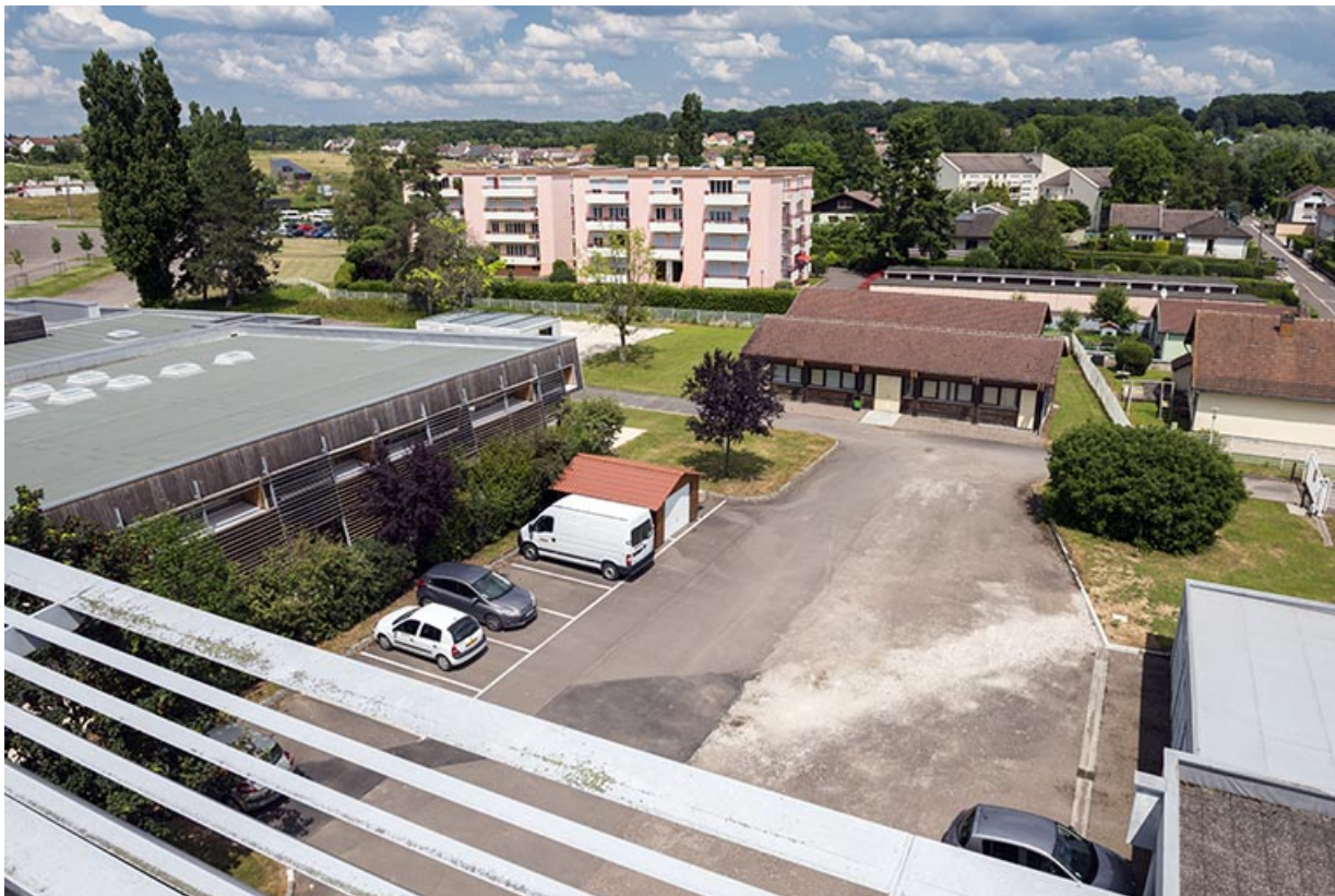
Depuis la terrasse des logements, vue sur la cour à l'est, entre cantine et préfabriqués.