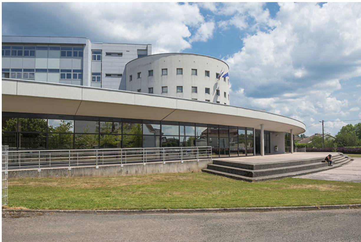
Vues de l'ouest : la place-parvis et la façade d'entrée.