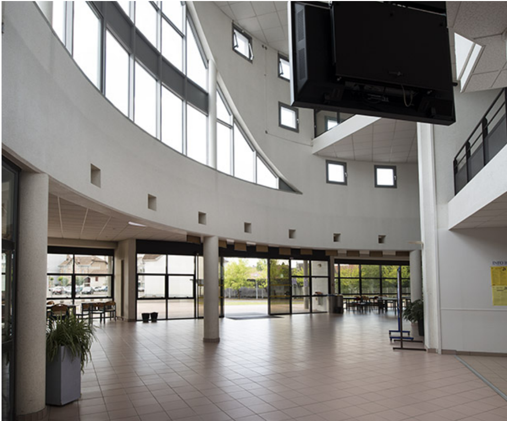
Vue intérieure de l'entrée.