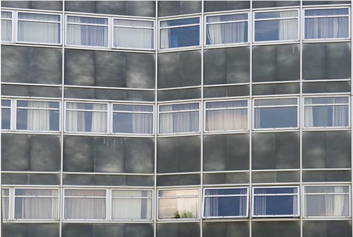
Détail de la façade ouest de l'externat nord-ouest.