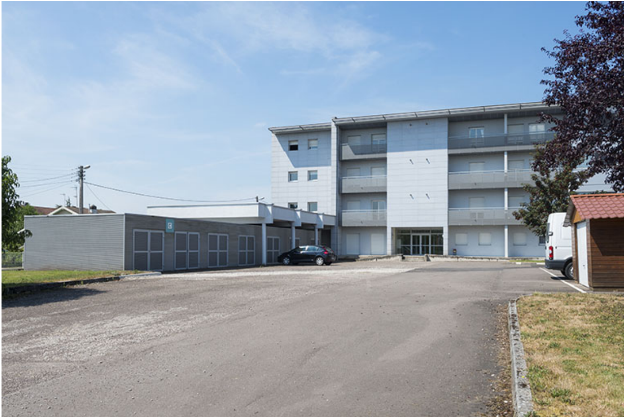
La façade est des logements et leurs resserres.