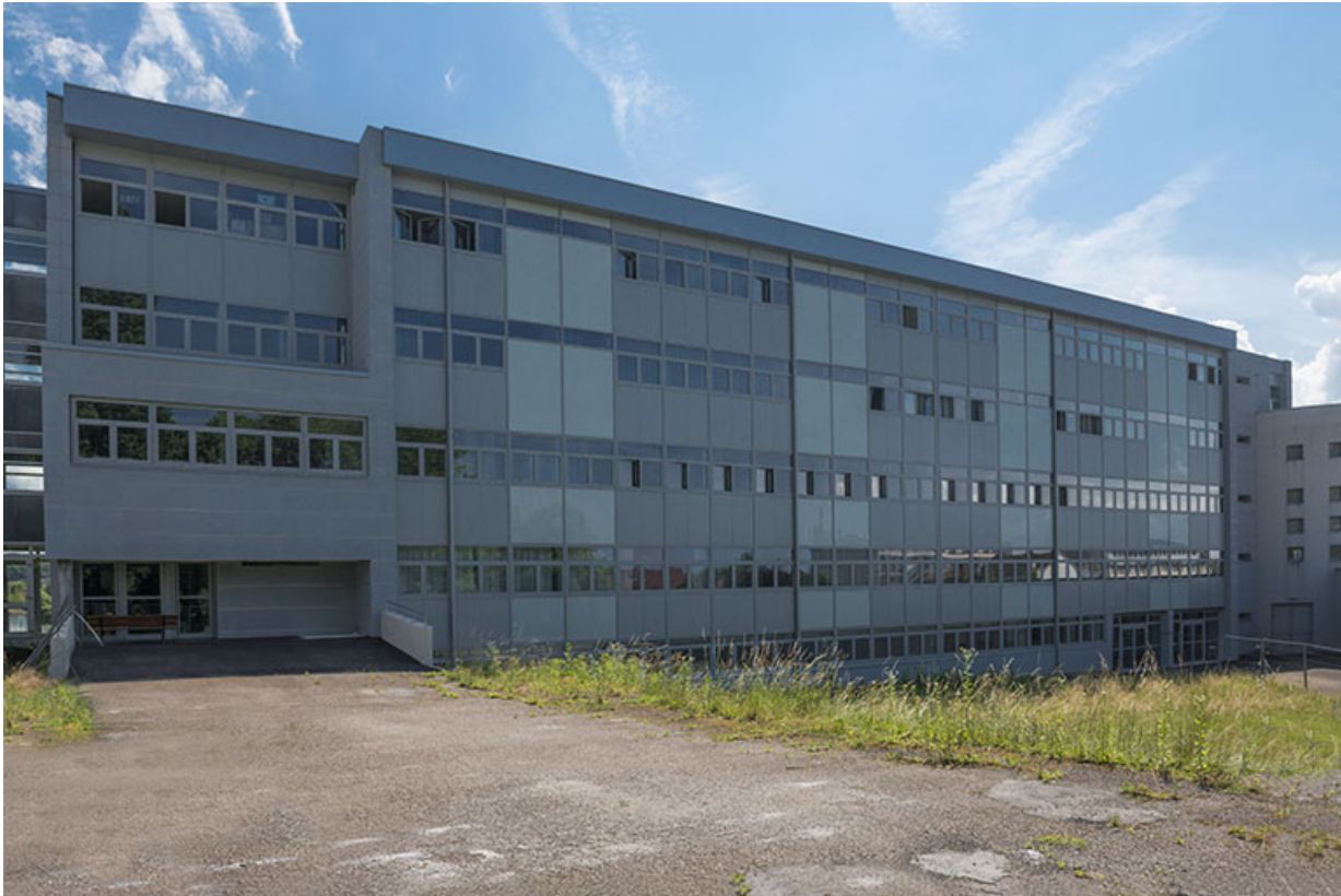
Façade ouest de l'externat.