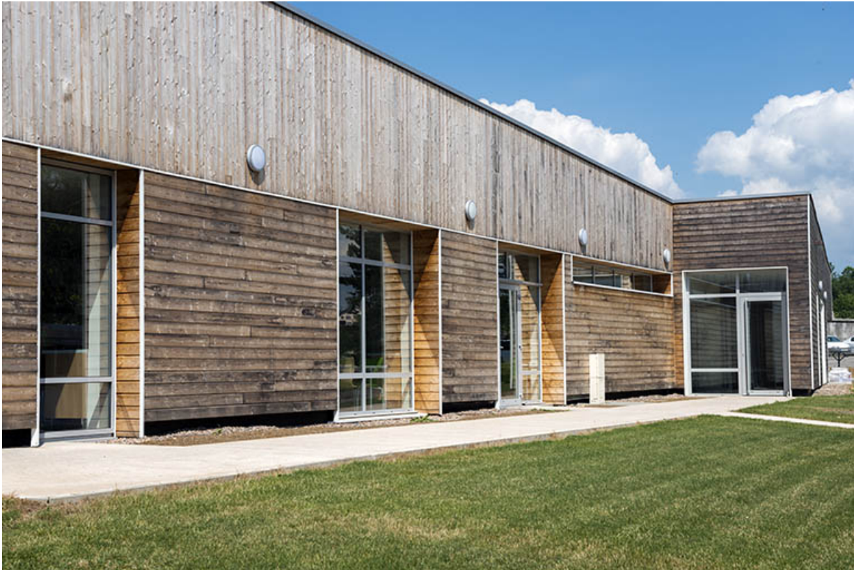
Détail de la façade est de la cantine.