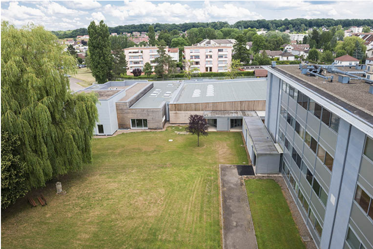
Vue vers l'est, la cantine et la façade postérieure nord de l'externat-internat. 70, Lure, 1 rue Georges Colomb