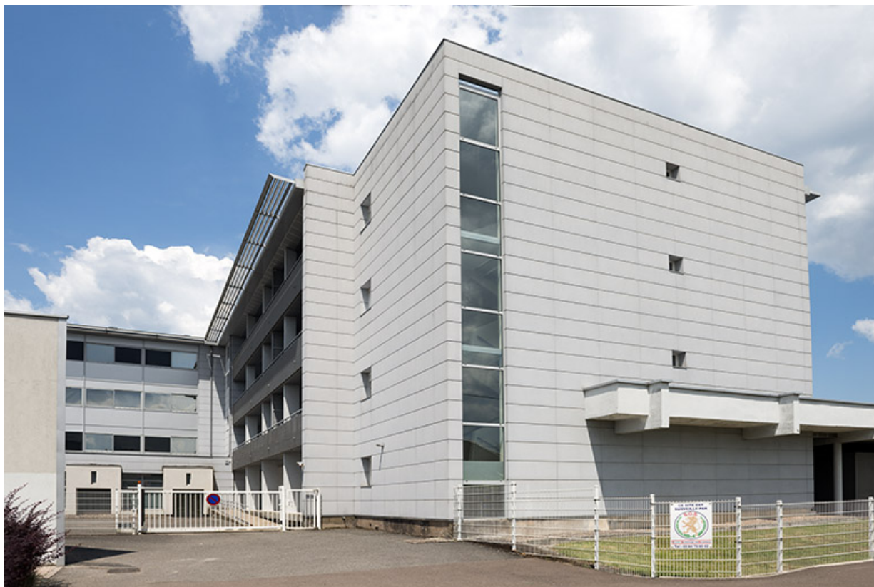
Angle sud-ouest des logements depuis la rue Colomb.