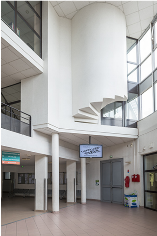
Détail intérieur de l'entrée.