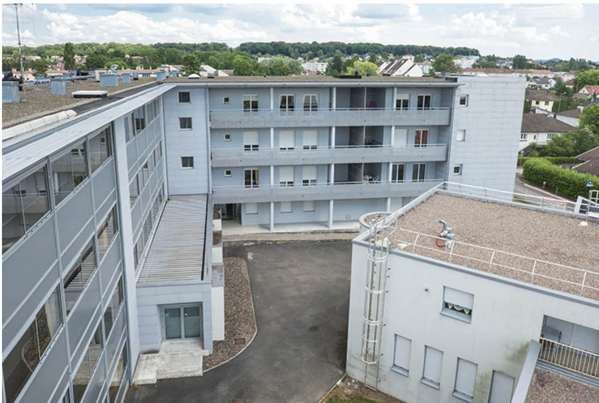
Vues de la terrasse de la rotonde, façade postérieure ouest des logements, façade postérieure sud de l'internat-externat et détail postérieur de la loge du concierge adossée à l'aile est de l'administration.