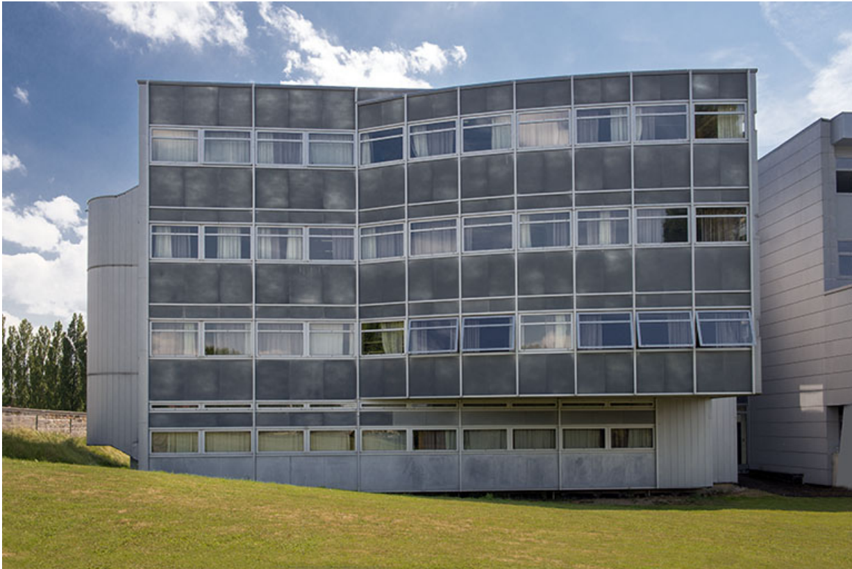
Façade occidentale de l'externat nord-ouest.