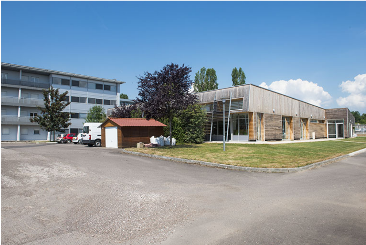
Angle sud-est de la cantine.