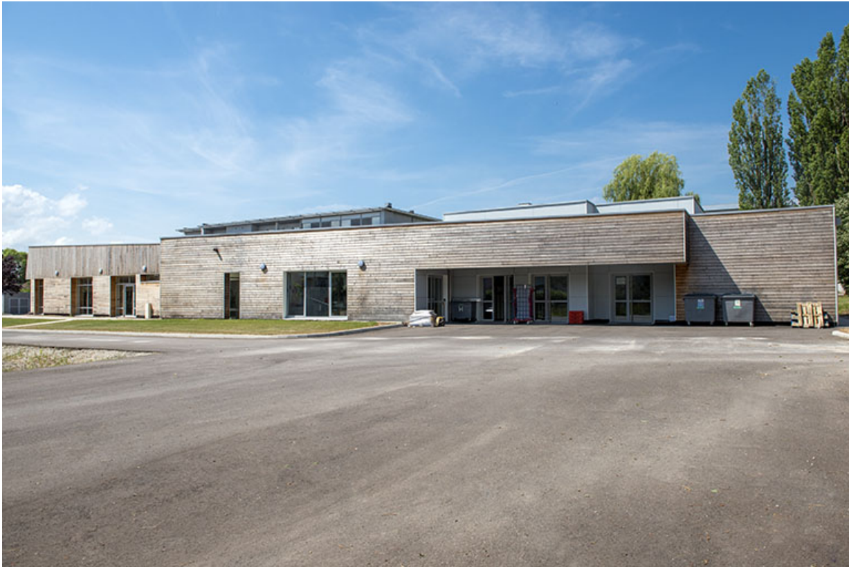
Façade nord-est de la cantine.