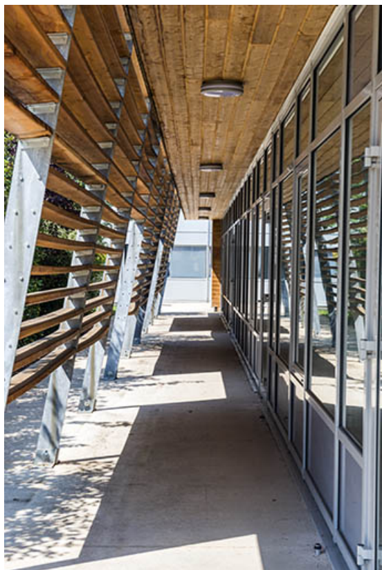
Détail de la façade sud de la cantine.