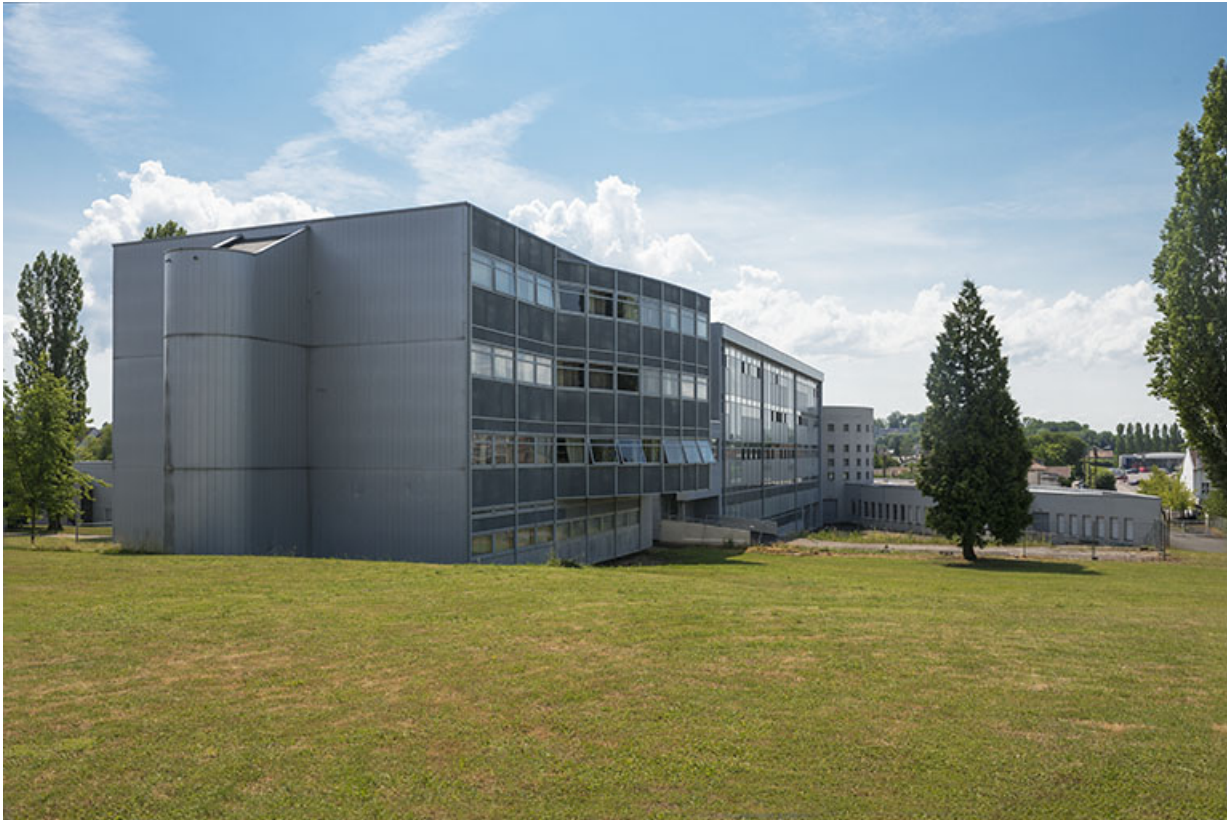
Vue d'ensemble depuis l'angle supérieur nord-ouest de l'externat.