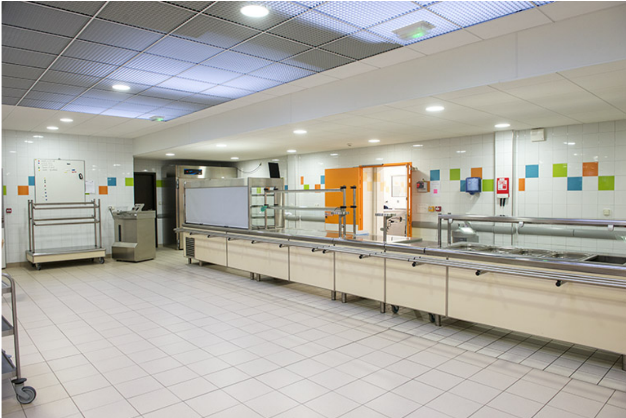
Vue intérieure de la cantine.