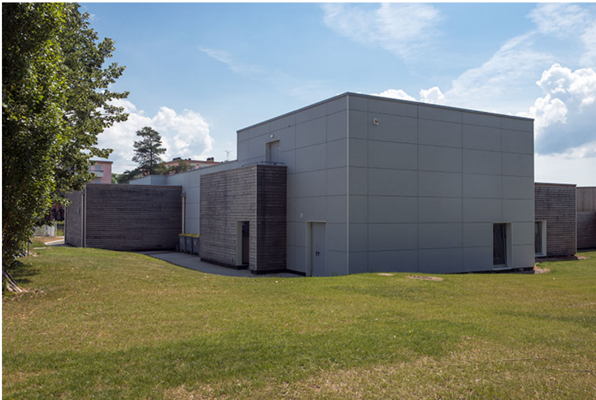
Angle nord-ouest et façades postérieures nord de la cantine.