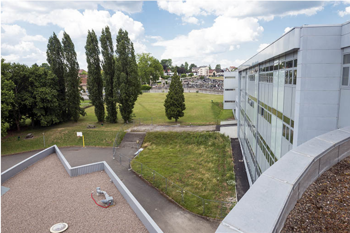
Vus de la terrasse de la rotonde, façade ouest de l'externat et détail de l'aile ouest de l'administration. 70, Lure, 1 rue Georges Colomb