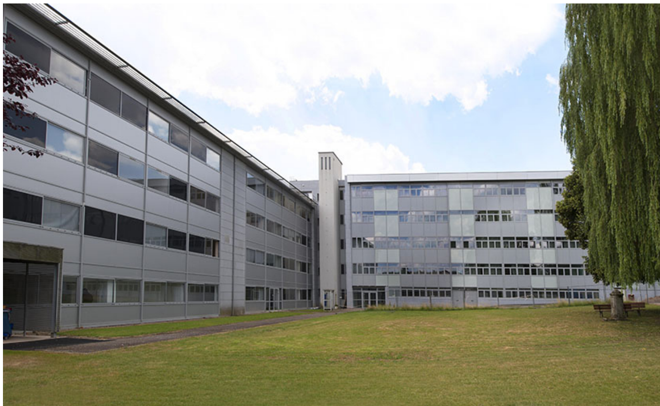
Cour devant les façades orientales des externats et la façade septentrionale de l'internat-externat.