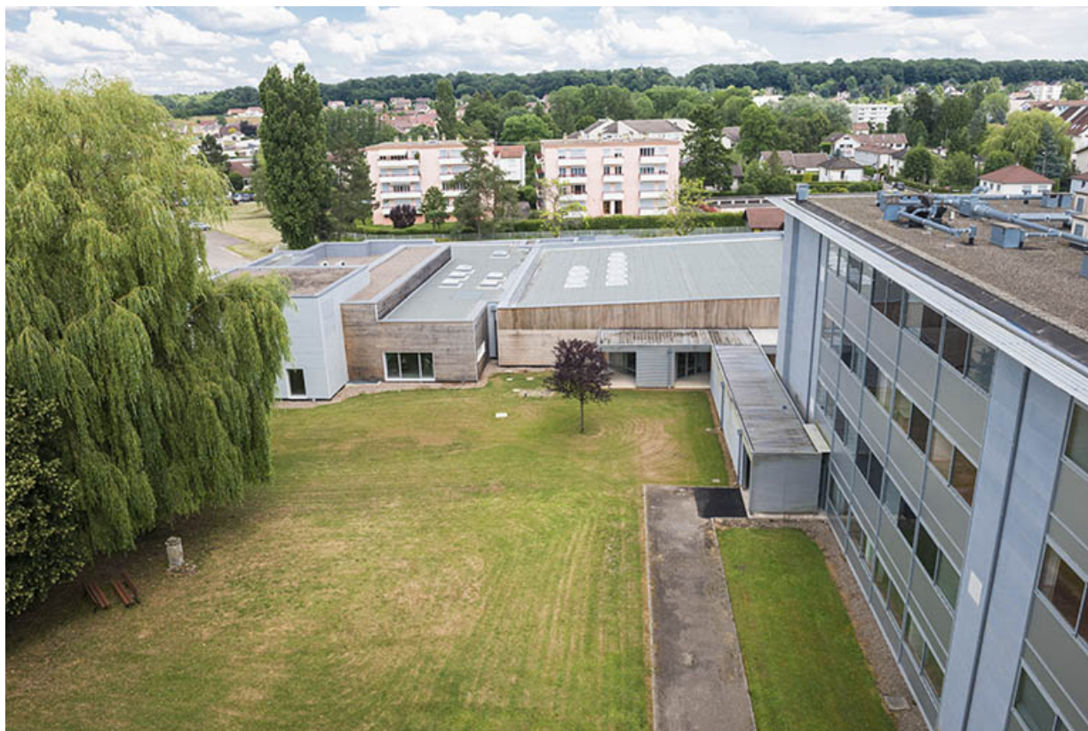
Vue vers l'est, la cantine et la façade postérieure nord de l'externat-internat. 70, Lure, 1 rue Georges Colomb