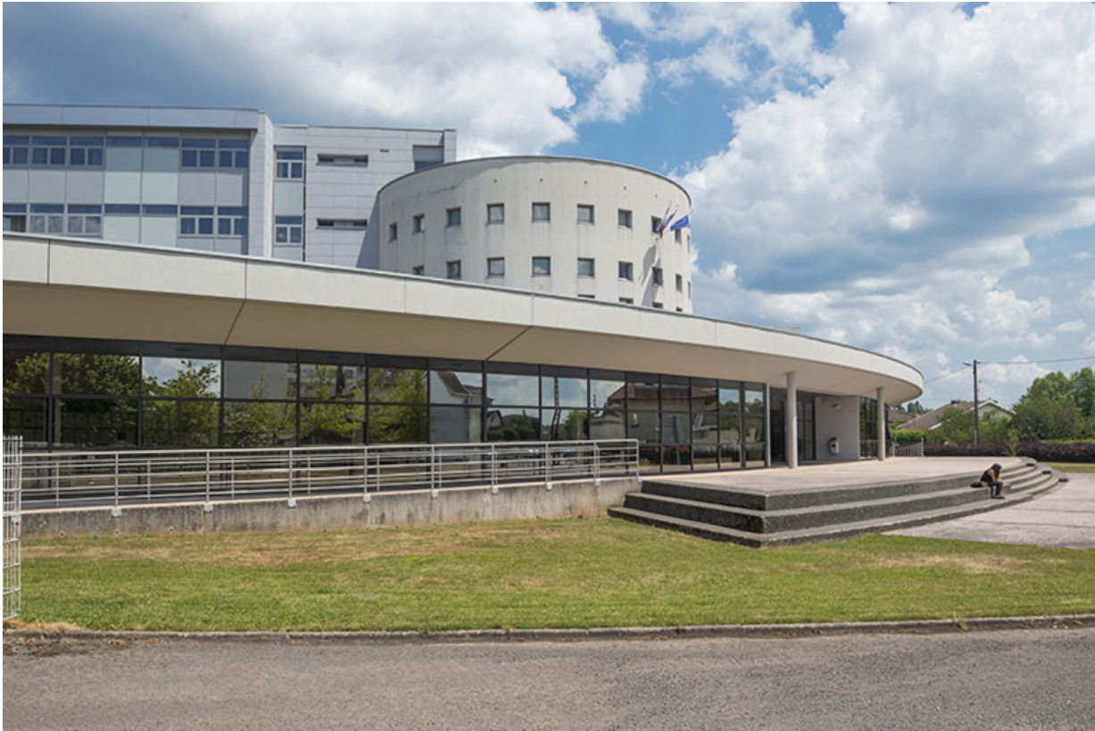
Vues de l'ouest : la place-parvis et la façade d'entrée.