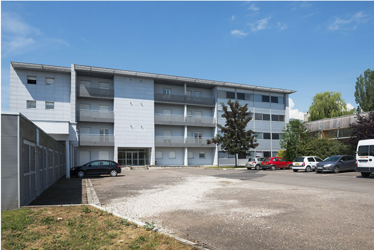
Angle nord-est des resserres et façade antérieure est des logements de fonction.