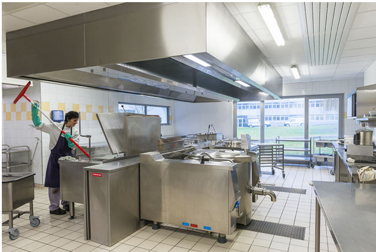
Vue intérieure de la cuisine de la cantine.