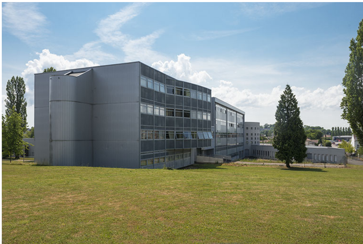
Vue d'ensemble depuis l'angle supérieur nord-ouest de l'externat. 70, Lure, 1 rue Georges Colomb