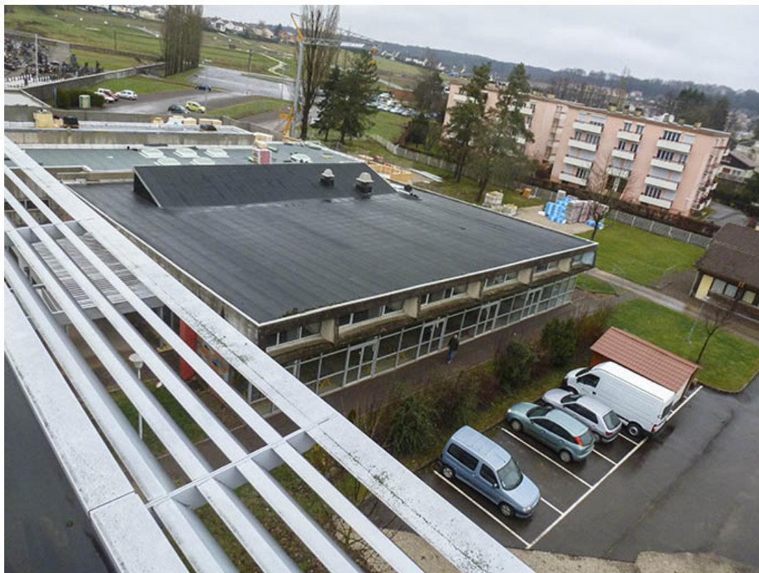
Depuis les toitures, vue sur la cantine (en 2012). 70, Lure, 1 rue Georges Colomb