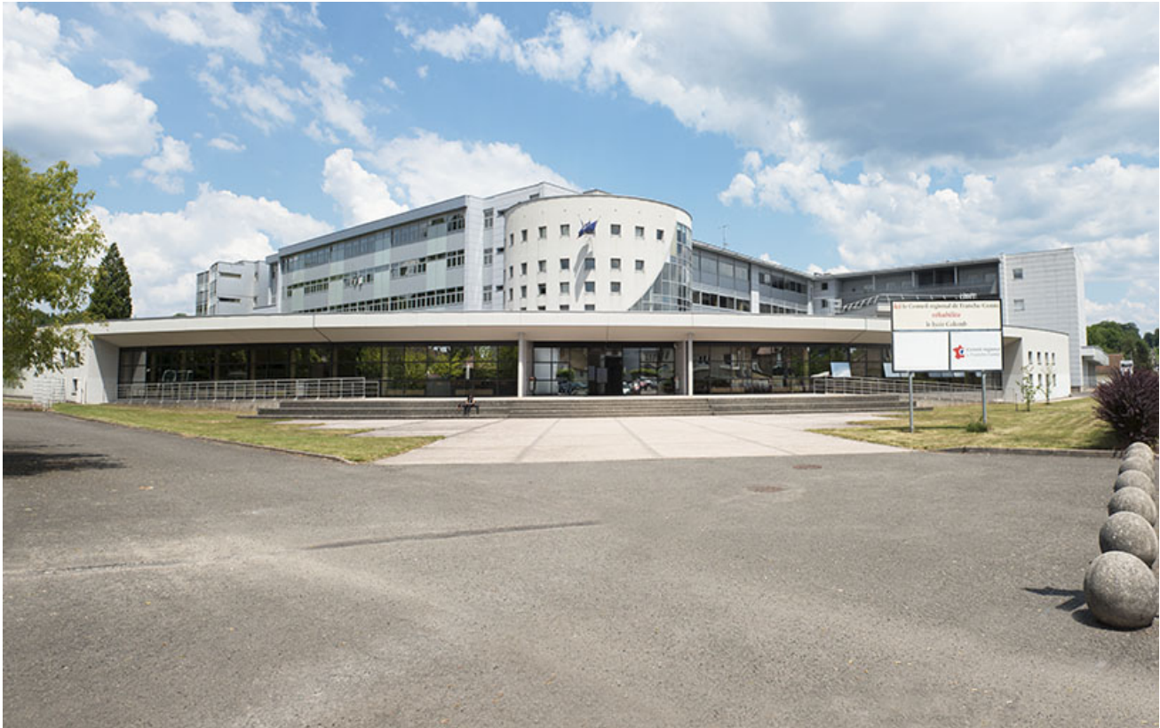
Lure, lycée Georges Colomb : place-parvis et façade de l'entrée.