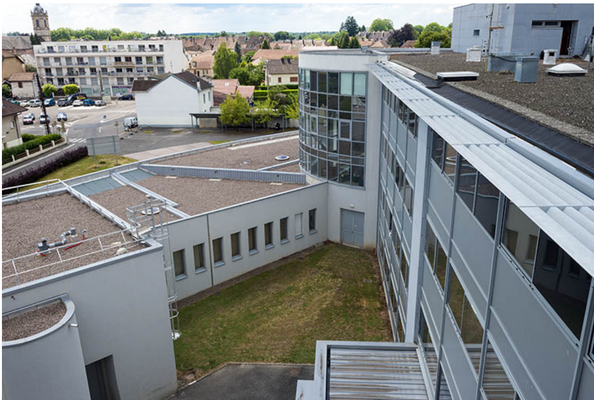
Depuis la terrasse des logements, vue sur l'articulation entre l'est de la rotonde centrale, l'internat-externat et l'administration. 70, Lure, 1 rue Georges Colomb