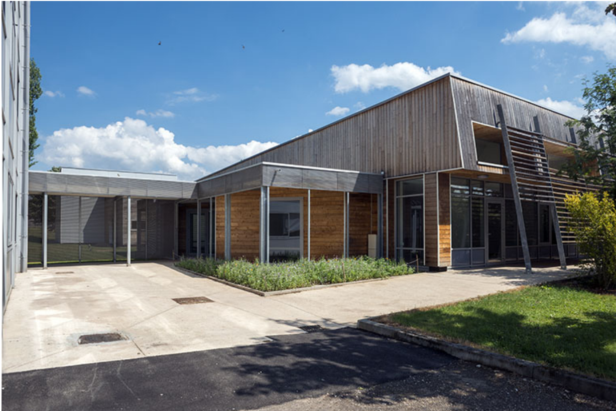
Liaison entre l'ouest de la cantine et l'externat.