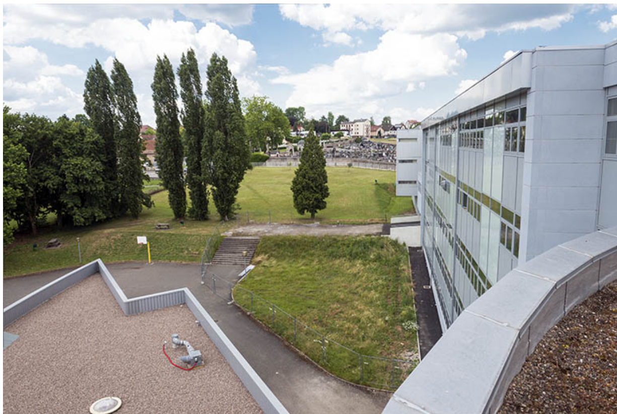
Vus de la terrasse de la rotonde, façade ouest de l'externat et détail de l'aile ouest de l'administration. 70, Lure, 1 rue Georges Colomb