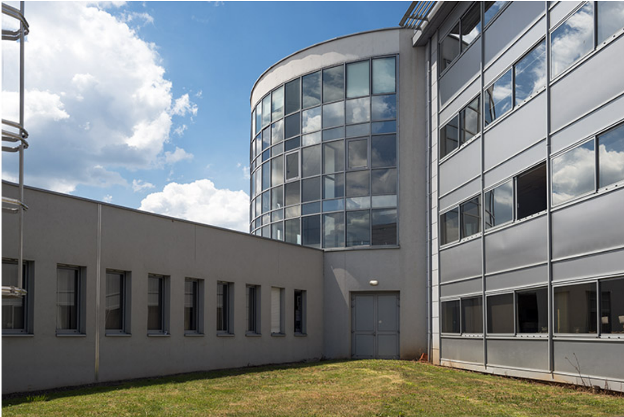
Détail de l'articulation entre l'est de la rotonde centrale, l'internat-externat et l'administration.