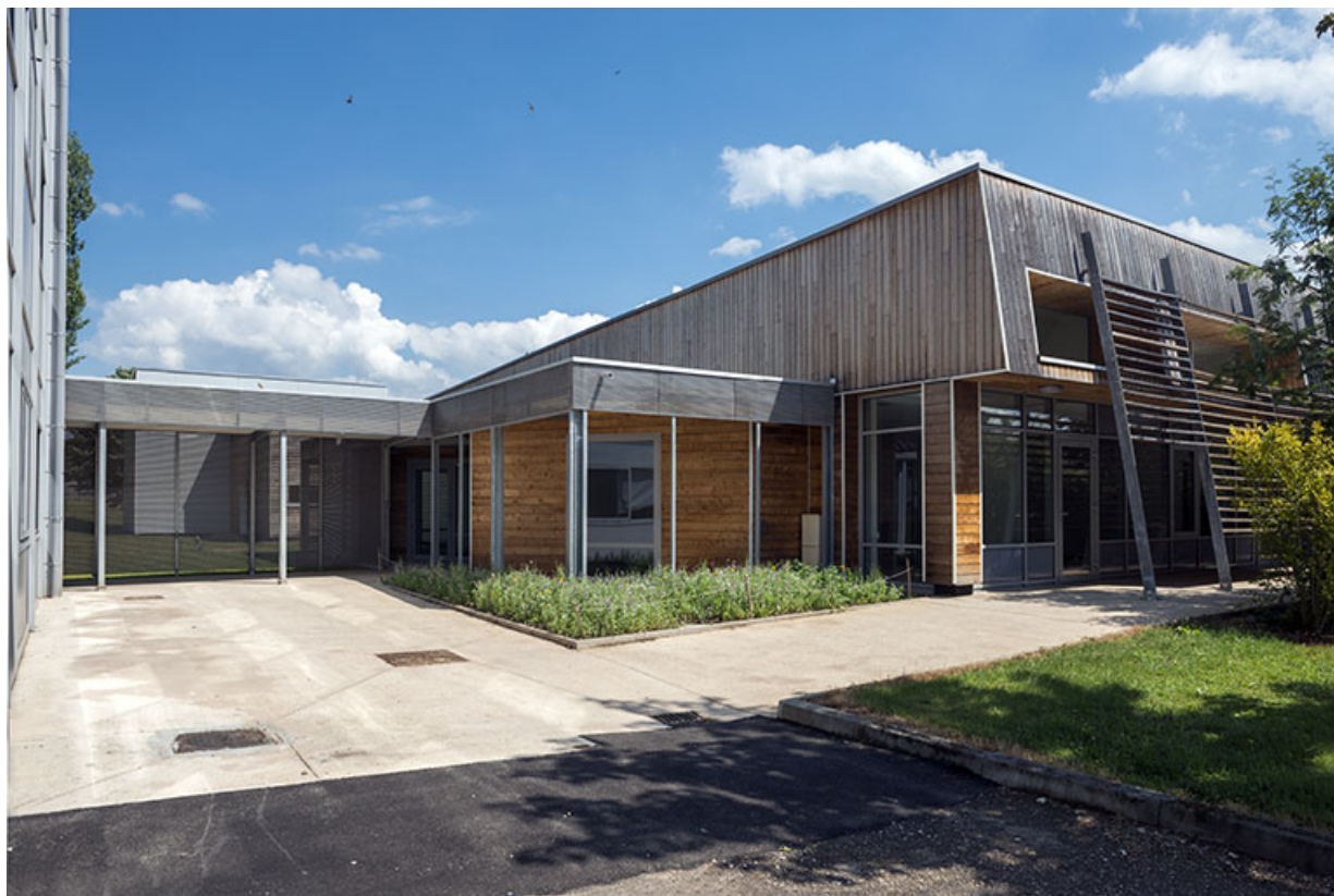
Liaison entre l'ouest de la cantine et l'externat.