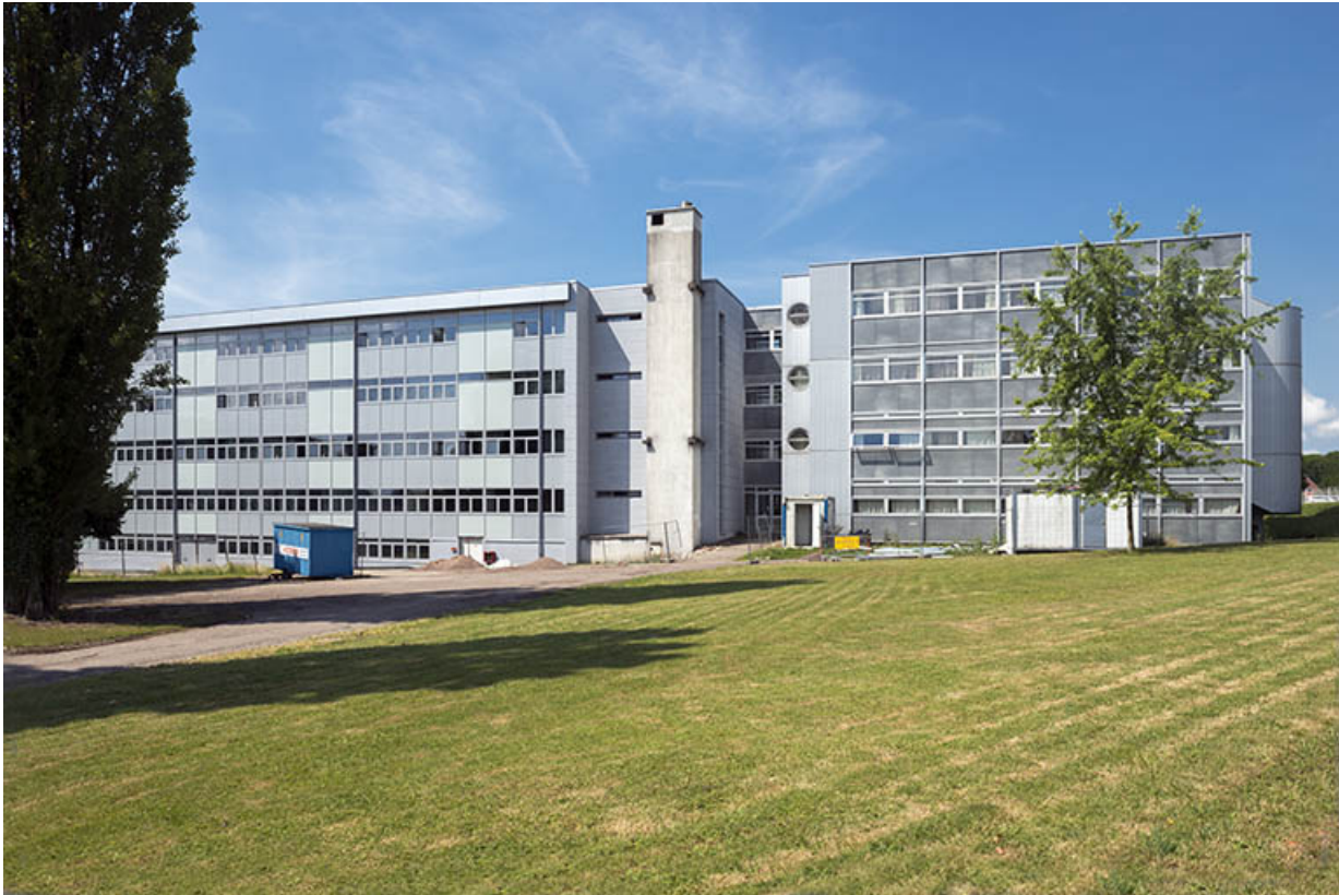
Façades orientales des externats.