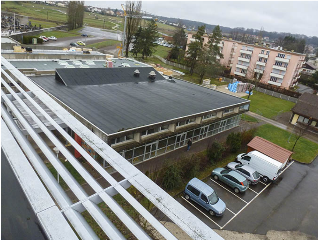
Depuis les toitures, vue sur la cantine (en 2012).