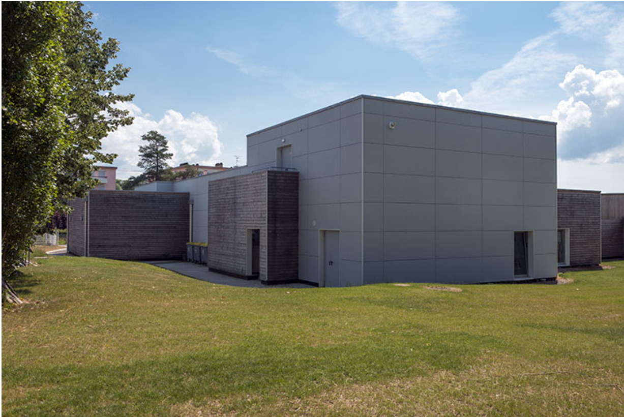
Angle nord-ouest et façades postérieures nord de la cantine.