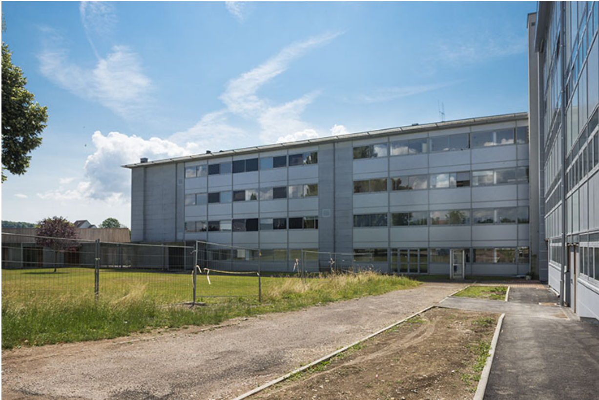
Façade septentrionale de l'internat-externat.