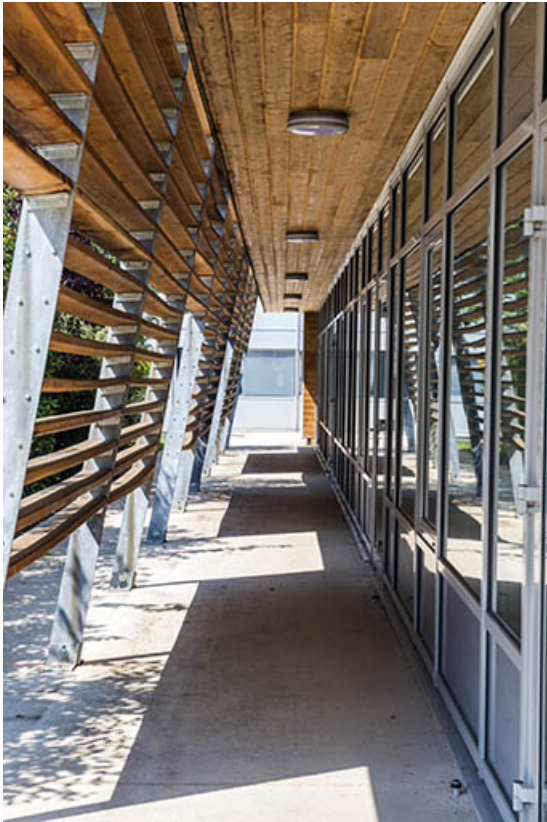
Détail de la façade sud de la cantine.