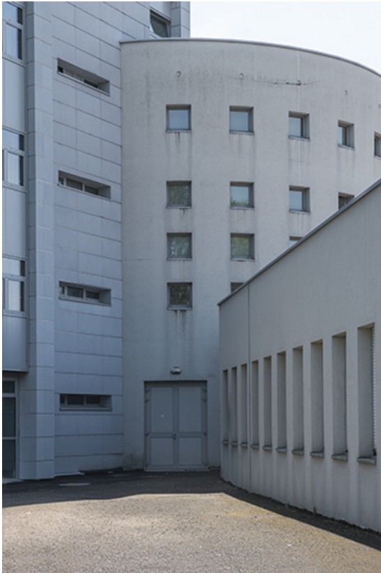
Détail de l'articulation entre l'ouest de la rotonde centrale, l'internat-externat et l'administration. 70, Lure, 1 rue Georges Colomb