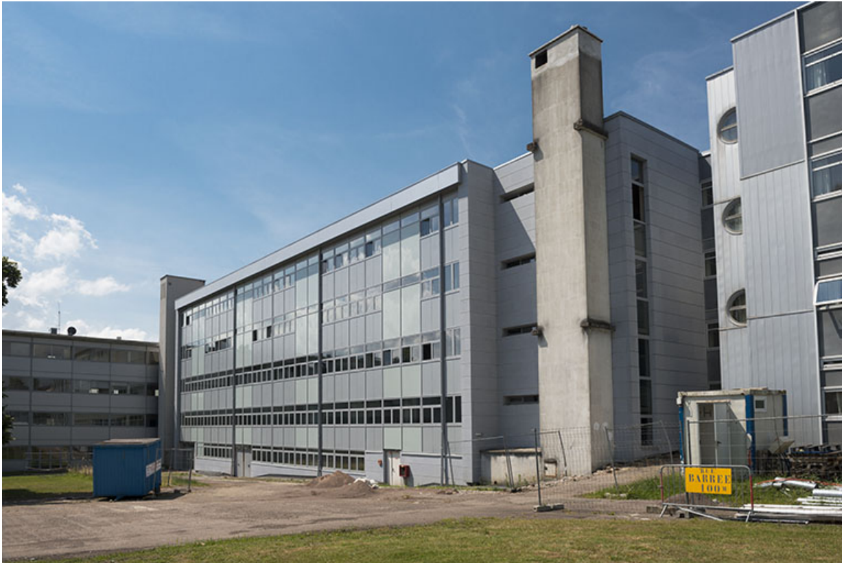
Façades orientales des externats et façade septentrionale de l'internat-externat. 70, Lure, 1 rue Georges Colomb