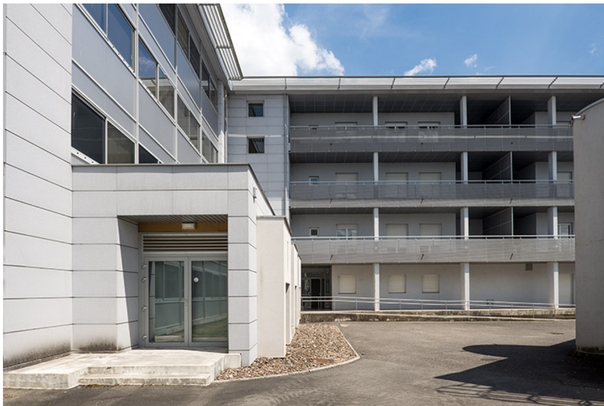
Vues de l'ouest, façade postérieure ouest des logements et façade postérieure sud de l'internat-externat. 70, Lure, 1 rue Georges Colomb