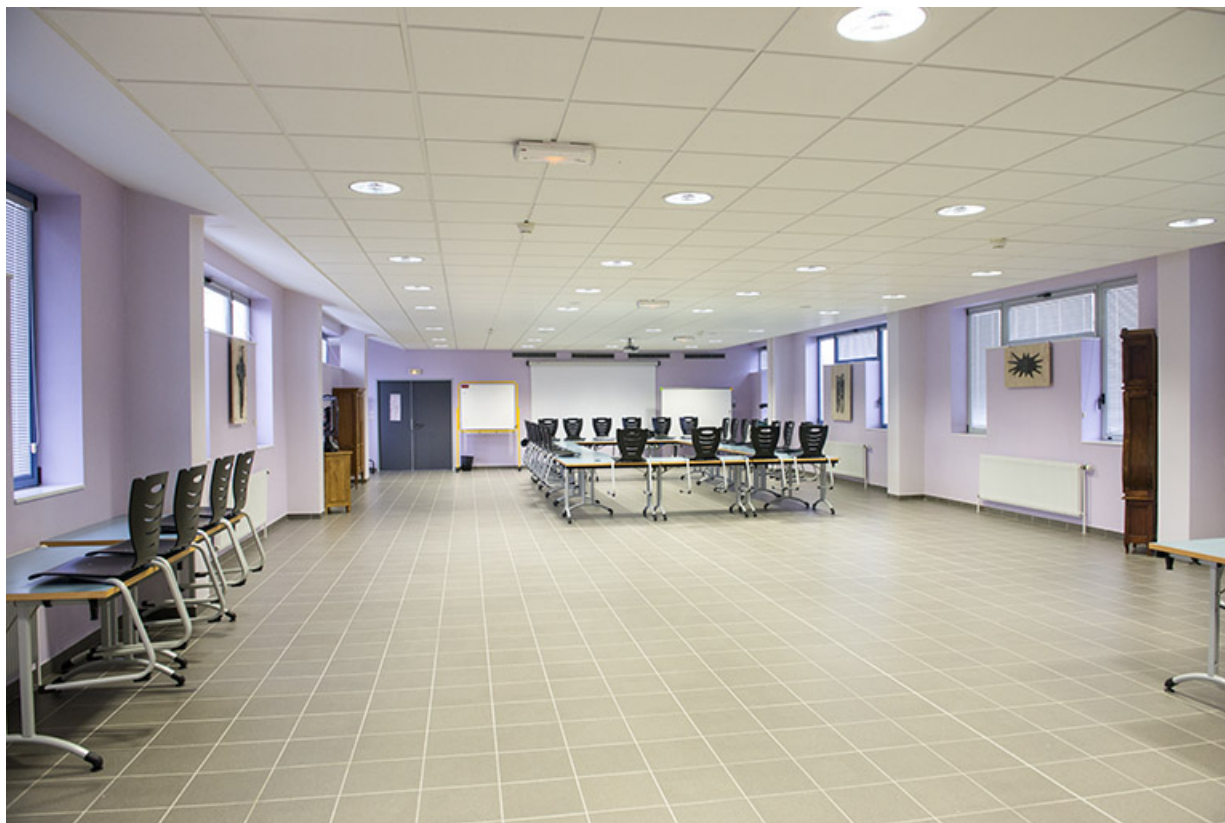
Les oeuvres dans leur contexte.