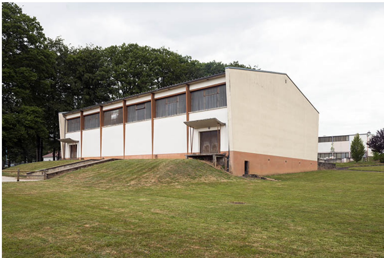
Gymnase : vue postérieure.

70, Luxeuil-les-Bains, 32 rue Pierre Rimey