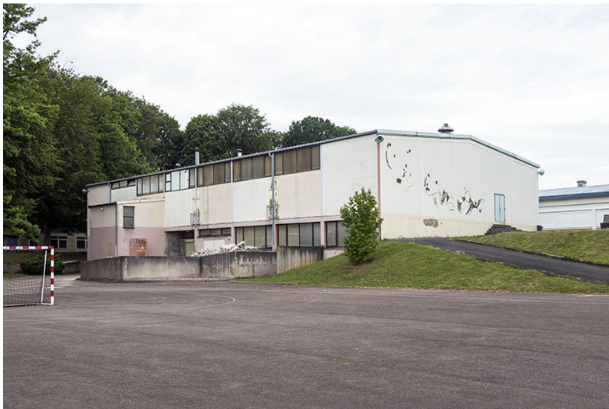
Atelier de gros oeuvre : vue trois-quart. 70, Luxeuil-les-Bains, 32 rue Pierre Rimey