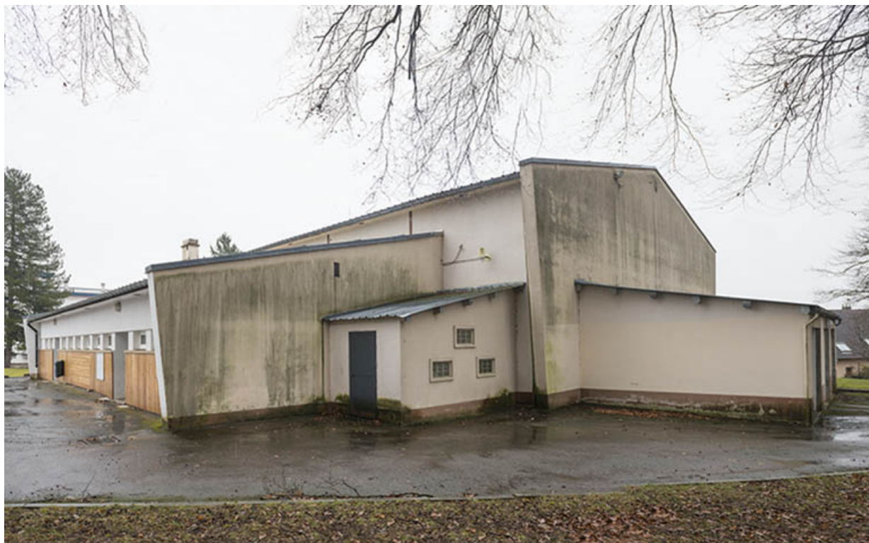
Angle nord-ouest du gymnase.

70, Luxeuil-les-Bains, 32 rue Pierre Rimey