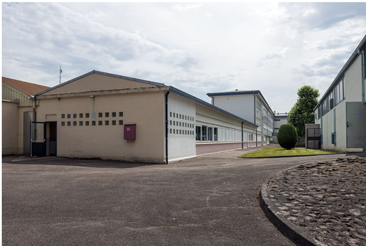
Ateliers : extrémité du bâtiment et façade antérieure de l'atelier gros-oeuvre.

70, Luxeuil-les-Bains, 32 rue Pierre Rimey