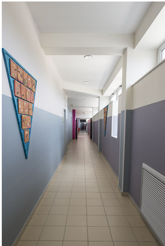
Externat : couloir du 1er étage.

70, Luxeuil-les-Bains, 32 rue Pierre Rimey