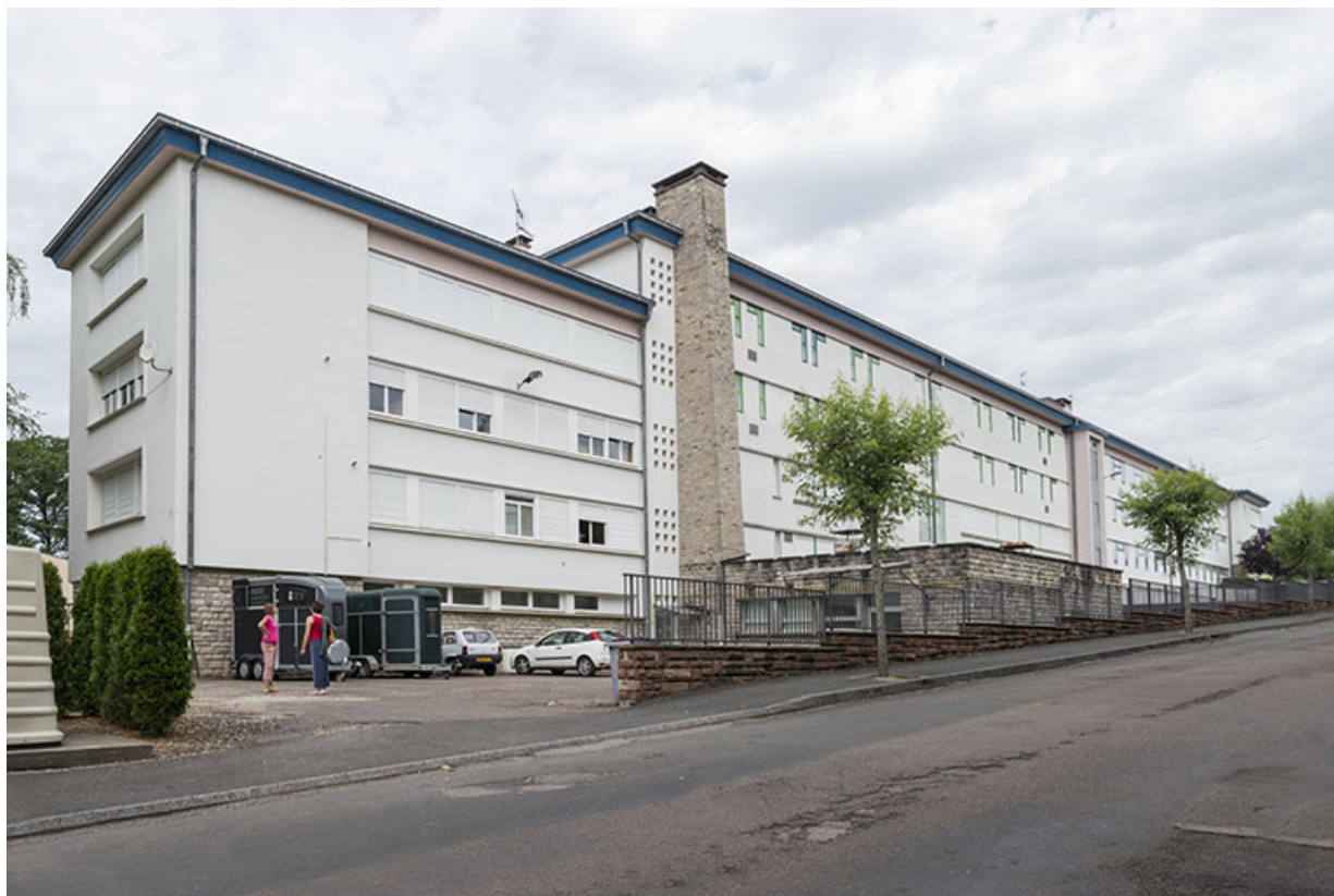
Externat et cuisine : façade antérieure, rue Rimey.

70, Luxeuil-les-Bains, 32 rue Pierre Rimey