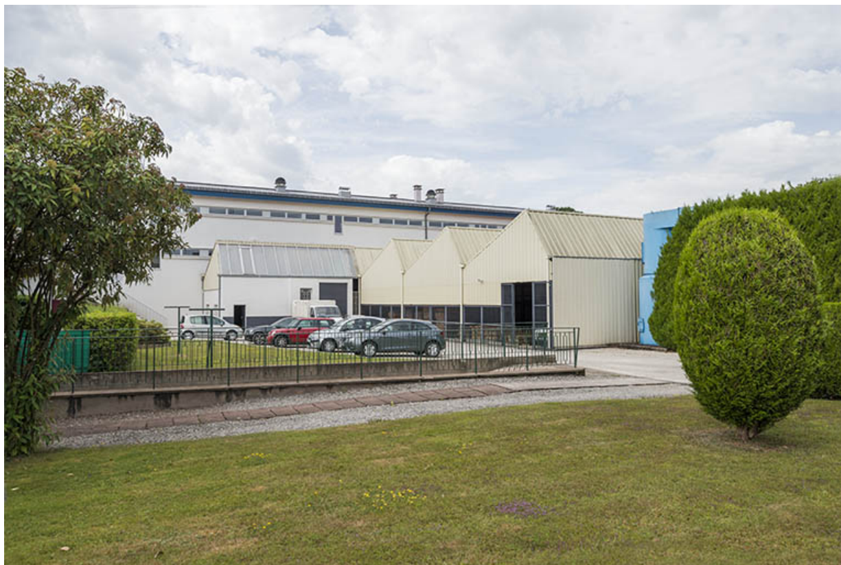
Externat et ateliers : cour arrière, rue Beauregard.

70, Luxeuil-les-Bains, 32 rue Pierre Rimey