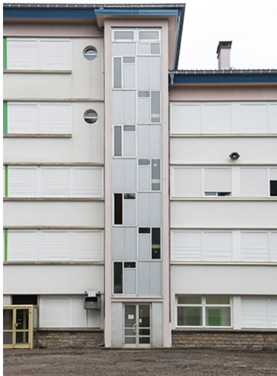
Externat : détail de la façade postérieure, cage d'escalier.

70, Luxeuil-les-Bains, 32 rue Pierre Rimey