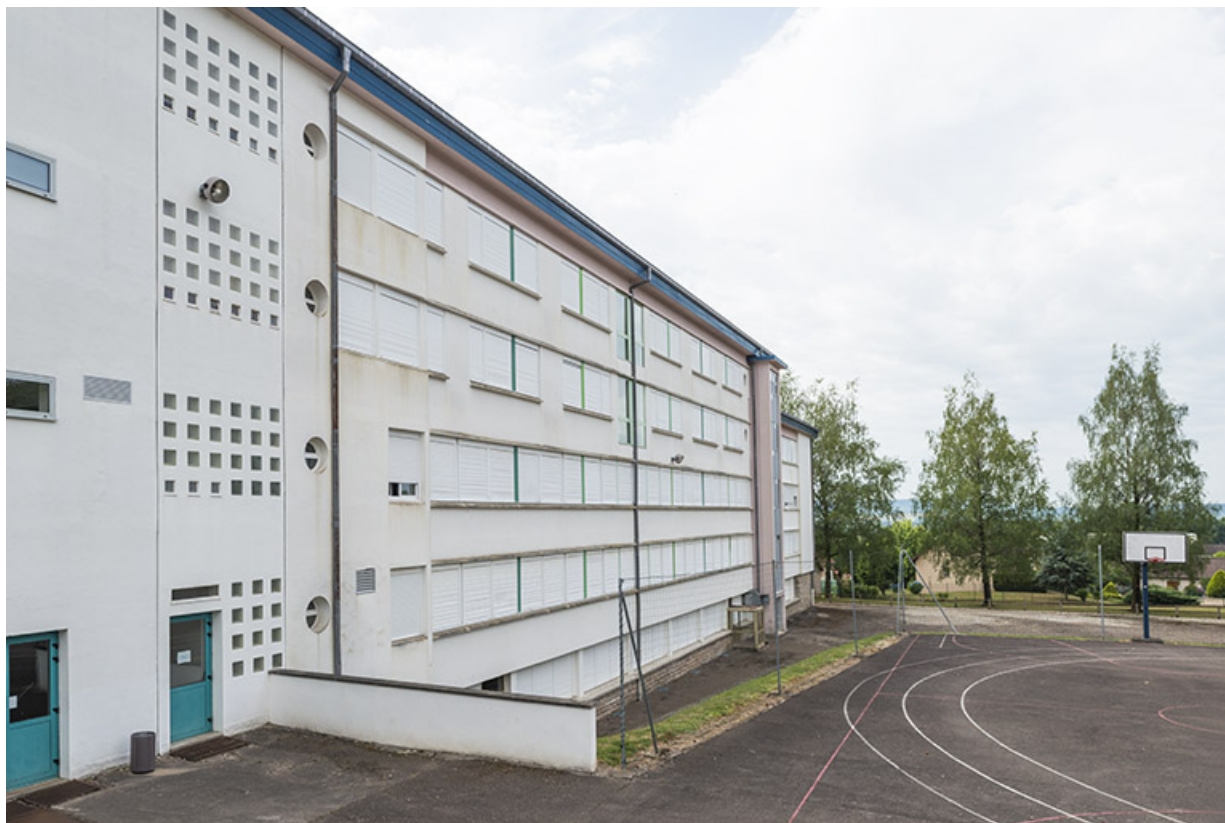
Externat : ensemble des façades arrière.

70, Luxeuil-les-Bains, 32 rue Pierre Rimey