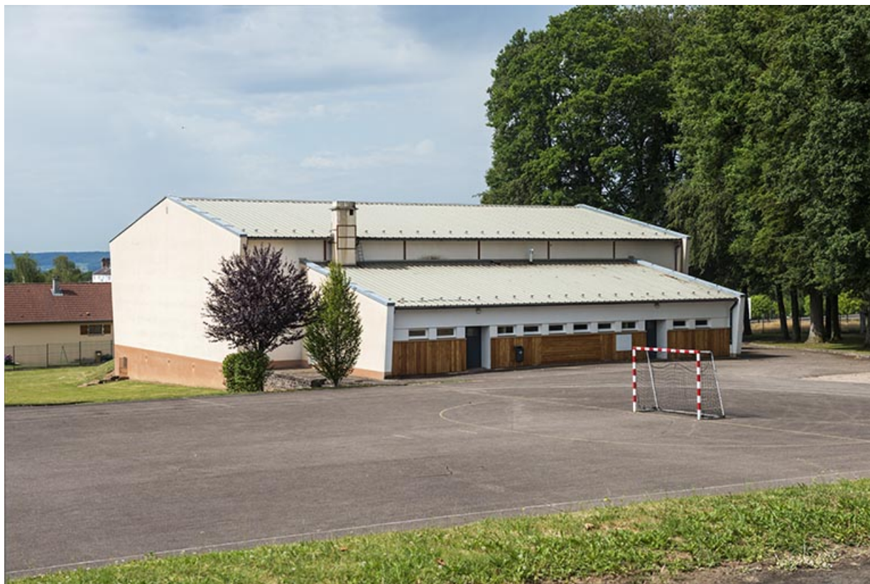
Gymnase et terrain de sport, vue générale.

70, Luxeuil-les-Bains, 32 rue Pierre Rimey