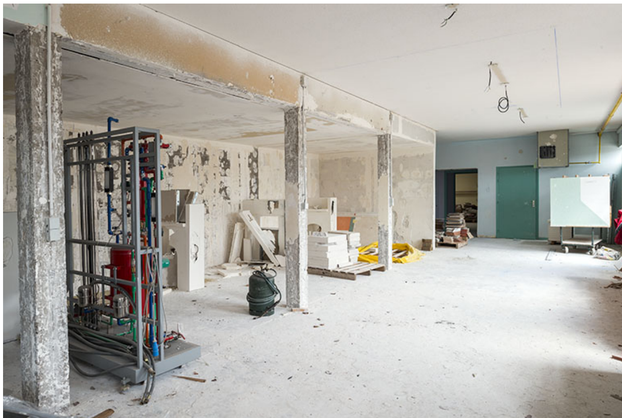
Atelier, bâtiment préfabriqué : plâtrerie.. 70, Luxeuil-les-Bains, 32 rue Pierre Rimey