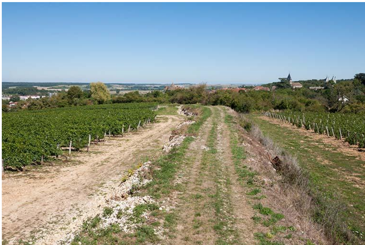
Vignes, ouest de la ville 70, Gy