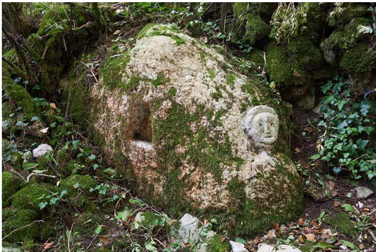
Pierre calcaire sculptée d'un visage humain située dans le Bois de Natoy 70, Gy