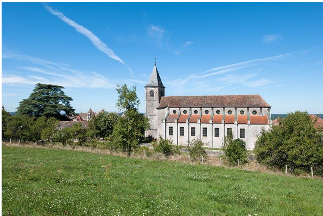
Vue générale sud de l'église