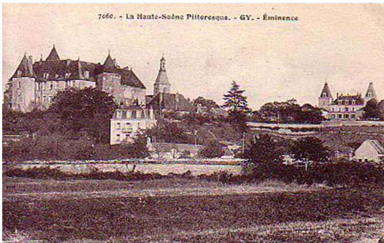
Vue générale du château sur une carte postale ancienne 70, Gy