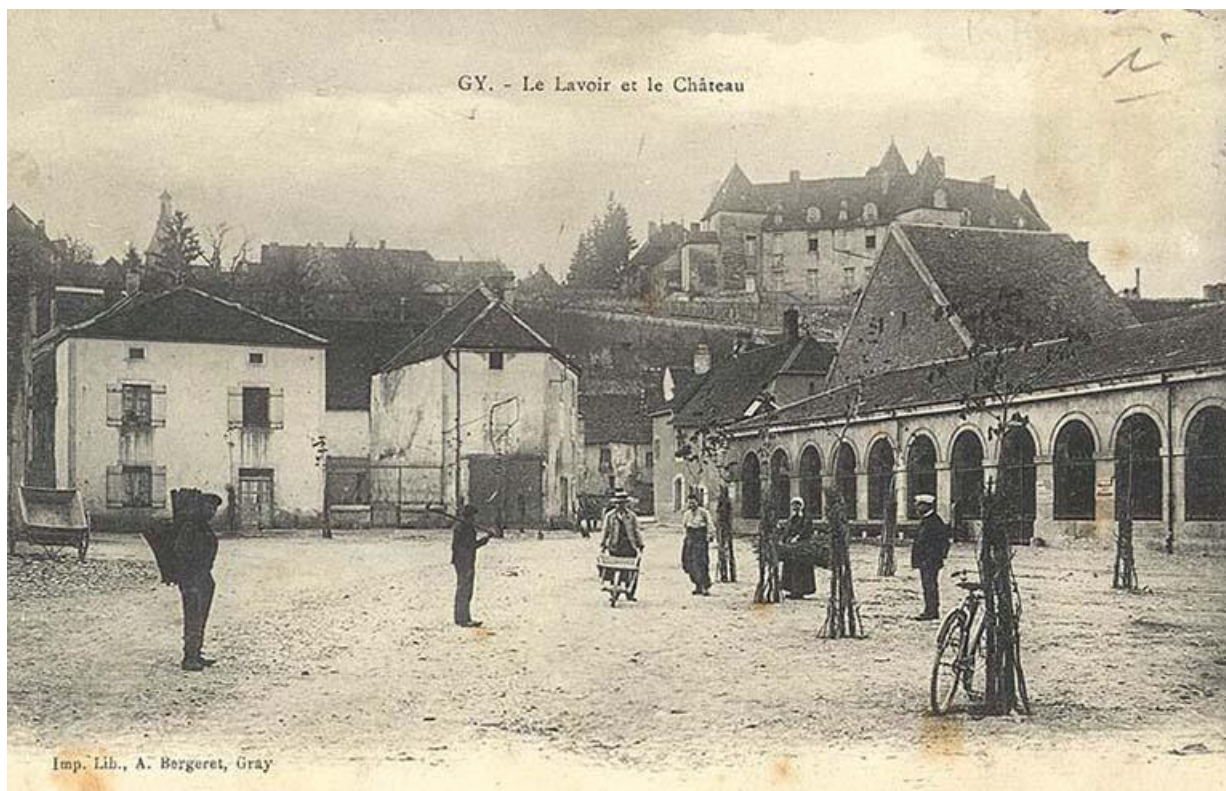
Le lavoir sur une carte postale ancienne