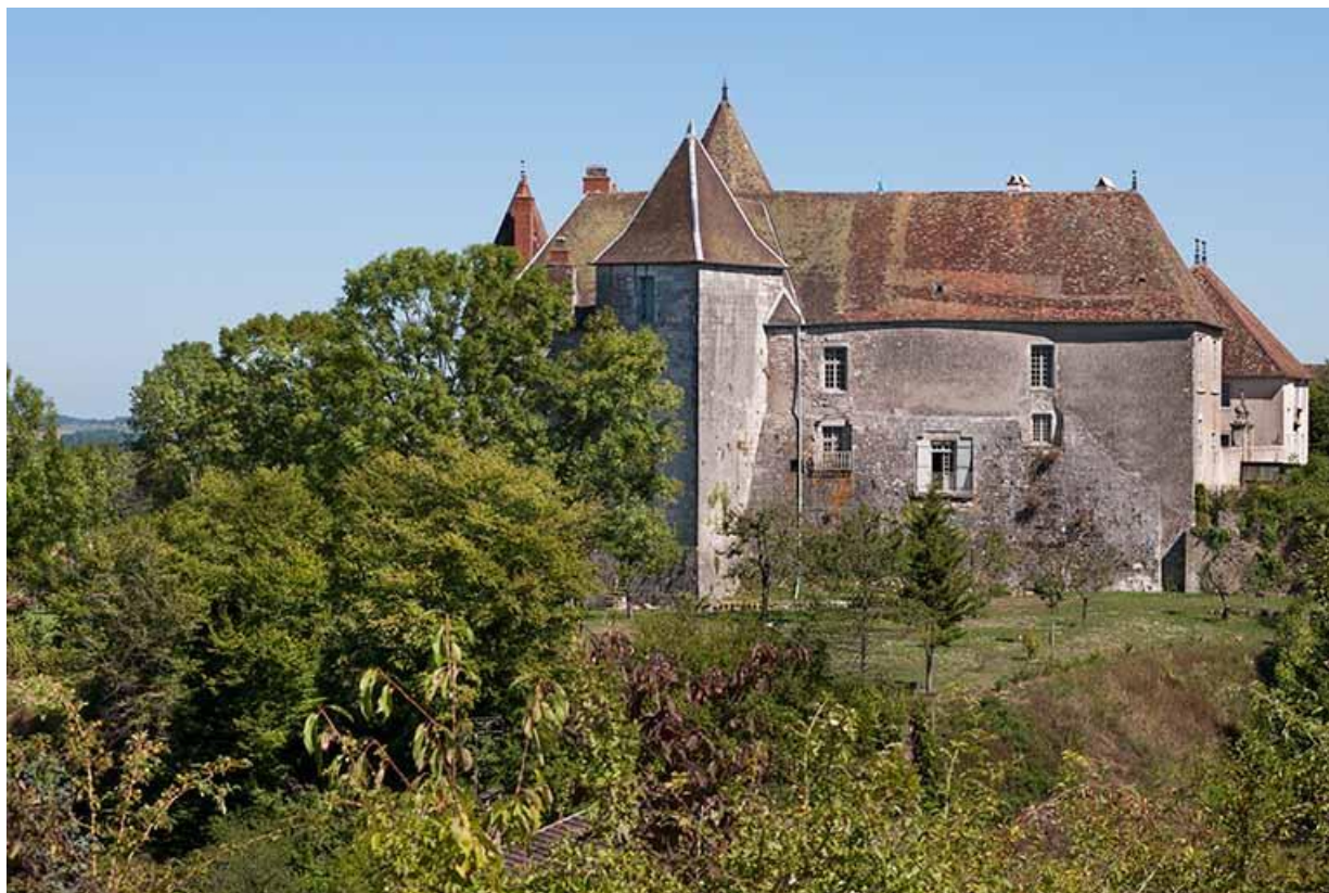
Vue ouest du château