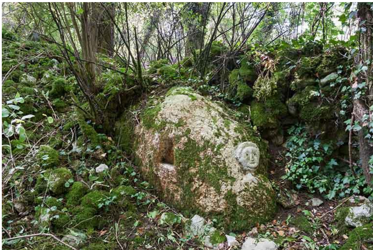
Pierre calcaire sculptée d'un visage humain située dans le Bois de Natoy 70, Gy