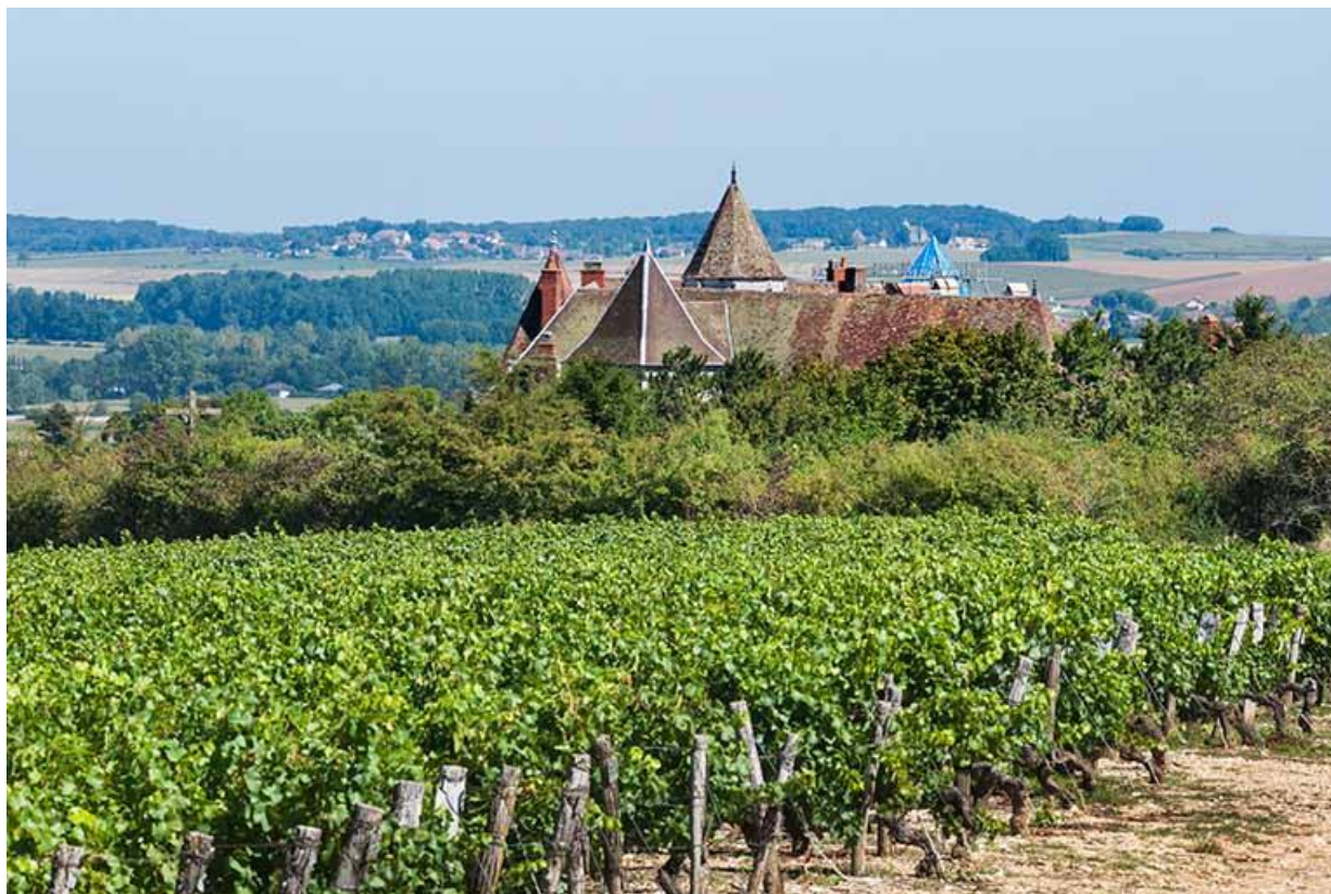
Vignes, ouest de la ville 70, Gy