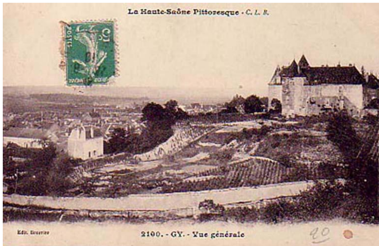
Vue générale ouest 70, Gy