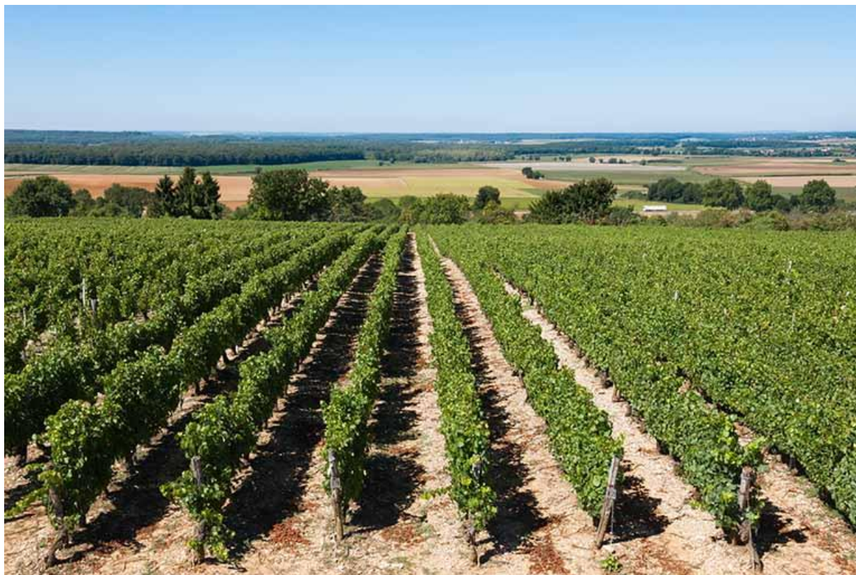
Parcelle de vigne 70, Gy