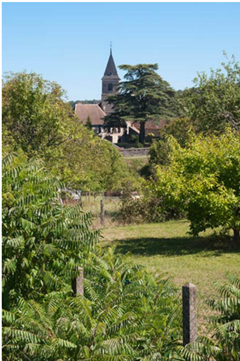
L'église et le château, vue ouest