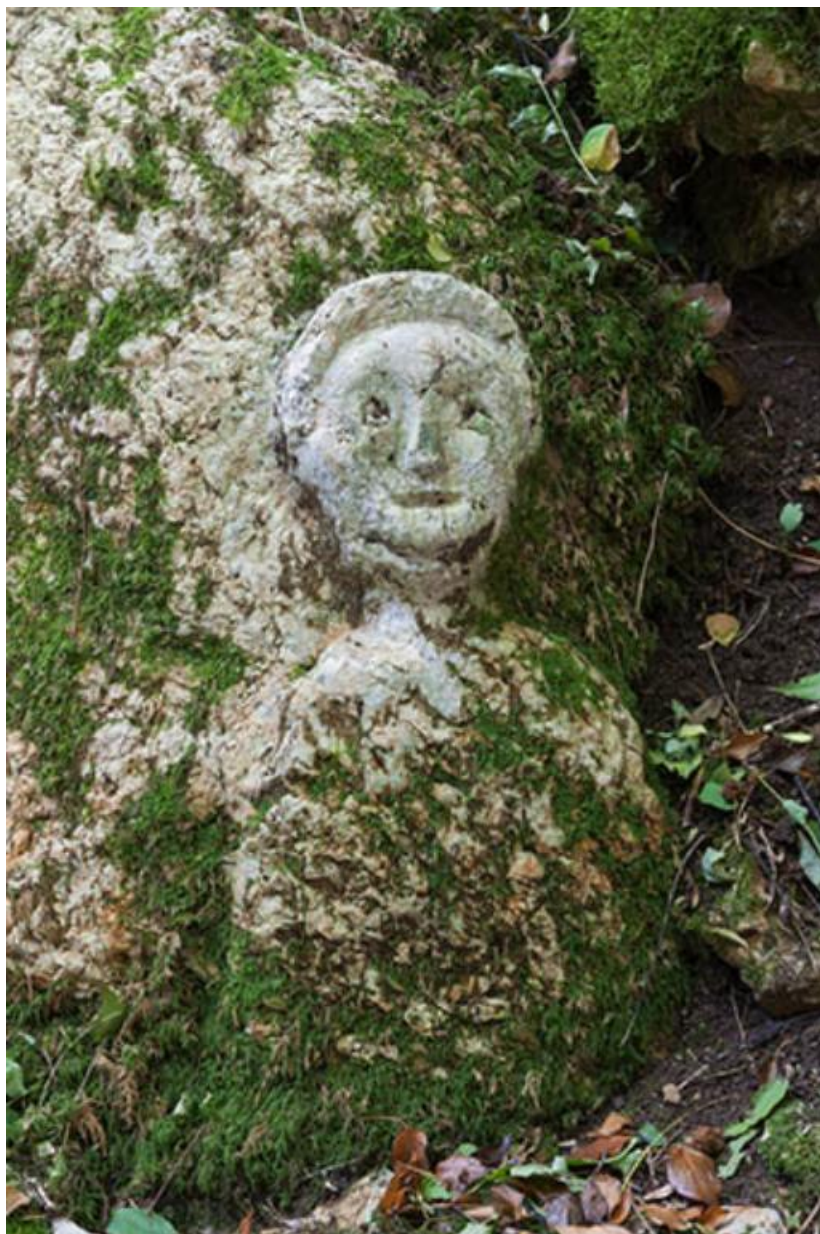
Pierre calcaire sculptée d'un visage humain située dans le Bois de Natoy, détail 70, Gy