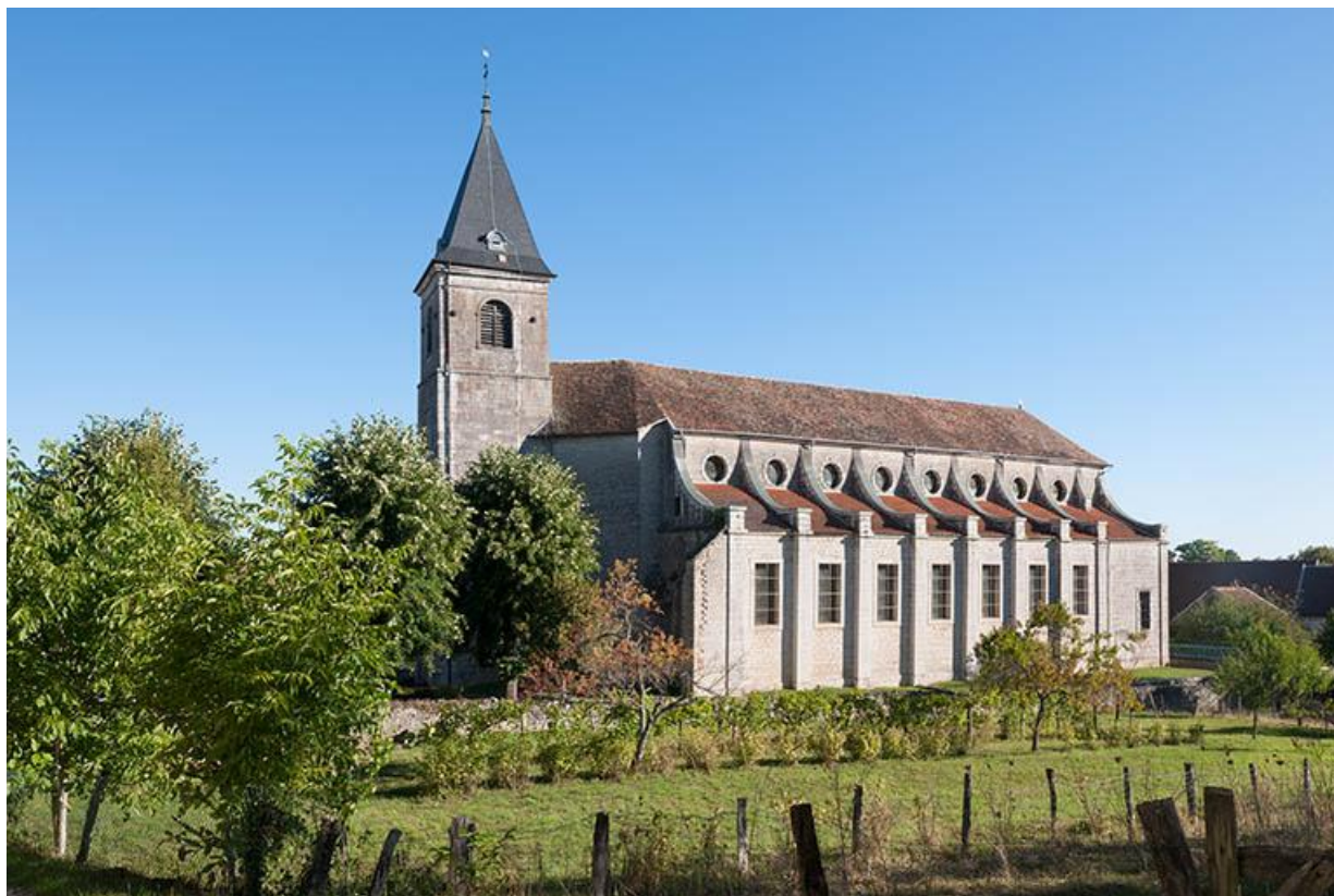
Vue sud-ouest de l'église