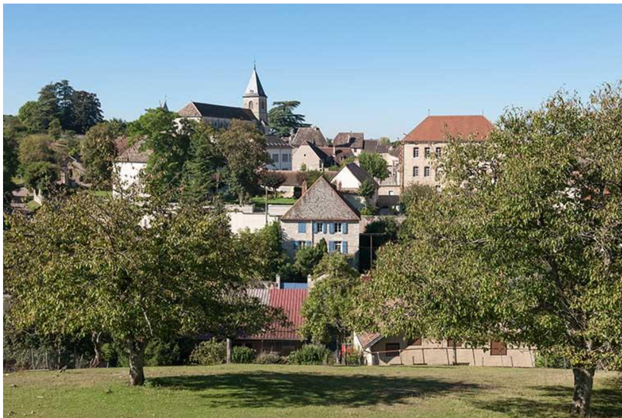
La ville haute 70, Gy