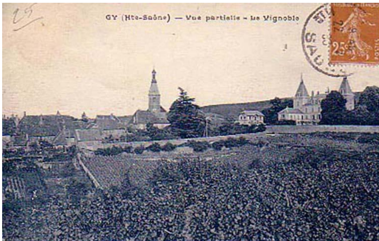
Vue ouest sur une carte postale ancienne 70, Gy