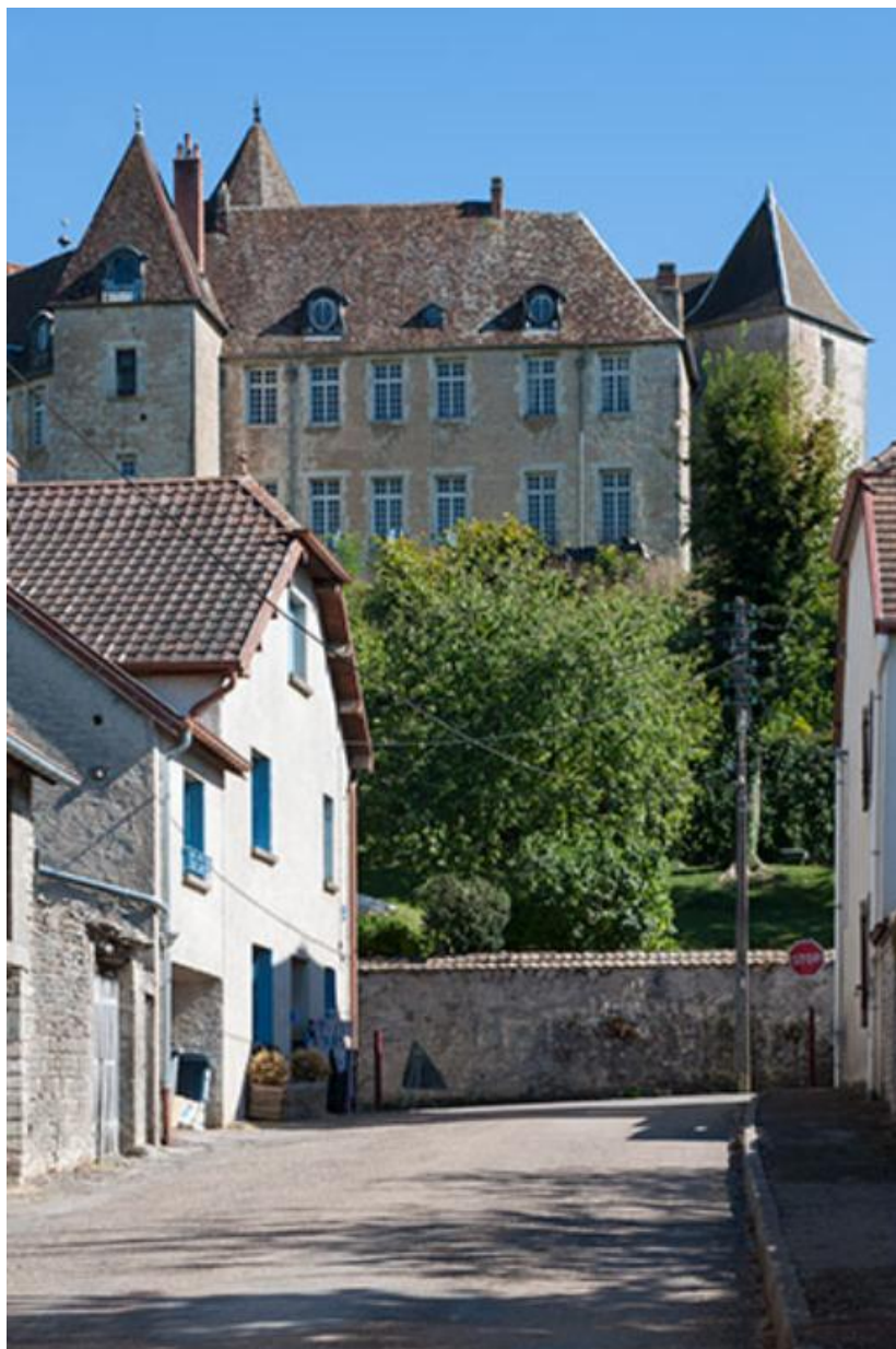
Le château, depuis la rue des Terreaux 70, Gy