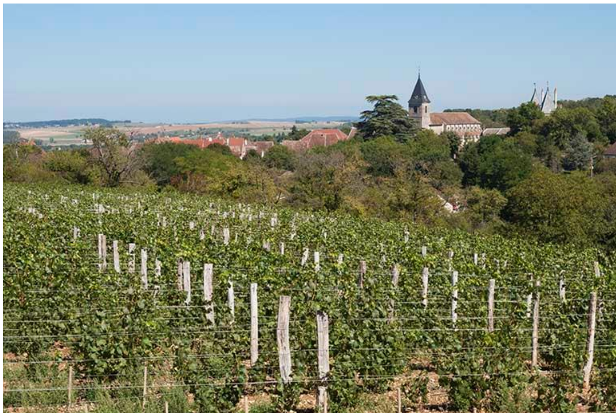
Vignes situées à l'ouest de la commune 70, Gy