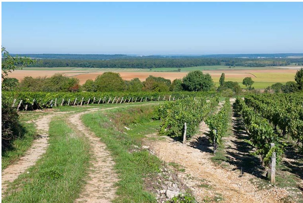
Paysage de vigne situé à l'ouest de la ville haute 70, Gy