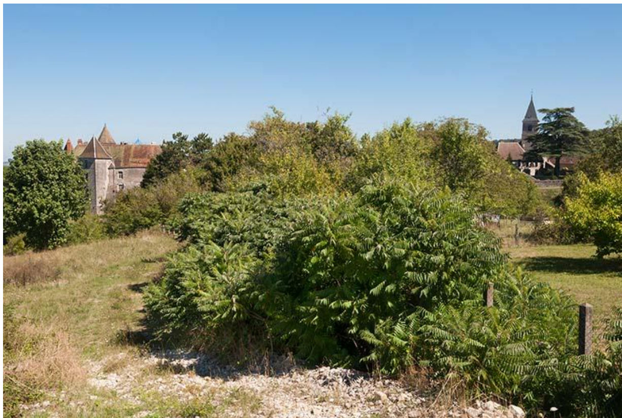
L'église et le château, vue ouest 70, Gy