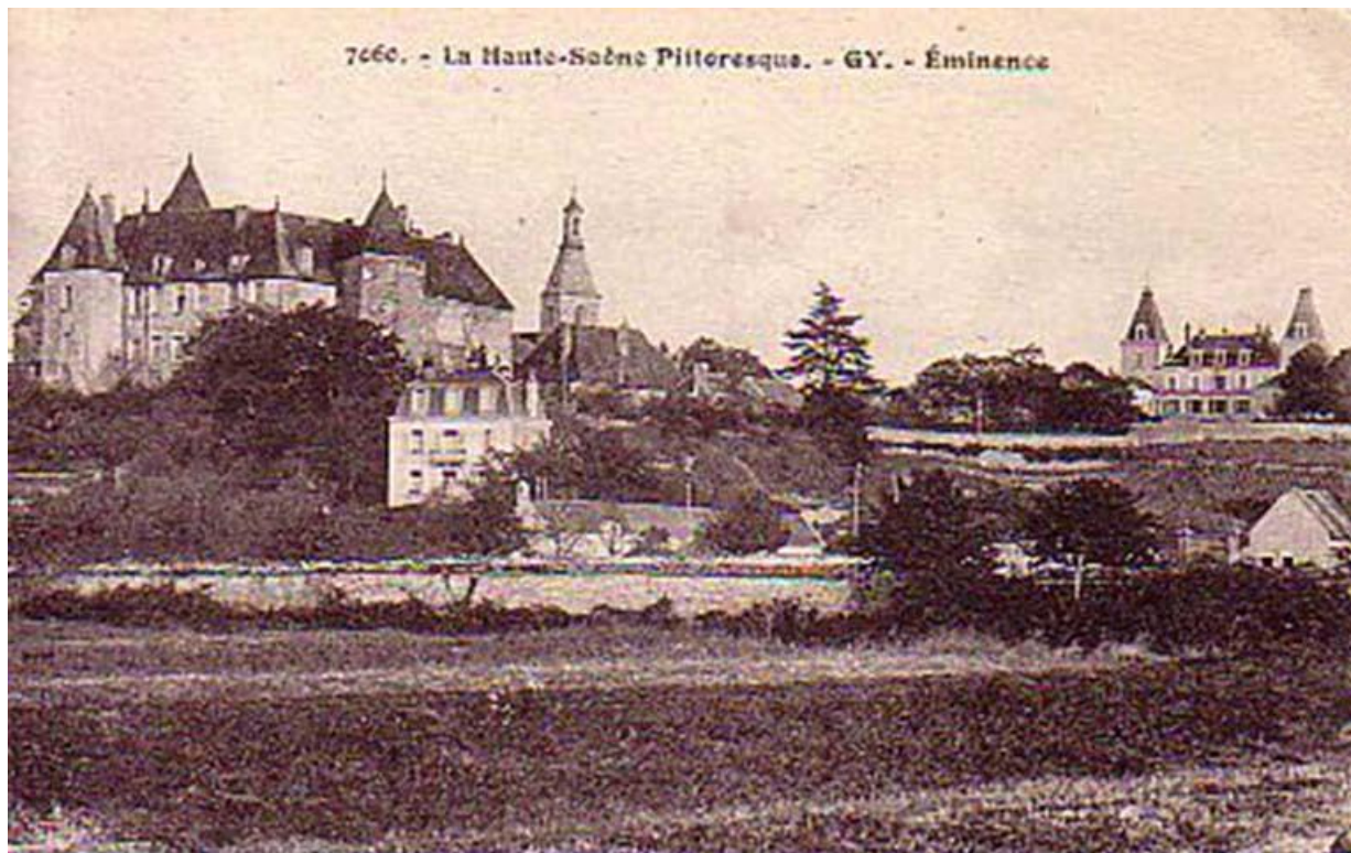
Vue générale du château sur une carte postale ancienne 70, Gy