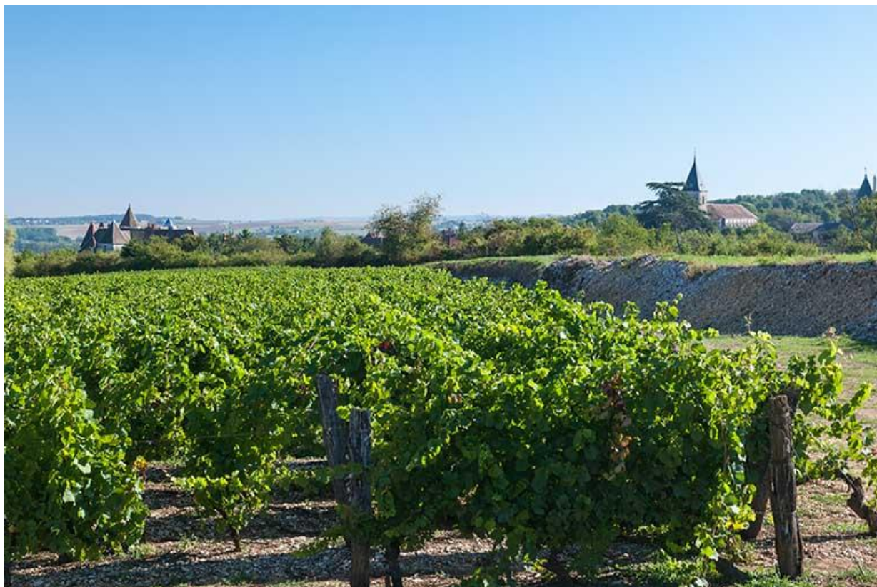
Vignes, ouest de la ville 70, Gy