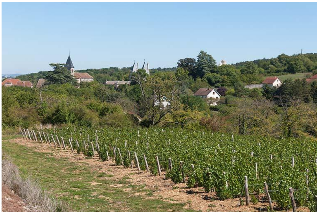
Vignes, ouest de la ville 70, Gy