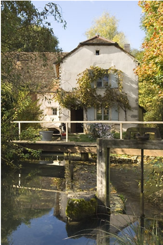
Vue d'ensemble depuis l'est, avec le bief d'amenée.