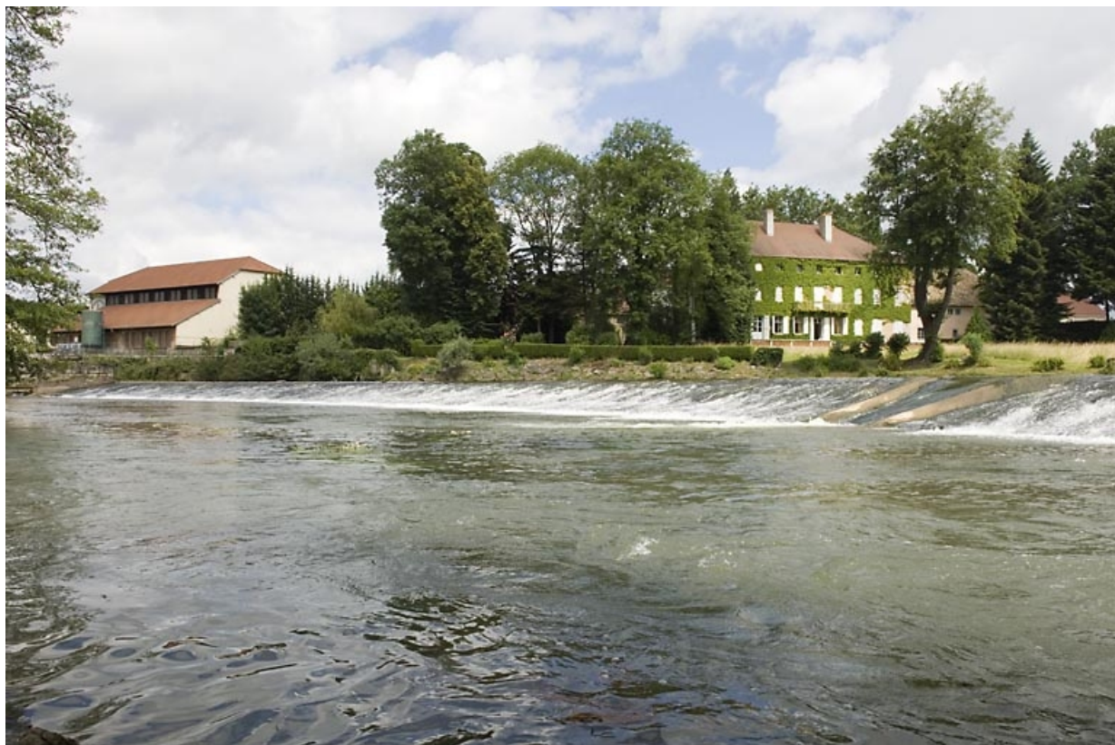
Vue d'ensemble depuis la rive gauche de l'Ognon.