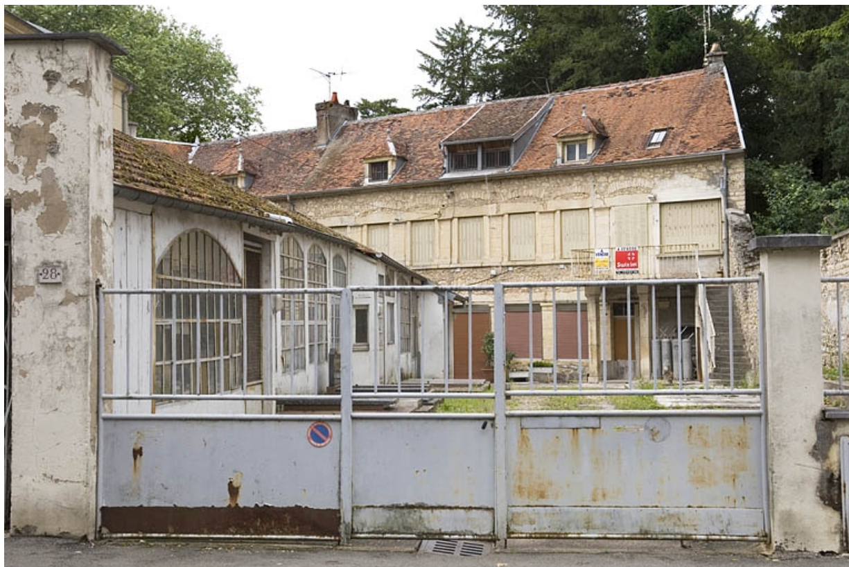
Vue d'ensemble depuis la rue Victor Hugo.