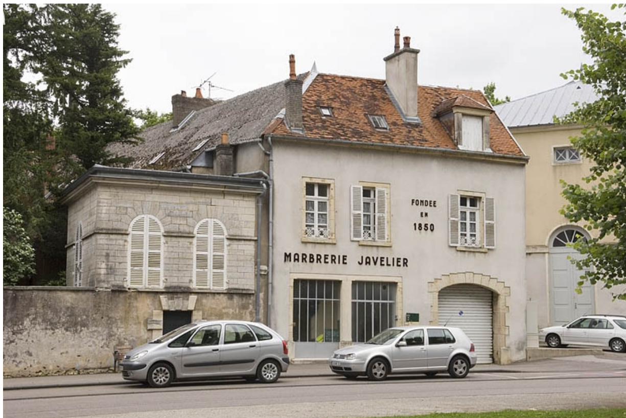
Vue d'ensemble depuis la rue Revon.