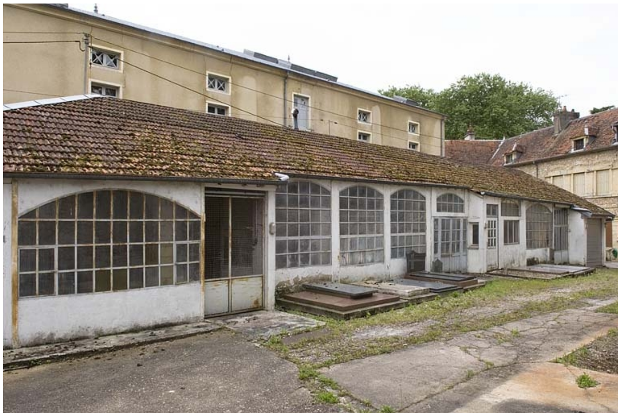
Atelier de fabrication vu de trois quarts.