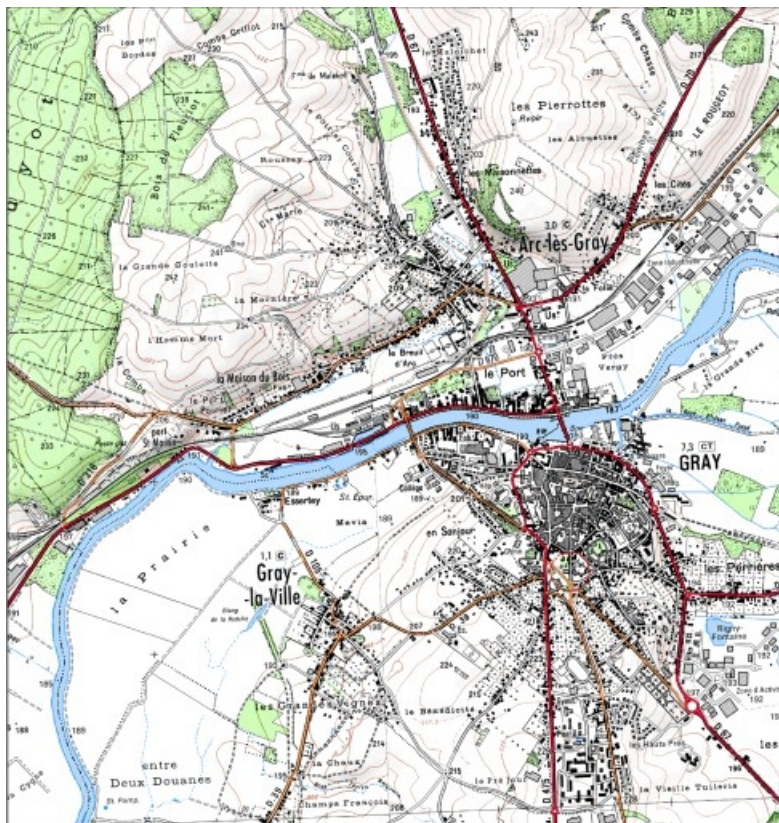
Carte de localisation. Carte topographique au 1:25000, I.G.N., Gray, 3222 E. SCAN 25, Licence n°2008CISE29-68. 70, Gray, 28 rue Victor Hugo