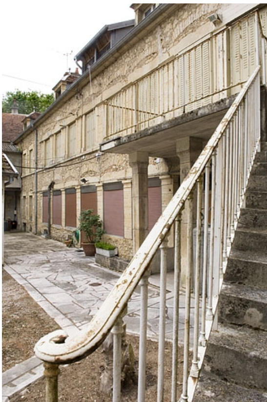
Façade antérieure du logement (atelier de fabrication primitif ?). 70, Gray, 28 rue Victor Hugo