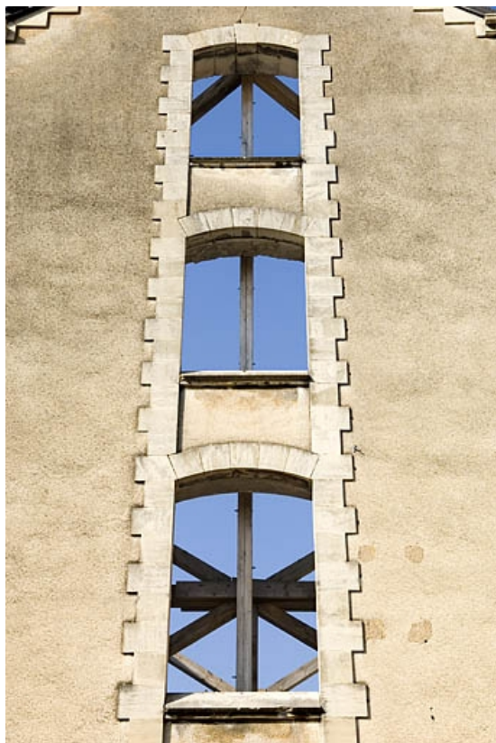
Pignon de l'aile ouest. Ouvertures de la travée centrale.