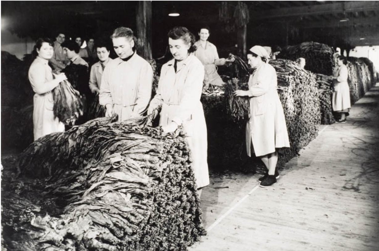
Bâtiment d'exploitation C. Masses de fermentation entièrement constituées. Travaux de retournement avec secouage par le personnel féminin.