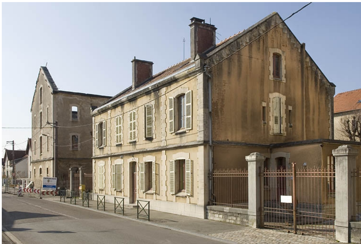
Aile ouest et bâtiment des bureaux depuis la rue.