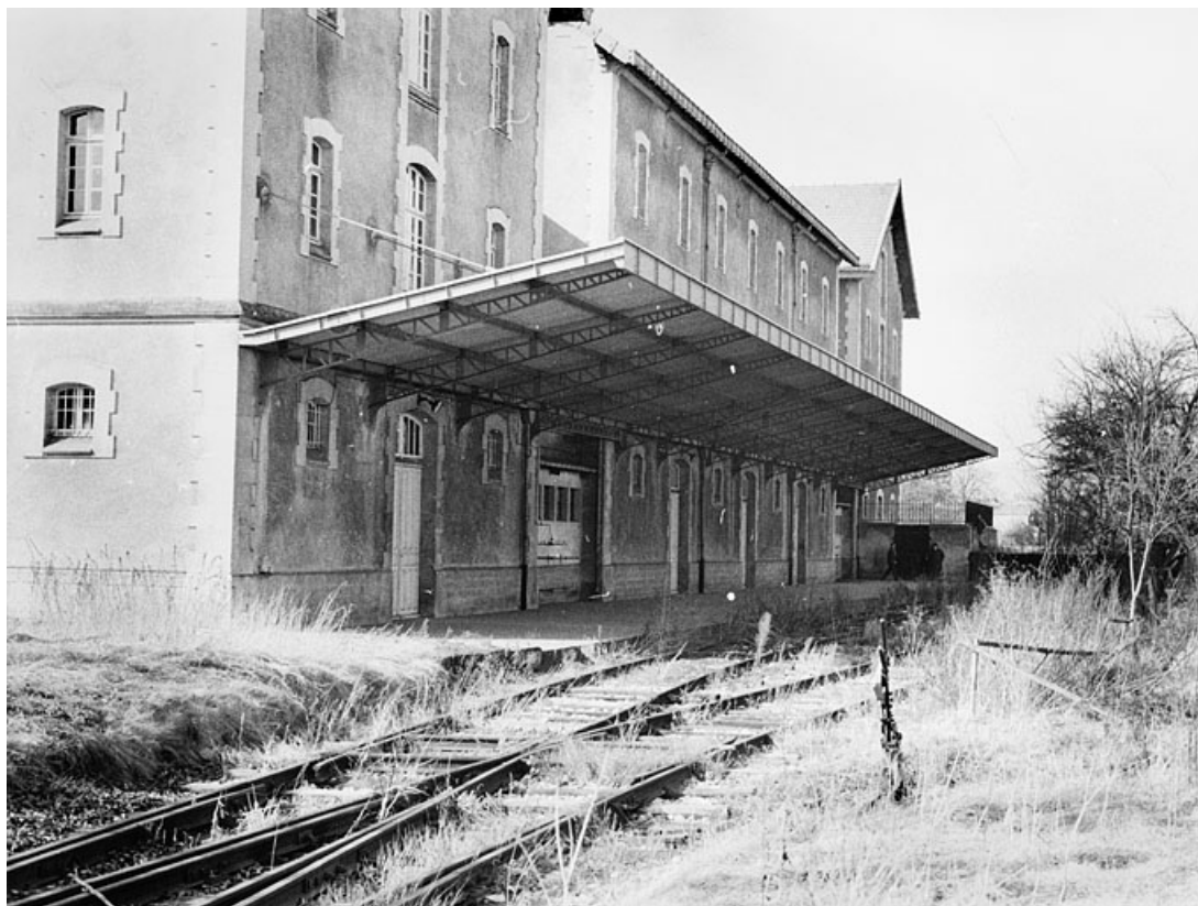
Embranchement ferroviaire et quai de chargement.