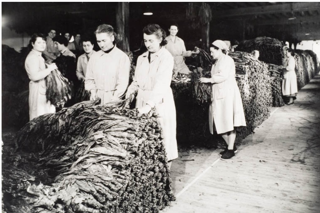
Bâtiment d'exploitation C. Masses de fermentation entièrement constituées. Travaux de retournement avec secouage par le personnel féminin.