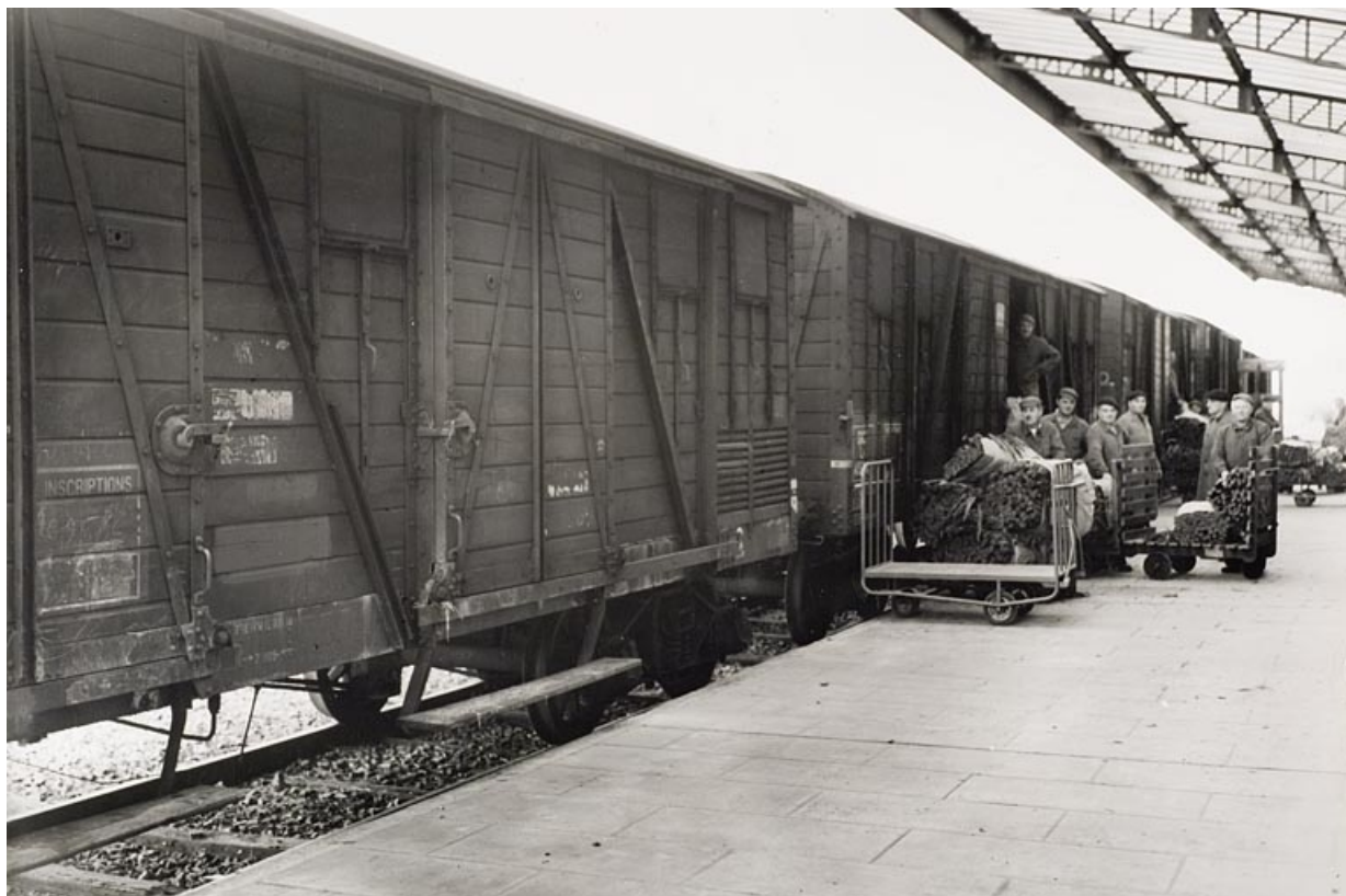
Quai de l'embranchement ferroviaire. Déchargement d'une rame de wagons d'une récolte provenant d'un centre d'achat extérieur. 70, Vesoul, 53 rue Jean Jaurès