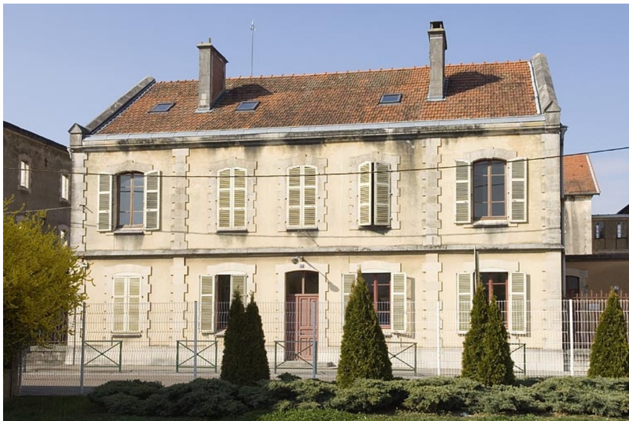
Bâtiment des bureaux. Façade antérieure.