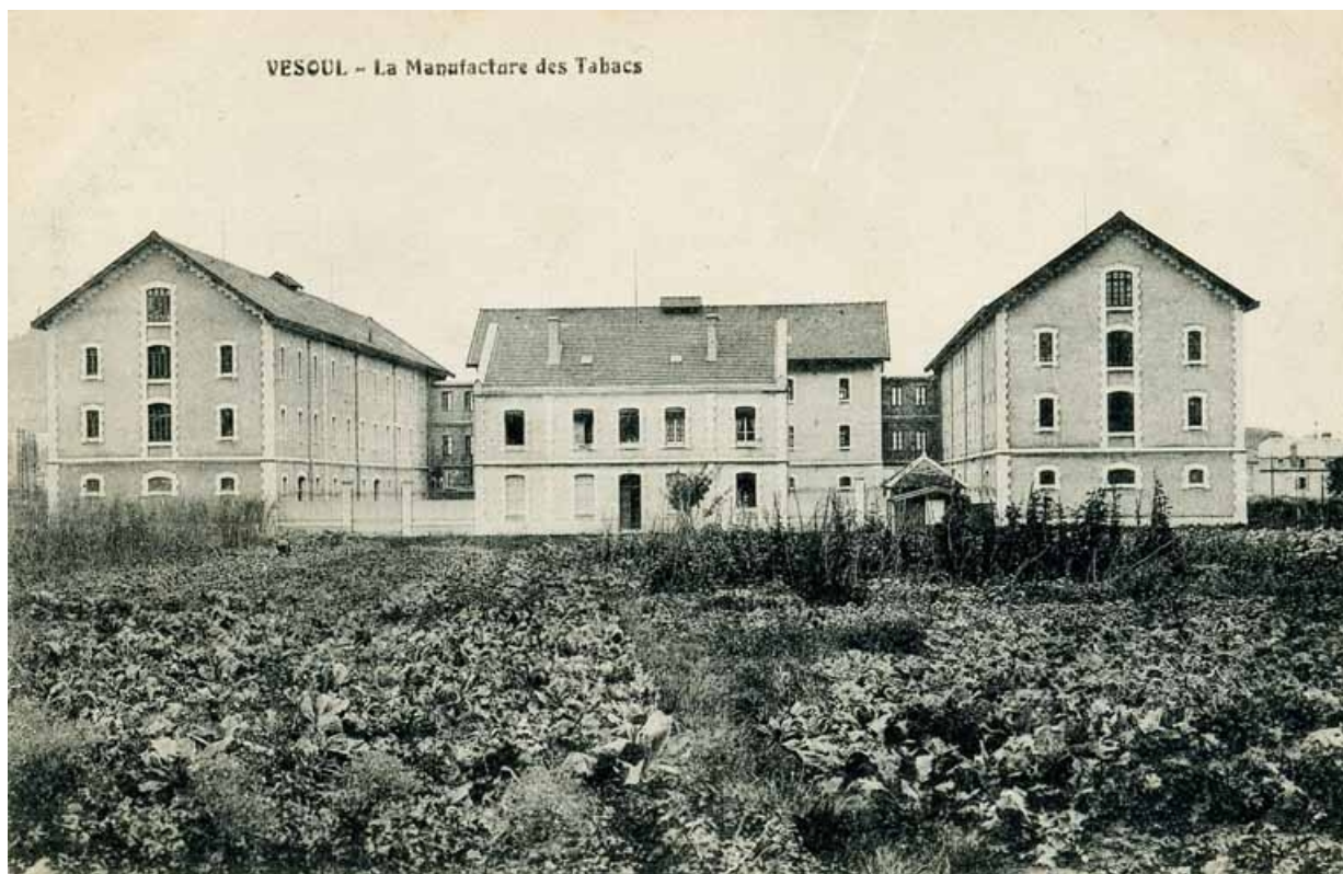
Vesoul - La Manufacture des Tabacs.