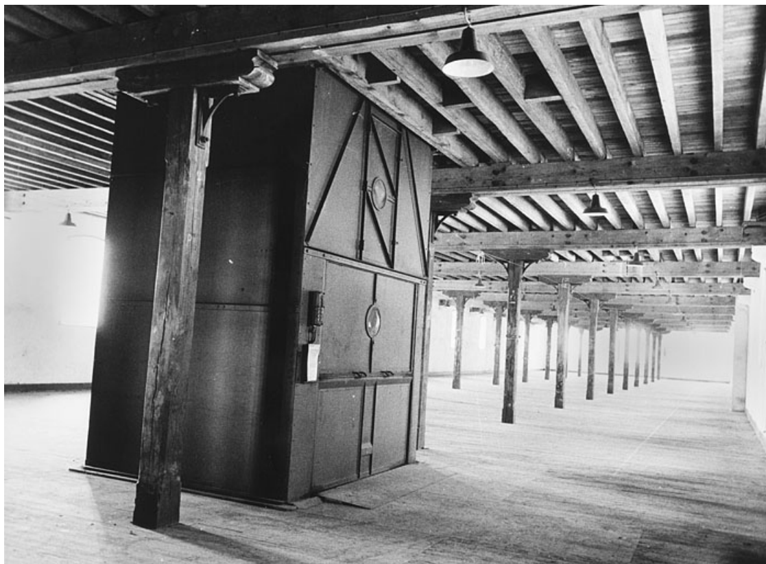
Etage d'un atelier, avec monte-charge au premier plan.