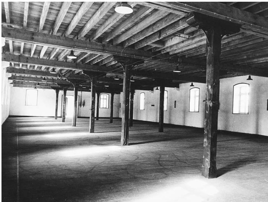
Etage du bâtiment B ou C.