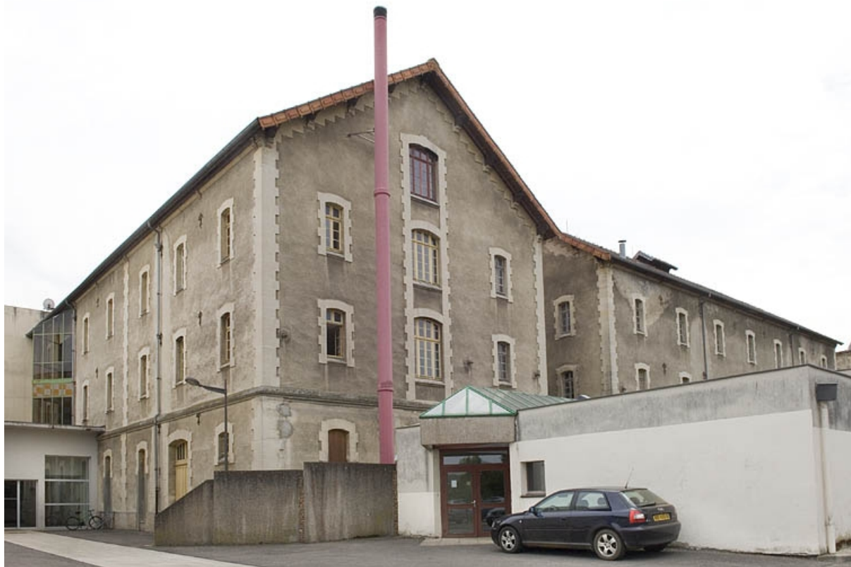
Ailes est vue de trois quarts arrière.