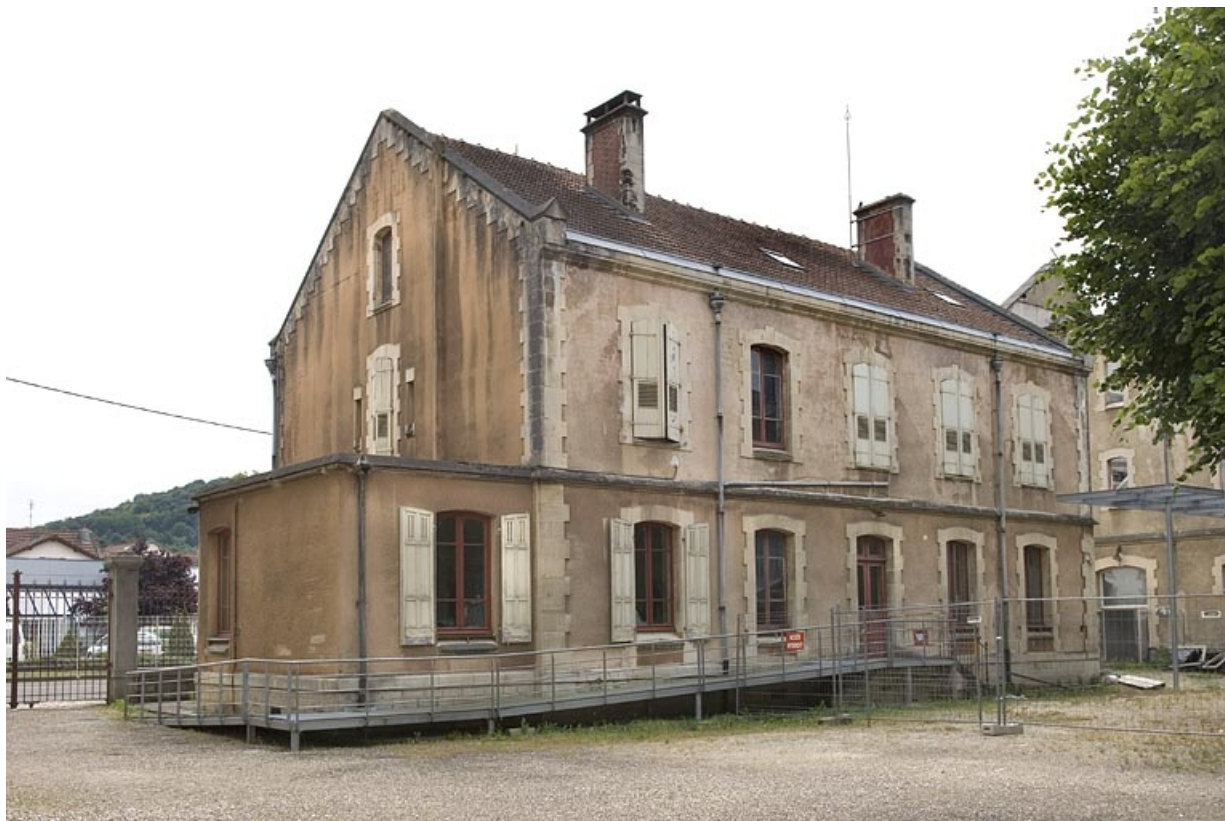
Façade postérieure du bâtiment des bureaux.