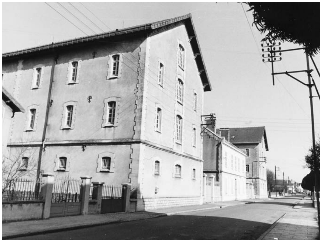
Vue de trois quarts depuis la rue Jean Jaurès.