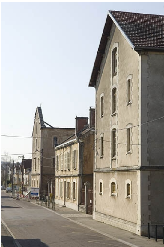
Vue de trois quarts droite.