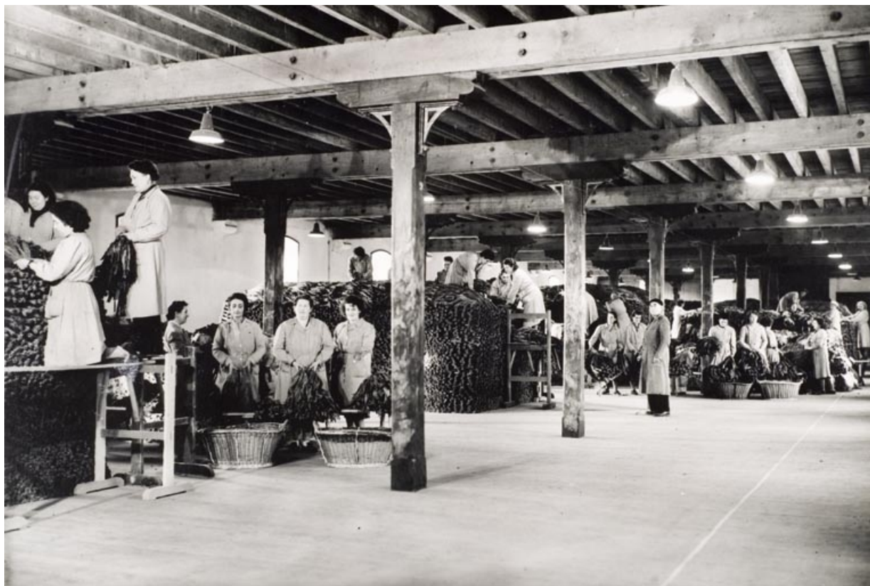
Magasin des tabacs en feuilles (bâtiment d'exploitation B). Masses de fermentation. Travaux de battage-montage par le personnel féminin.