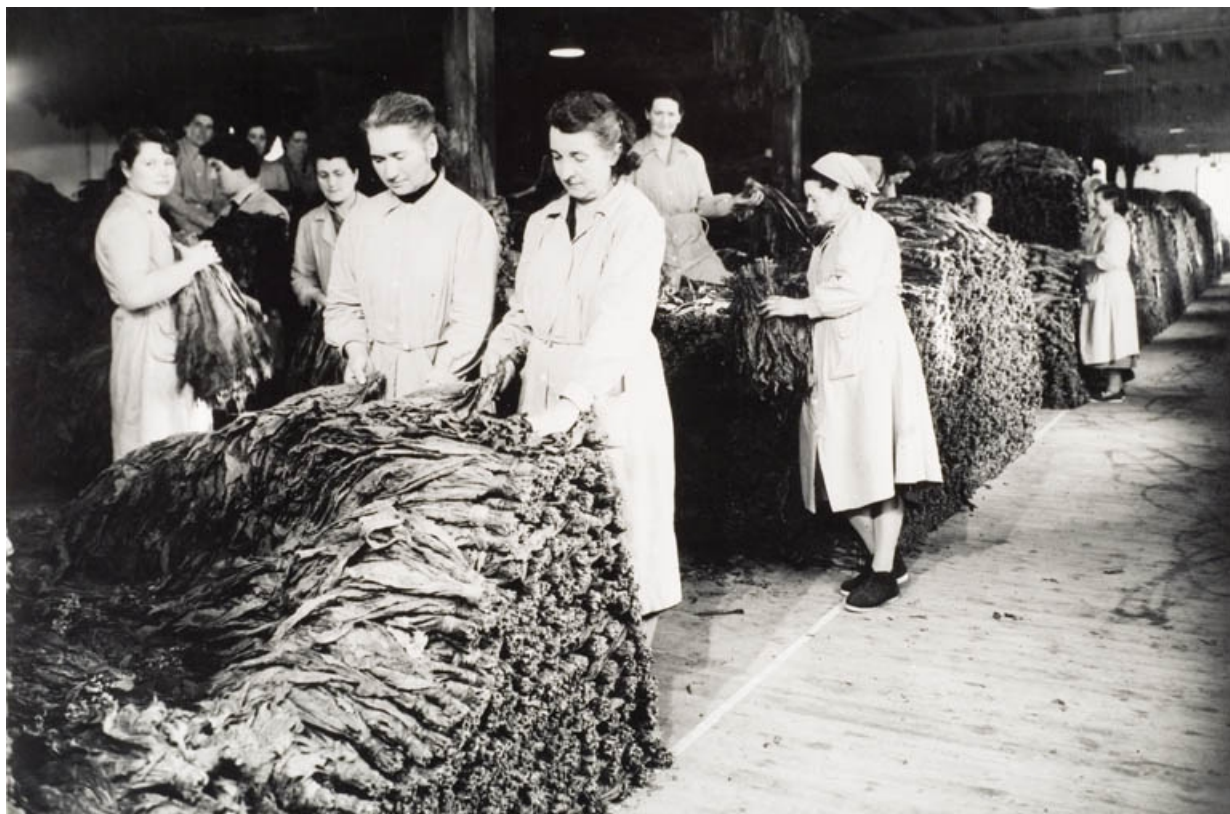
Bâtiment d'exploitation C. Masses de fermentation entièrement constituées. Travaux de retournement avec secouage par le personnel féminin.