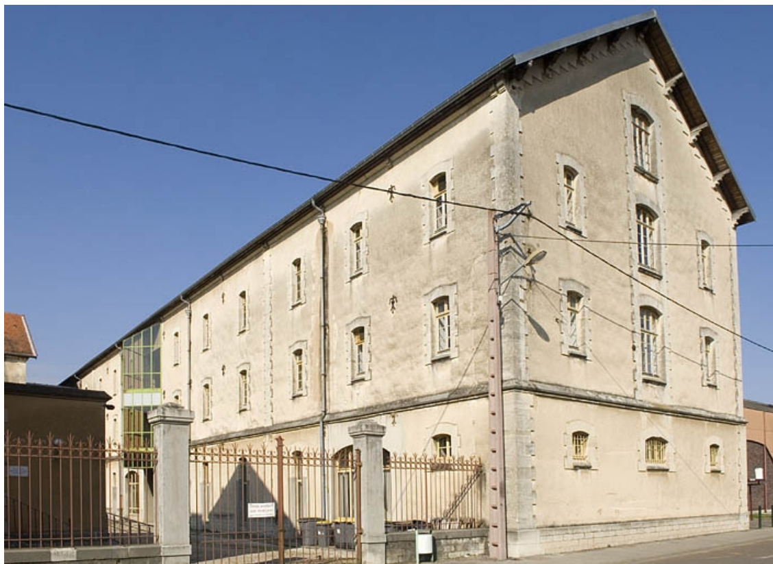
Aile est vue de trois quarts.