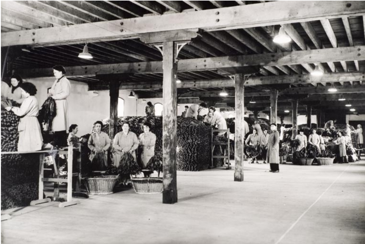
Magasin des tabacs en feuilles (bâtiment d'exploitation B). Masses de fermentation. Travaux de battage-montage par le personnel féminin.