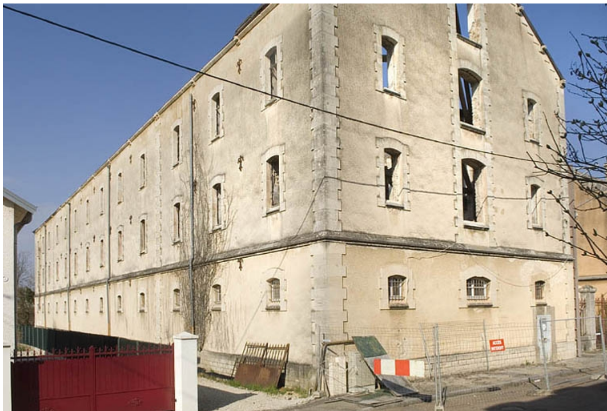
Aile ouest incendiée vue de trois quarts.