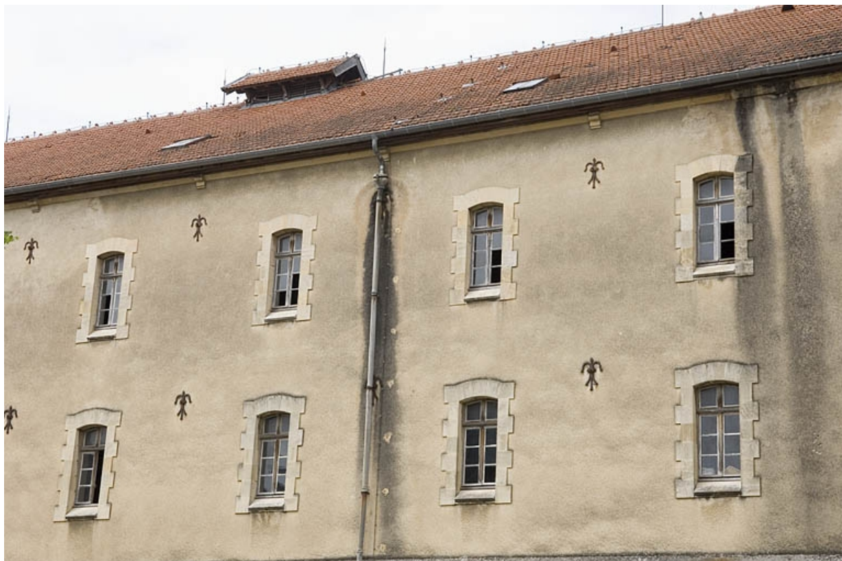
Etages supérieurs du corps central.