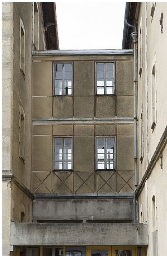
Passerelle entre le corps central et l'aile est.