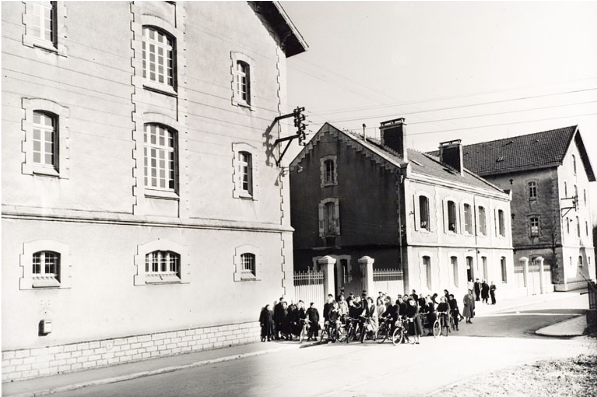
Vue d'ensemble depuis la rue Jean Jaurès des ailes B et C des bâtiments d'exploitation et pavillon A. Sortie du personnel. 70, Vesoul, 53 rue Jean Jaurès