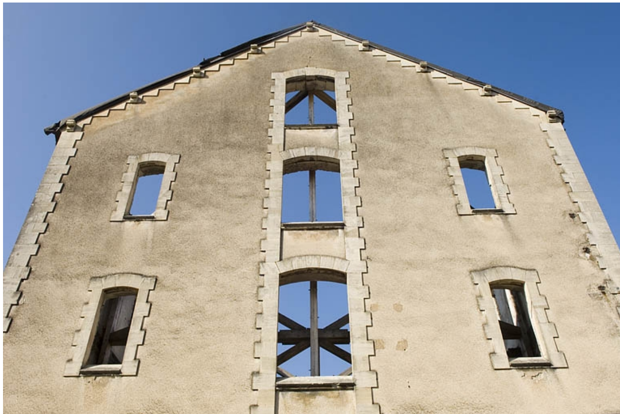
Aile ouest. Pignon sur rue.