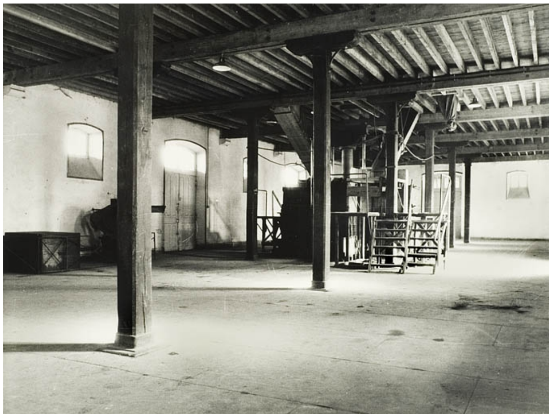
Rez-de-chaussée d'un atelier.