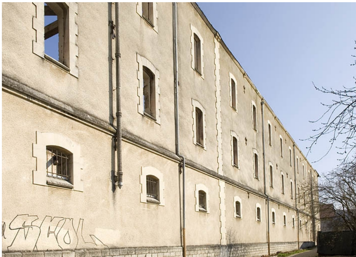
Aile ouest. Façade occidentale.