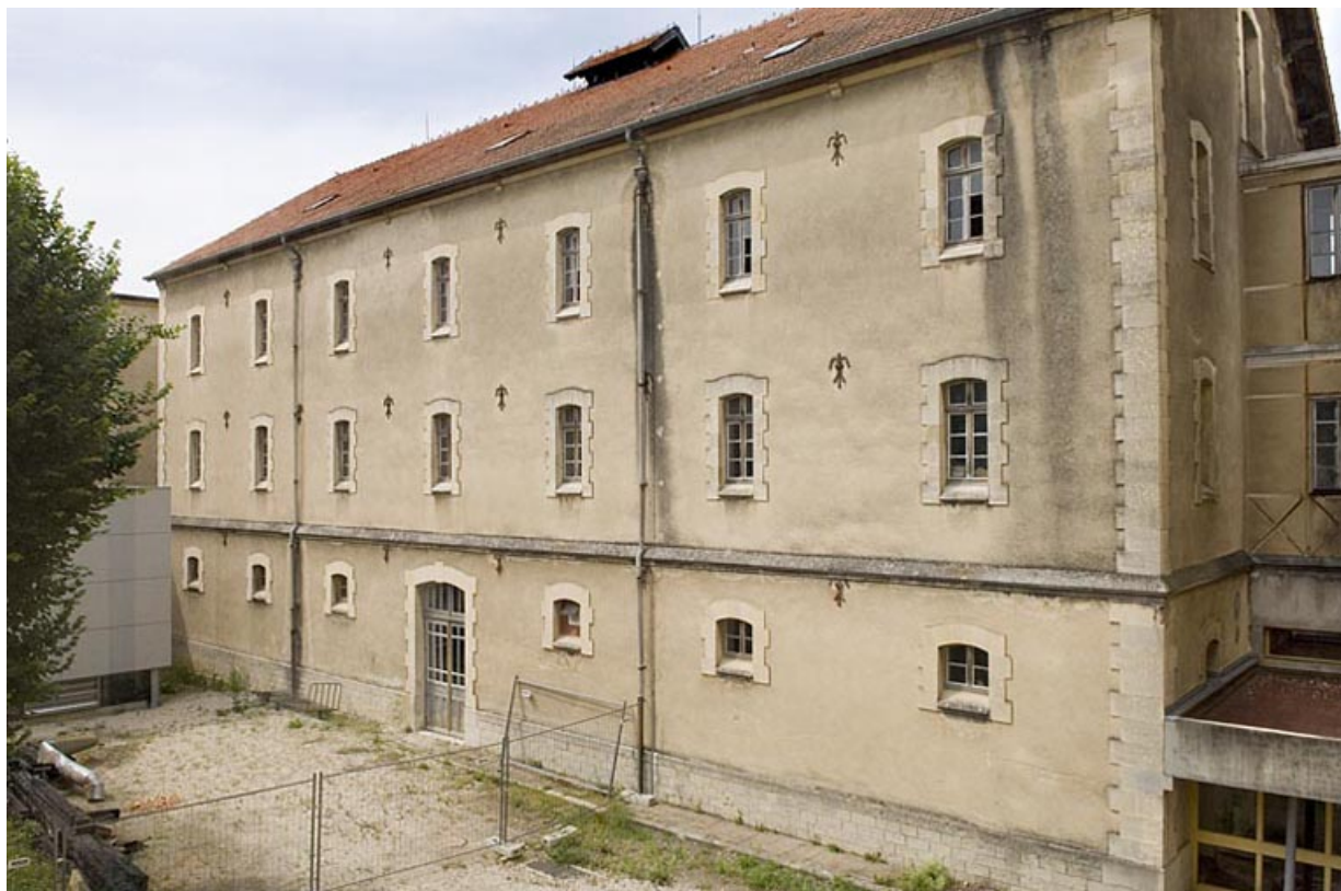
Vue depuis la cour. Elévation du corps central.