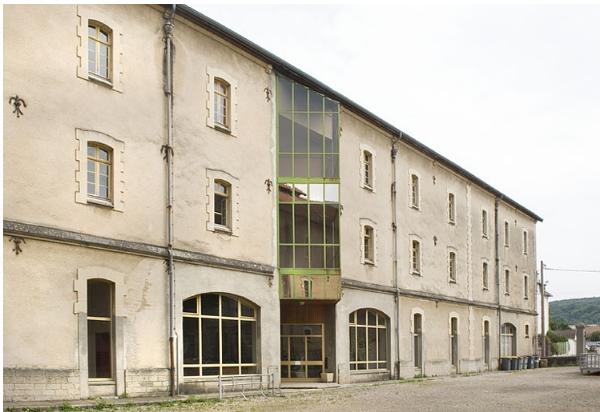
Vue depuis la cour. Elévation de l'aile est.