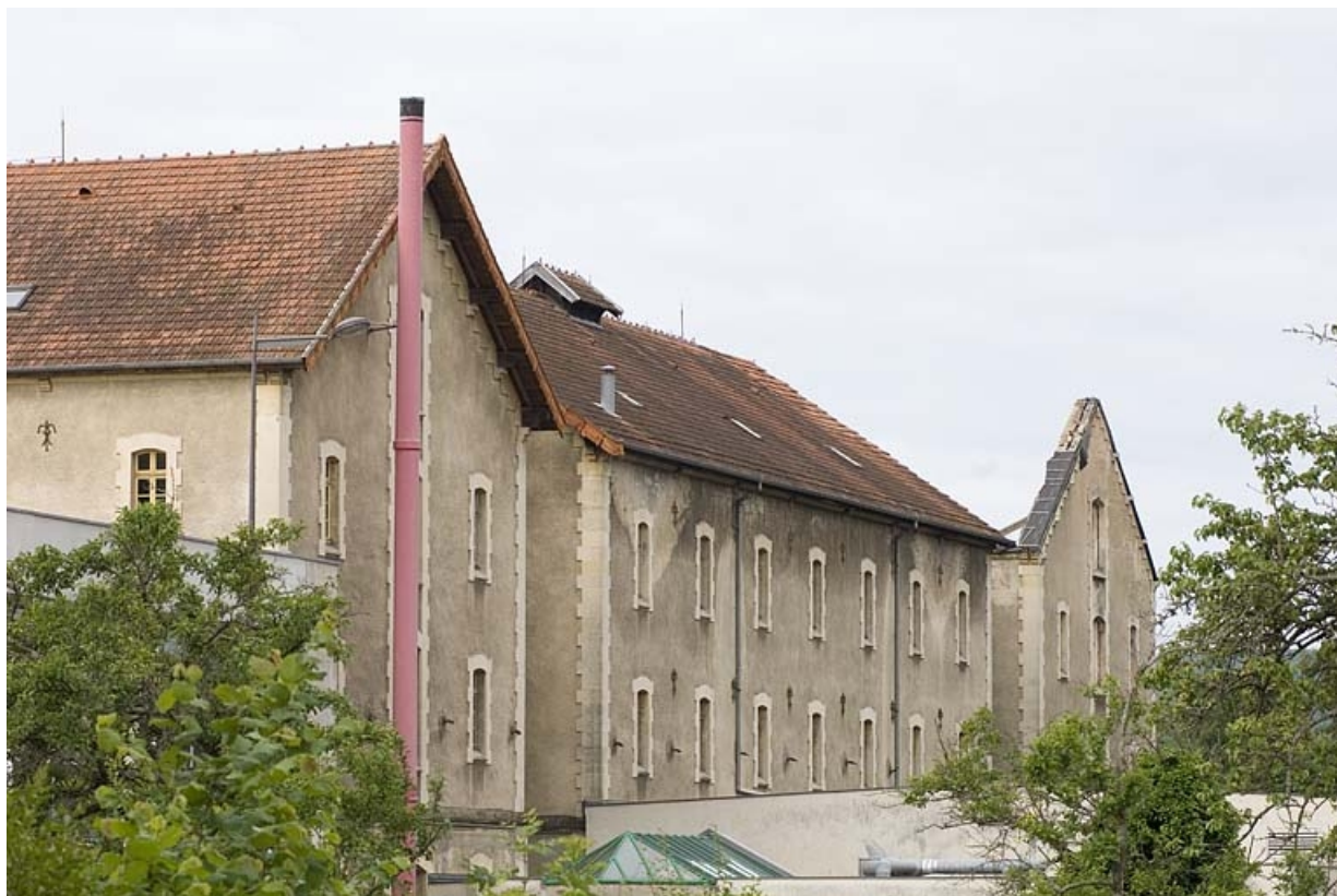
Vue de trois quarts arrière.