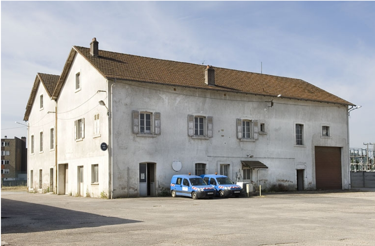
Vue depuis le nord-est.

70, Vesoul rue de la Périlleuse, lieudit : le Moulin Saint-Martin