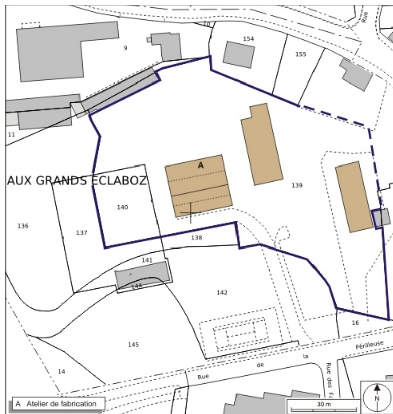
Plan-masse et de situation. Extrait du plan cadastral numérisé, 2008, section BT, 1:1000. Source : Direction générale des Finances Publiques - Cadastre ; mise à jour : 2008.

70, Vesoul rue de la Périlleuse, lieudit : le Moulin Saint-Martin