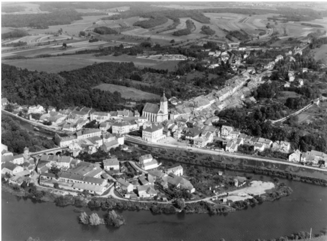
Vue aérienne depuis le sud-ouest.

70, Port-sur-Saône, 33, 35 rue de la Rezelle