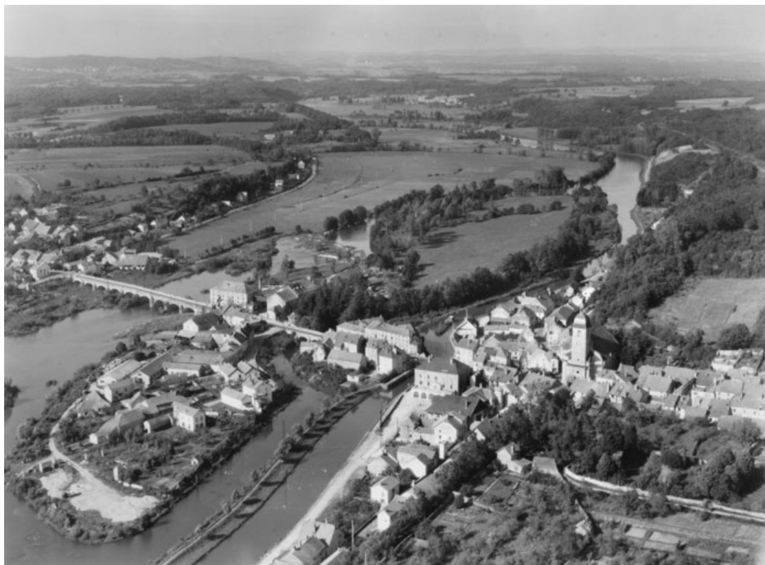
Vue aérienne depuis le sud-est.

70, Port-sur-Saône, 33, 35 rue de la Rezelle