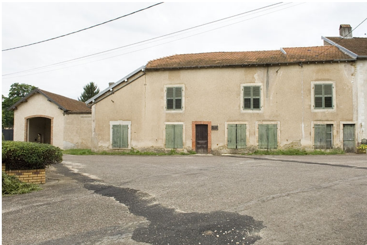
Vue du bâtiment d'entrée.

70, Port-sur-Saône, 33, 35 rue de la Rezelle