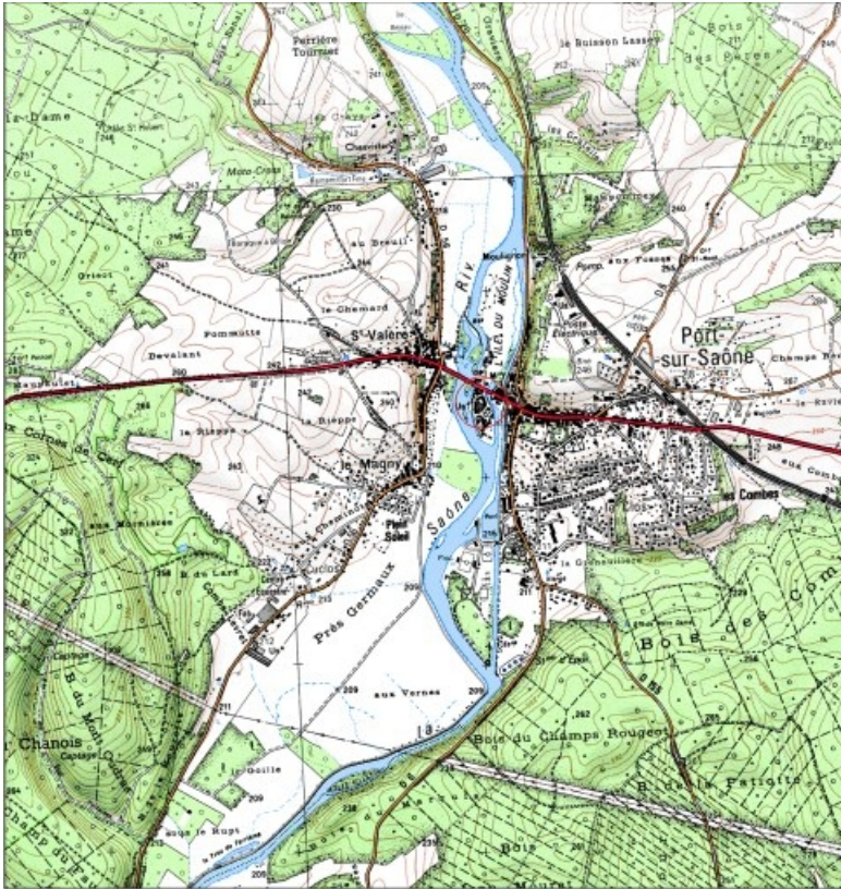
Carte de localisation. Carte topographique au 1:25000, I.G.N., Port-sur-Saône, 3321 E. SCAN 25 © IGN - 2008, Licence n°2008CISE29-68.

70, Port-sur-Saône, 33, 35 rue de la Rezelle