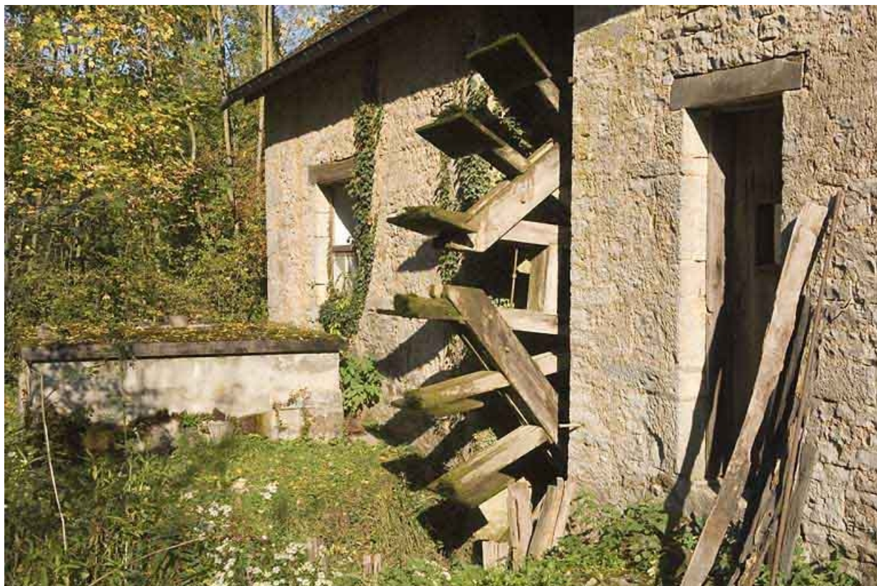
Façade postérieure. Détail de la roue.