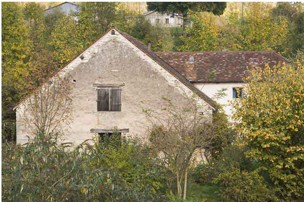
Pignon sud du moulin.