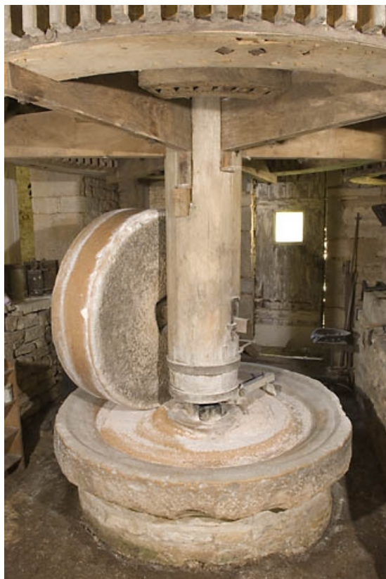
Paire de meules (ou ribe). Vue d'ensemble.