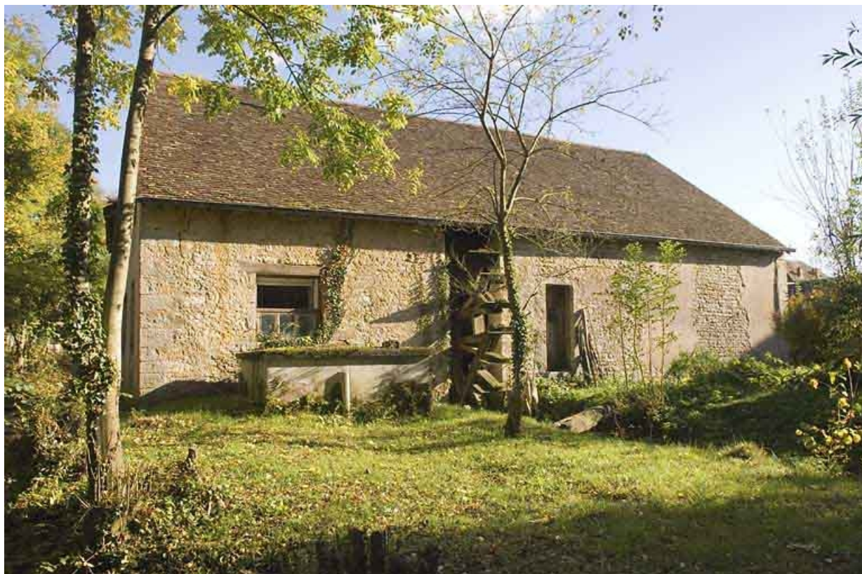
Façade postérieure du moulin.