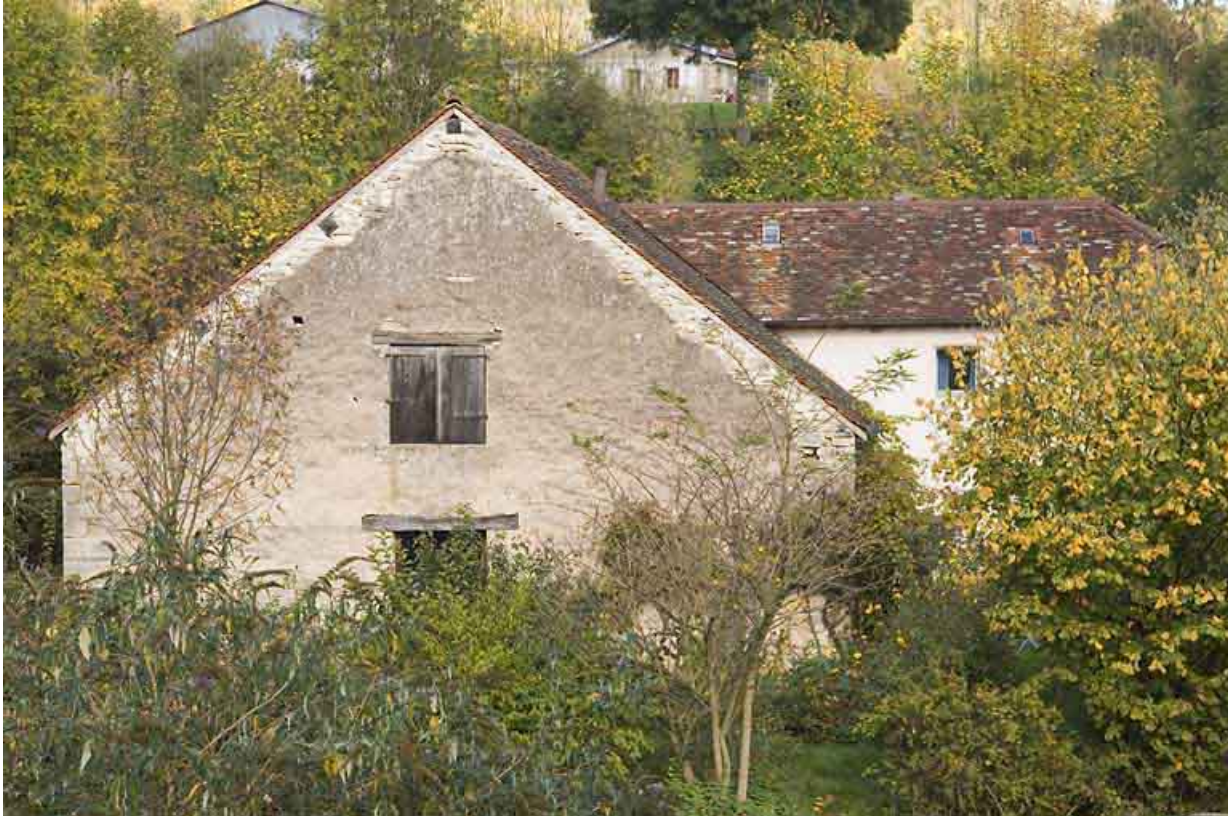
Pignon sud du moulin.