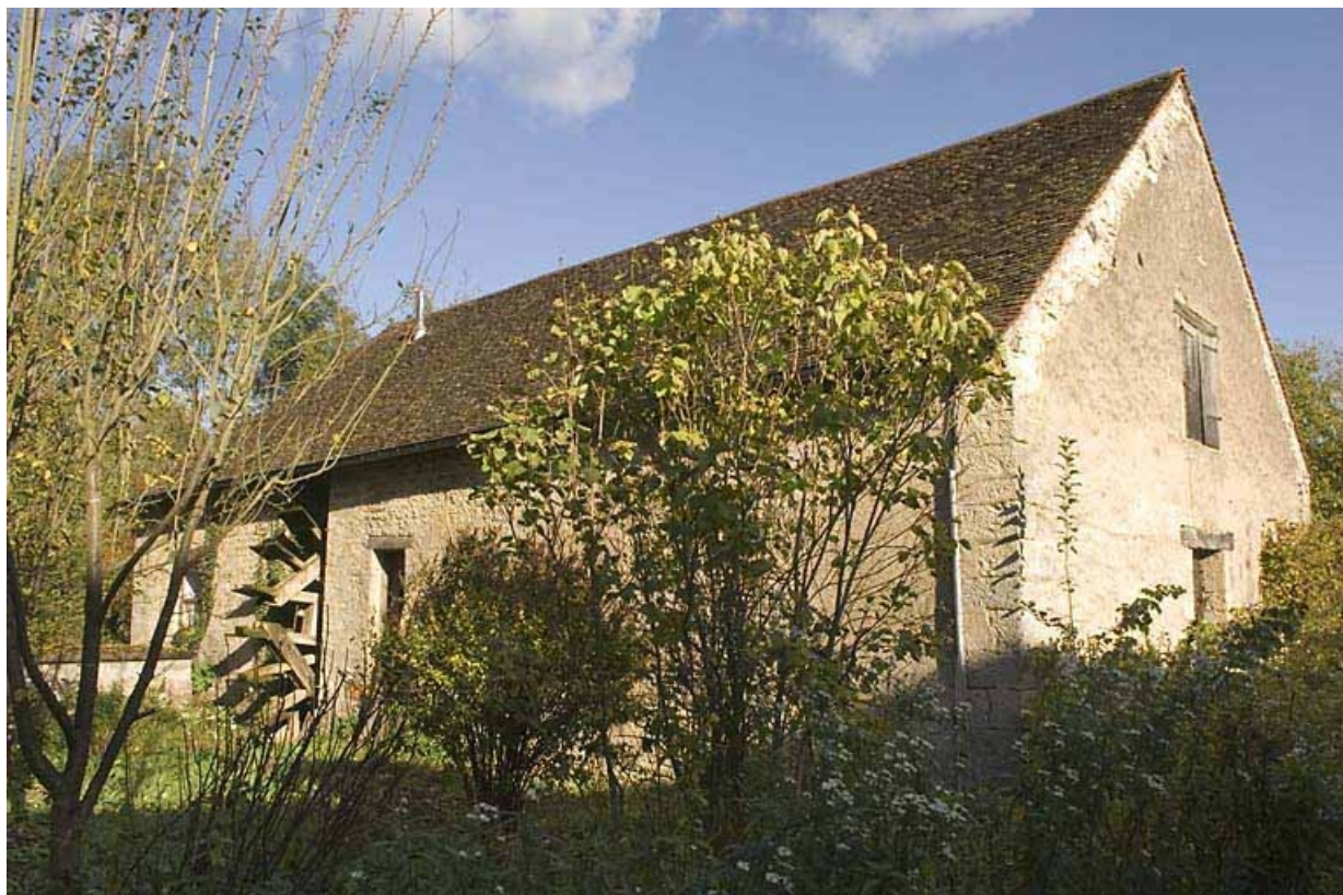
Le moulin vu de trois quarts arrière.