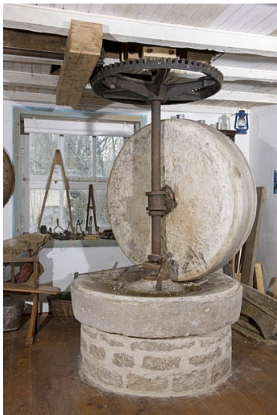
Meules de broyage installées dans le logis.