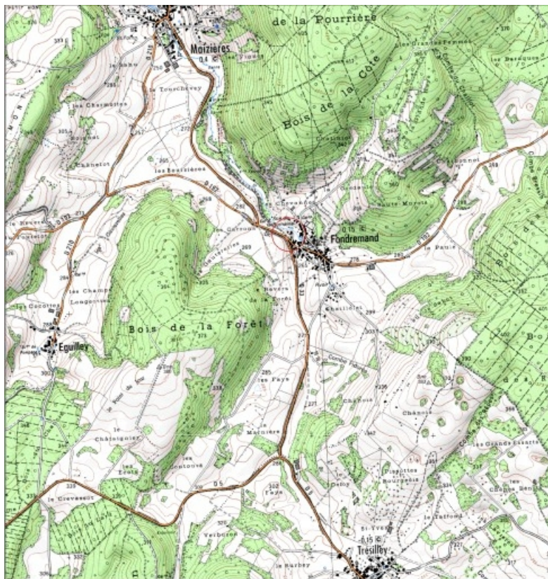
Carte de localisation. Carte topographique au 1:25000, I.G.N., Rioz, 3322 E. SCAN 25, Licence n°2008CISE29-68. 70, Fondremand, lieudit : le Moulin