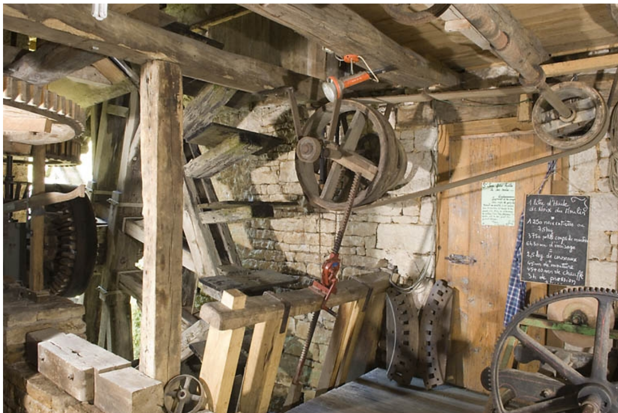
Atelier de fabrication. Roue hydraulique et transmissions.