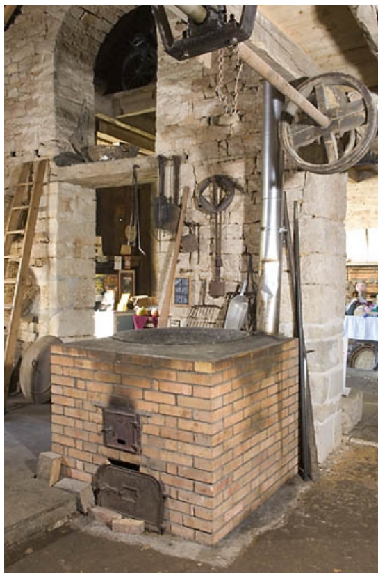
Chaudière (cuisson des matières oléagineuses).