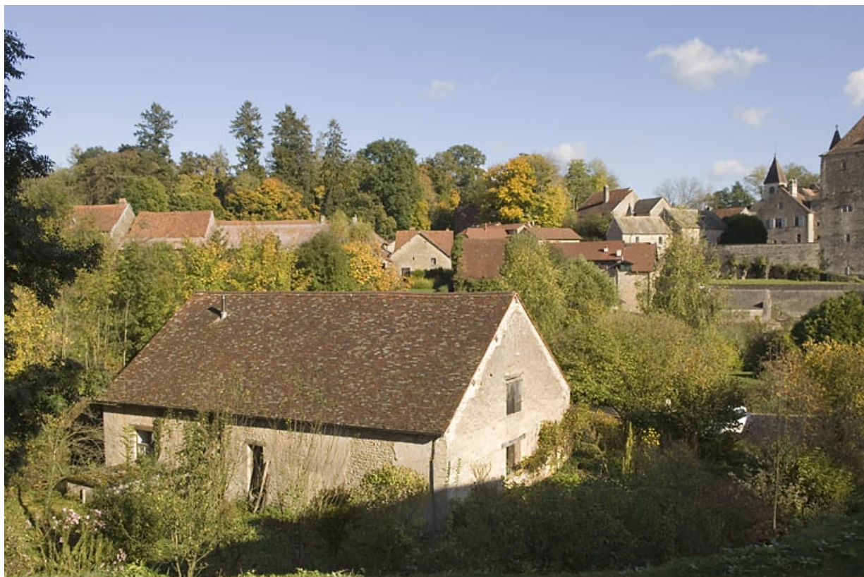
Vue plongeante depuis l'ouest. 70, Fondremand, lieudit : le Moulin