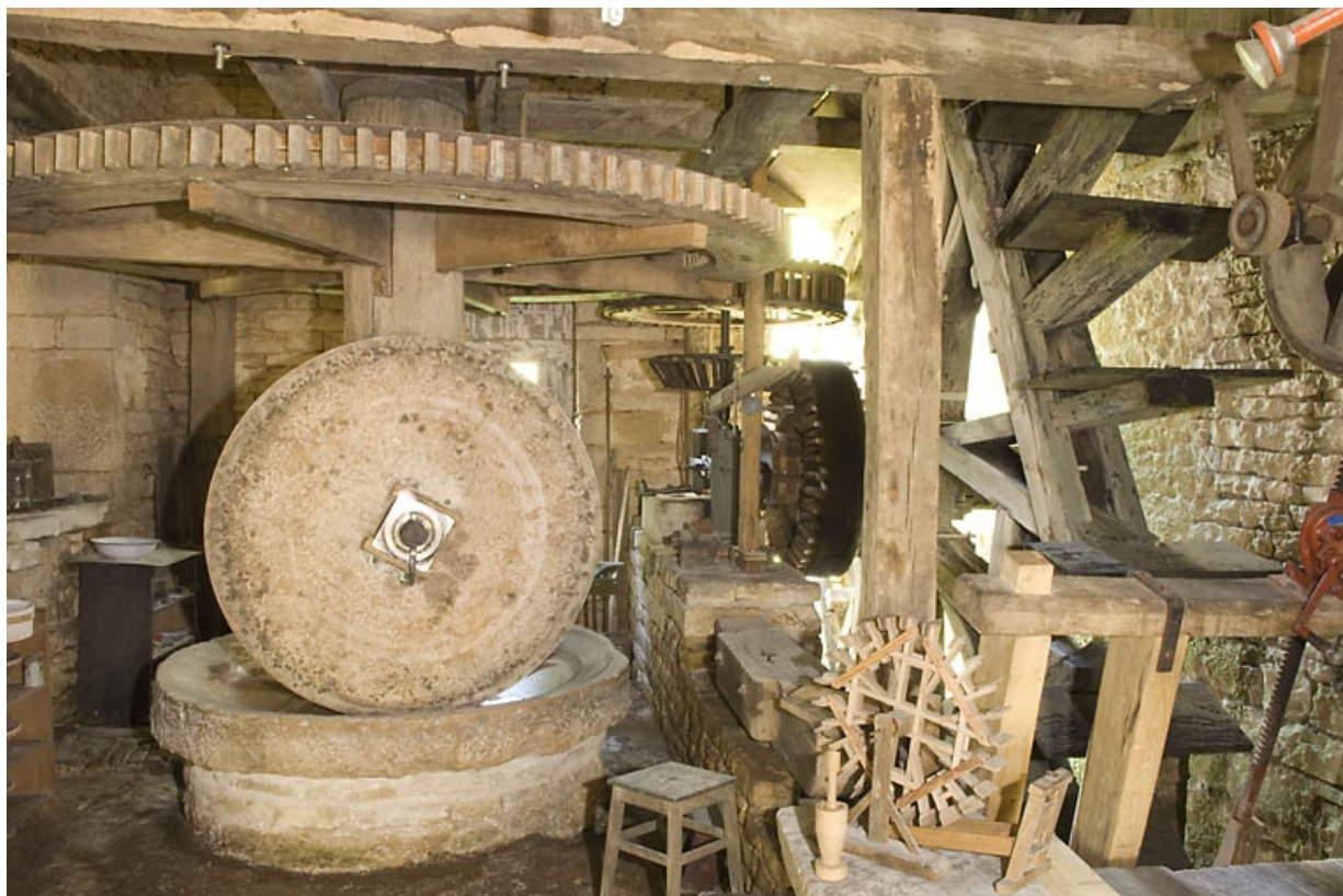
Intérieur de l'atelier de fabrication.