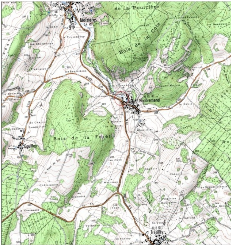
Carte de localisation. Carte topographique au 1:25000, I.G.N., Rioz, 3322 E. SCAN 25, Licence n°2008CISE29-68. 70, Fondremand, lieudit : le Moulin