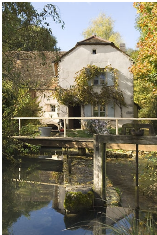
Vue d'ensemble depuis l'est, avec le bief d'amenée.