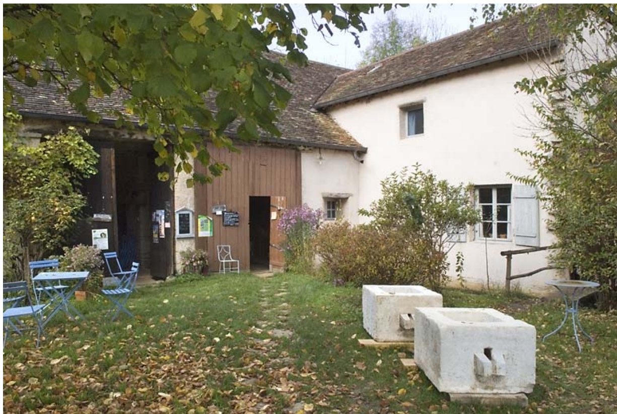
Façade est du moulin et logement.