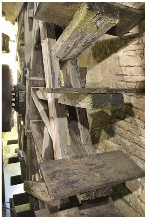
Détail de la roue hydraulique.