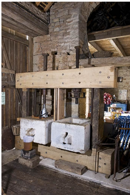
Couple de pressoirs installé début 2010.