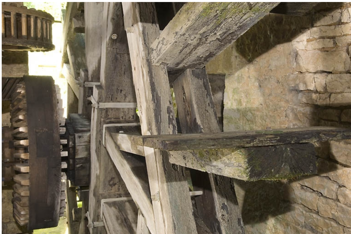
Détail des palettes de la roue.