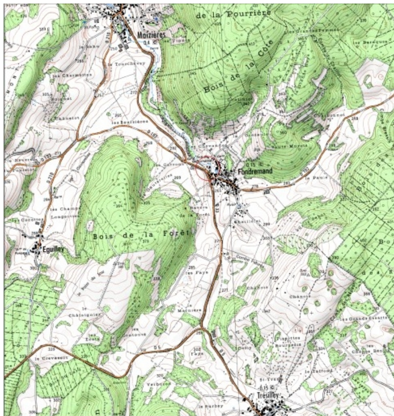
Carte de localisation. Carte topographique au 1:25000, I.G.N., Rioz, 3322 E. SCAN 25 © IGN - 2008, Licence n°2008CISE29-68. 70, Fondremand, lieudit : le Moulin