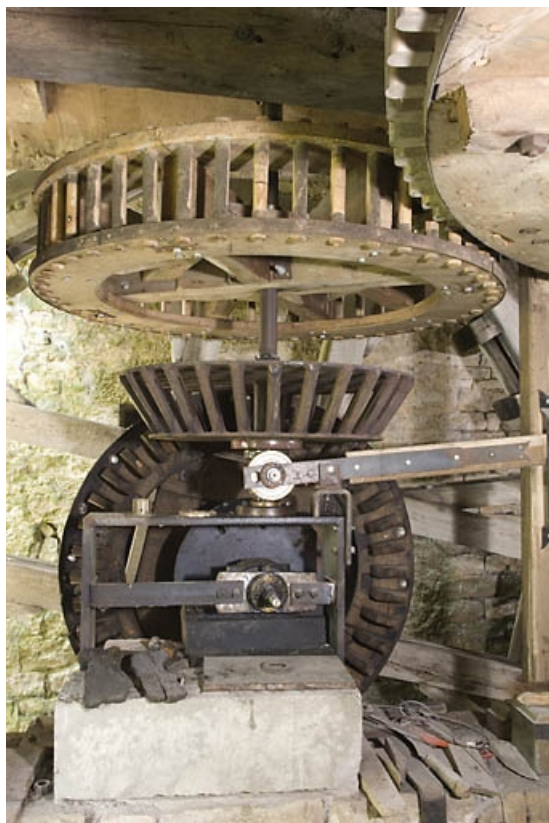
Détail des éléments de transmission (roues dentées et lanternes). 70, Fondremand, lieudit : le Moulin