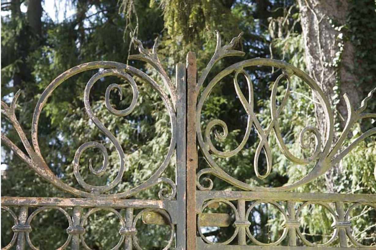
Monogramme de la grille d'entrée.