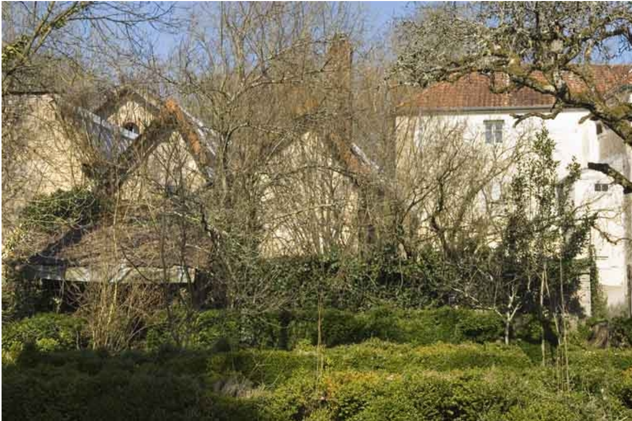
Atelier de fabrication et logement depuis l'ouest.