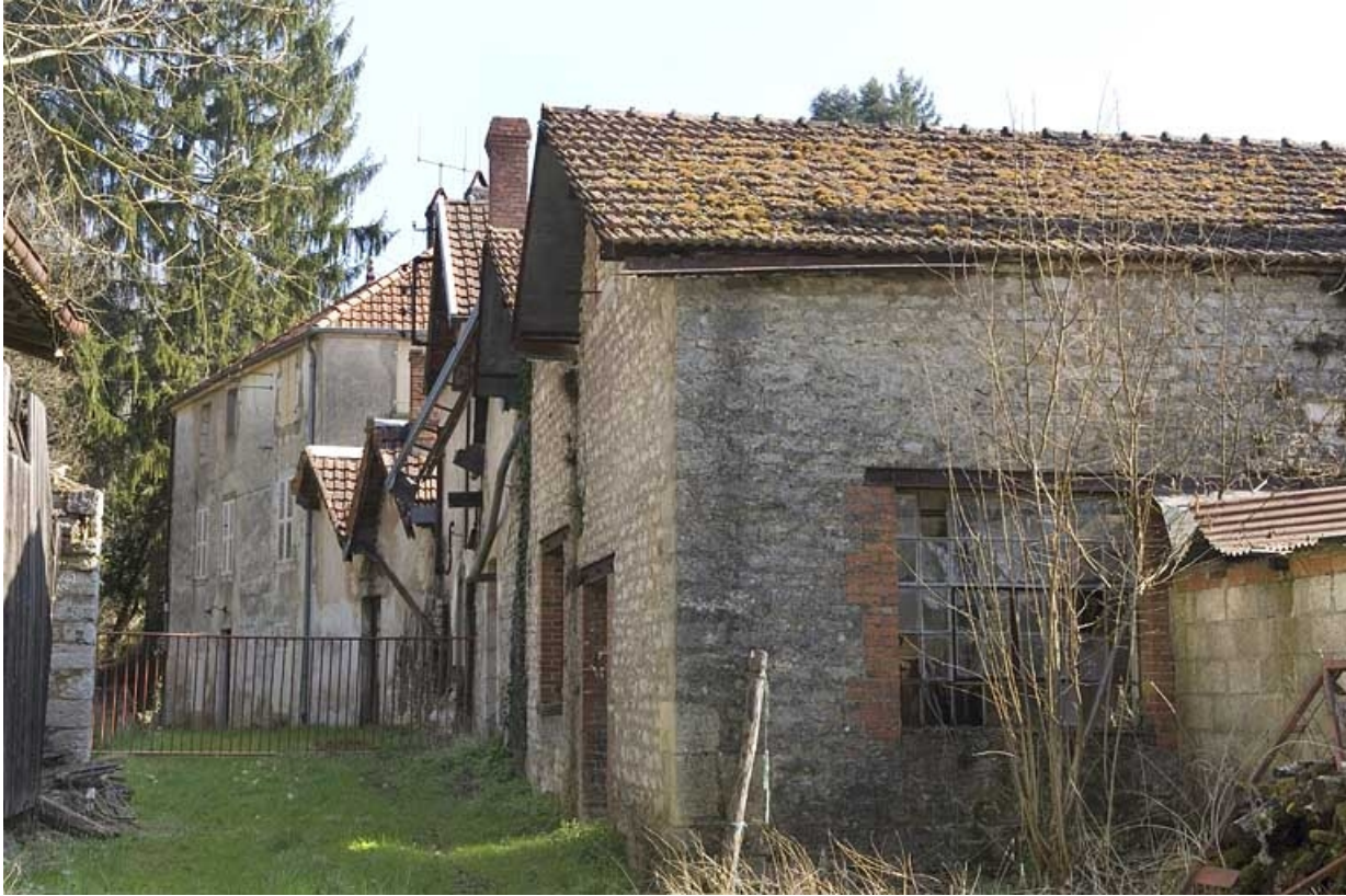
Logement et ateliers de fabrication depuis le sud-ouest.