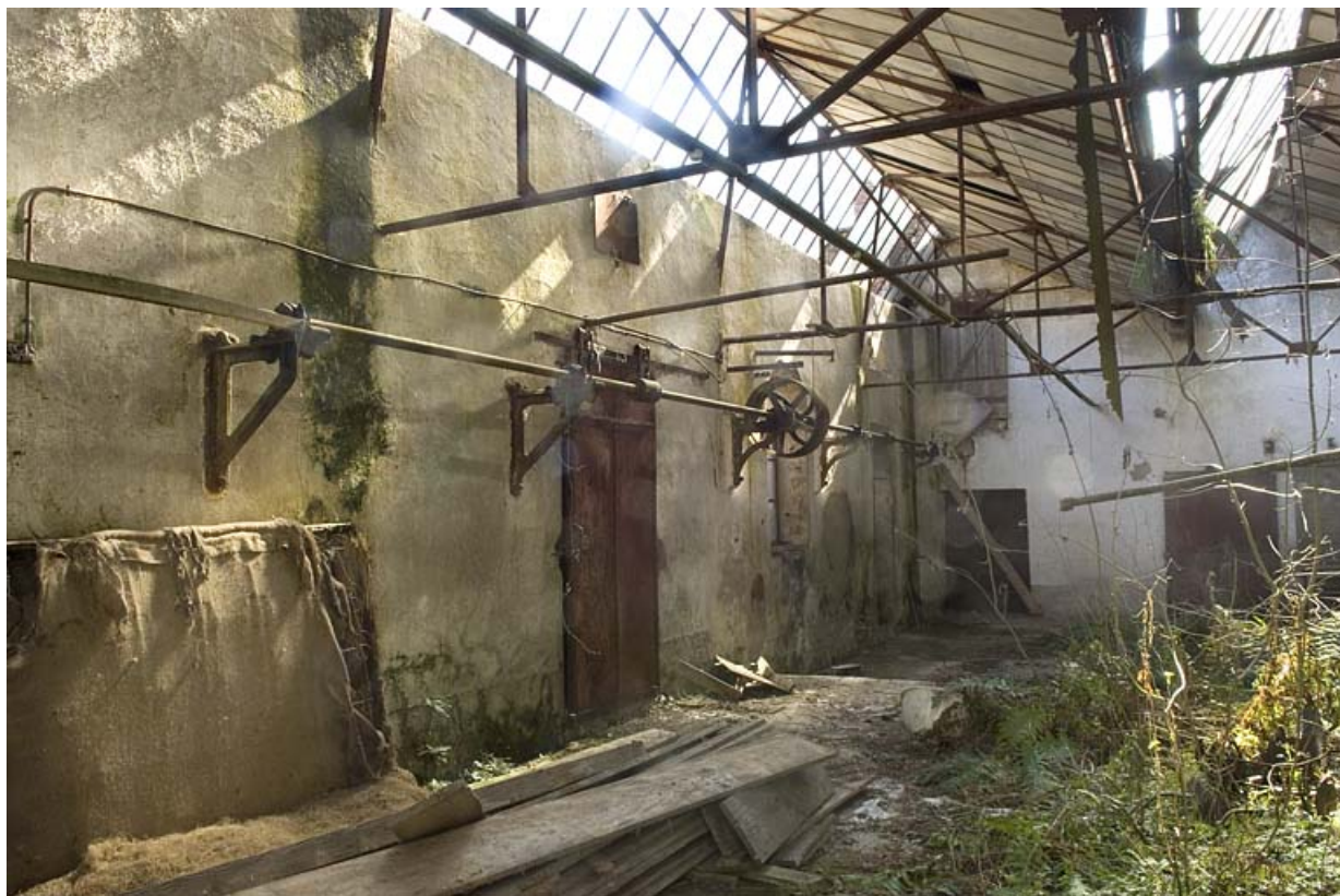
Atelier de fabrication. Charpente métallique et éléments de transmission. 70, Autet, lieudit : la Charme