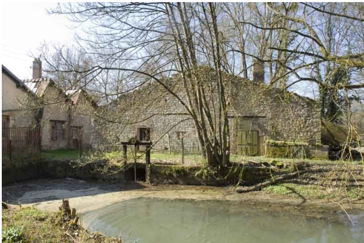
Bief d'aménée et pignon de l'entrepôt industriel (?).