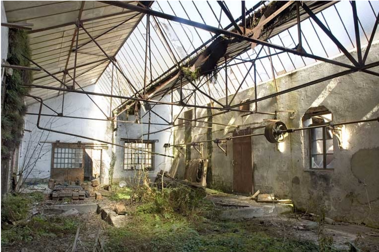
Intérieur d'un atelier de fabrication.