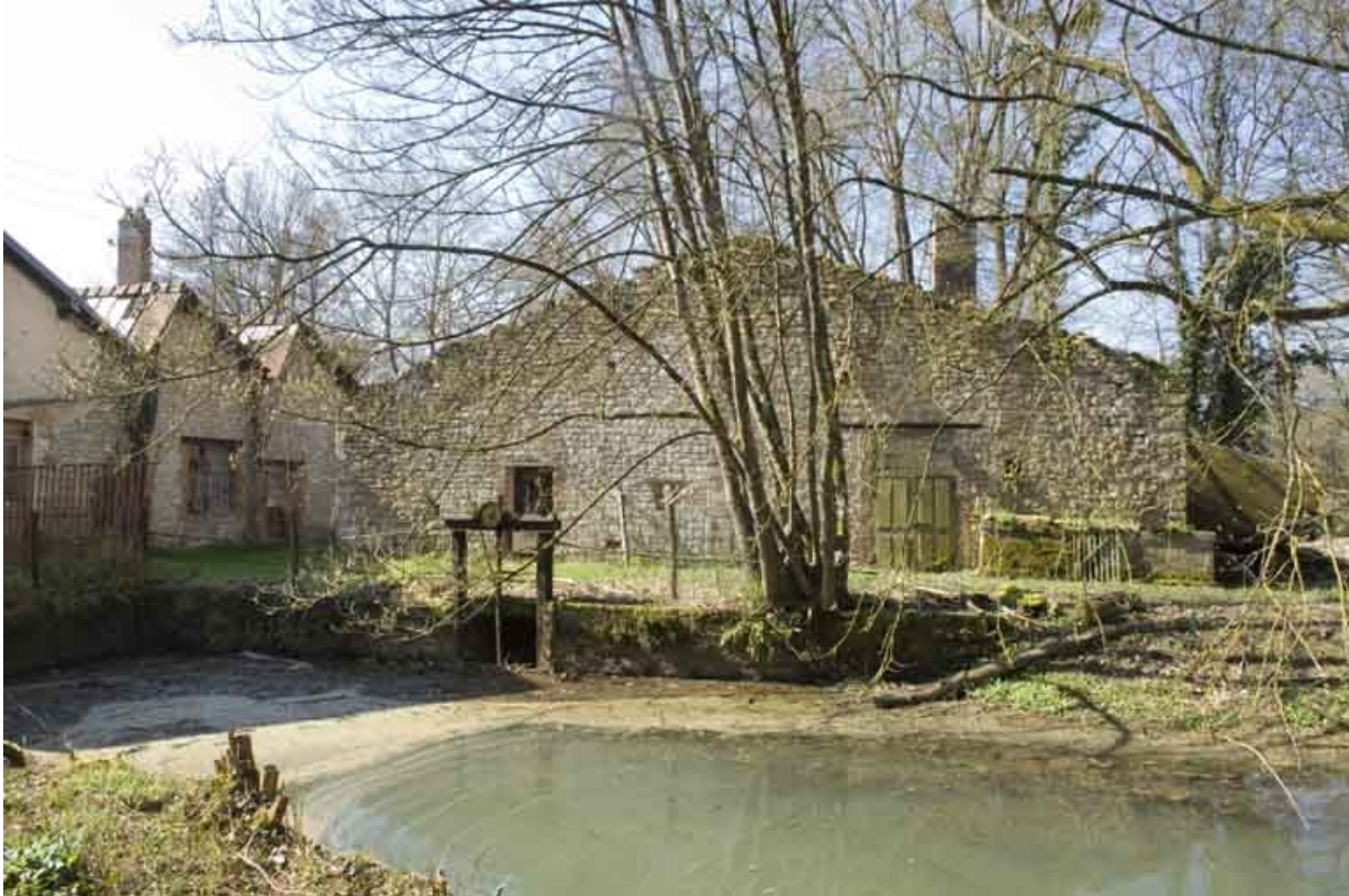
Bief d'amenée et pignon de l'entrepôt industriel (?).