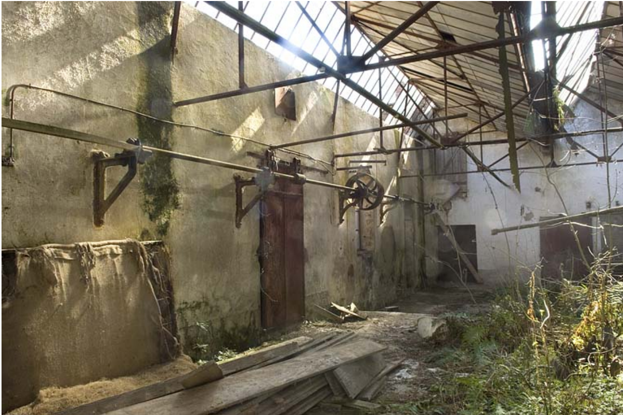
Atelier de fabrication. Charpente métallique et éléments de transmission. 70, Autet, lieudit : la Charme