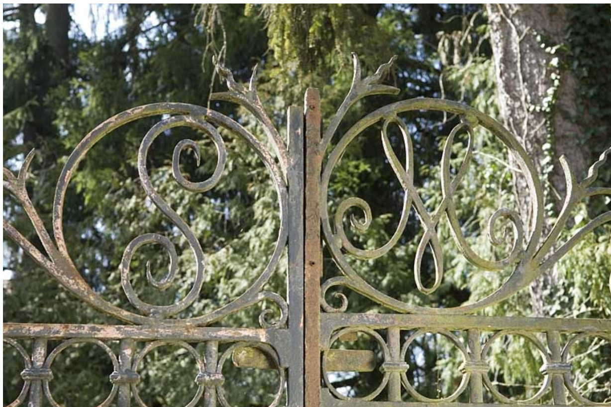
Monogramme de la grille d'entrée.