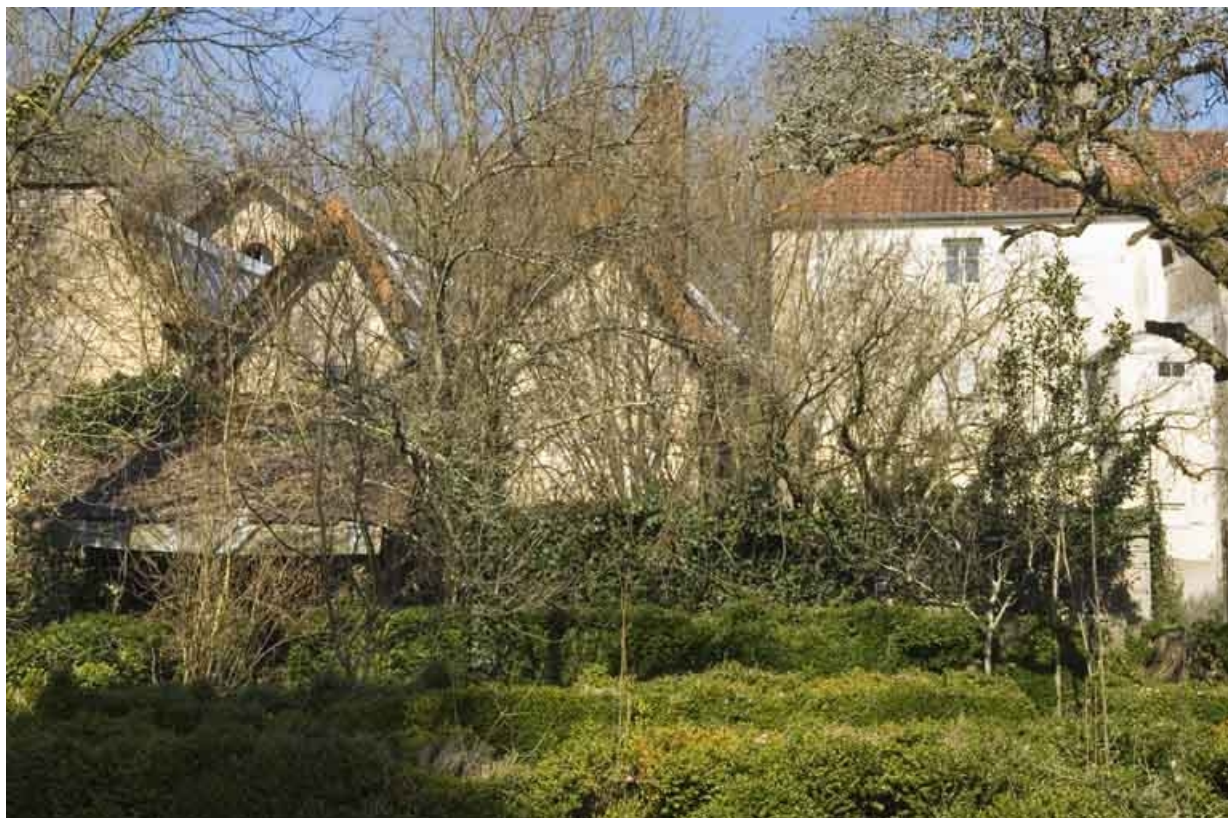
Atelier de fabrication et logement depuis l'ouest.