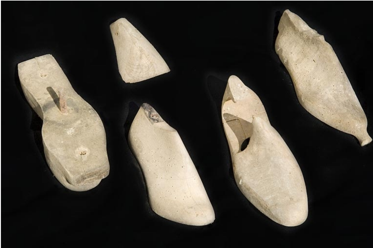
Formes pour chaussures.