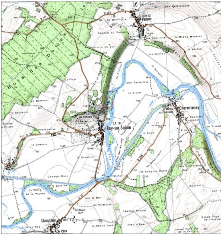
Carte de localisation. Carte topographique au 1:25000, I.G.N., Dampierre-sur-Salon, 3221 E. SCAN 25 © IGN - 2008, Licence n°2008CISE29-68.