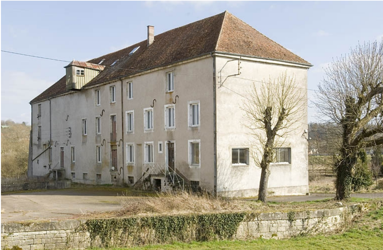
Façade nord vue de trois quarts.

70, Soing-Cubry-Charentenay R.D. 23, lieudit : le Moulin