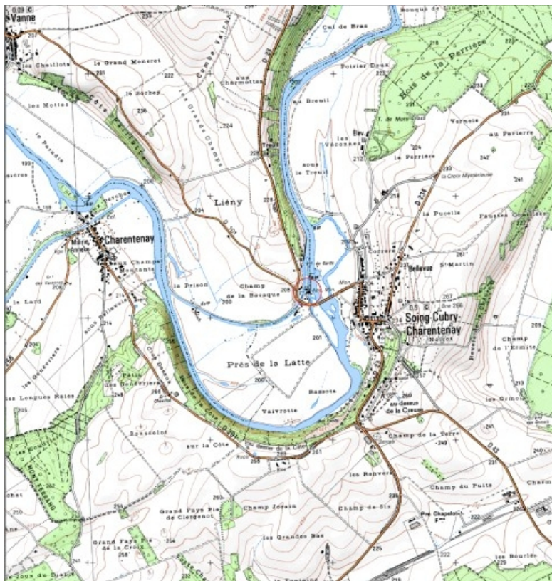
Carte de localisation. Carte topographique au 1:25000, I.G.N., Fresne-Saint-Mamès, 3321 O. SCAN 25 © IGN - 2008, Licence n°2008CISE29-68.

70, Soing-Cubry-Charentenay R.D. 23, lieudit : le Moulin