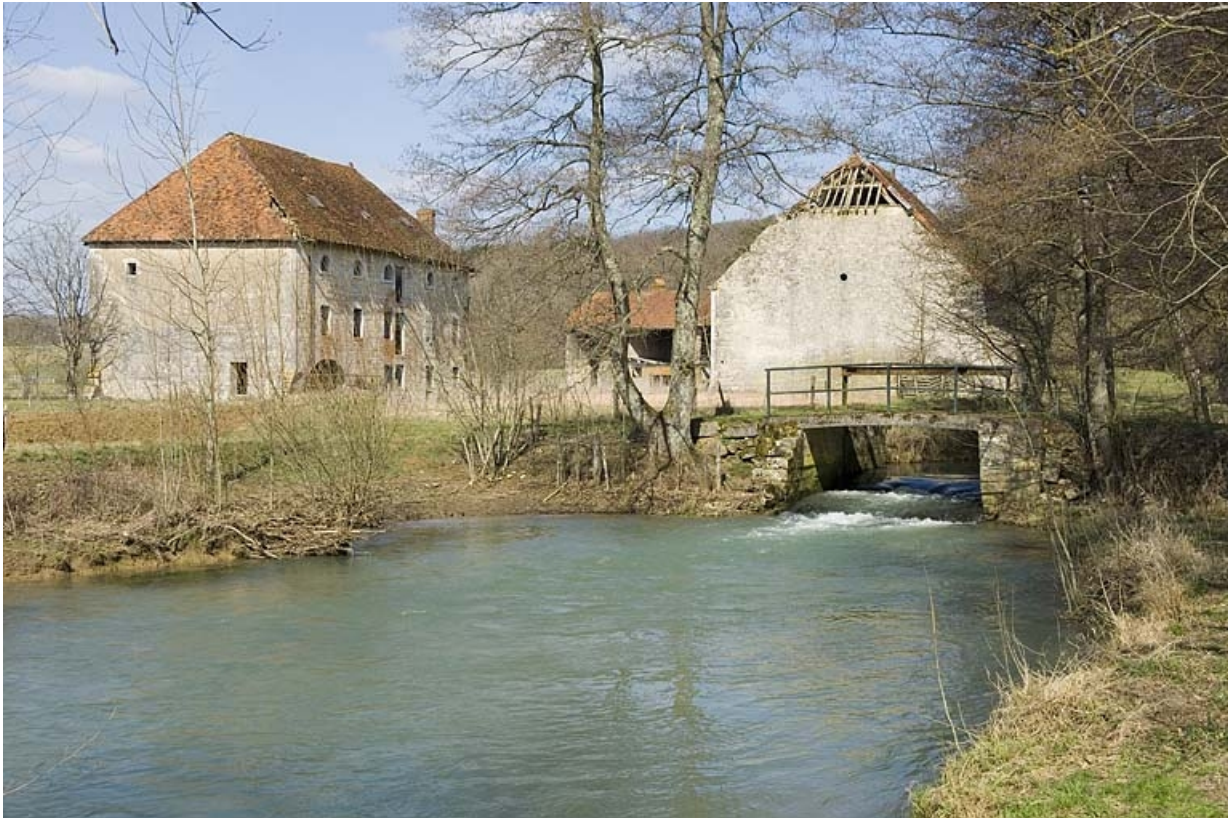
Vue d'ensemble depuis le sud.