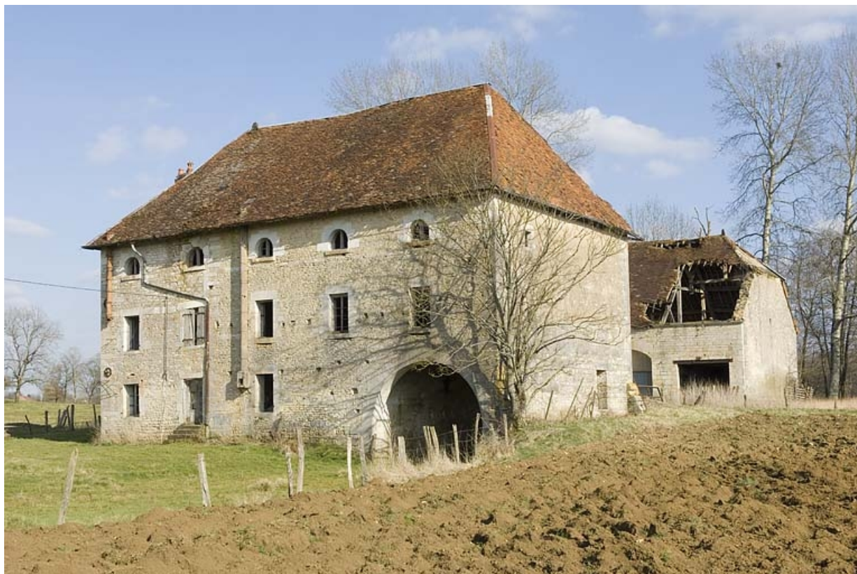
Vue depuis l'ouest.