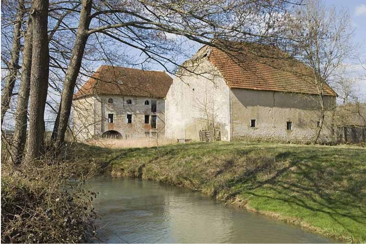
Vue d'ensemble depuis le sud-est.