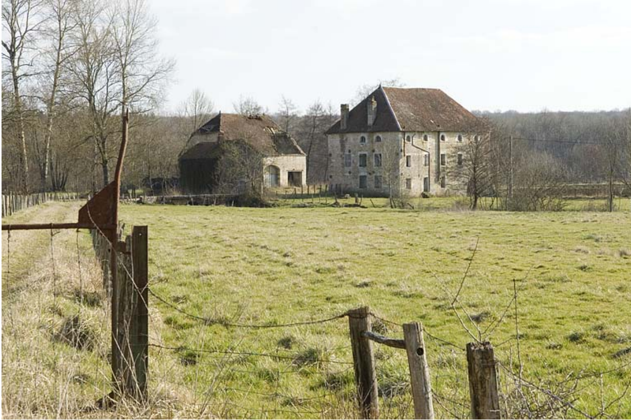
Vue d'ensemble depuis le nord-ouest.