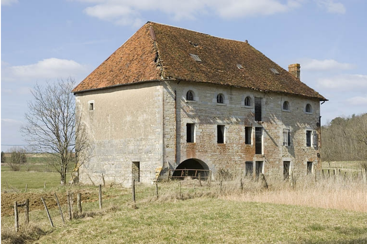
Vue depuis le sud.