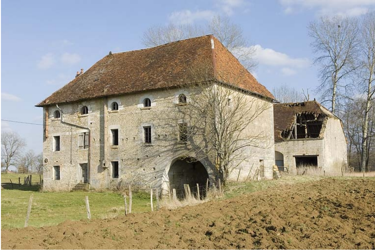
Vue depuis l'ouest.