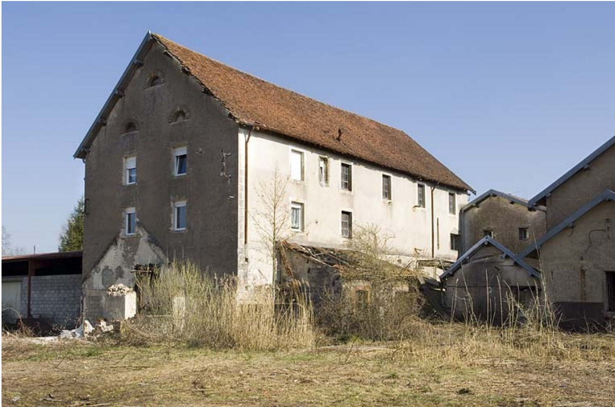
Atelier de fabrication vu de trois quarts arrière.

70, Vellexon-Queutrey-et-Vaudey R.D. 13, lieudit : Queutrey