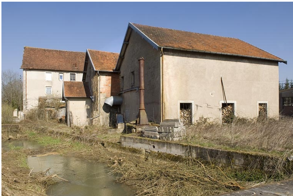
Ateliers de fabrication et chaufferie depuis le sud.

70, Vellexon-Queutrey-et-Vaudey R.D. 13, lieudit : Queutrey