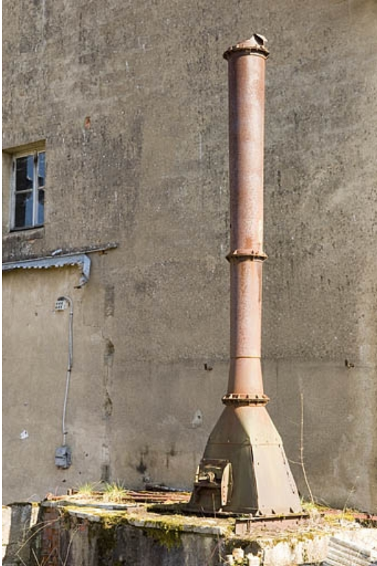
Vestige de la cheminée métallique.

70, Vellexon-Queutrey-et-Vaudey R.D. 13, lieudit : Queutrey