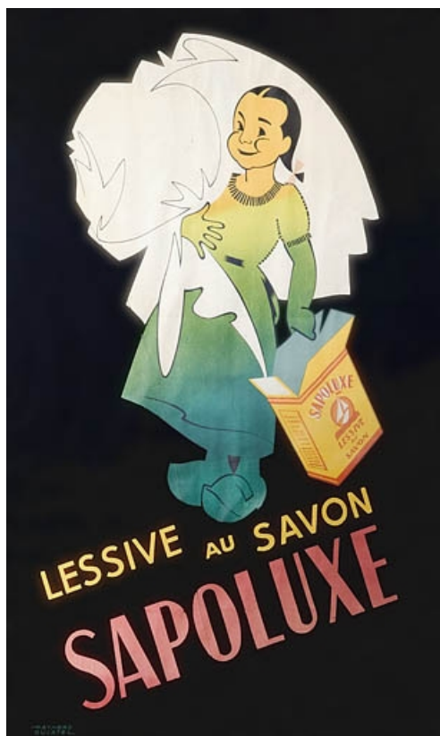
Lessive au savon Sapoluxe.

70, Vellexon-Queutrey-et-Vaudey R.D. 13, lieudit : Queutrey