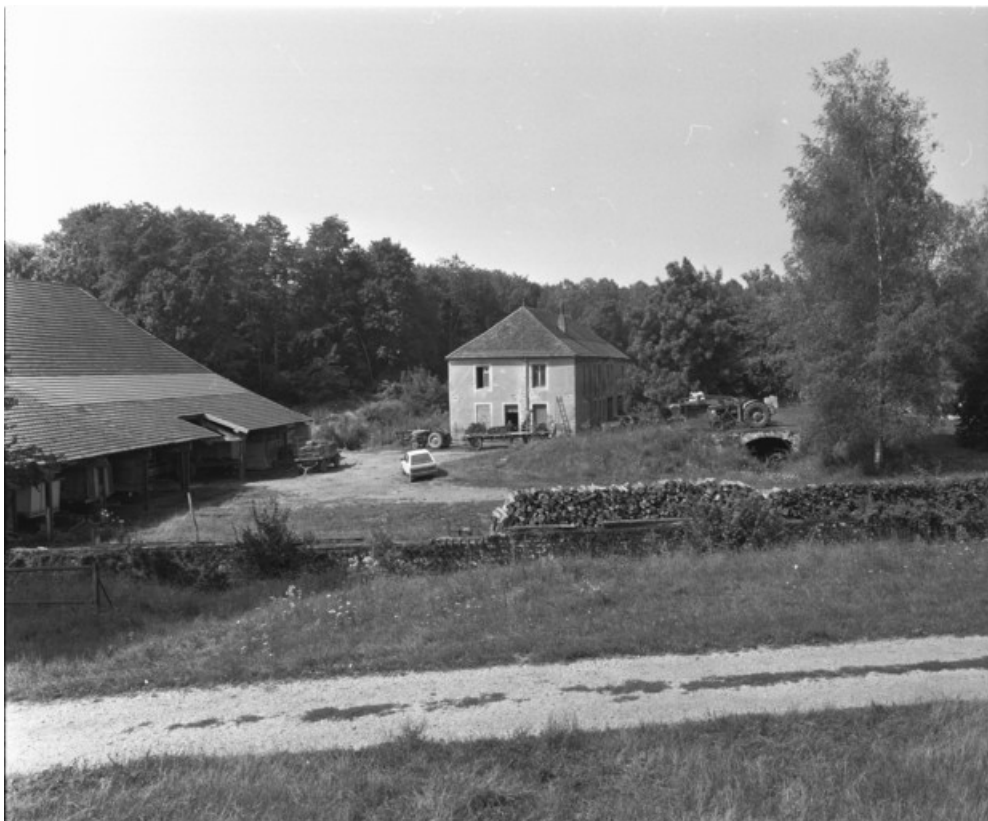
La halle à charbon et un logement ouvrier en 1989.

70, Le Pont-de-Planches, lieudit : la Romaine