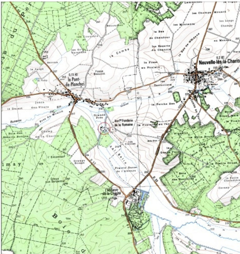
Carte de localisation. Carte topographique au 1:25000, I.G.N., Fresne-Saint-Mamès, 3321 O. SCAN 25 © IGN - 2008, Licence n°2008CISE29-68.

70, Le Pont-de-Planches, lieu-dit : la Romaine