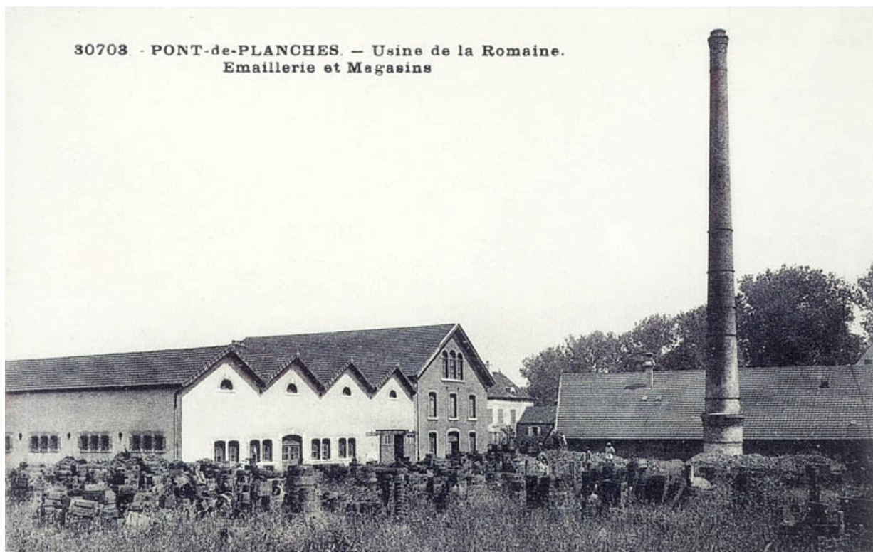
Pont-de-Planches. - Usine de la Romaine. Emaillerie et Magasins.

70, Le Pont-de-Planches, lieudit : la Romaine