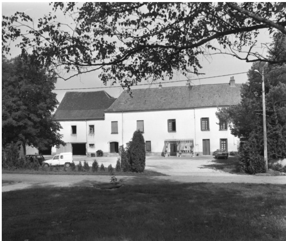
Façade sud du logement en 1989.

70, Le Pont-de-Planches, lieudit : la Romaine