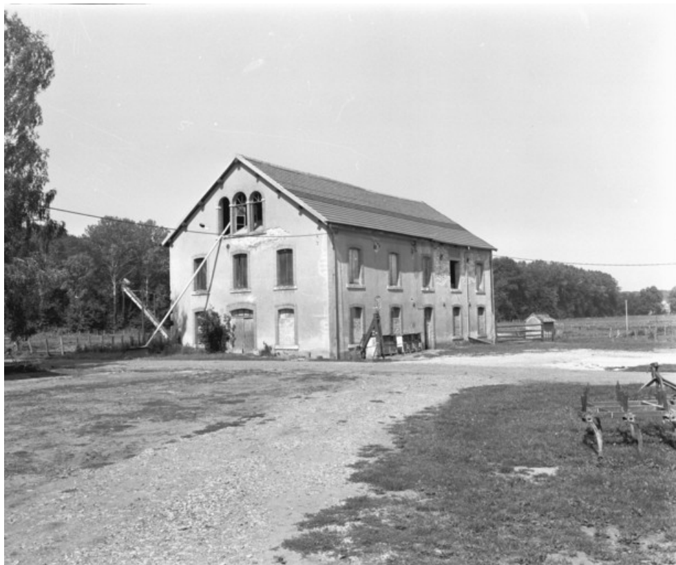
Atelier d'émaillage vu de trois quarts en 1989.

70, Le Pont-de-Planches, lieudit : la Romaine