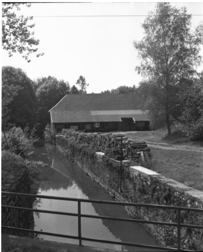
Le canal et la halle à charbon en 1989.

70, Le Pont-de-Planches, lieudit : la Romaine