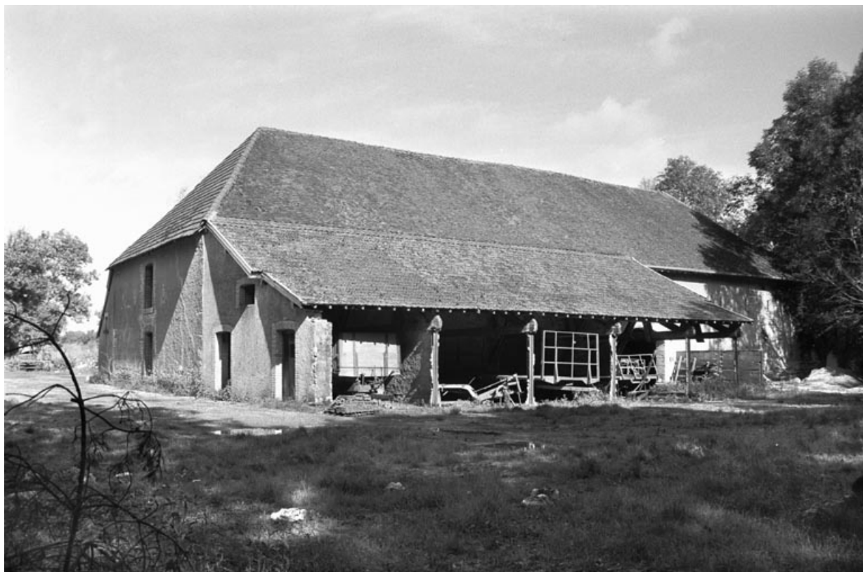
La halle à charbon vue de trois quarts arrière en 1987.

70, Le Pont-de-Planches, lieudit : la Romaine