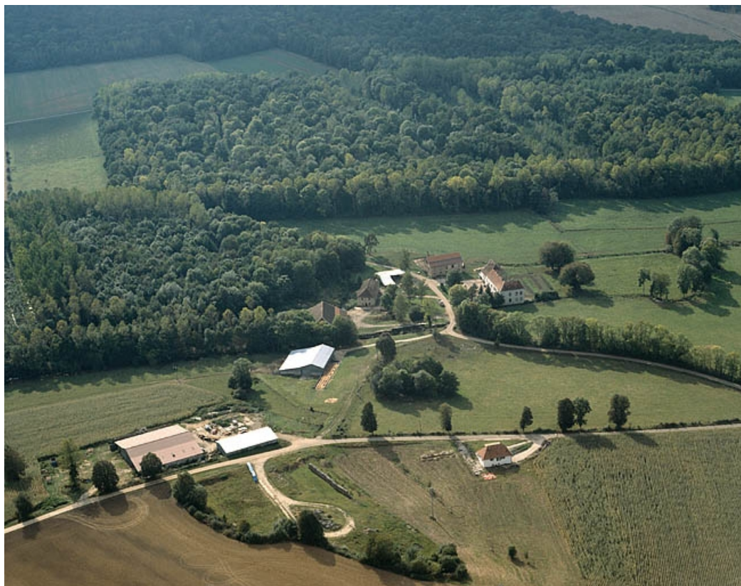
Vue aérienne depuis l'est en 1989.

70, Le Pont-de-Planches, lieudit : la Romaine