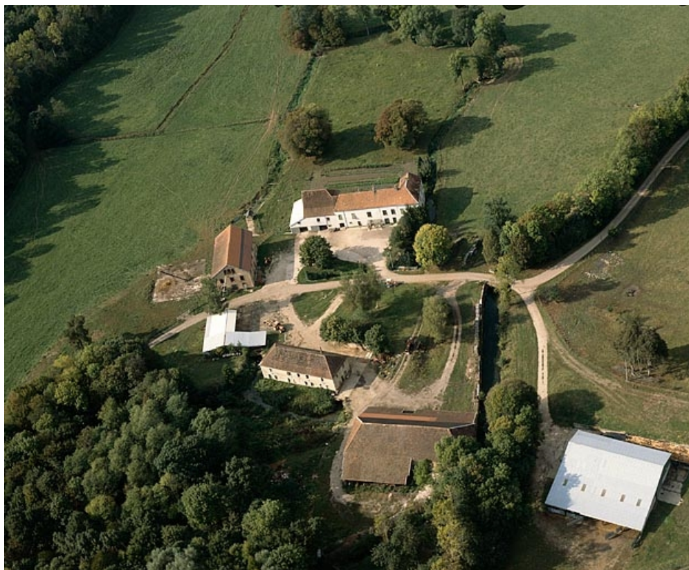
Vue aérienne plongeante depuis le sud-est en 1989.

70, Le Pont-de-Planches, lieudit : la Romaine