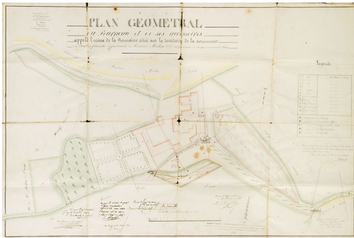
Plan géométral du fourneau et de ses accessoires appelé l'usine de la Romaine [...] appartenant à M. Melin [...]. 70, Le Pont-de-Planches, lieudit : la Romaine