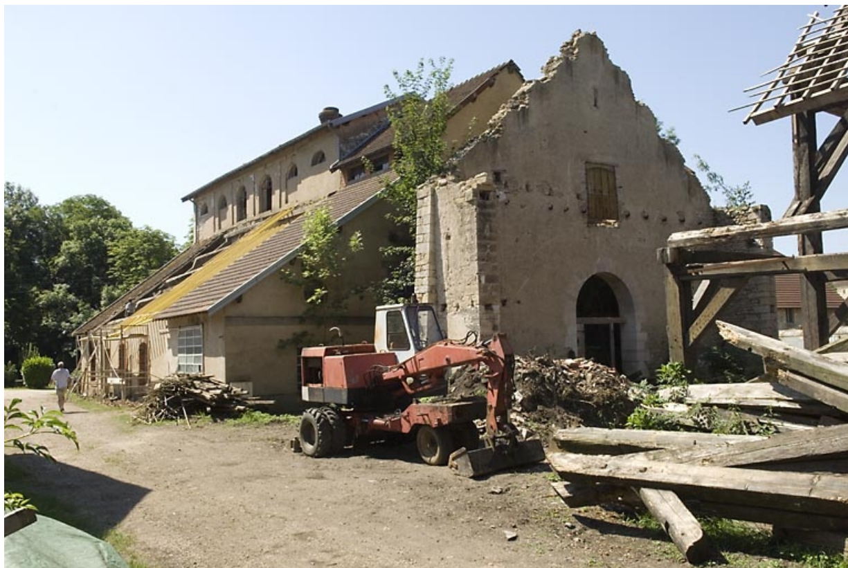
Le haut fourneau et la partie ruinée de la halle à charbon.

70, Beaujeu-Saint-Vallier-Pierrejux-et-Quitteur, lieudit : la Forge