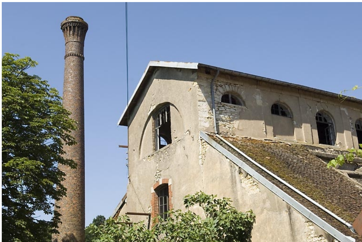
Cheminée et partie supérieure du haut fourneau.

70, Beaujeu-Saint-Vallier-Pierrejux-et-Quitteur, lieudit : la Forge