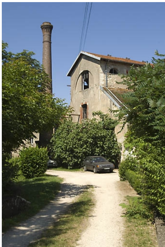
Vue du haut fourneau depuis l'entrée.

70, Beaujeu-Saint-Vallier-Pierrejux-et-Quitteur, lieudit : la Forge