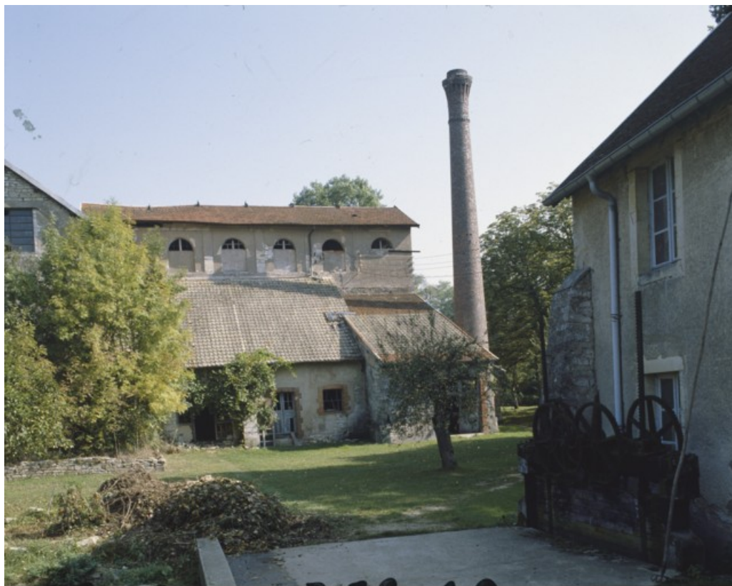
Façade ouest du haut fourneau depuis le moulin en 1989. 70, Beaujeu-Saint-Vallier-Pierrejux-et-Quitteur, lieudit : la Forge