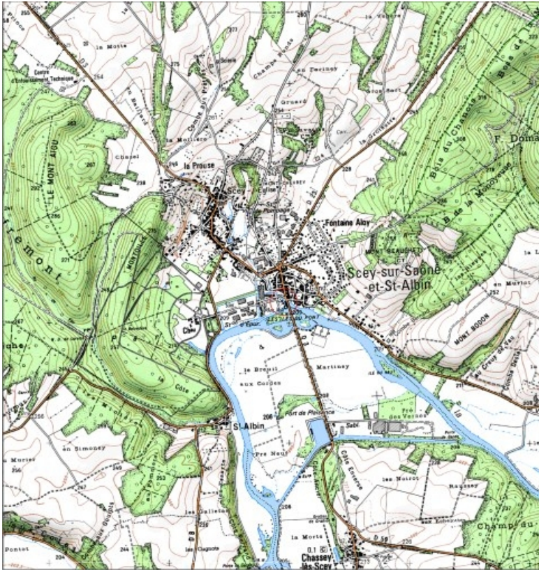
Carte de localisation. Carte topographique au 1:25000, I.G.N., Port-sur-Saône, 3321 E. SCAN 25 © IGN - 2008, Licence n°2008CISE29-68.

70, Scey-sur-Saône-et-Saint-Albin, 50 rue Armand Paulmard