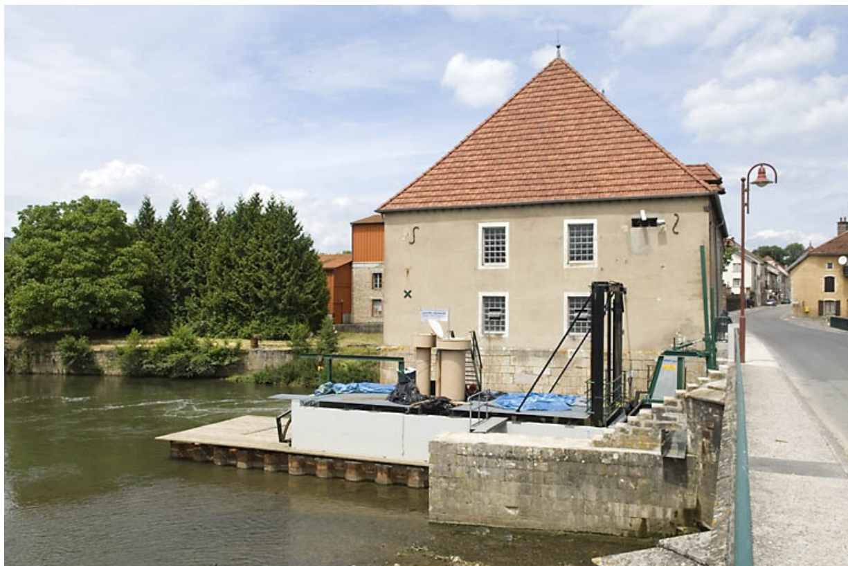
Groupe-bulbe de la centrale hydroélectrique et façade sud du moulin.

70, Scey-sur-Saône-et-Saint-Albin, 50 rue Armand Paulmard