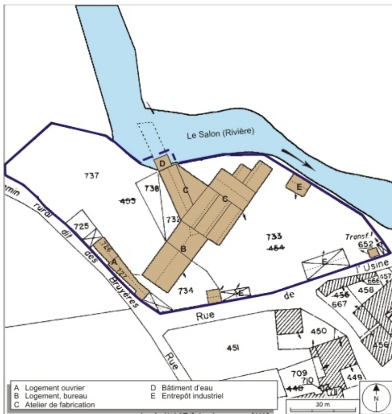
Plan-masse et de situation. Extrait du plan cadastral numérisé, 2008, section C, 1:1250 agrandi à 1:1000.

70, Champlitte rue de l' Usine, lieudit : Nouvelle-lès-Champlitte