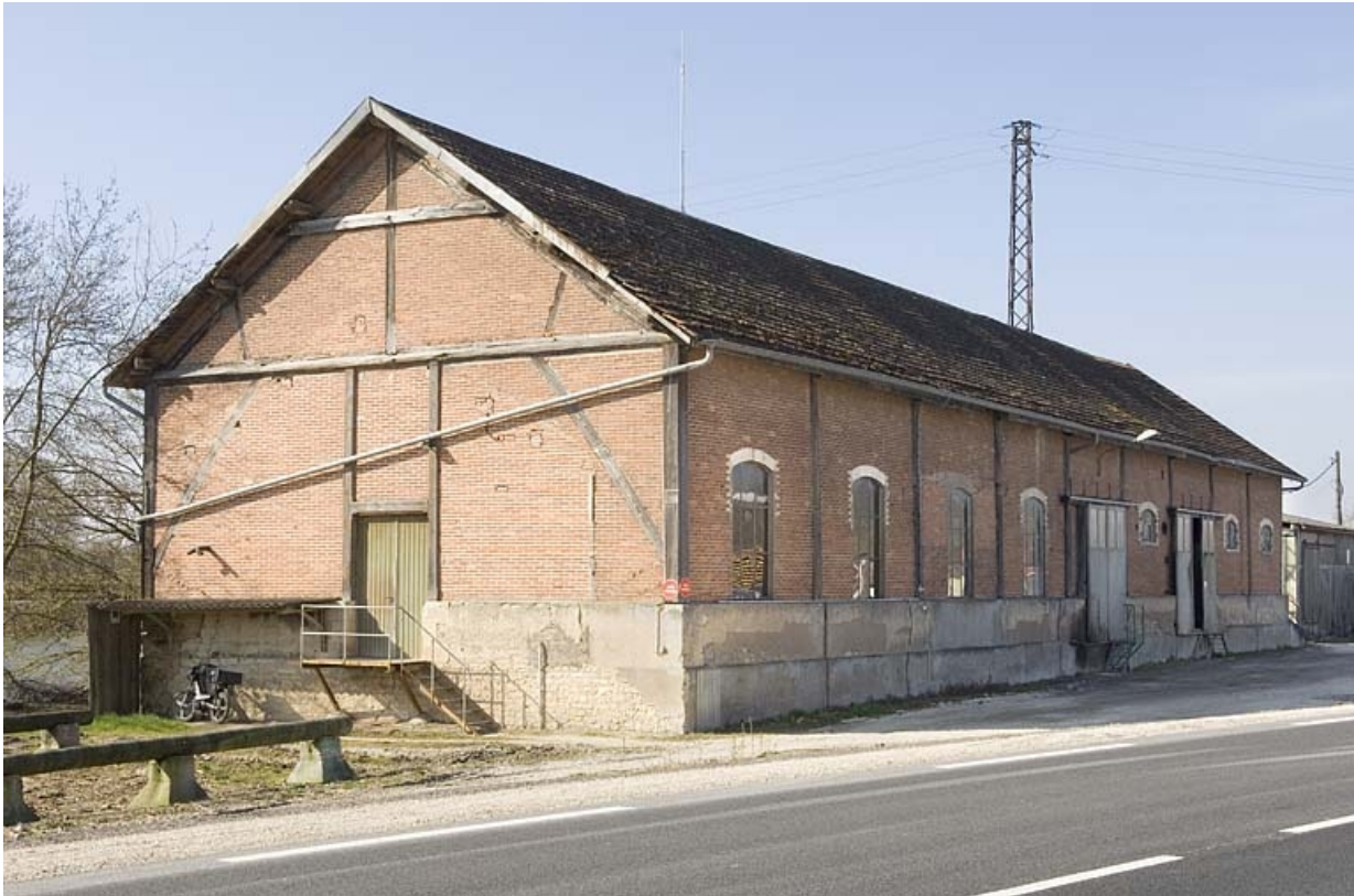
Magasin industriel depuis le nord-est.