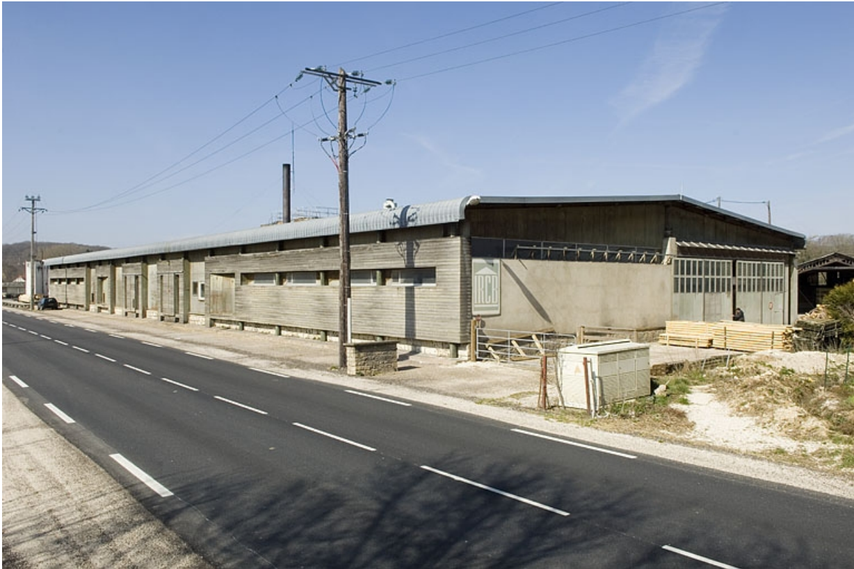
Vue d'ensemble depuis l'est.