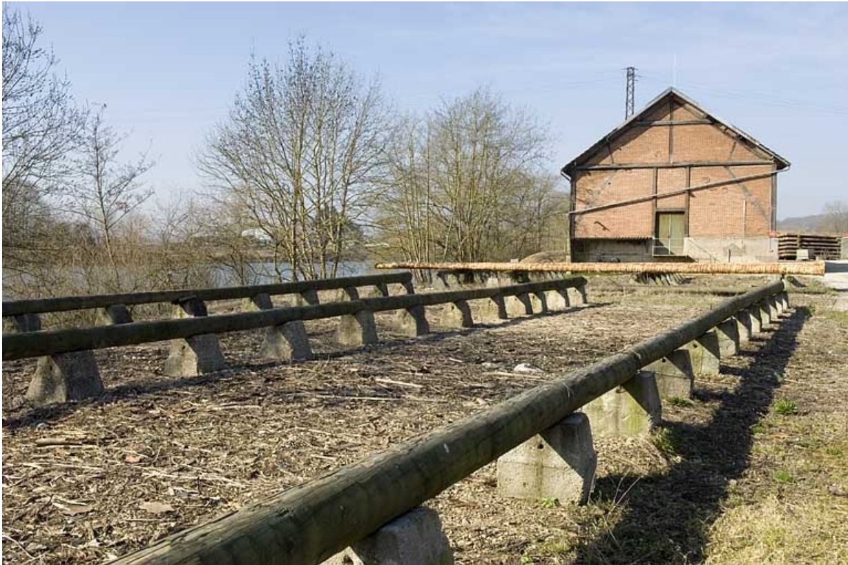
Aire de stockage et magasin industriel.