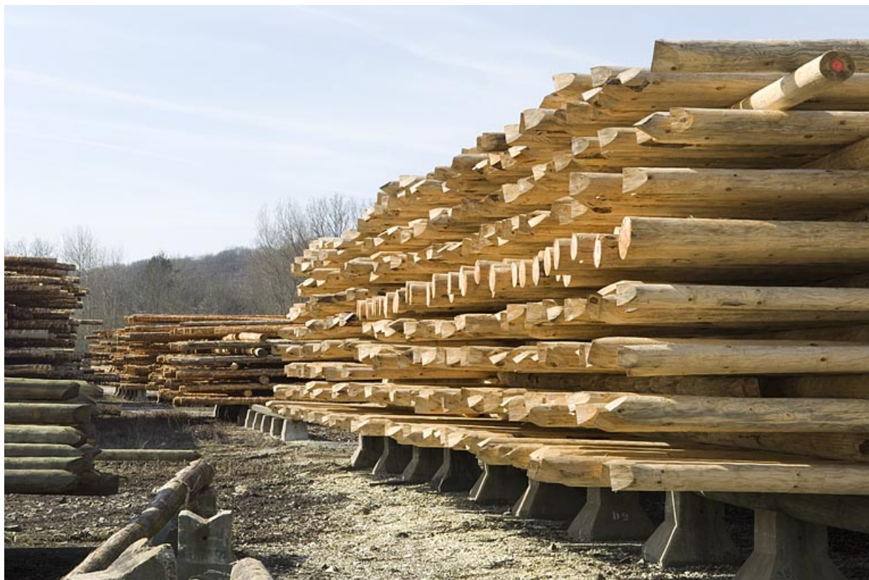
Aire de stockage des poteaux en cours de fabrication.