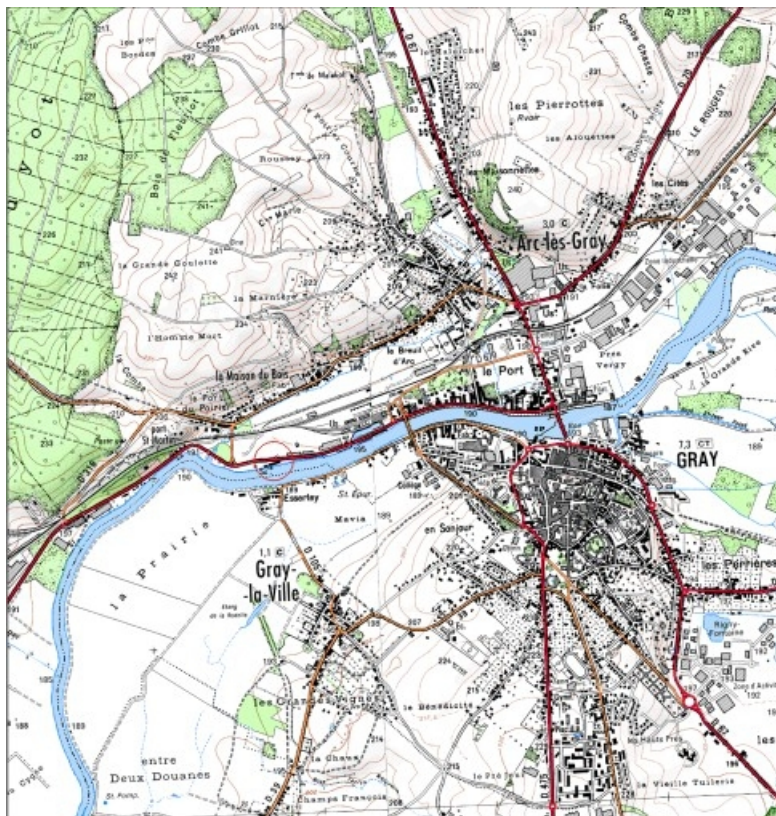
Carte de localisation. Carte topographique au 1:25000, I.G.N., Gray, 3222 O. SCAN 25, Licence n°2008CISE29-68. 70, Arc-lès-Gray R.D. 70