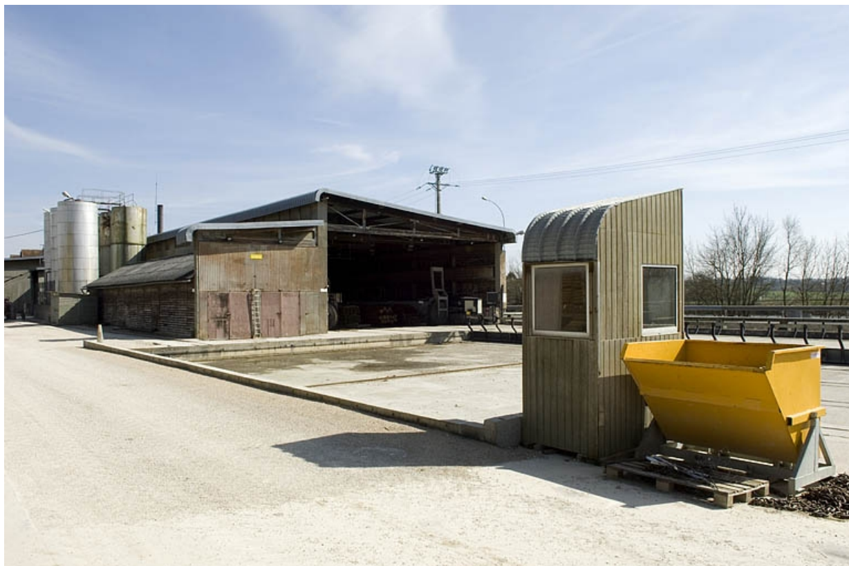
Atelier de fabrication depuis le nord-ouest. 70, Arc-lès-Gray R.D. 70