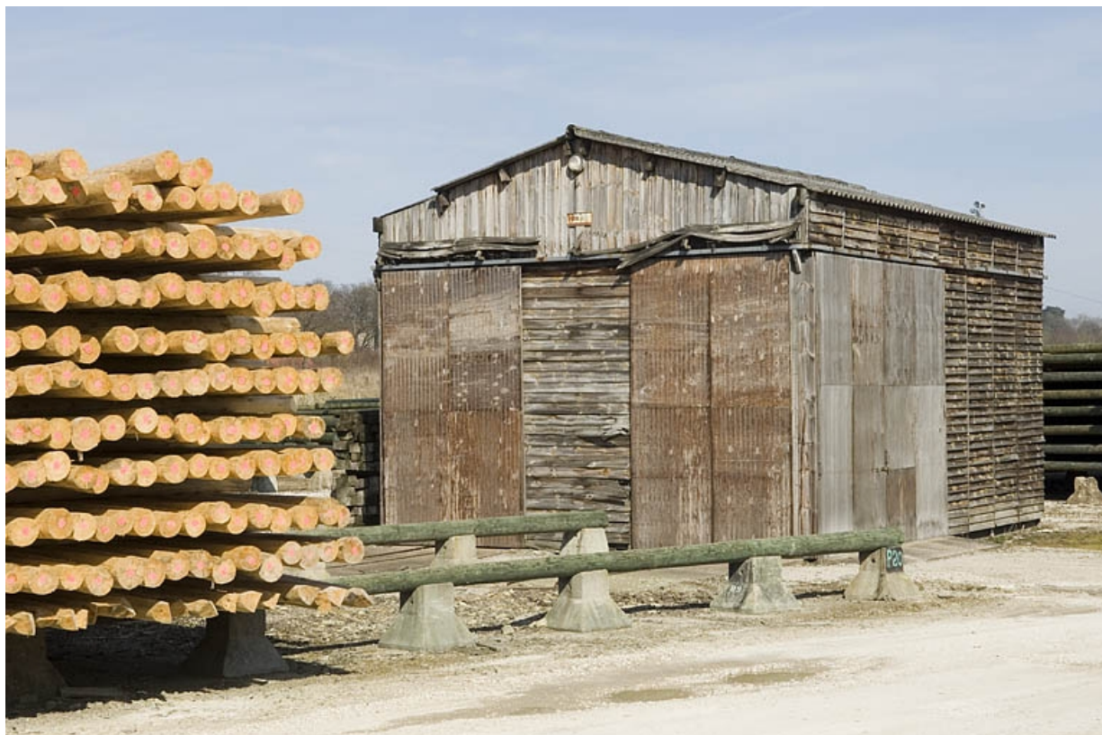
Chantier de bois et bâtiment industriel.