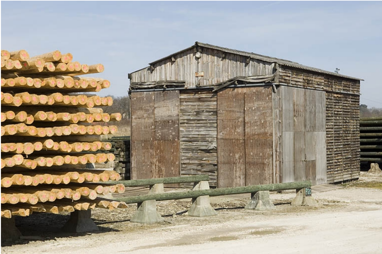
Chantier de bois et bâtiment industriel.