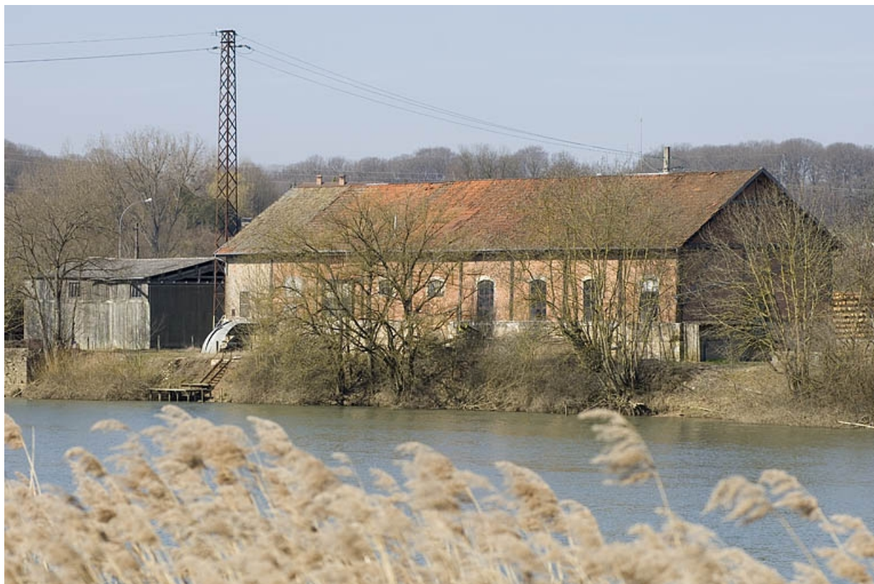
Magasin industriel depuis la rive gauche de la Saône. 70, Arc-lès-Gray R.D. 70