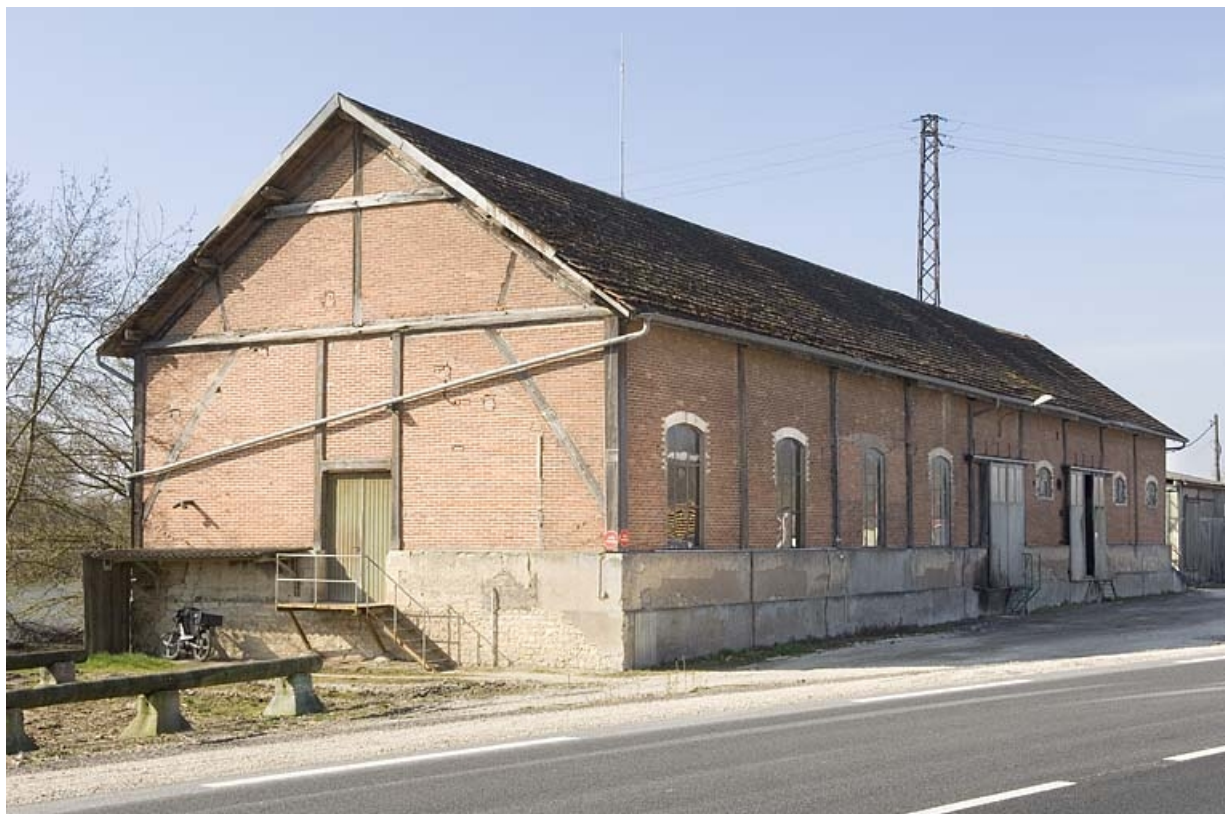
Magasin industriel depuis le nord-est.