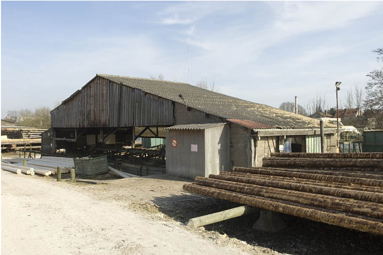
Atelier d'écorçage et de perçage.