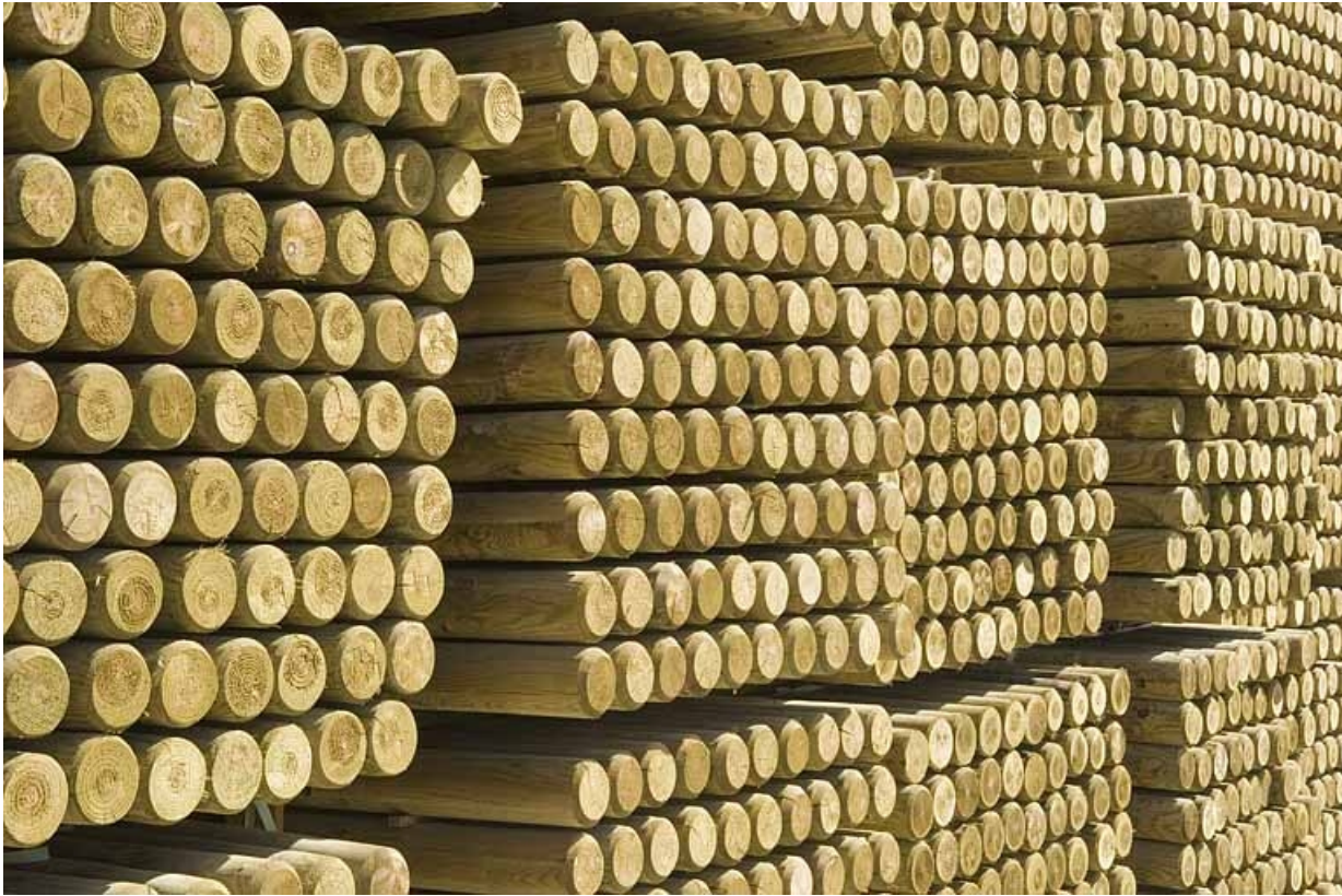
Empilements de piquets en bois.