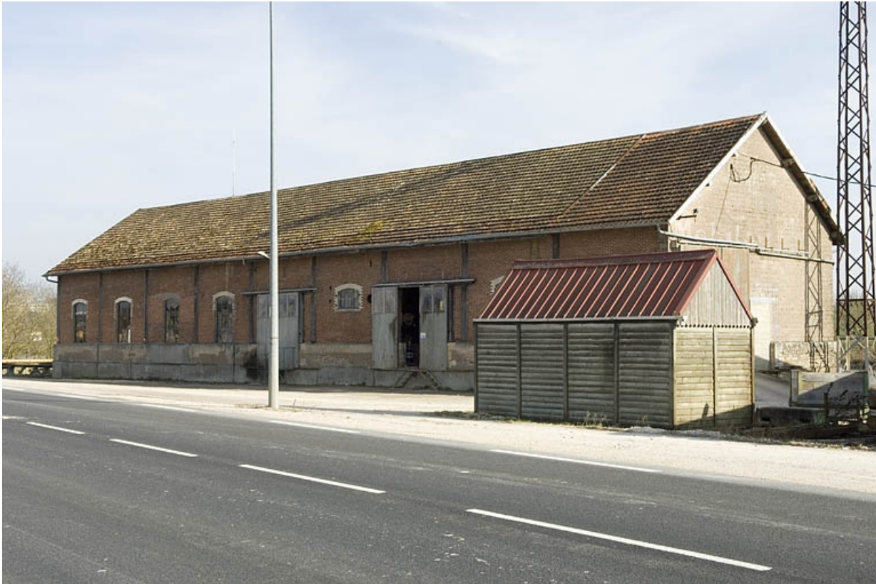
Magasin industriel depuis le nord-ouest.