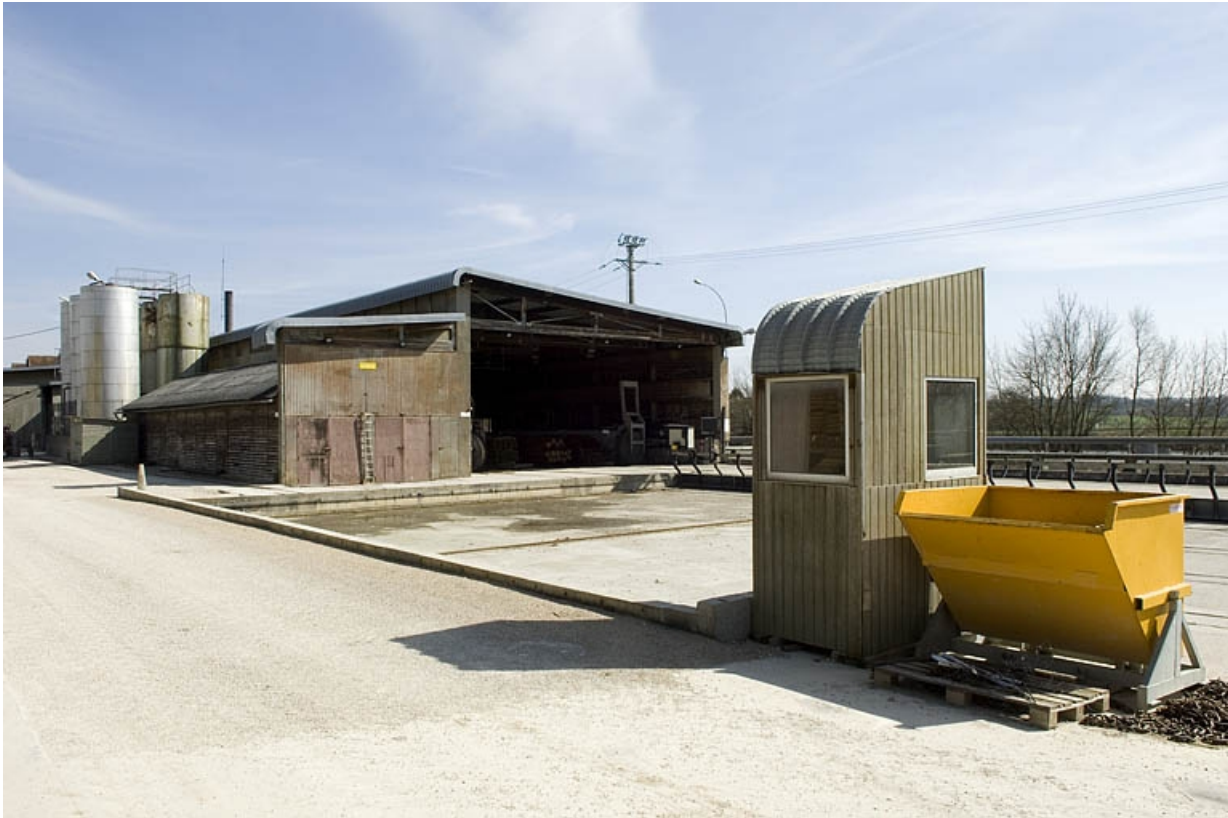
Atelier de fabrication depuis le nord-ouest. 70, Arc-lès-Gray R.D. 70