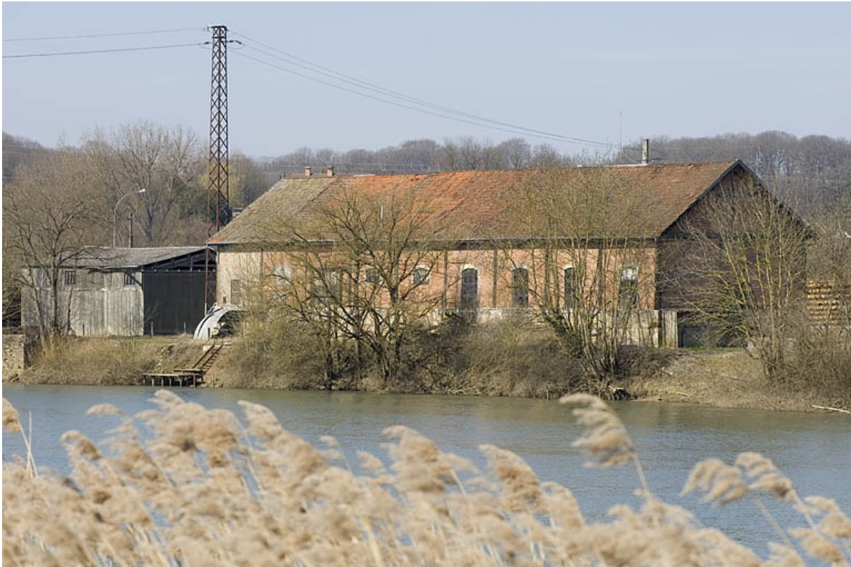
Magasin industriel depuis la rive gauche de la Saône.