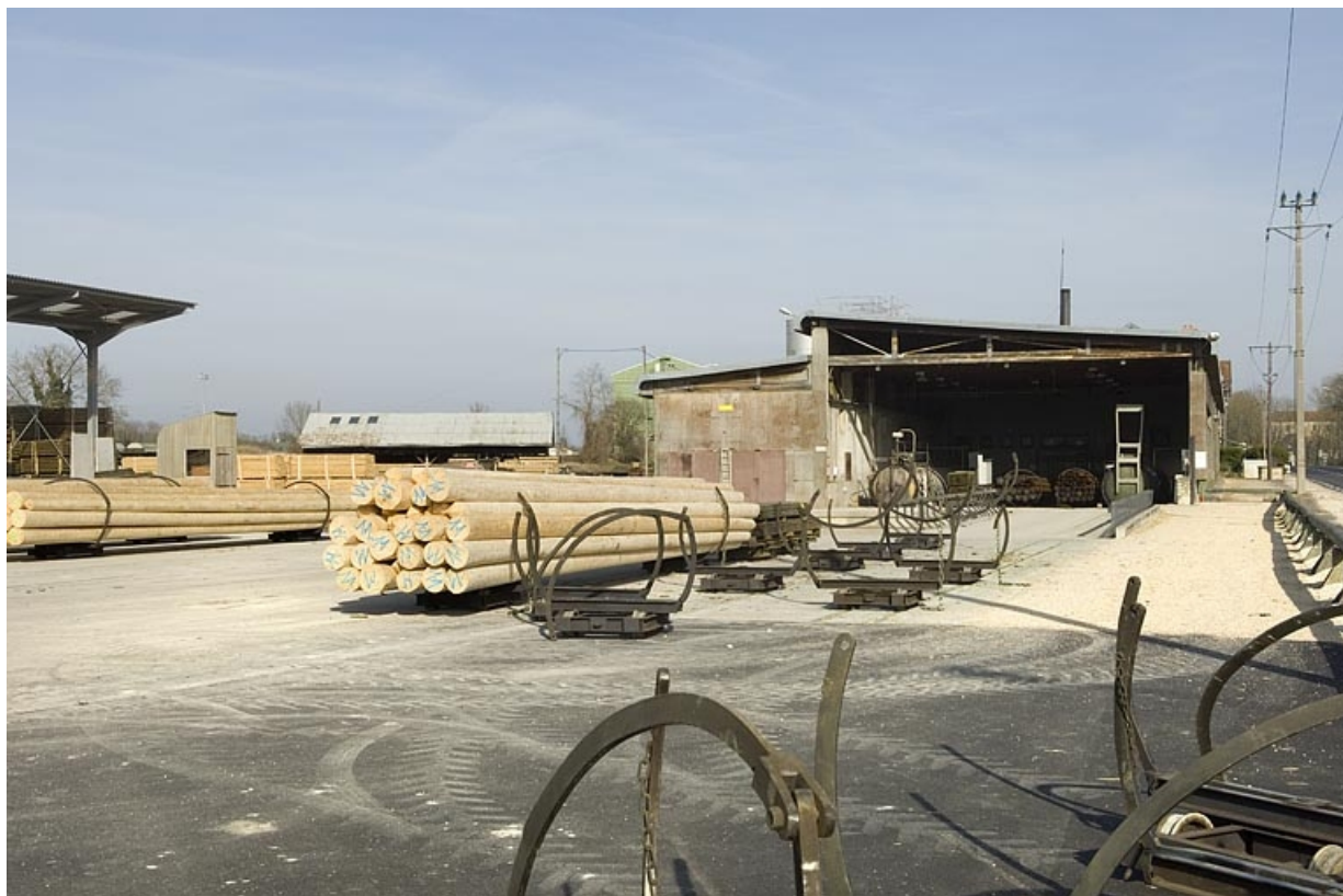
Atelier de fabrication depuis l'ouest.