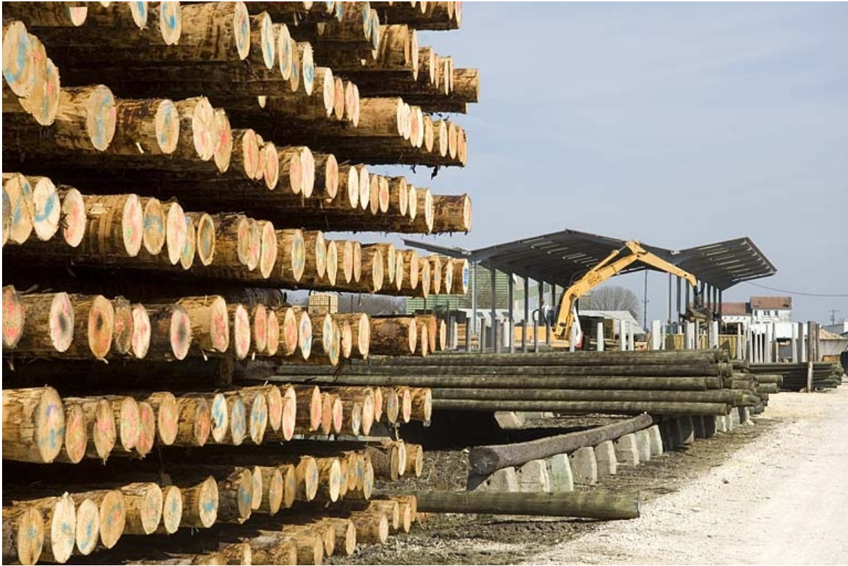
Chantier de bois et magasin industriel.