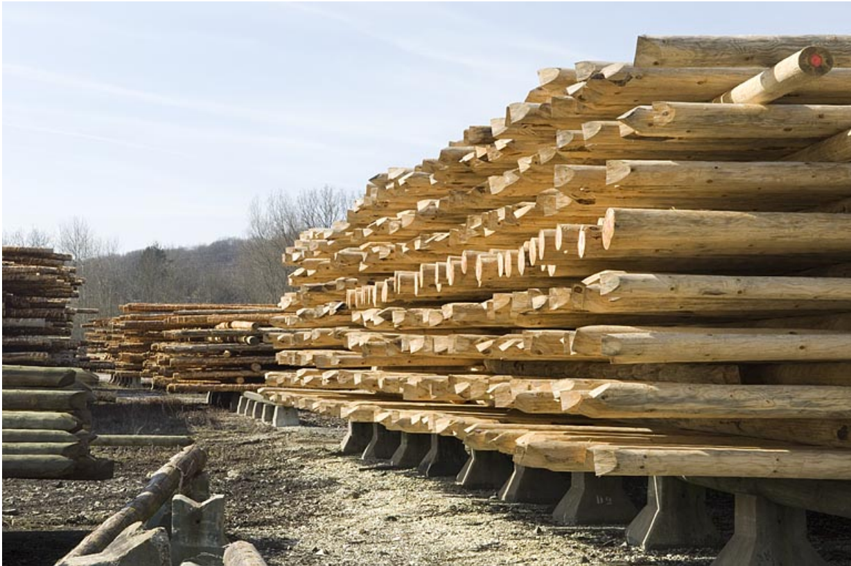
Aire de stockage des poteaux en cours de fabrication.