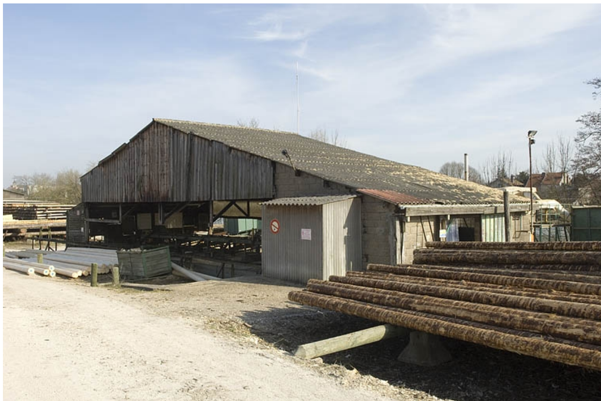
Atelier d'écorçage et de perçage.