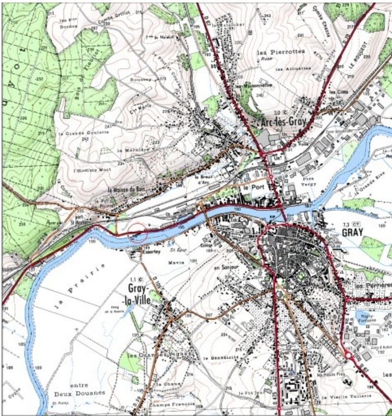
Carte de localisation. Carte topographique au 1:25000, I.G.N., Gray, 3222 O. 70, Arc-lès-Gray R.D. 70