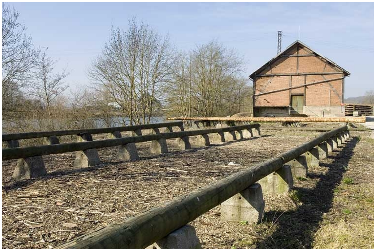
Aire de stockage et magasin industriel.