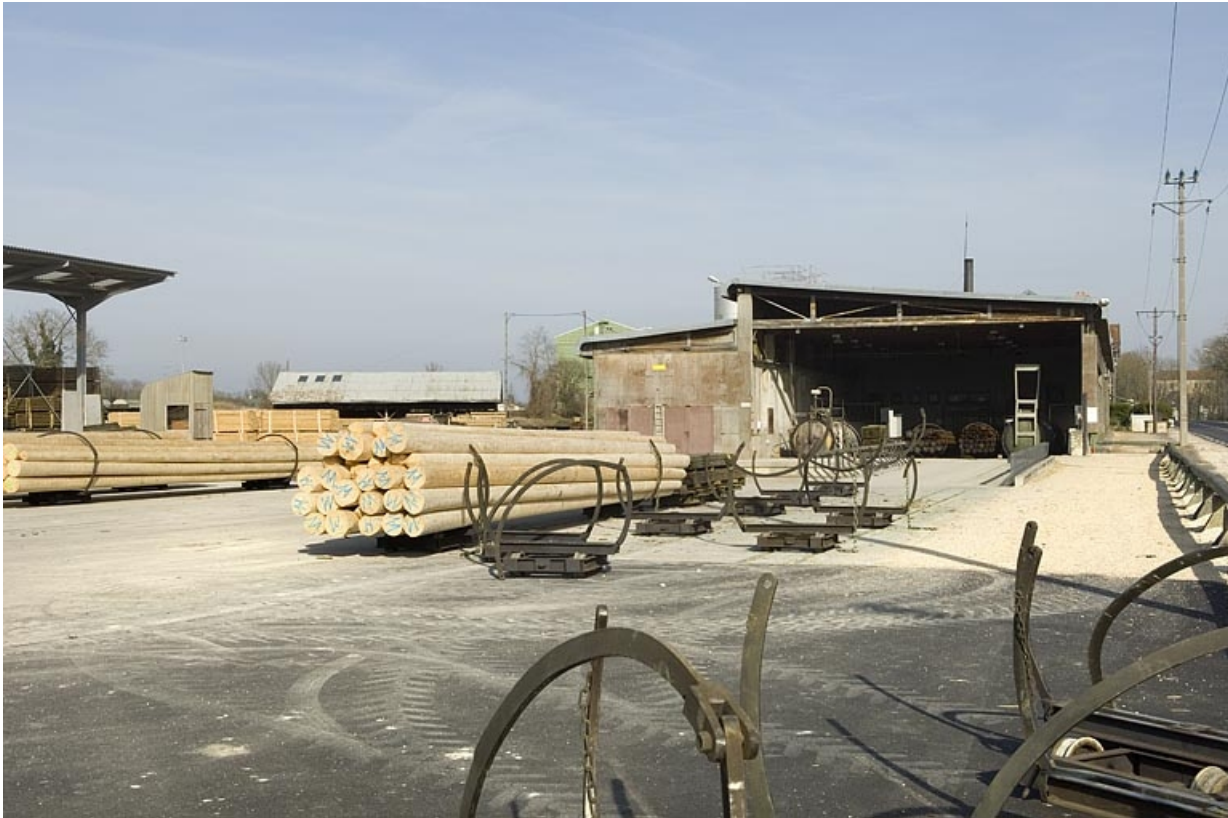
Atelier de fabrication depuis l'ouest.