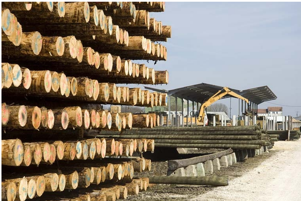
Chantier de bois et magasin industriel. 70, Arc-lès-Gray R.D. 70