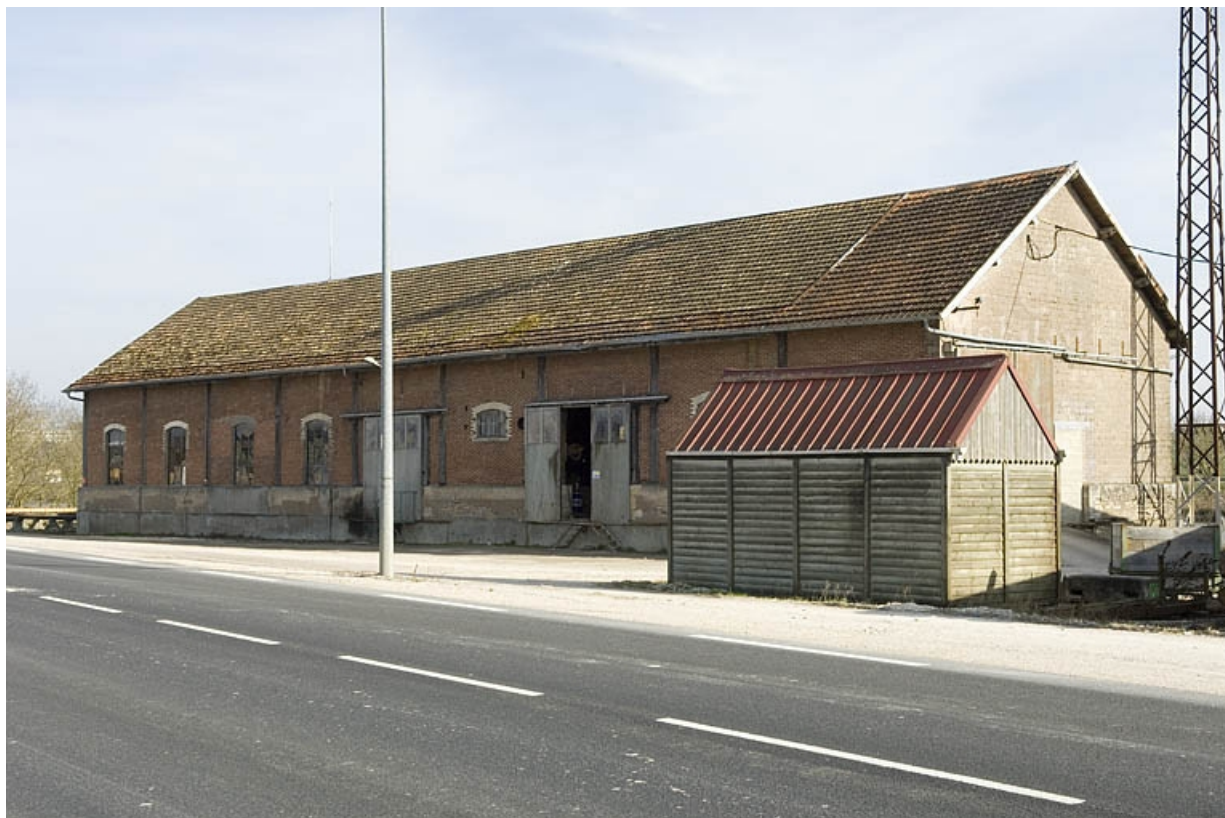
Magasin industriel depuis le nord-ouest.