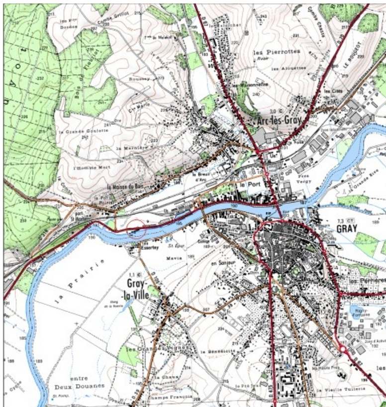
Carte de localisation. Carte topographique au 1:25000, I.G.N., Gray, 3222 O. 70, Arc-lès-Gray R.D. 70