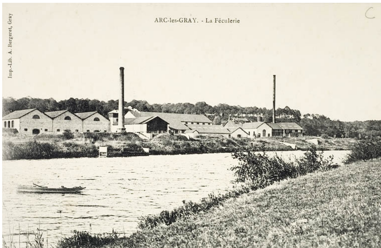
Arc-lès-Gray. La féculerie.

70, Arc-lès-Gray R.D. 70, lieudit : la Féculerie