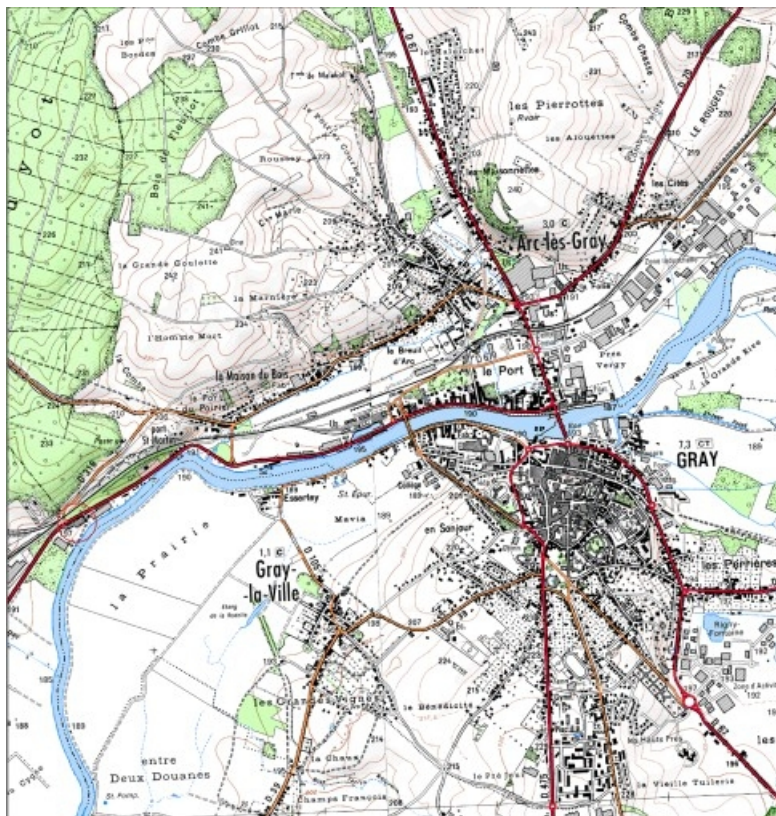
Carte de localisation. Carte topographique au 1:25000, I.G.N., Gray, 3222 O. Licence n°2008CISE29-68. 70, Arc-lès-Gray R.D. 70, lieudit : la Féculerie