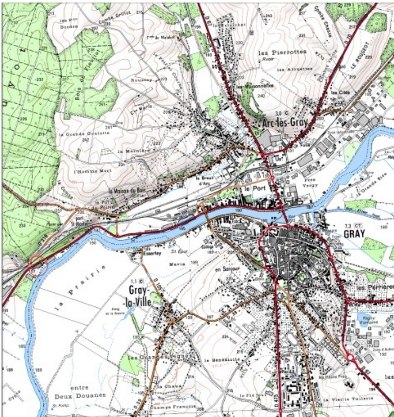
Carte de localisation. Carte topographique au 1:25000, I.G.N., Gray, 3222 O. 70, Arc-lès-Gray R.D. 70, lieudit : la Féculerie