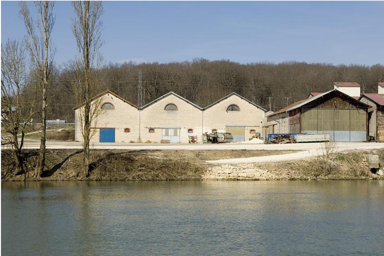
Atelier de fabrication depuis le sud-est.

70, Arc-lès-Gray R.D. 70, lieudit : la Féculerie