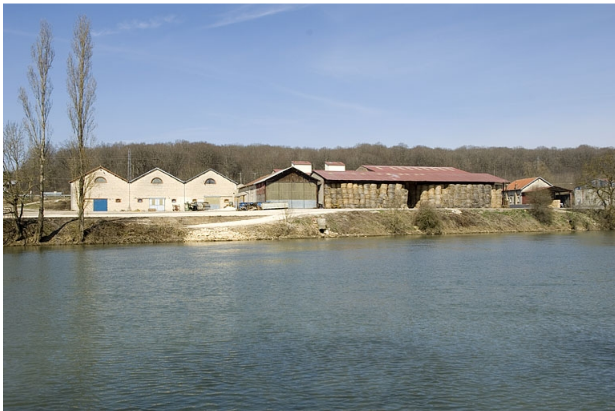
Vue d'ensemble depuis la rive gauche de la Saône.

70, Arc-lès-Gray R.D. 70, lieudit : la Féculerie