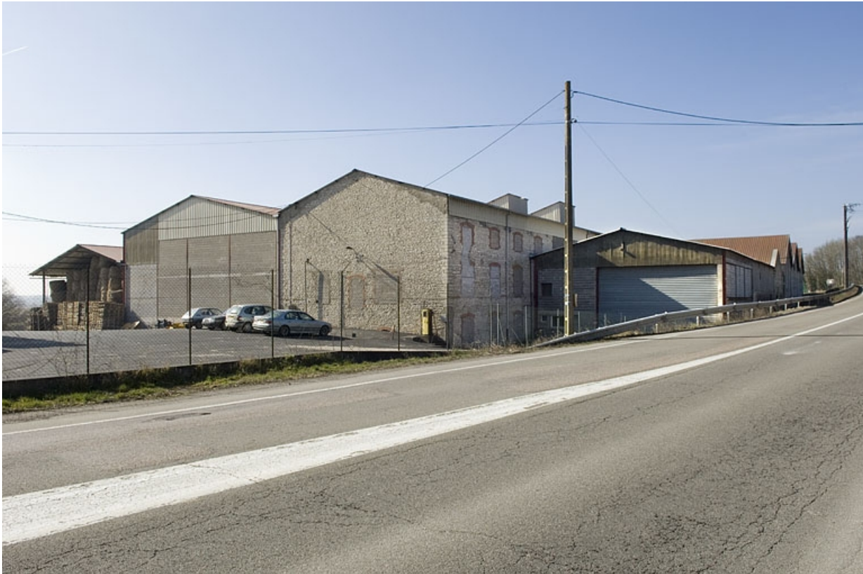
Atelier de fabrication depuis le nord.

70, Arc-lès-Gray R.D. 70, lieudit : la Féculerie