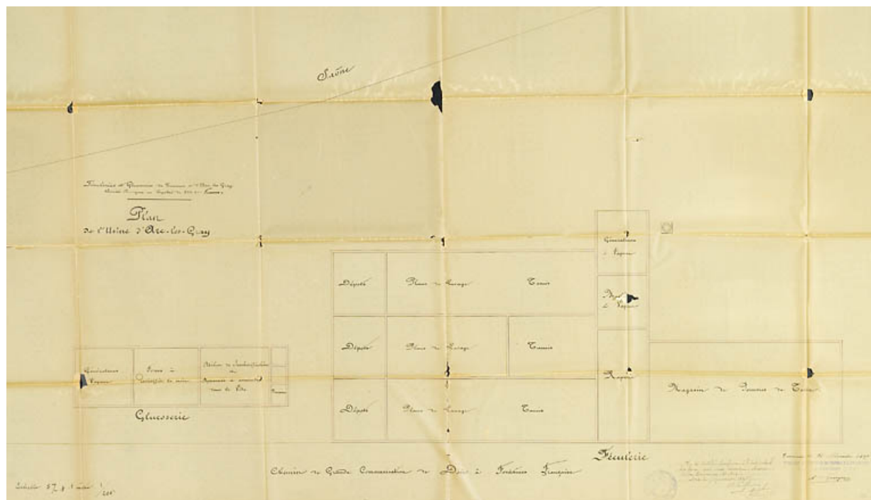
Féculeries et glucoseries de Tournus et d'Arc lès Gray. Plan de l'usine d'Arc lès Gray.

70, Arc-lès-Gray R.D. 70, lieudit : la Féculerie