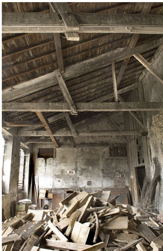
Intérieur de l'atelier à flanc de colline. Vue depuis le sud.