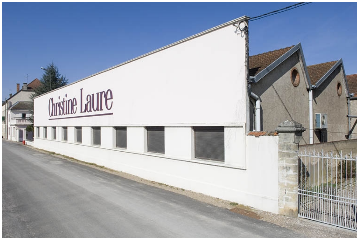
Façade sud de l'atelier de fabrication.