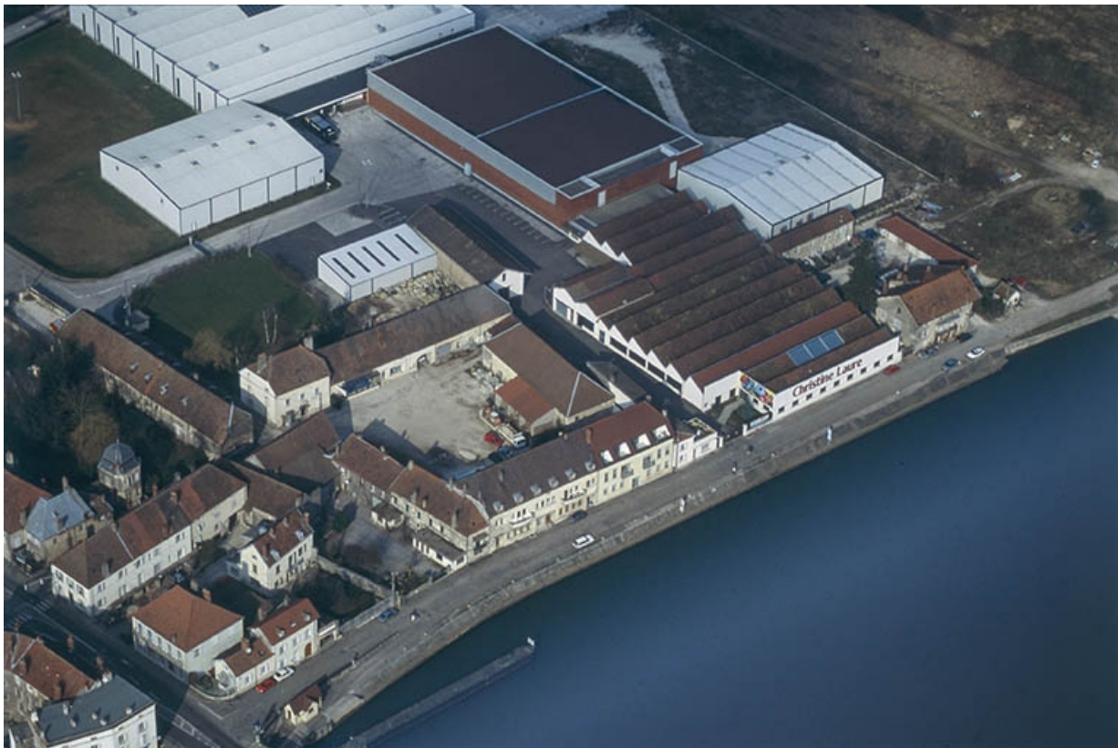
Vue aérienne depuis le sud-est en 1998.