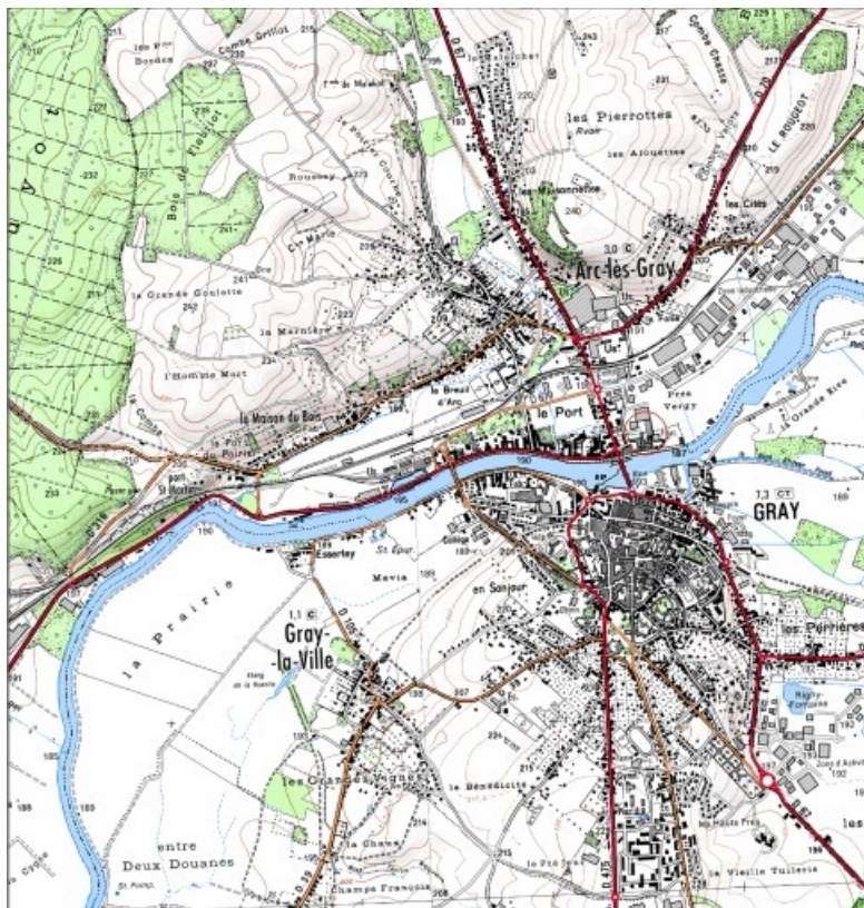
Carte de localisation. Carte topographique au 1:25000, I.G.N., Gray, 3222 E. SCAN 25 70, Gray quai Vergy