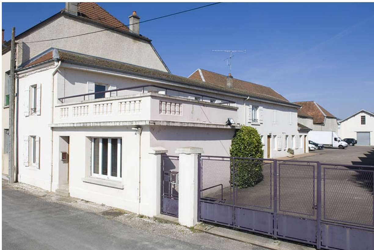
Conciergerie et bureaux depuis l'entrée.