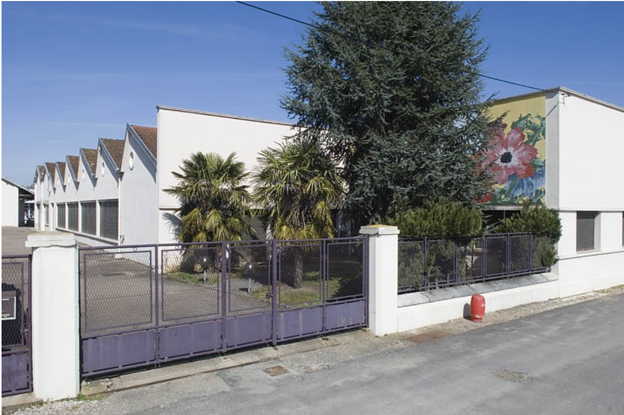
Vue de l'atelier depuis l'ancienne entrée.