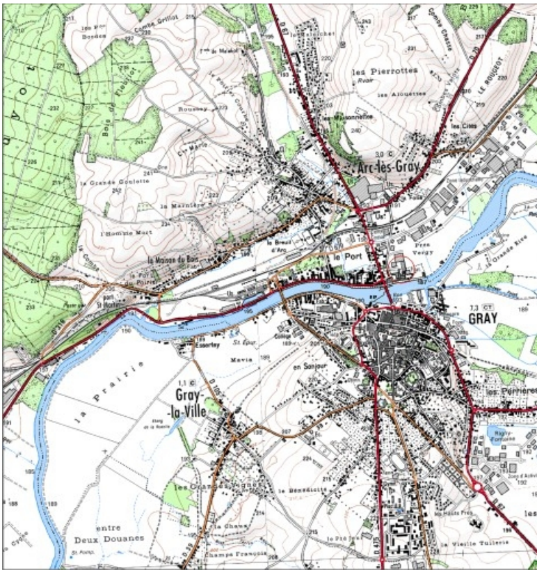
Carte de localisation. Carte topographique au 1:25000, I.G.N., Gray, 3222 E. SCAN 25 70, Gray quai Vergy