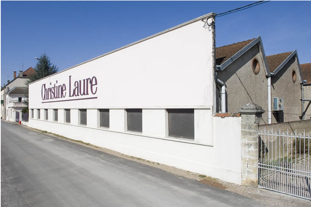
Façade sud de l'atelier de fabrication.