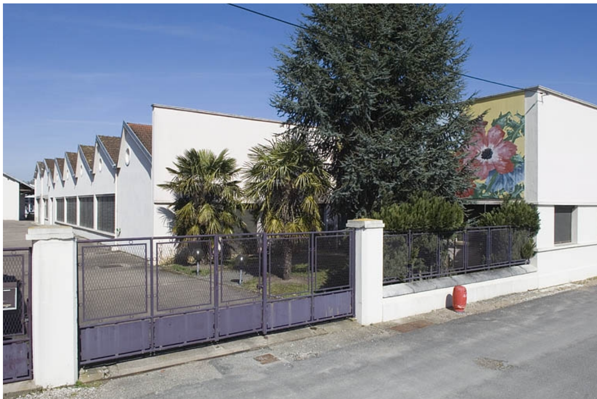
Vue de l'atelier depuis l'ancienne entrée.