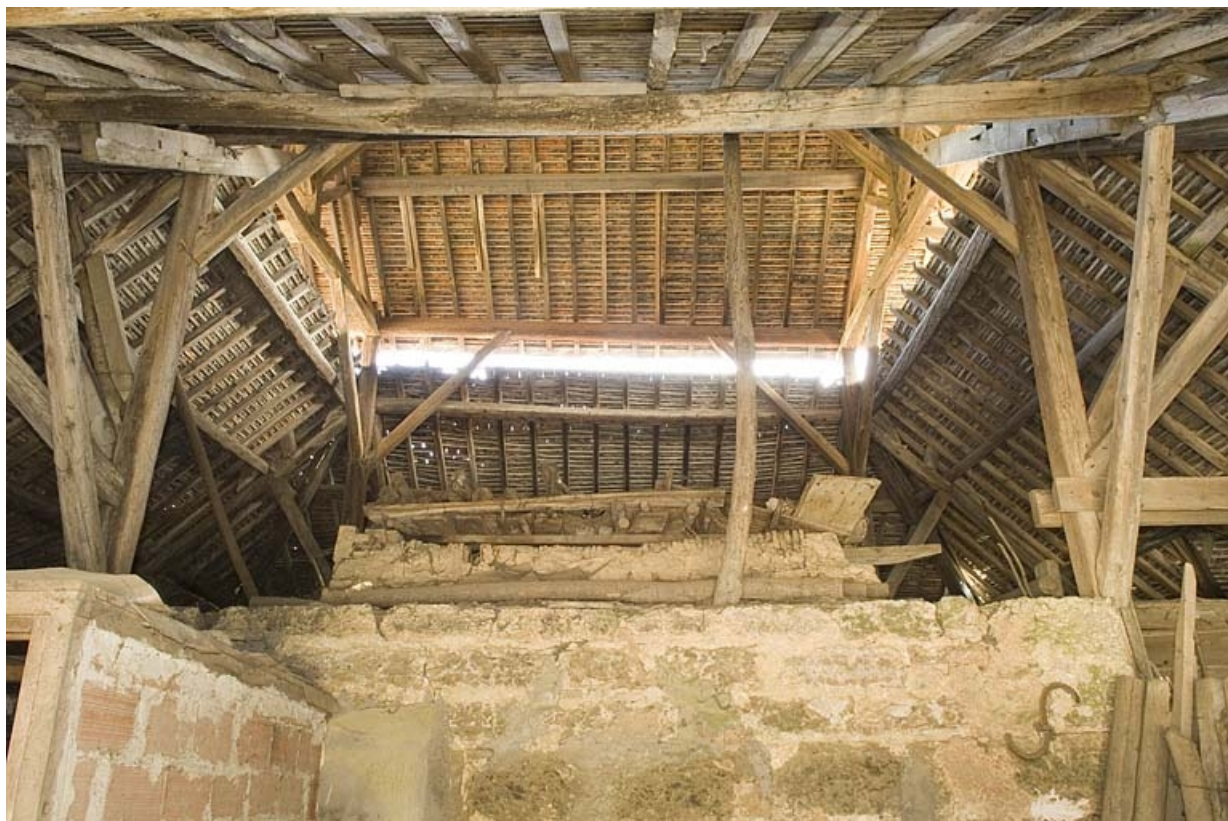
Vue intérieure du bâtiment du four. Massif maçonné.

70, Champtonnay, 7 route de Besançon, lieudit : la Vendue