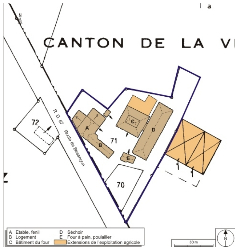
Plan-masse et de situation. Extrait du plan cadastral numérisé, 2008, section ZD, 1:2000 agrandi à 1:1000. Source : Direction générale des Finances Publiques - Cadastre ; mise à jour : 2008.

70, Champtonnay, 7 route de Besançon, lieudit : la Vendue