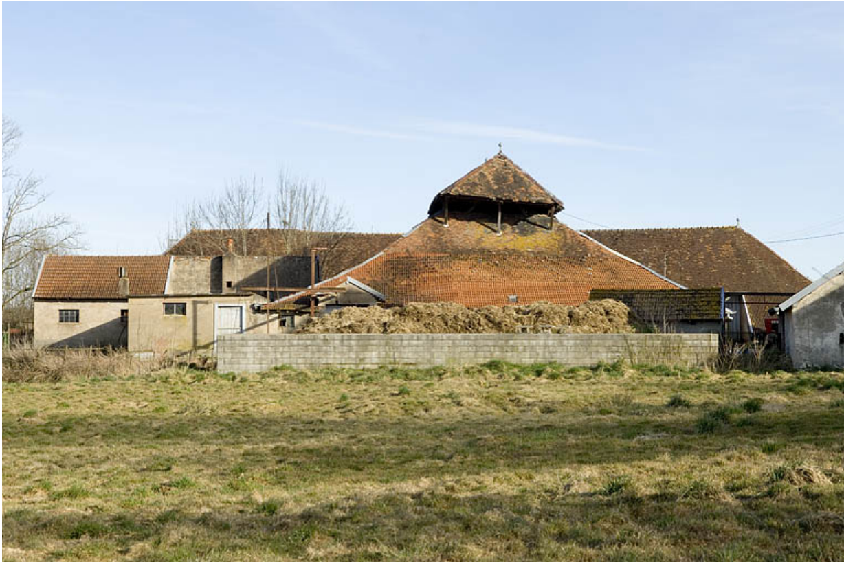
Bâtiment du four et séchoir depuis l'ouest.

70, Champtonnay, 7 route de Besançon, lieudit : la Vendue