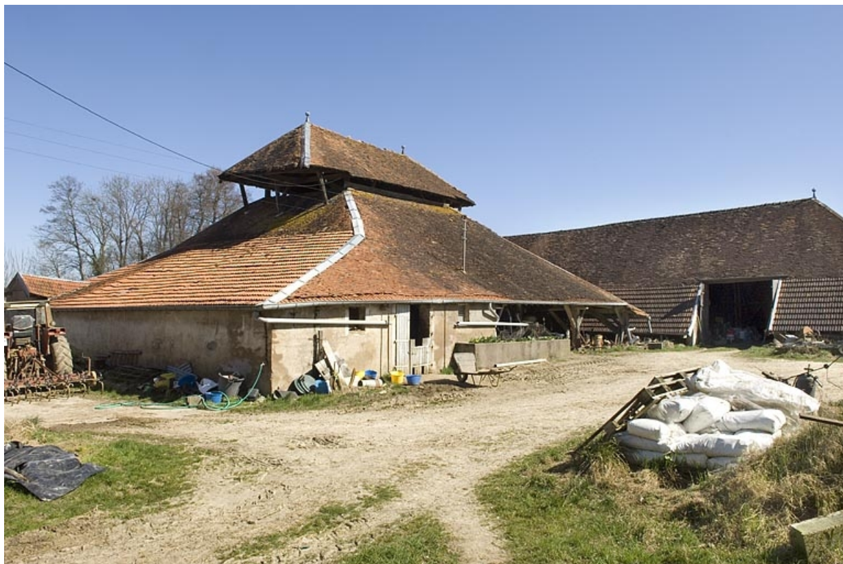
Bâtiment du four et séchoir vus de trois quarts.