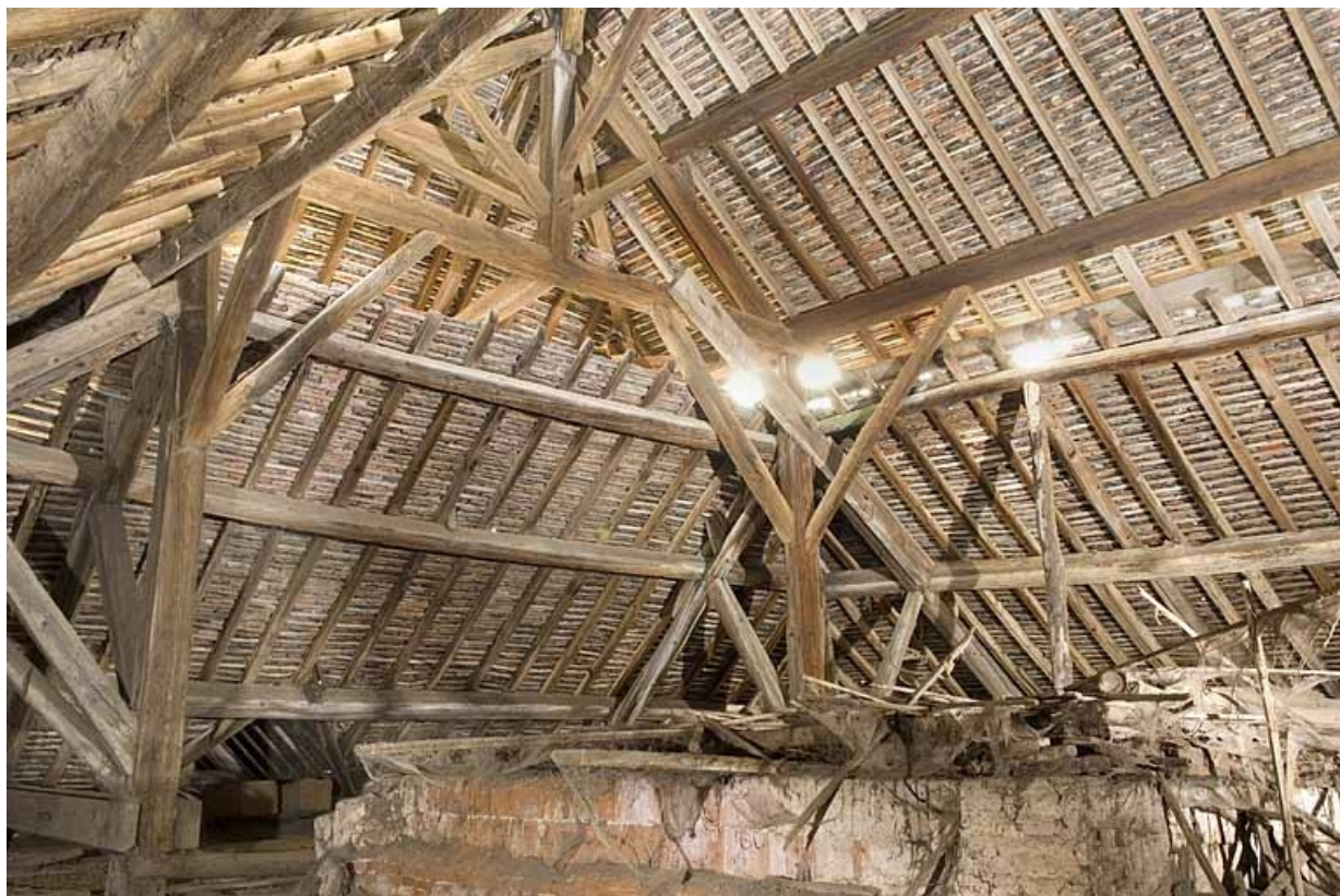
Bâtiment du four. Charpente de la croupe est. Vue de trois quarts.

70, Champtonnay, 7 route de Besançon, lieudit : la Vendue