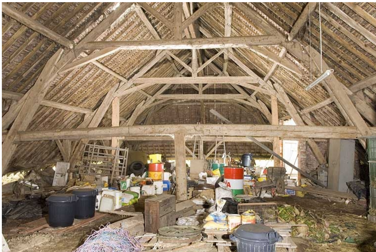
Séchoir. Partie sud de la charpente.