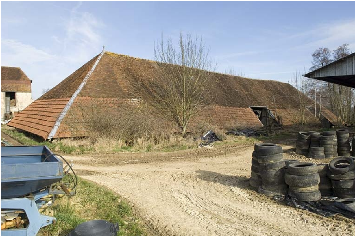
Séchoir depuis le sud.

70, Champtonnay, 7 route de Besançon, lieudit : la Vendue