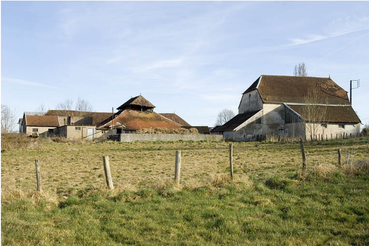
Vue rapprochée depuis le nord-ouest.

70, Champtonnay, 7 route de Besançon, lieudit : la Vendue