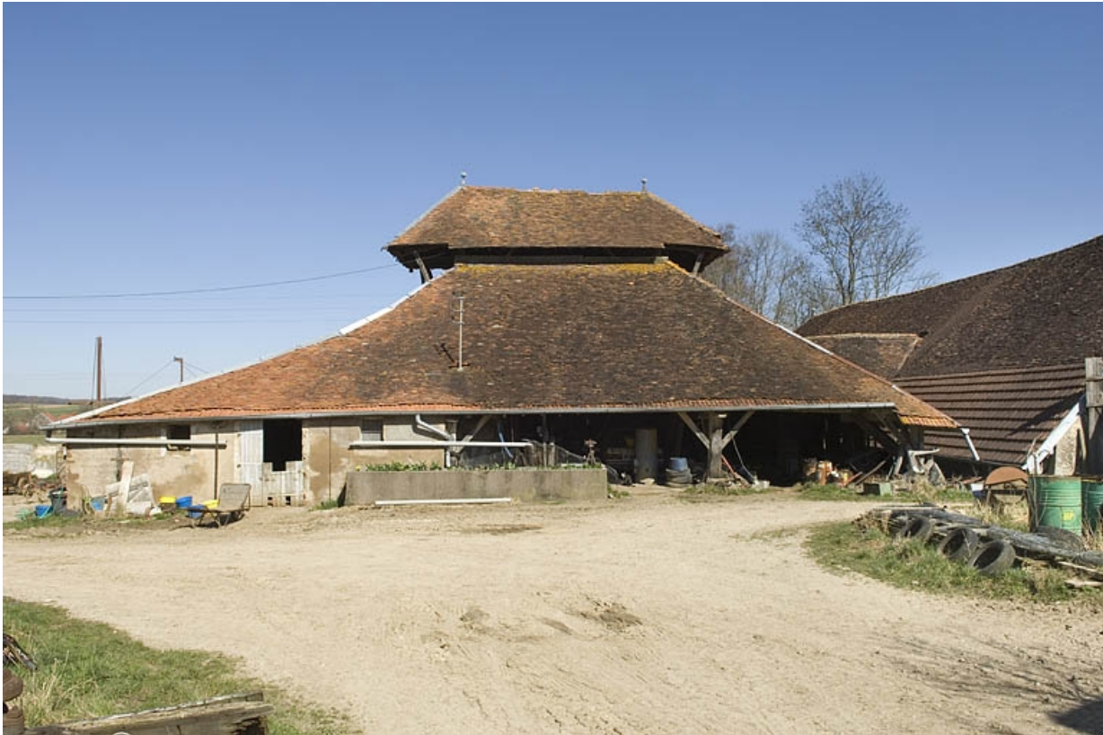
Bâtiment du four vu de face.

70, Champtonnay, 7 route de Besançon, lieudit : la Vendue