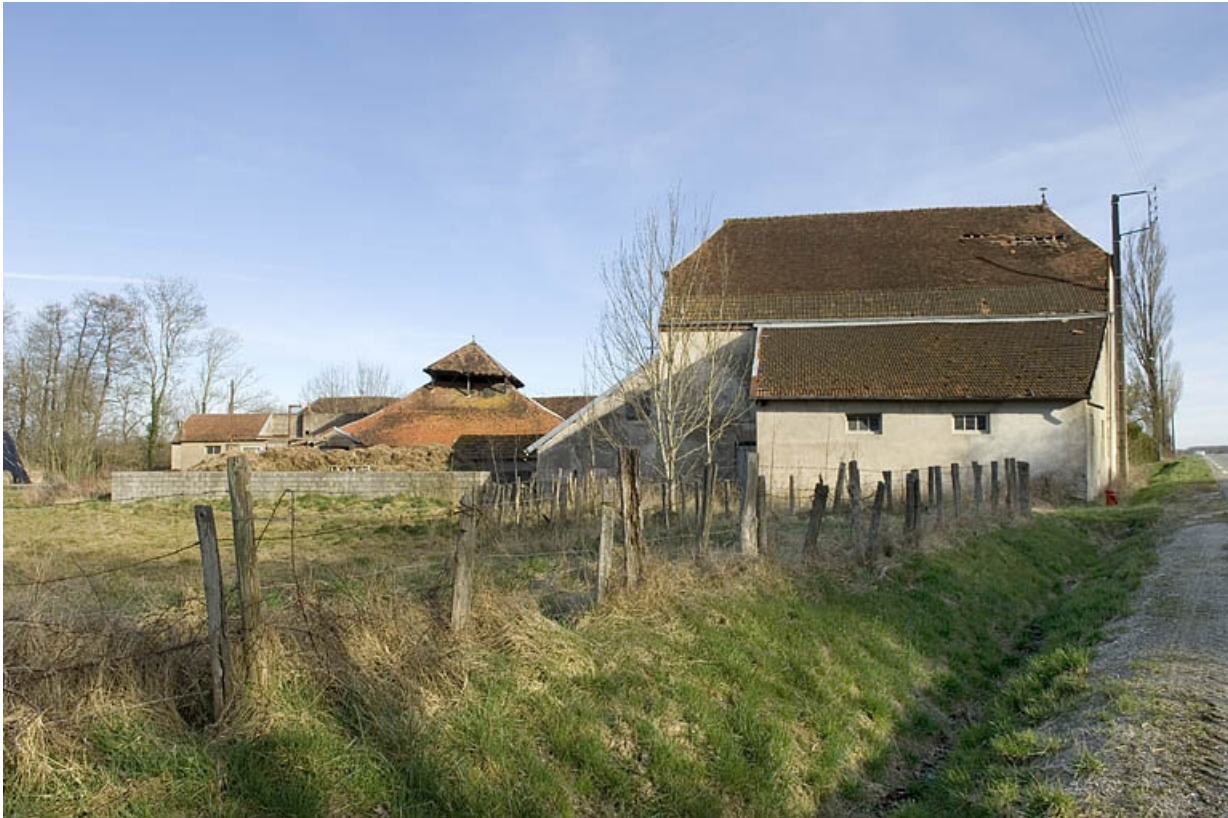
Bâtiment du four et ferme depuis le nord-ouest.

70, Champtonnay, 7 route de Besançon, lieudit : la Vendue