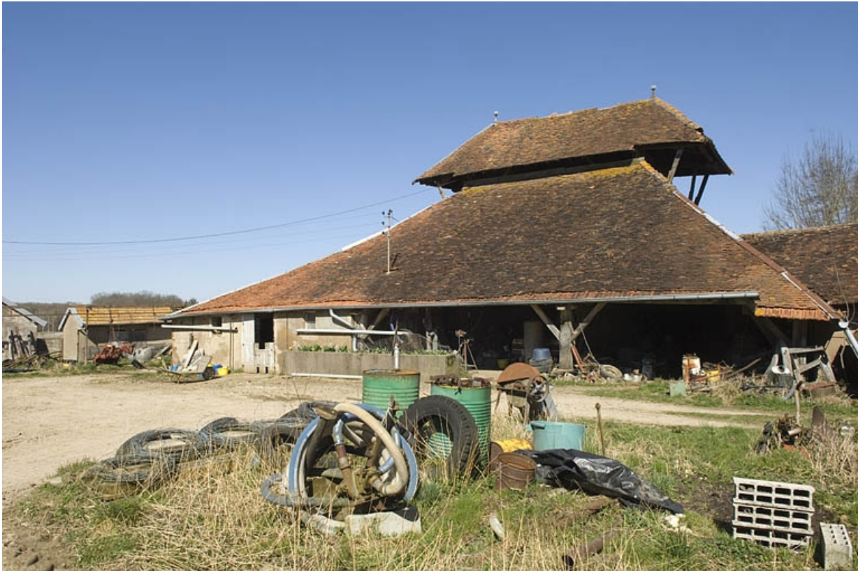
Bâtiment du four vu de trois quarts droite.

70, Champtonnay, 7 route de Besançon, lieudit : la Vendue