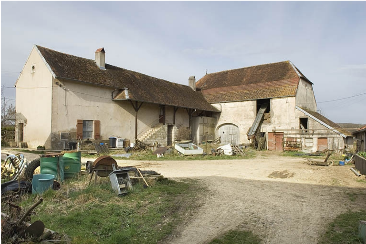
Vue de la ferme depuis l'est.

70, Champtonnay, 7 route de Besançon, lieudit : la Vendue