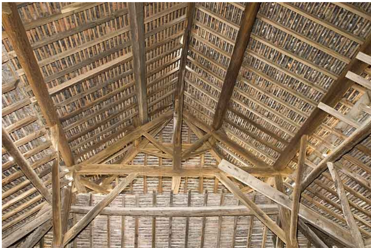
Bâtiment du four. Charpente de la croupe est. Vue de face.

70, Champtonnay, 7 route de Besançon, lieudit : la Vendue