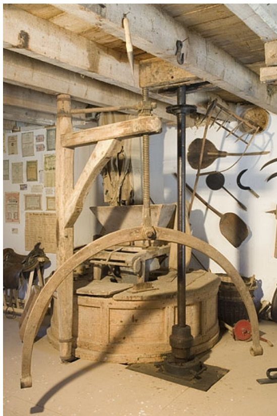
Premier étage. Potence et meules dans leur archure.

70, Chargey-lès-Gray rue du Moulin, lieudit : les Planches