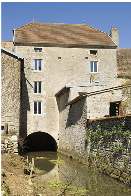
Façade postérieure depuis le bief d'aval.

70, Chargey-lès-Gray rue du Moulin, lieudit : les Planches