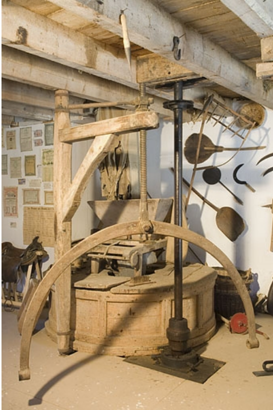
Premier étage. Potence et meules dans leur archure.

70, Chargey-lès-Gray rue du Moulin, lieudit : les Planches