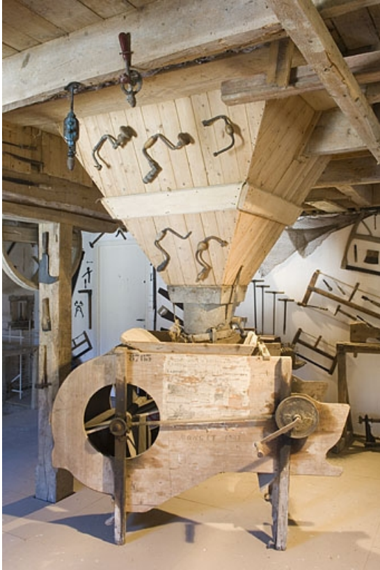
Premier étage. Tarare et sa trémie.

70, Chargey-lès-Gray rue du Moulin, lieudit : les Planches