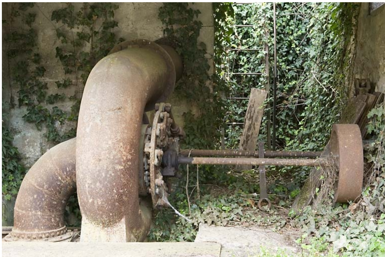
Turbine à axe horizontal.

70, Montureux-et-Prantigny, lieudit : quartier du Haut fourneau