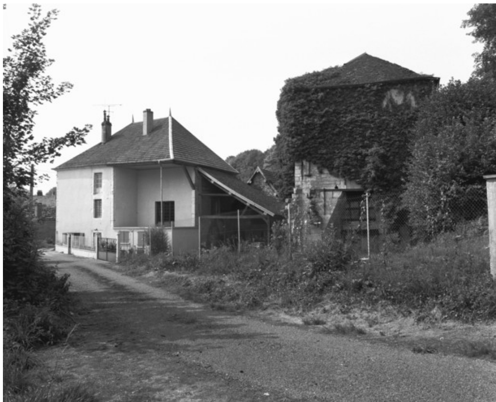
Logement patronal et haut fourneau depuis le nord-est en 1989.

70, Montureux-et-Prantigny, lieudit : quartier du Haut fourneau