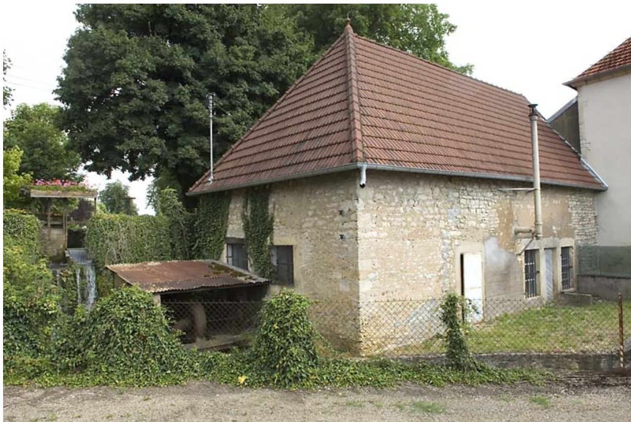
Local de la turbine et atelier.

70, Montureux-et-Prantigny, lieudit : quartier du Haut fourneau