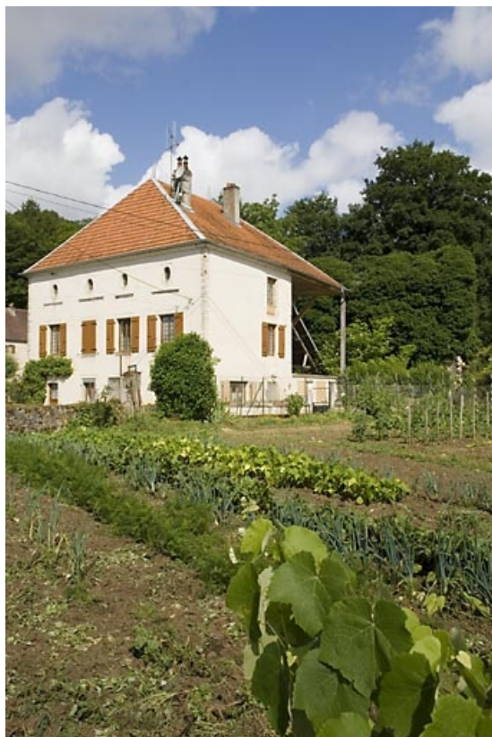
Logement patronal vu depuis le nord-est.

70, Montureux-et-Prantigny, lieudit : quartier du Haut fourneau