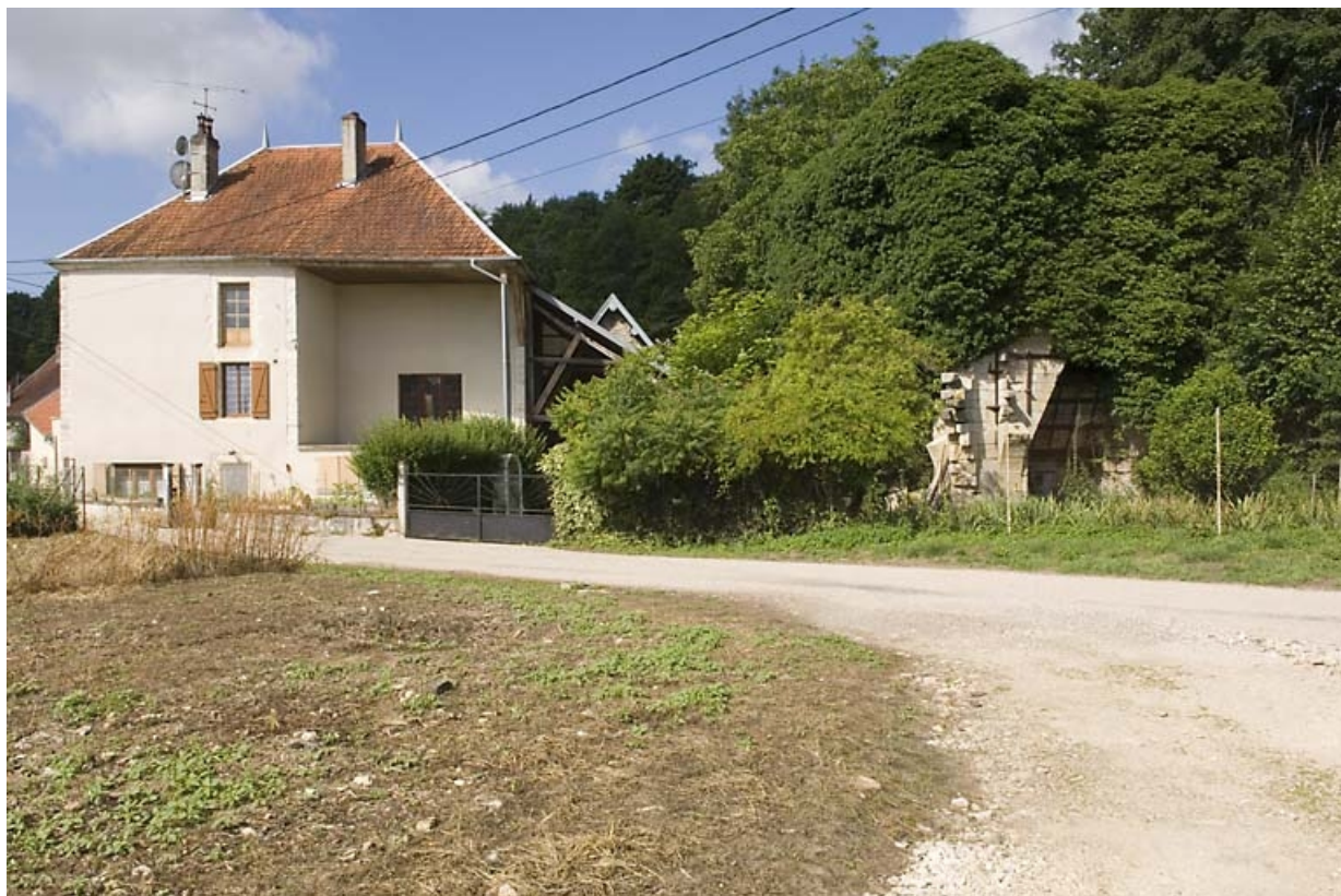
Logement patronal et haut fourneau depuis le nord.

70, Montureux-et-Prantigny, lieudit : quartier du Haut fourneau