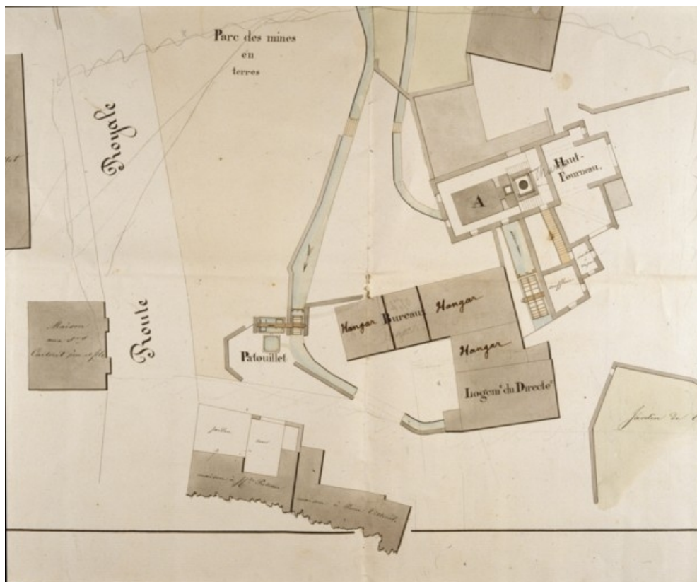
Plan du haut fourneau de Montureux appartenant à Mrs de Falatieu [détail].

70, Montureux-et-Prantigny, lieudit : quartier du Haut fourneau