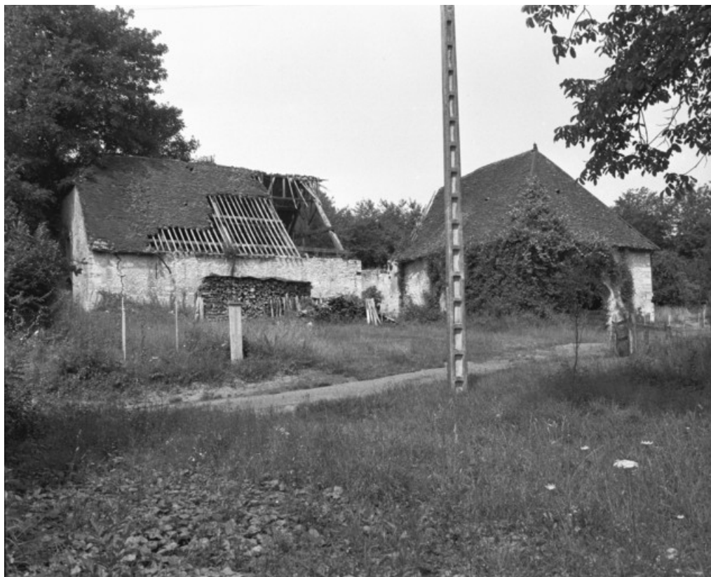
Halle à charbon en L en 1989.

70, Montureux-et-Prantigny, lieudit : quartier du Haut fourneau