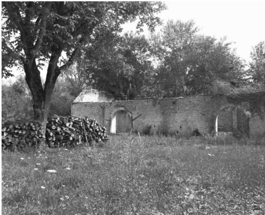
Ruines de la halle à charbon est en 1989.

70, Montureux-et-Prantigny, lieudit : quartier du Haut fourneau