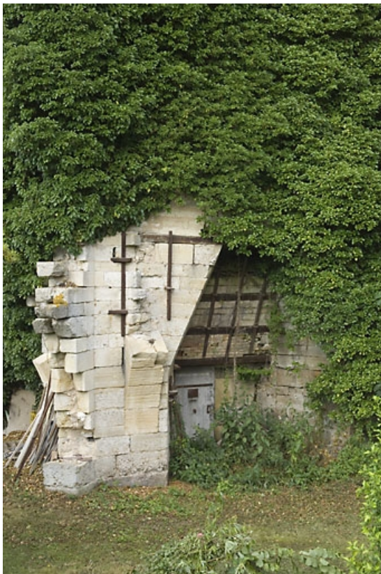
Haut fourneau. Embrasure de coulée.

70, Montureux-et-Prantigny, lieudit : quartier du Haut fourneau