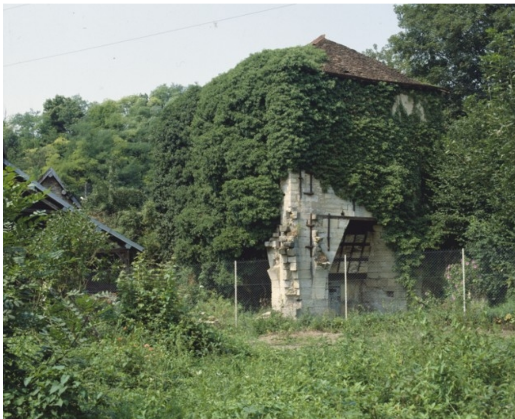
Le haut fourneau en 1989.

70, Montureux-et-Prantigny, lieudit : quartier du Haut fourneau