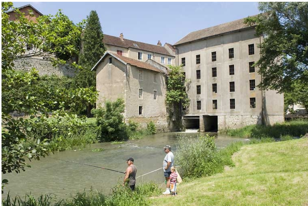
Vue de trois quarts arrière. 70, Marnay rue du Moulin