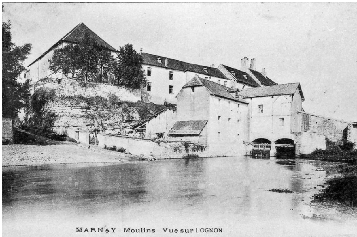
MARNAY - Moulins - Vue sur l'Ognon. Moulin avant sa destruction. 70, Marnay rue du Moulin