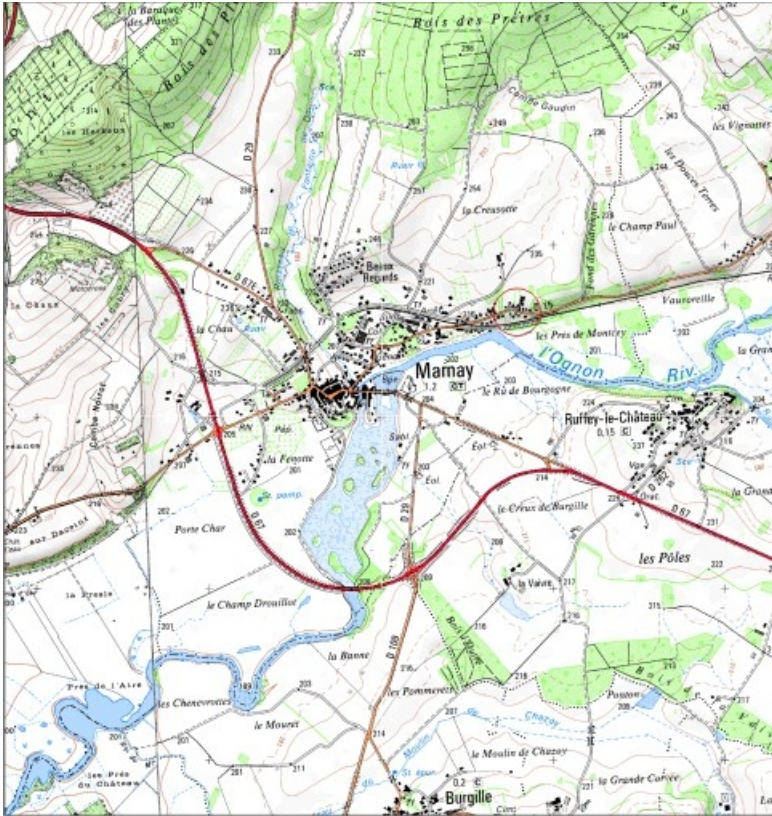
Carte de localisation. Carte topographique au 1:25000, I.G.N., Marnay, 3323 O. 70, Marnay, 7, 9 route de Brussey