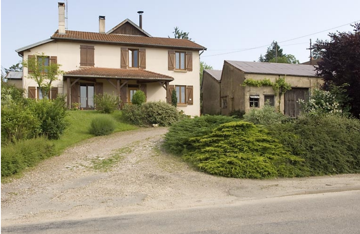
Logement et atelier de fabrication depuis la route.