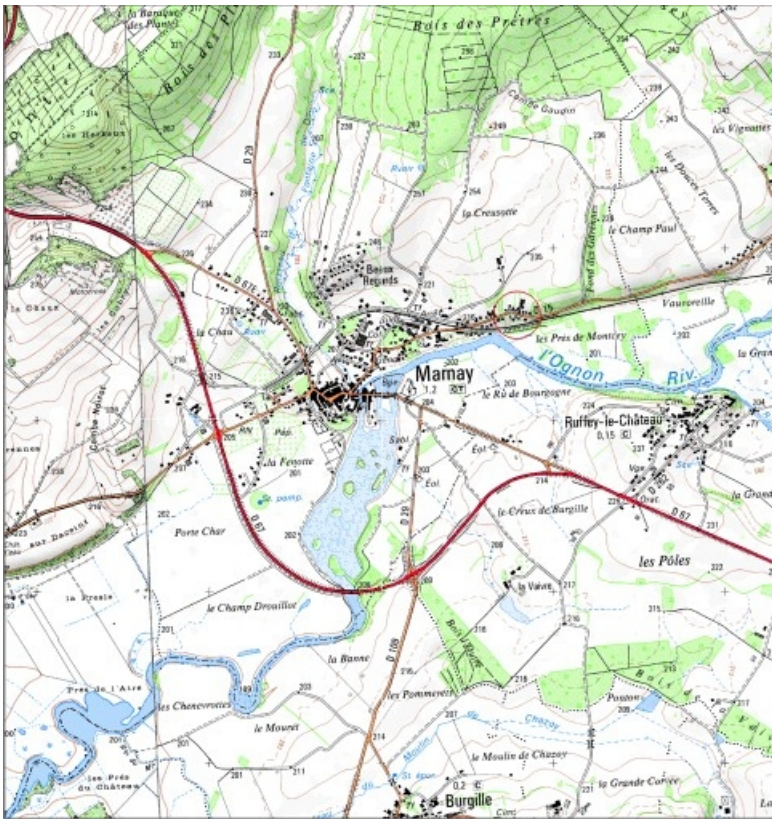
Carte de localisation. Carte topographique au 1:25000, I.G.N., Marnay, 3323 O. SCAN 25, Licence n°2008CISE29-68. 70, Marnay, 7, 9 route de Brussey