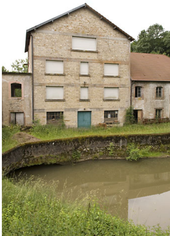
Façade de l'atelier de fabrication.