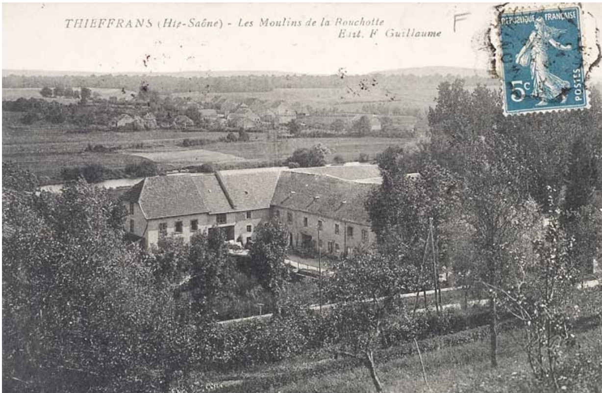
Thieffrans (Haute-Saône). - Les Moulins de la Rouchotte.