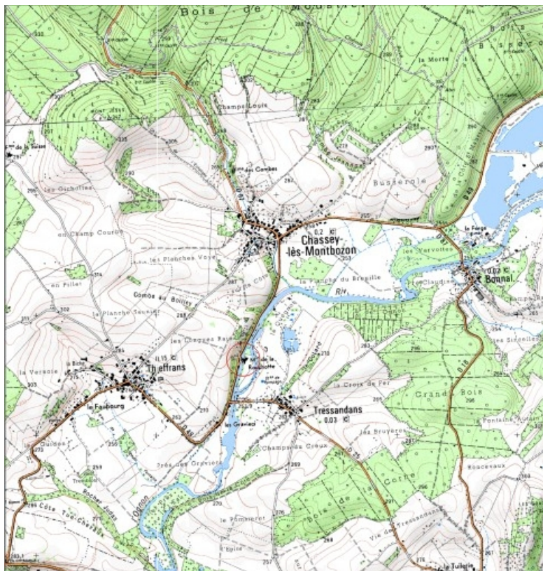
Carte de localisation. Carte topographique au 1:25000, I.G.N., Rougemont, 3422 E. SCAN 25, Licence n°2008CISE29-68. 70, Thieffrans, lieudit : la Rouchotte