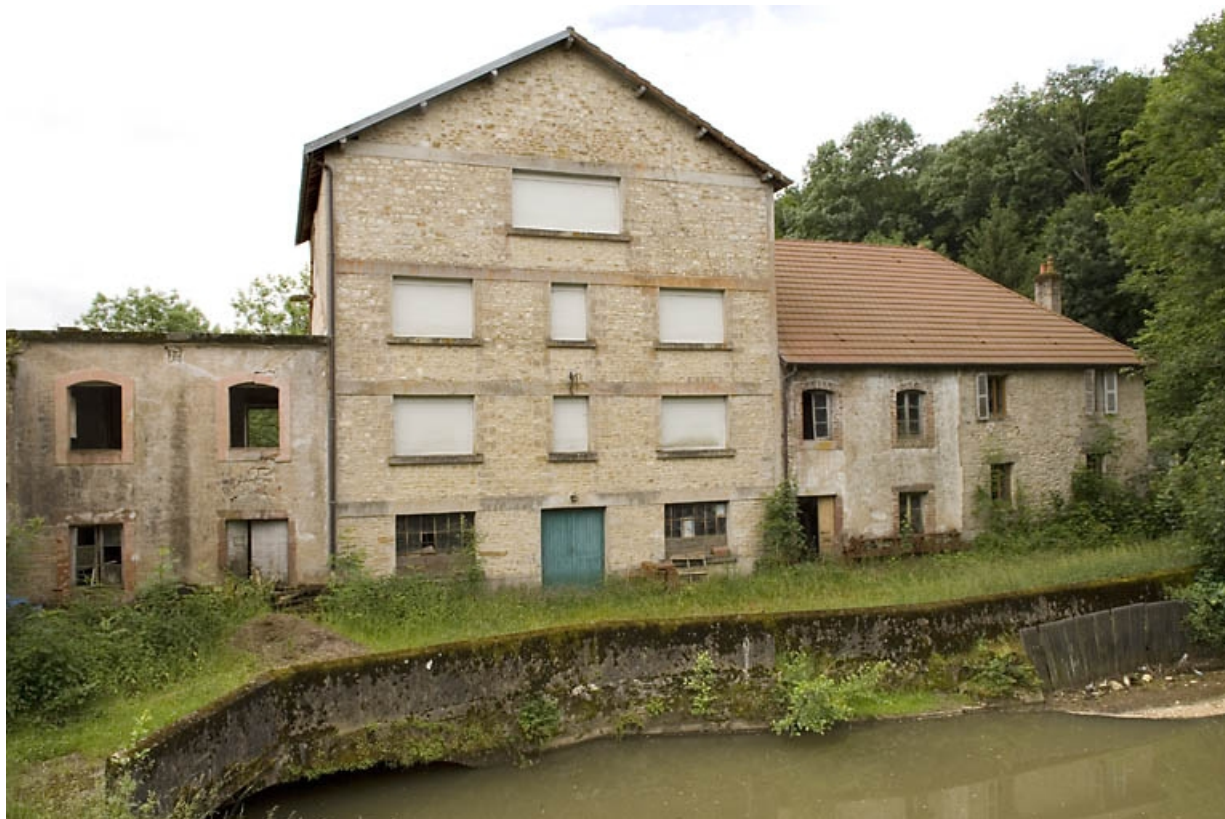
Façade de l'atelier de fabrication et du bâtiment d'eau depuis l'amont. 70, Thieffrans, lieudit : la Rouchotte