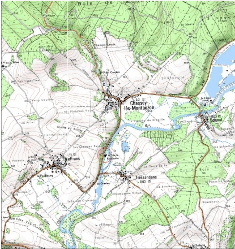
Carte de localisation. Carte topographique au 1:25000, I.G.N., Rougemont, 3422 E. 70, Thieffrans, lieudit : la Rouchotte