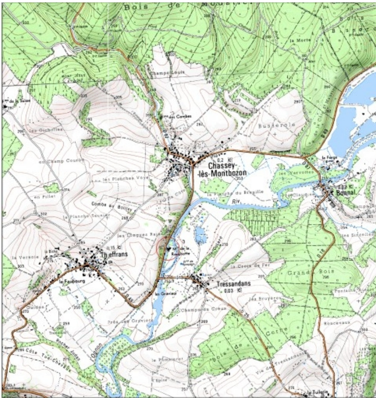
Carte de localisation. Carte topographique au 1:25000, I.G.N., Rougemont, 3422 E. SCAN 25 70, Thieffrans, lieudit : la Rouchotte