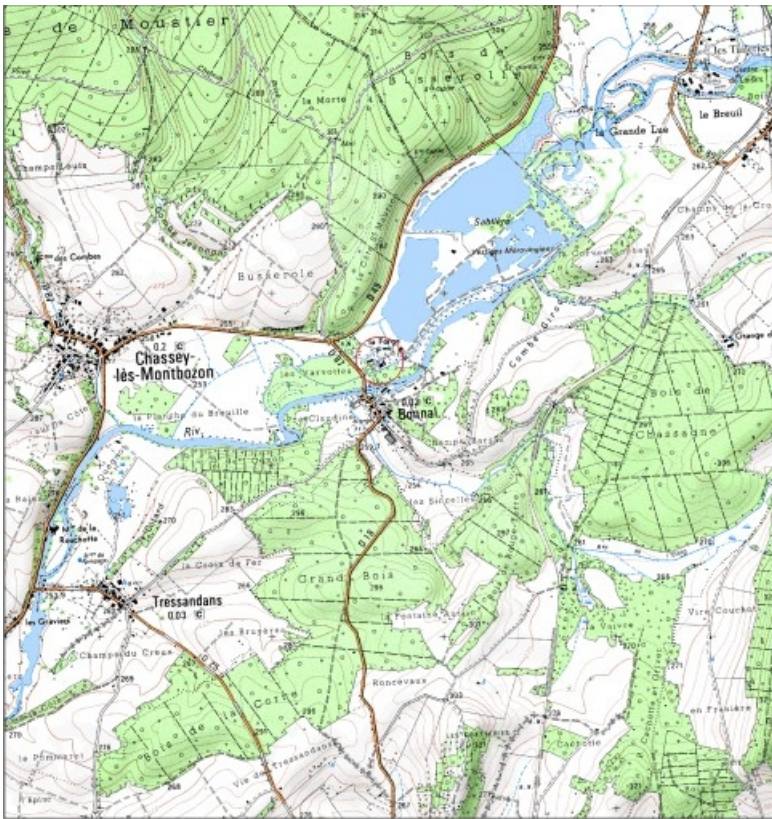
Carte de localisation. Carte topographique au 1:25000, I.G.N., Rougemont, 3422 E. SCAN 25, Licence n°2008CISE29-68. 70, Chassey-lès-Montbozon, lieu-dit : la Forge