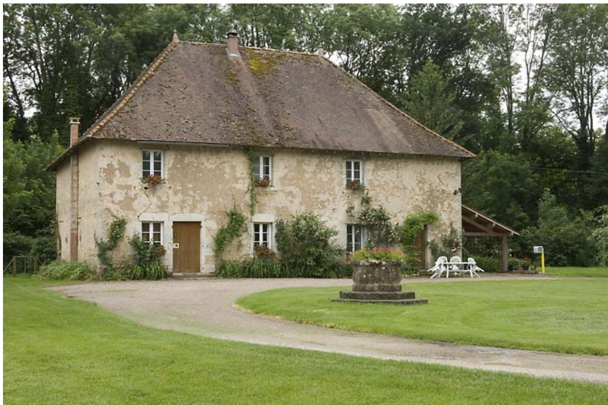
Logement patronal vu de trois quarts gauche.

70, Chassey-lès-Montbozon, lieudit : la Forge