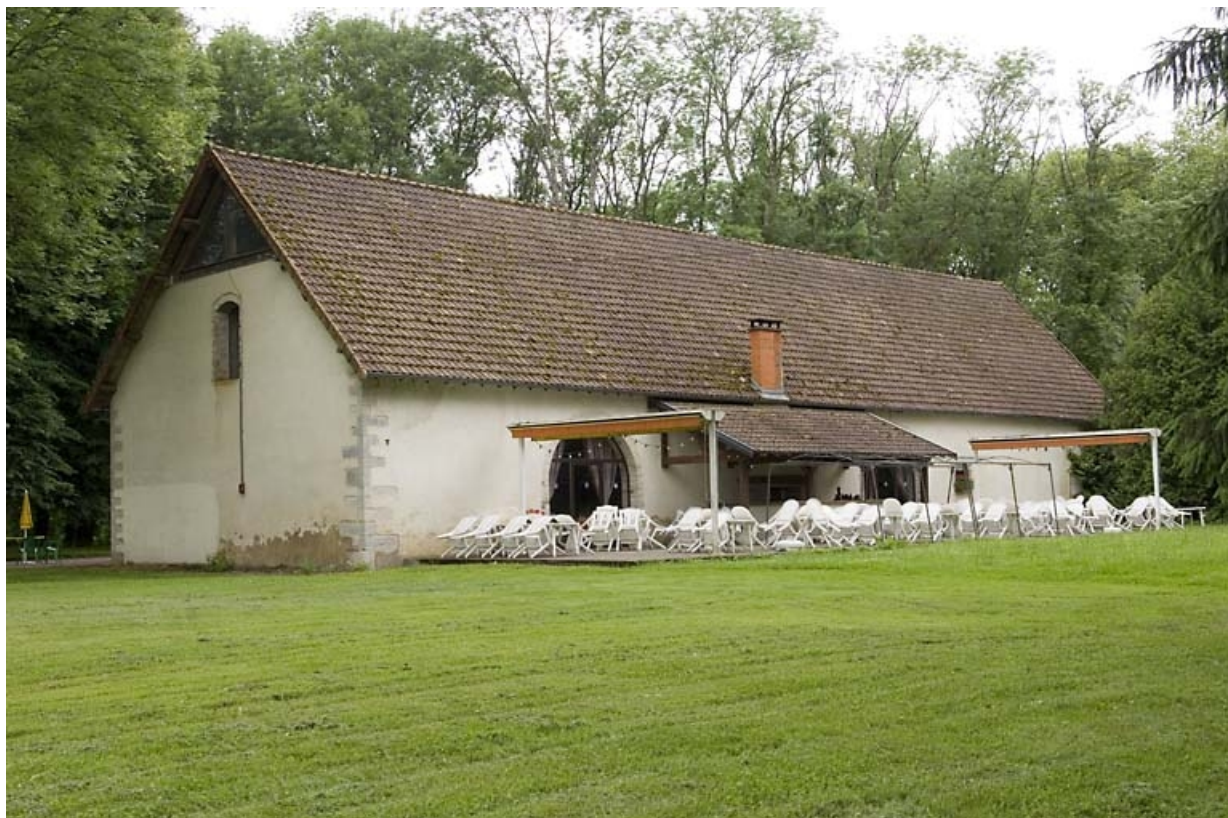
Ancienne halle à charbon depuis le sud. 70, Chassey-lès-Montbozon, lieudit : la Forge