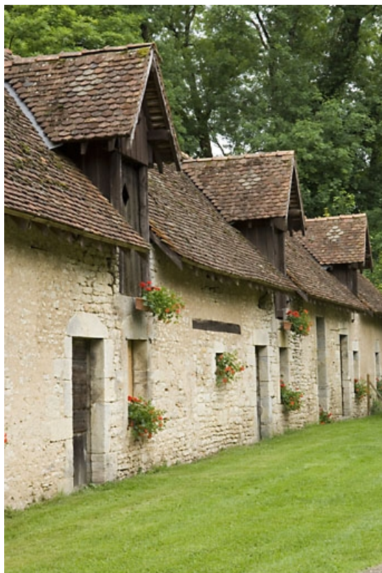
Détail de la façade antérieure du logement ouvrier.

70, Chassey-lès-Montbozon, lieudit : la Forge