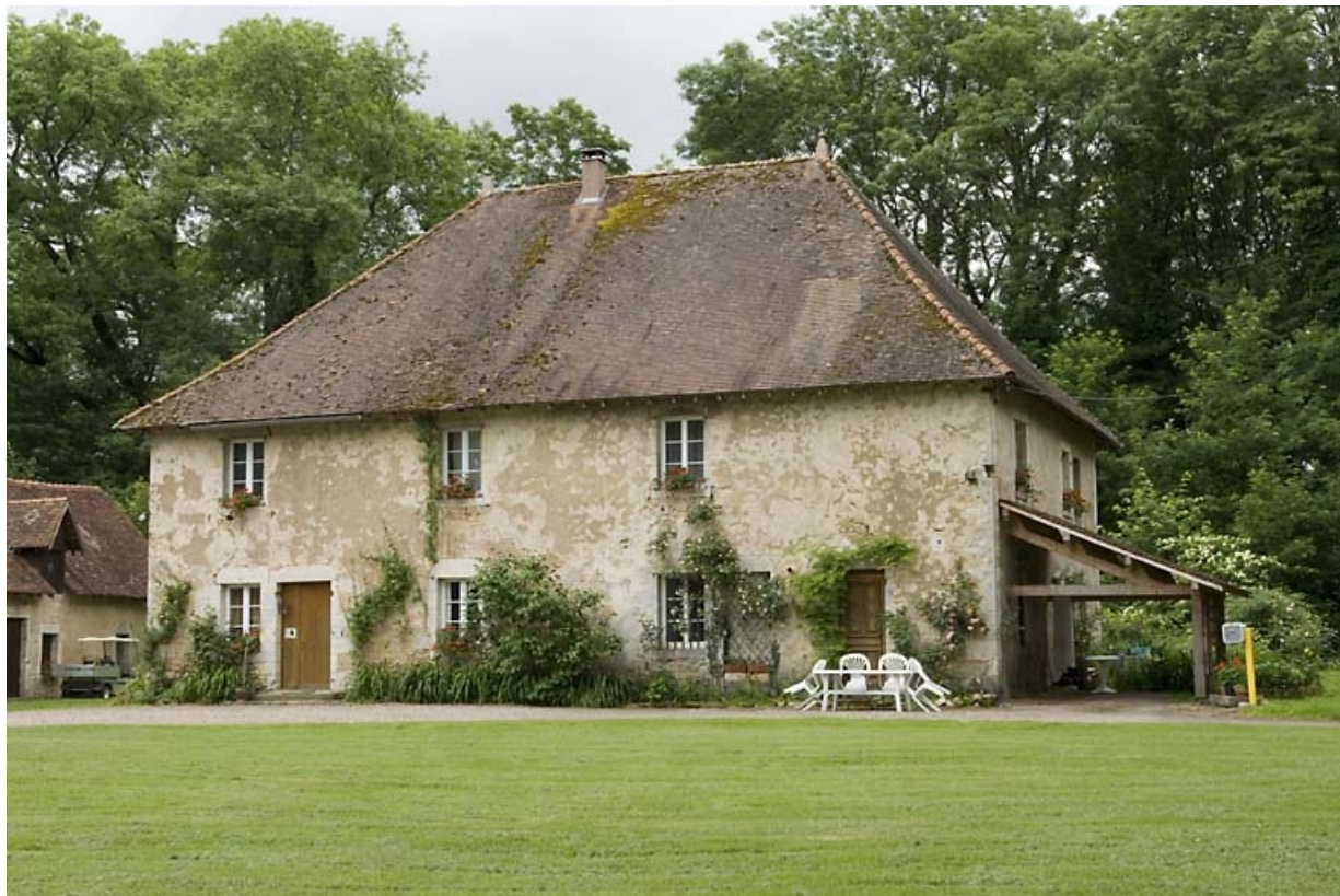
Logement patronal vu de trois quarts droite.

70, Chassey-lès-Montbozon, lieudit : la Forge