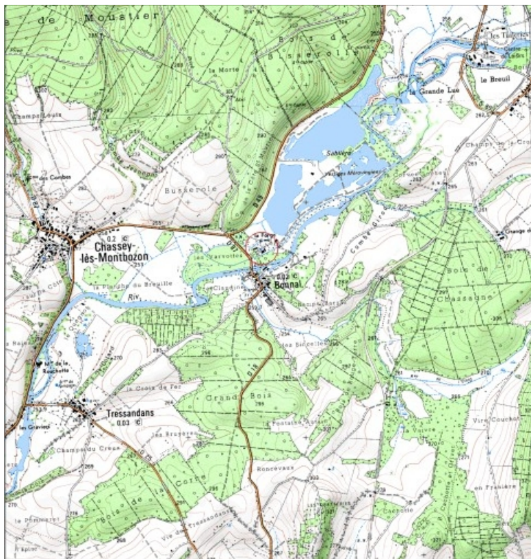
Carte de localisation. Carte topographique au 1:25000, I.G.N., Rougemont, 3422 E. SCAN 25 70, Chassey-lès-Montbozon, lieu-dit : la Forge