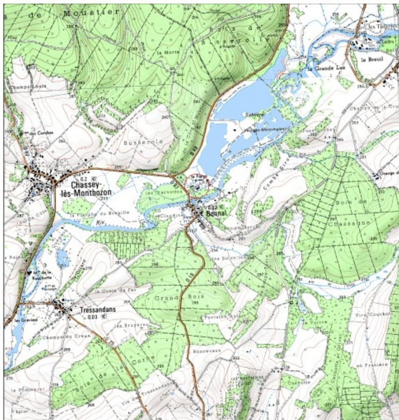
Carte de localisation. Carte topographique au 1:25000, I.G.N., Rougemont, 3422 E. SCAN 25, Licence n°2008CISE29-68. 70, Chassey-lès-Montbozon, lieu-dit : la Forge