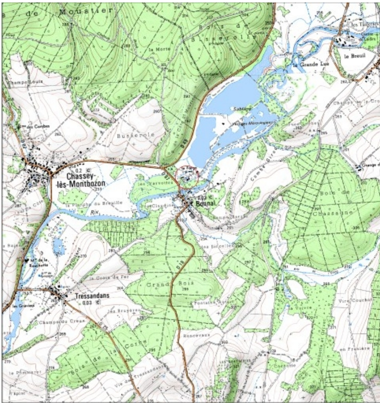
Carte de localisation. Carte topographique au 1:25000, I.G.N., Rougemont, 3422 E. 70, Chassey-lès-Montbozon, lieudit : la Forge