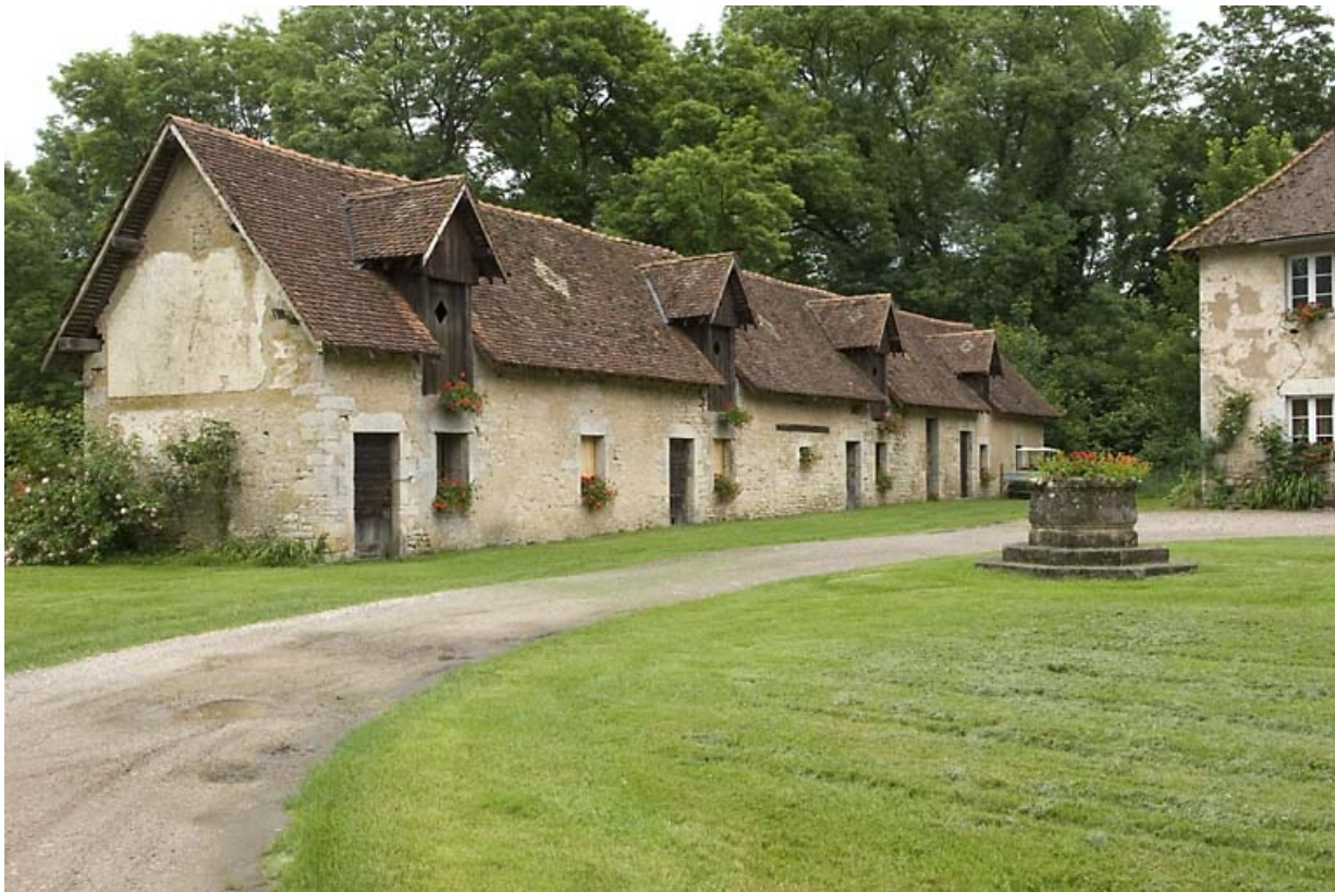
Logement ouvrier vu depuis le nord.

70, Chassey-lès-Montbozon, lieudit : la Forge