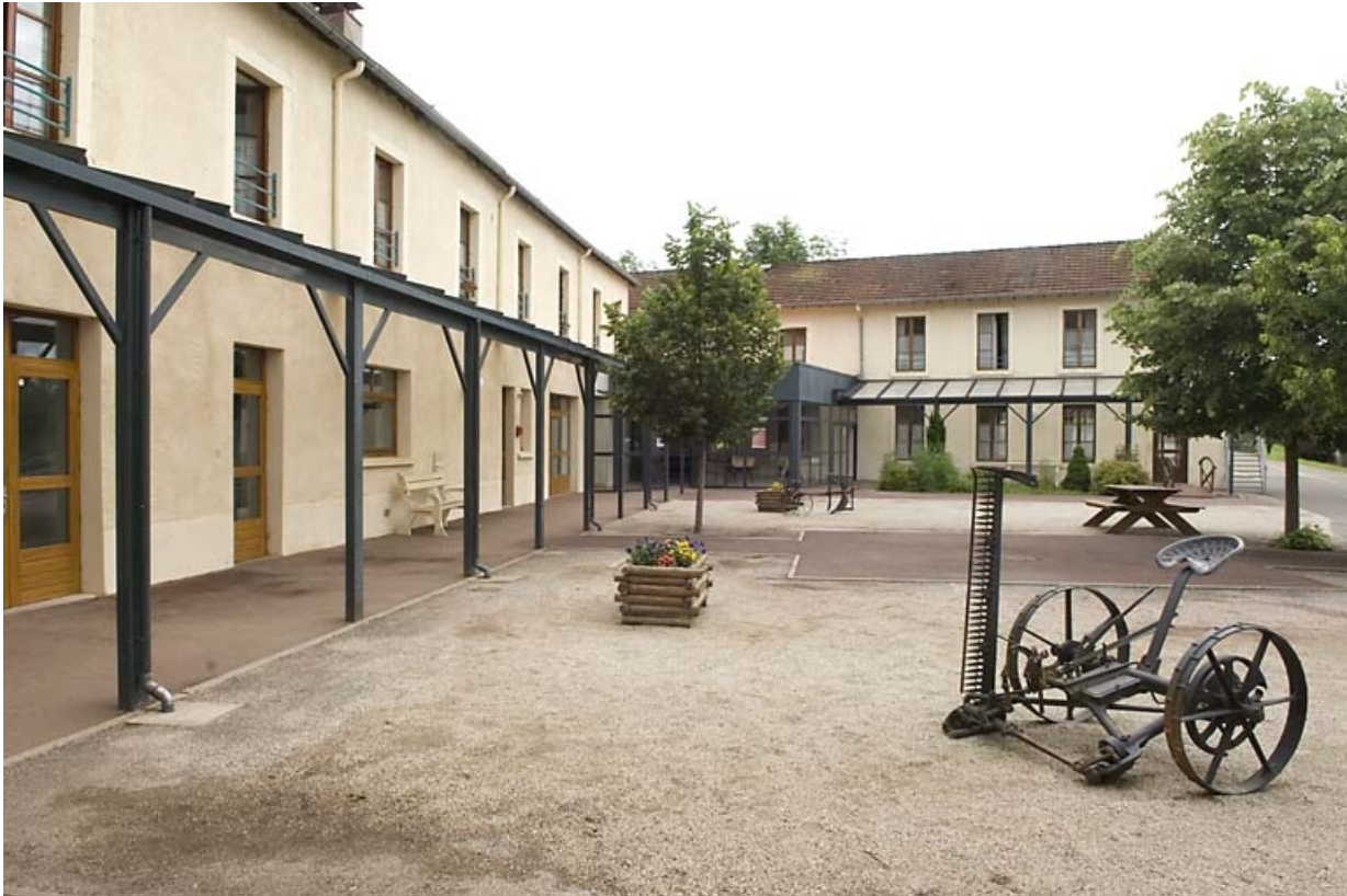
Ferme et orphelinat. Vue de la cour.