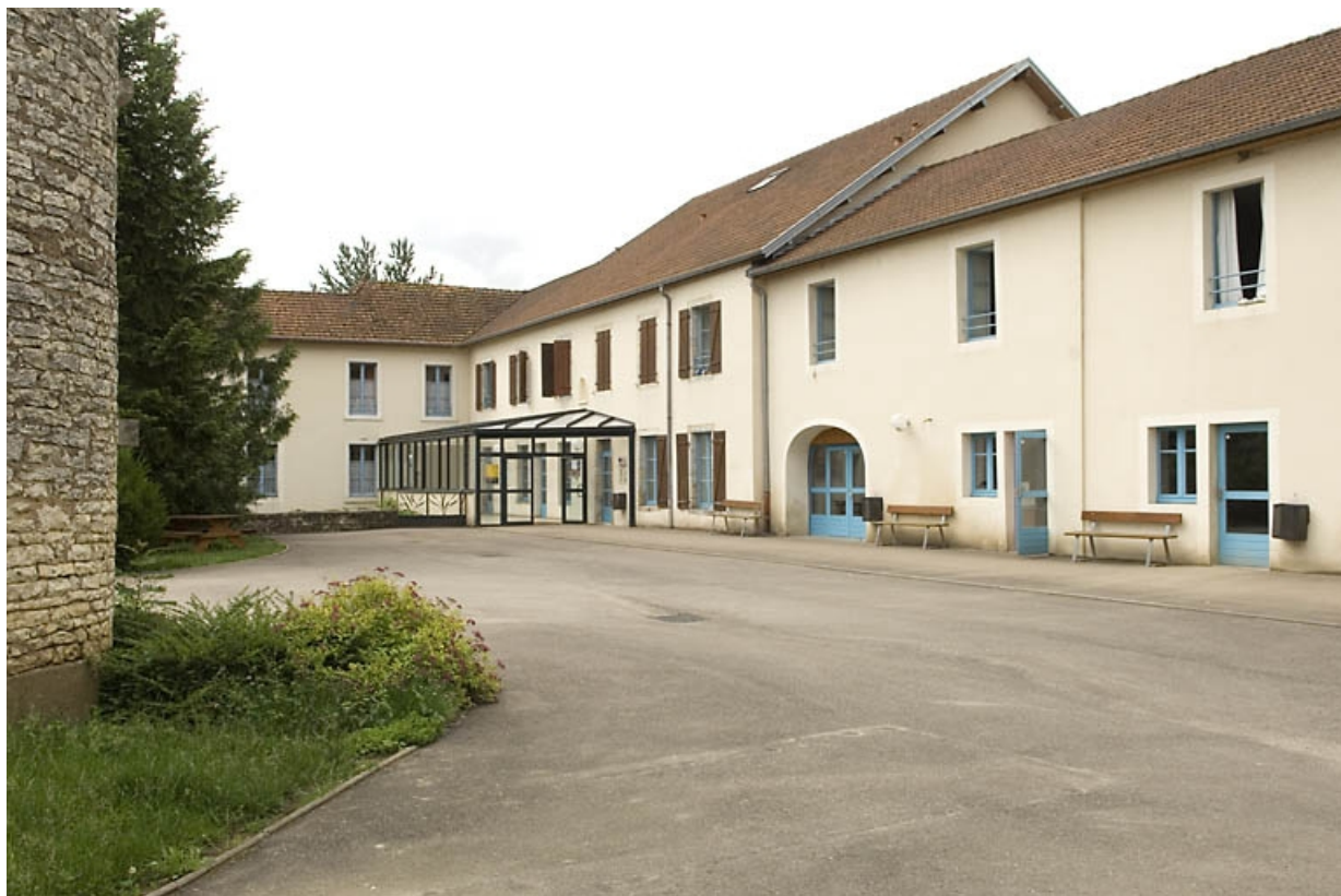
Façade est de l'atelier de fabrication (moulin et papeterie). 70, Montbozon, 6 rue Bressot