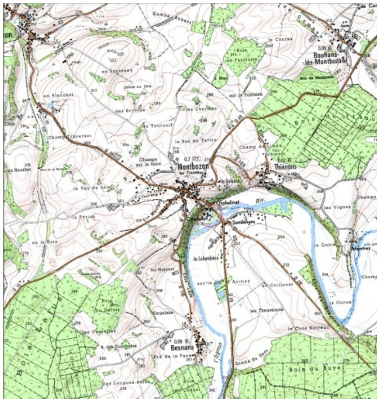
Carte de localisation. Carte topographique au 1:25000, I.G.N., Montbozon, 3422 O. SCAN 25 70, Montbozon, 6 rue Bressot