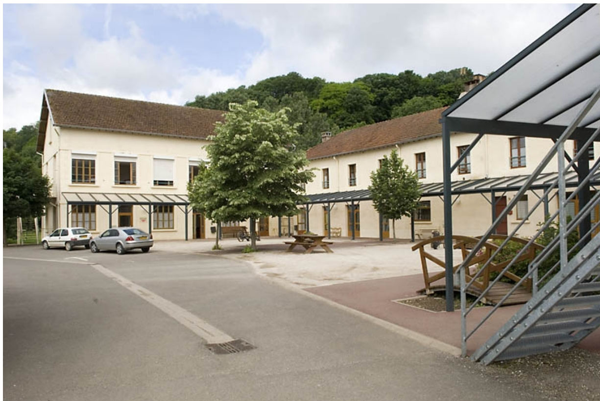
Ferme et orphelinat. Vue depuis l'est. 70, Montbozon, 6 rue Bressot