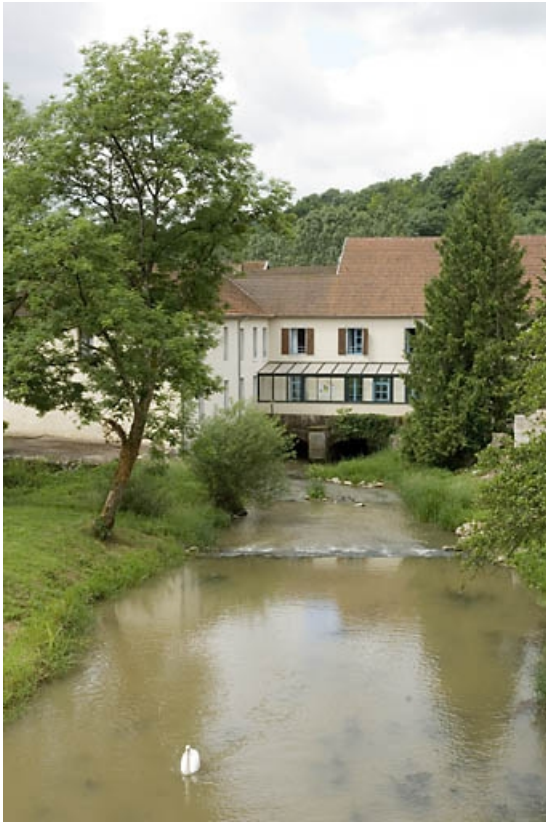
Bief d'amenée à l'usine.