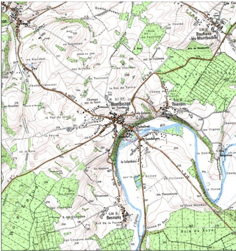
Carte de localisation. Carte topographique au 1:25000, I.G.N., Montbozon, 3422 O. SCAN 25 70, Montbozon, 6 rue Bressot