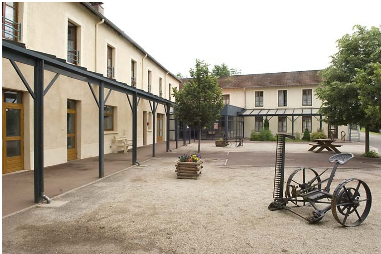
Ferme et orphelinat. Vue de la cour.