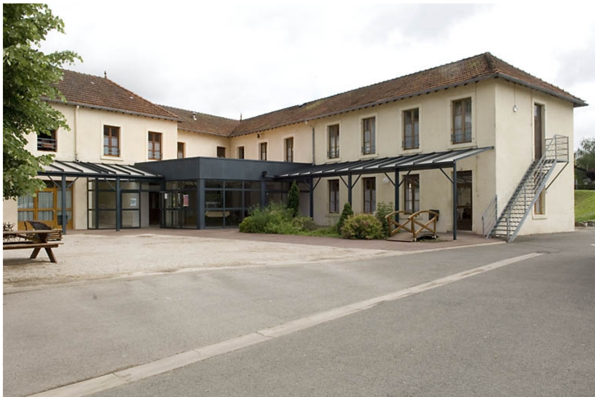
Ferme et orphelinat. Vue depuis le sud-ouest. 70, Montbozon, 6 rue Bressot