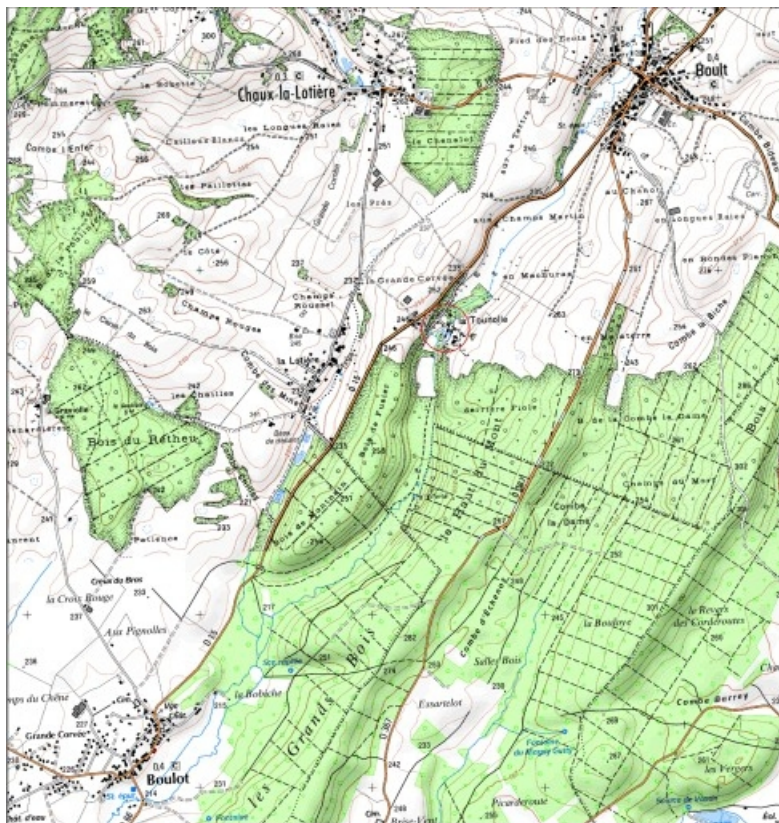
Carte de localisation. Carte topographique au 1:25000, I.G.N., Rioz, 3322 E. SCAN 25 70, Boulton, lieu-dit : la Tounolle