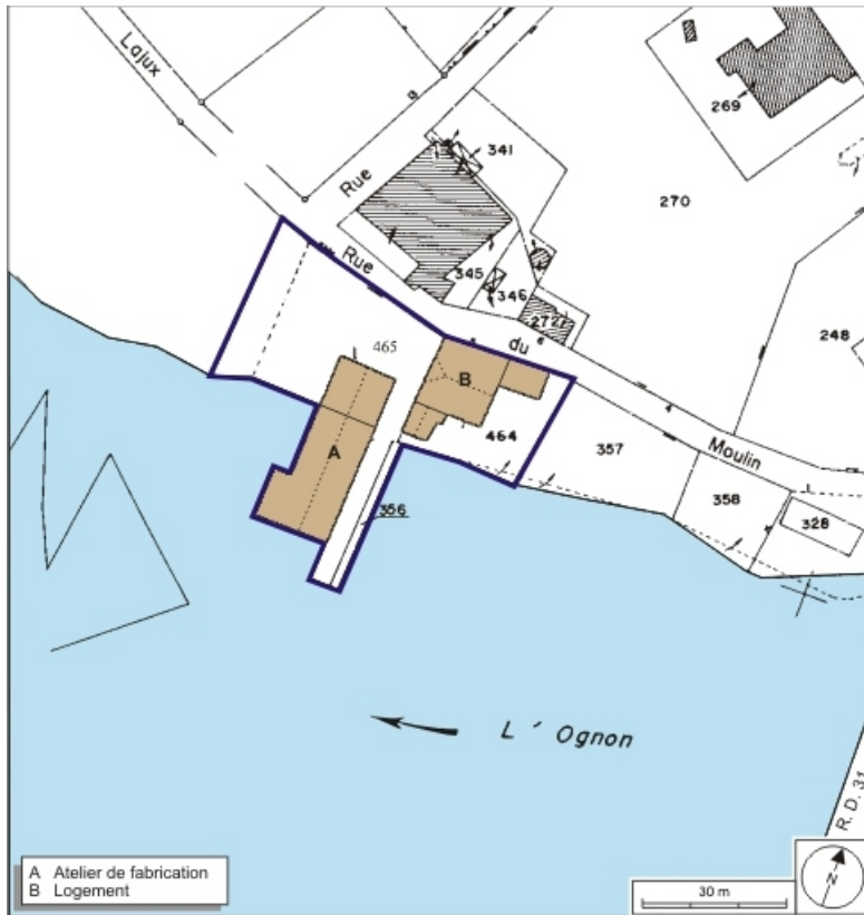
Plan-masse et de situation. Extrait du plan cadastral numérisé, 2008, section AB, 1:1000. Source : Direction générale des Finances Publiques - Cadastre ; mise à jour : 2008.