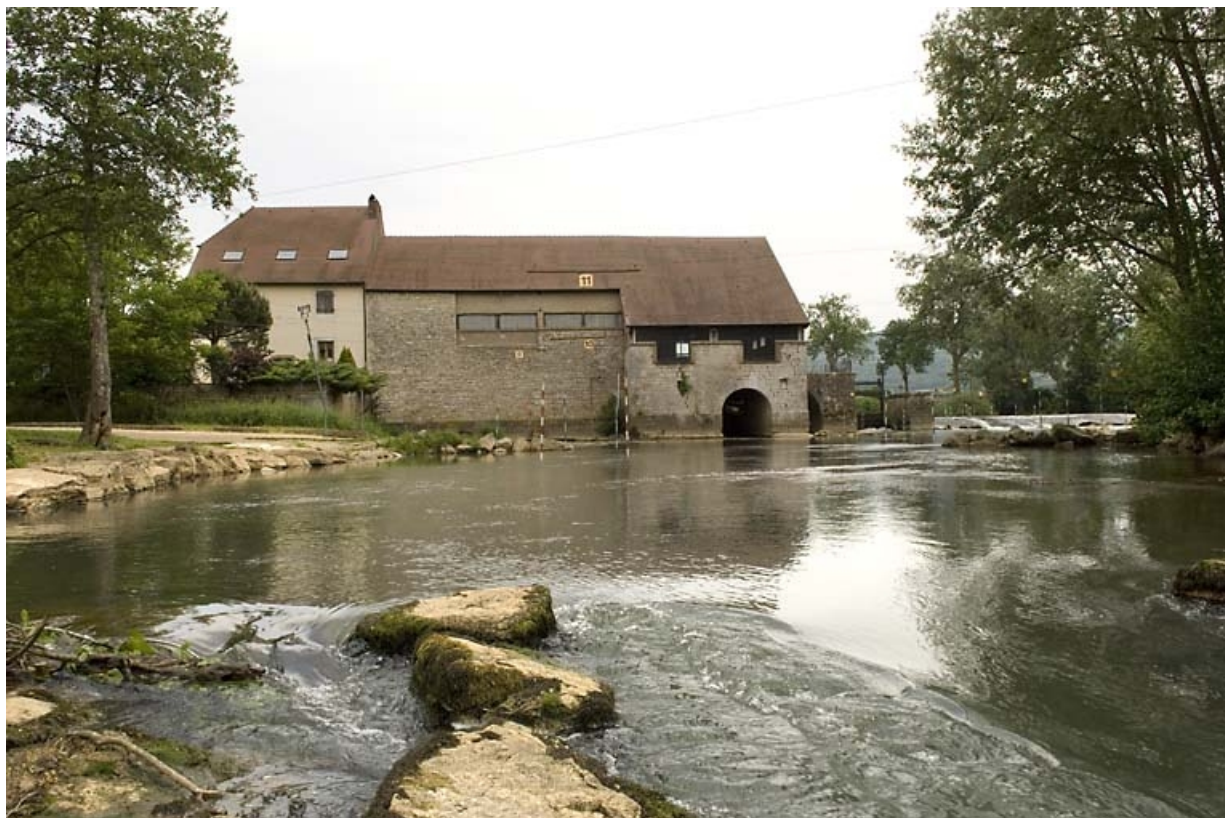
Vue d'ensemble depuis l'Ognon, en aval.