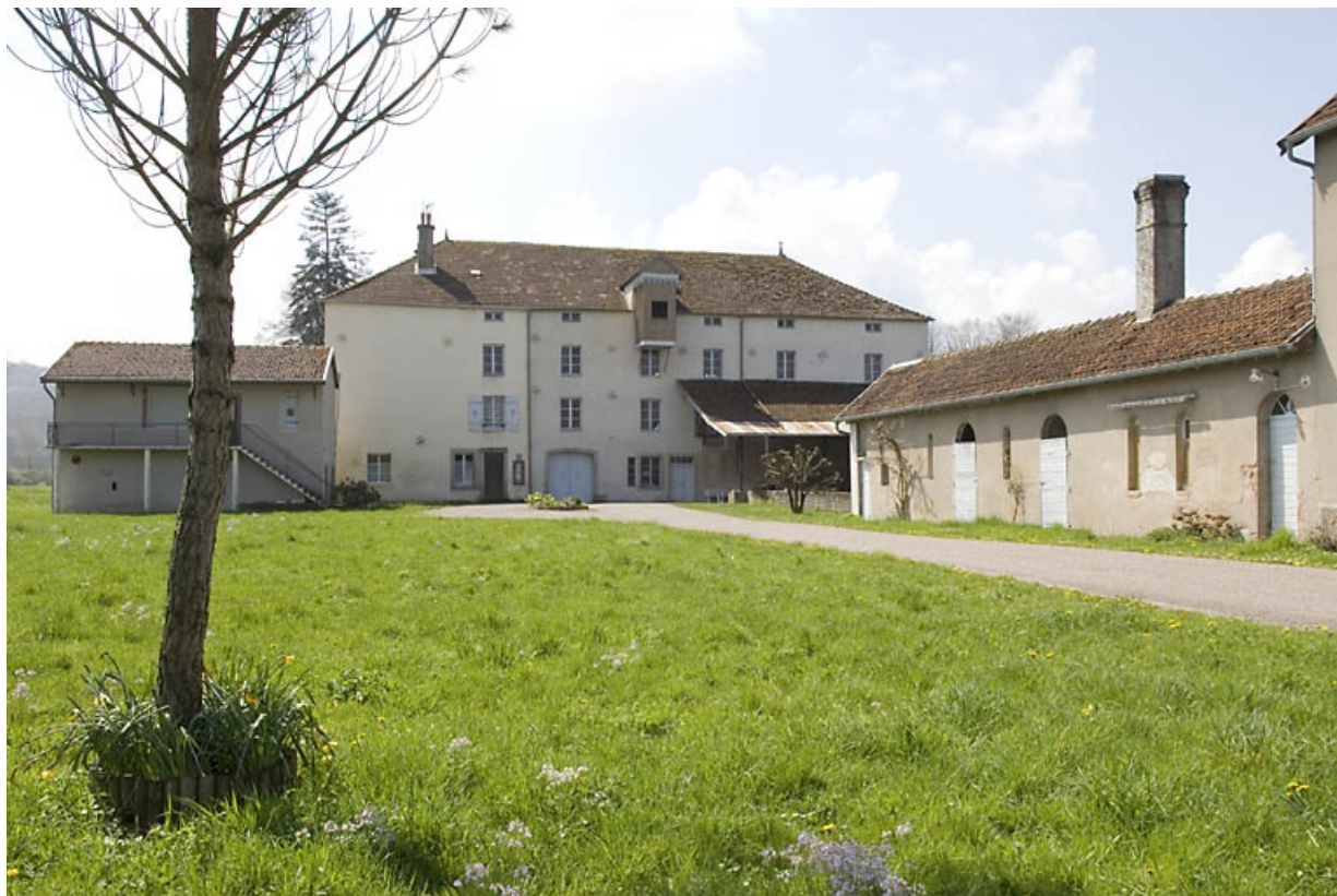
Façade antérieure et dépendances depuis l'entrée.

70, Ormoy, lieudit : le Moulin de Sainte-Clotilde