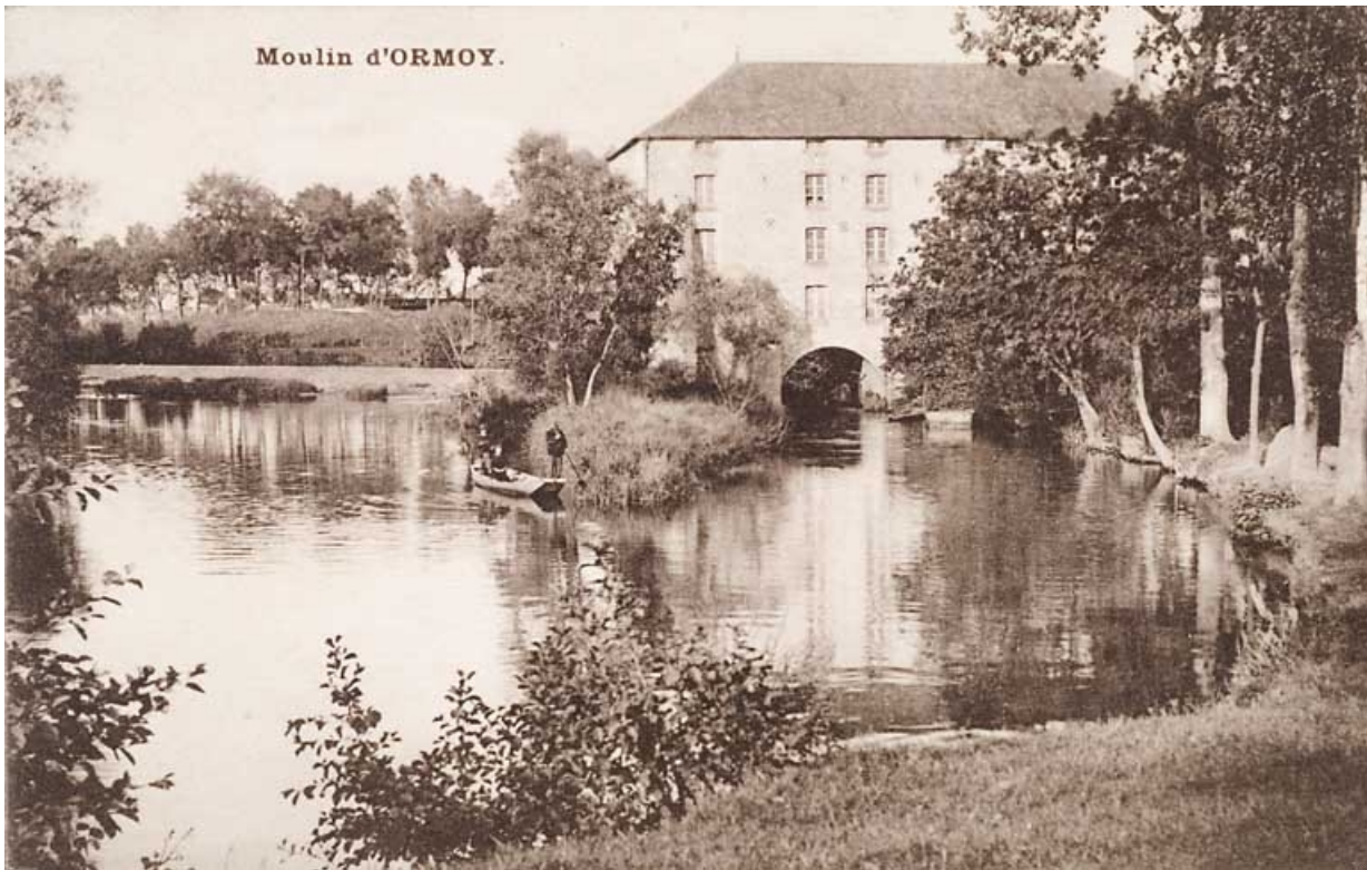
Moulin d'Ormoy. 70, Ormoy