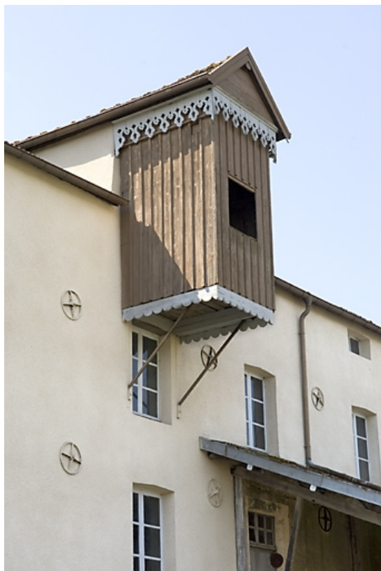
Façade antérieure. Edicule du monte-sac. 70, Ormoy, lieudit : le Moulin de Sainte-Clotilde