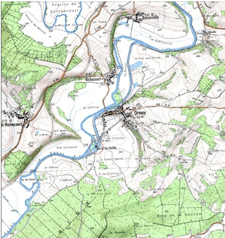
Carte de localisation. Carte topographique au 1:25000, I.G.N., Jussey, 3320 O. 70, Ormoy, lieudit : le Moulin de Sainte-Clotilde