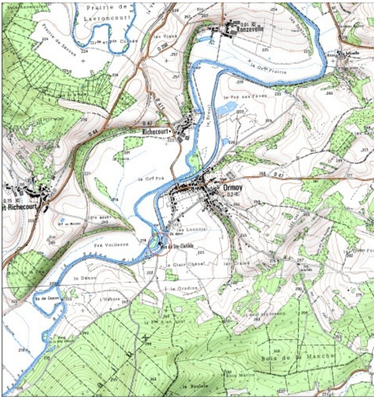
Carte de localisation. Carte topographique au 1:25000, I.G.N., Jussey, 3320 O. SCAN 25 70, Ormoy, lieudit : le Moulin de Sainte-Clotilde