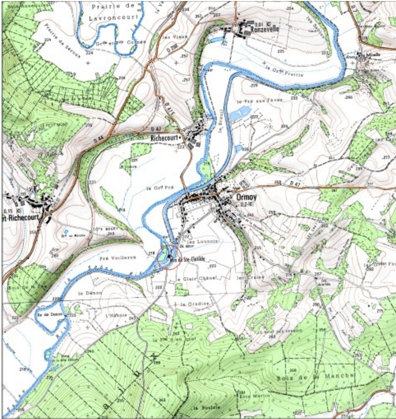
Carte de localisation. Carte topographique au 1:25000, I.G.N., Jussey, 3320 O. SCAN 25, Licence n°2008CISE29-68. 70, Ormoy, lieudit : le Moulin de Sainte-Clotilde