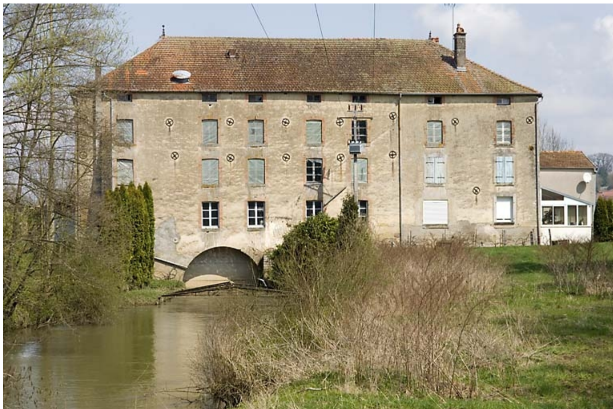
Façade postérieure vue de face.

70, Ormoy, lieudit : le Moulin de Sainte-Clotilde