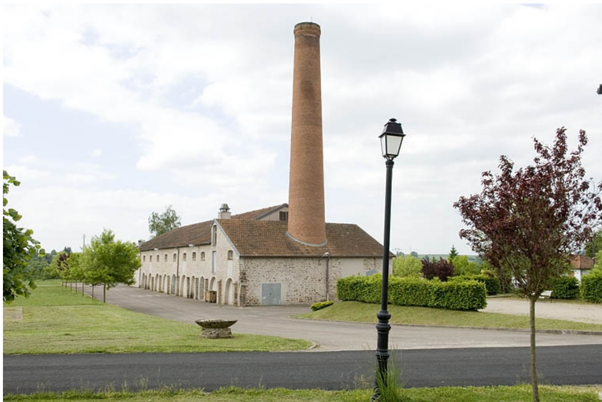
Vue depuis l'est.