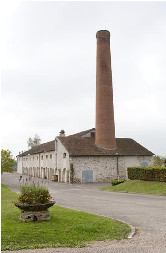
Vue depuis l'est (cadrage vertical).