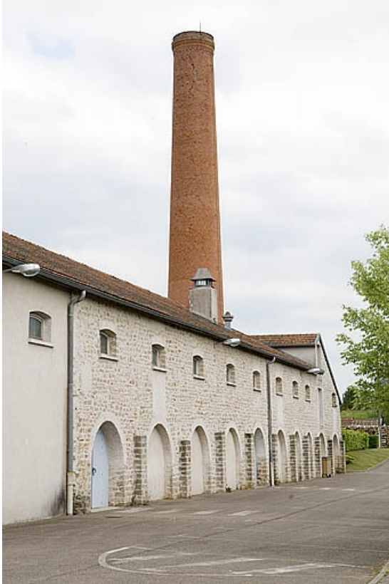
Façade nord vue de trois quarts gauche.