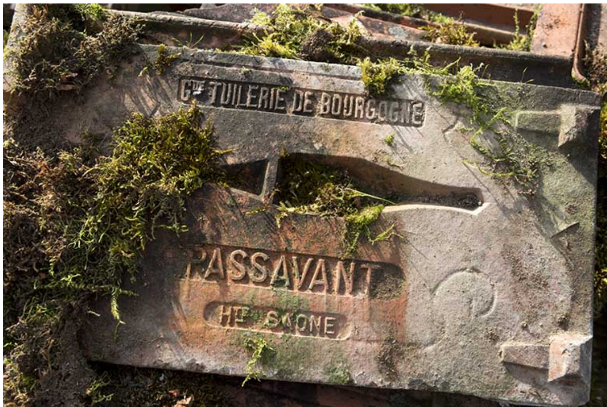
Tuile mécanique. Face interne.