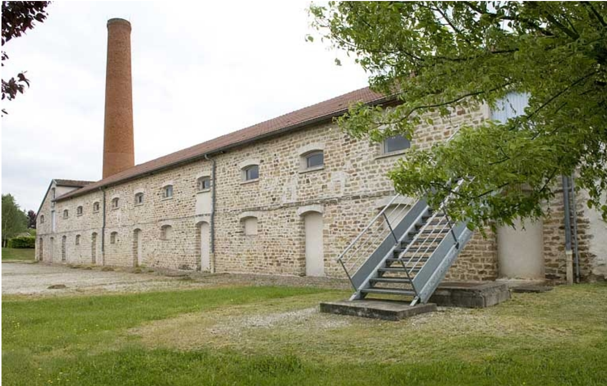
Façade nord vue de trois quarts droite.