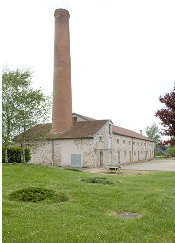
Vue de trois quarts depuis le nord-est.