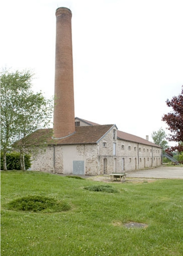
Vue de trois quarts depuis le nord-est.