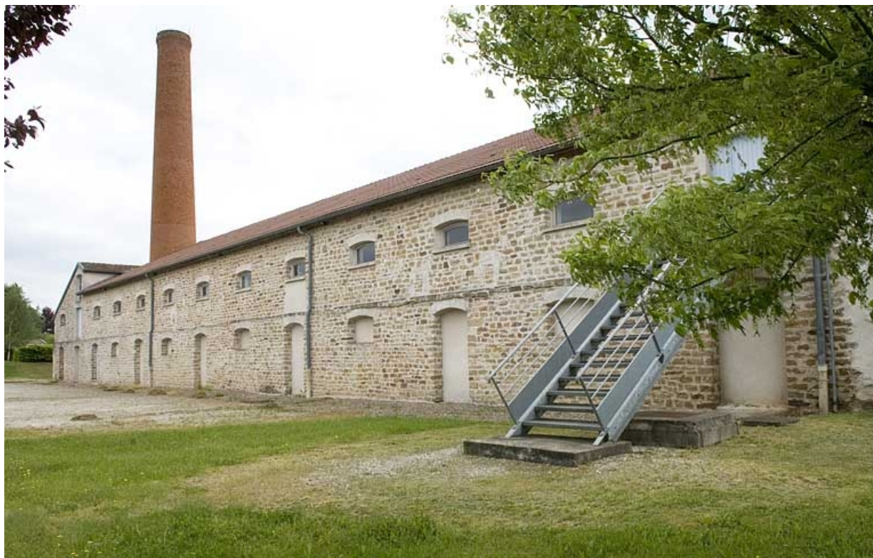
Façade nord vue de trois quarts droite.