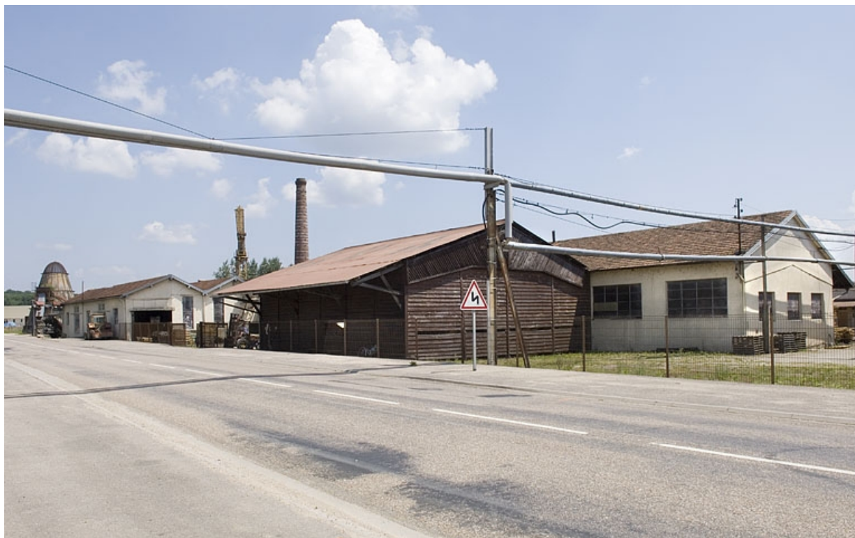
Vue d'ensemble depuis la rue Emile Hauviller.