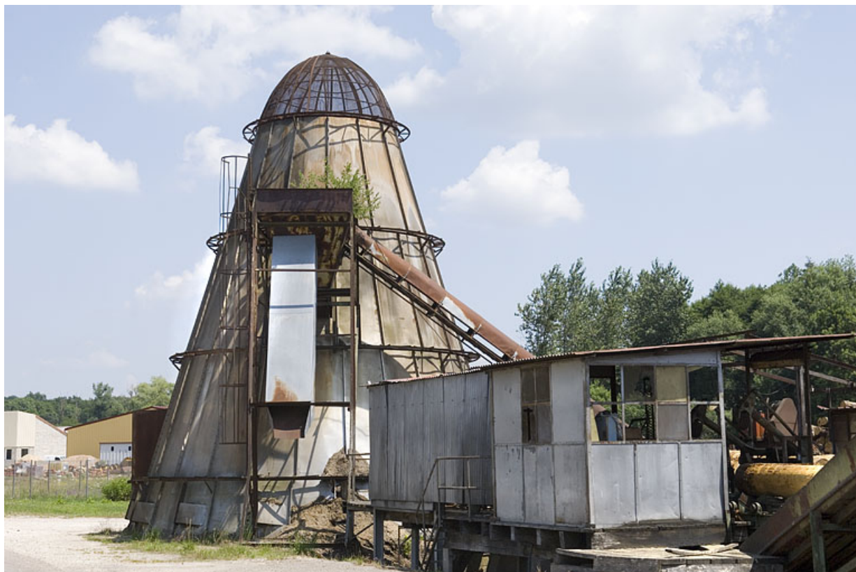
Poste d'écorçage et four à écorces.