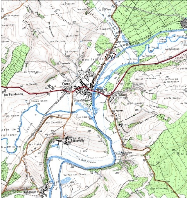
Carte de localisation. Carte topographique au 1:25000, I.G.N., Jussey, 3320 O. 70, Corre, 65 rue Emile Hauviller