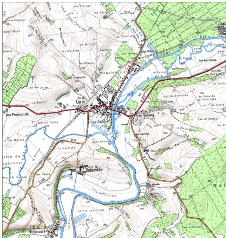
Carte de localisation. Carte topographique au 1:25000, I.G.N., Jussey, 3320 O. 70, Corre, 65 rue Emile Hauviller