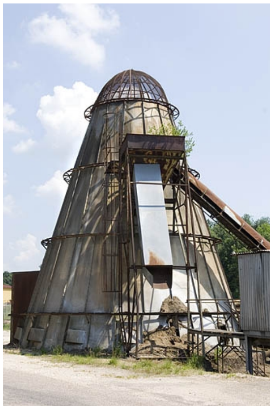
Four à écorces américain, depuis l'ouest.