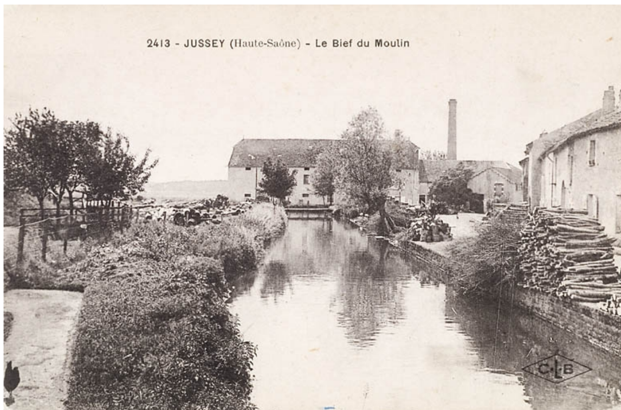
Jussey (Haute-Saône). - Le bief du Moulin.