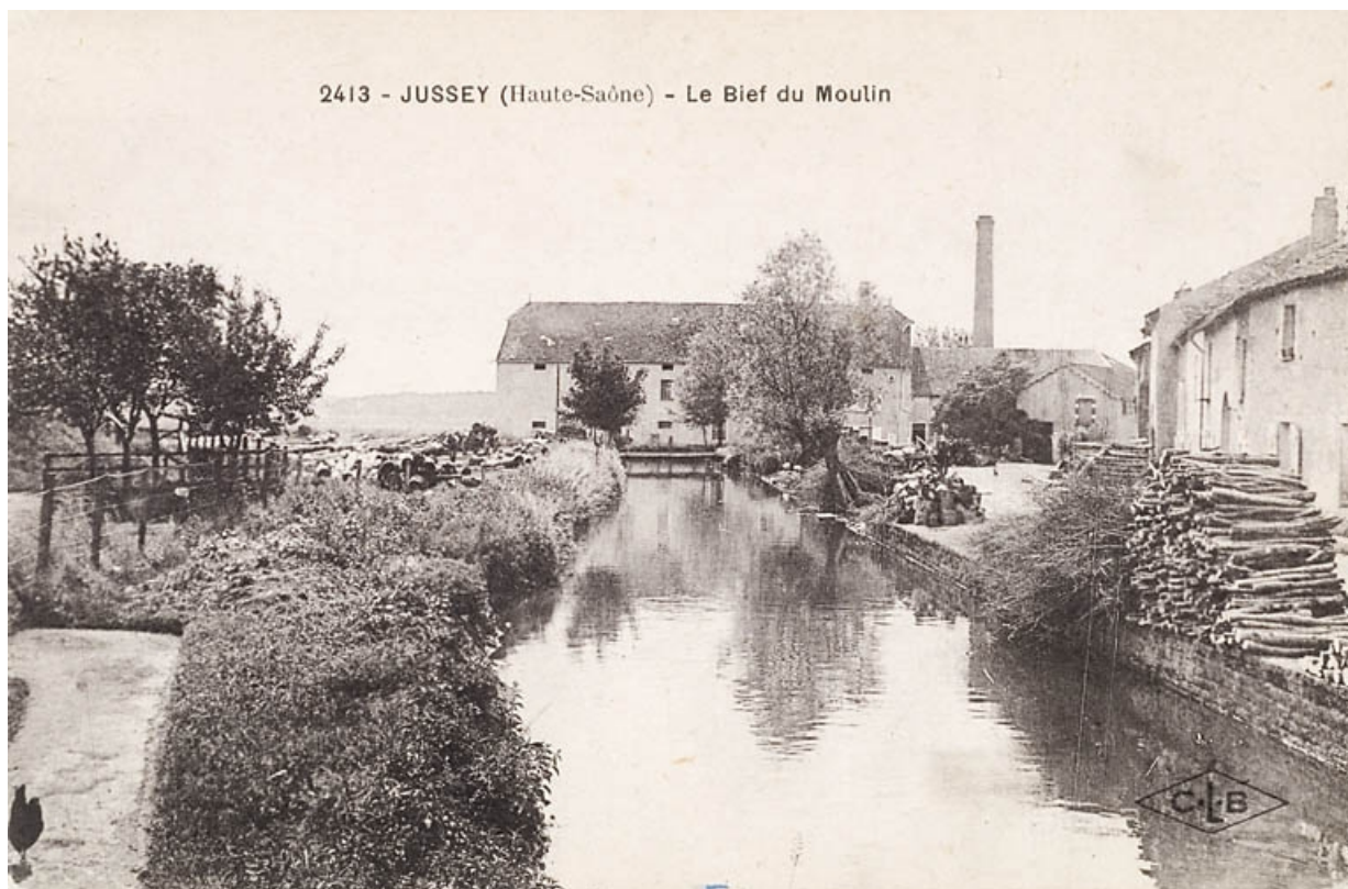
Jussey (Haute-Saône). - Le bief du Moulin.