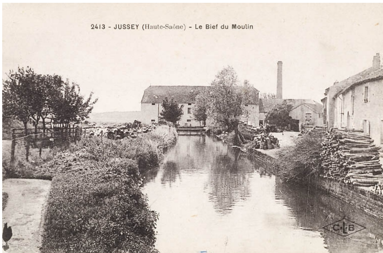
Jussey (Haute-Saône). - Le bief du Moulin.