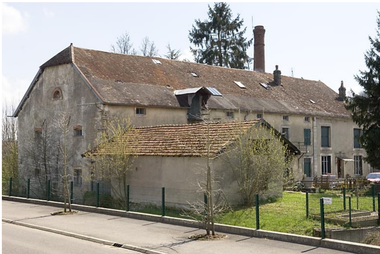
Vue d'ensemble depuis le nord.