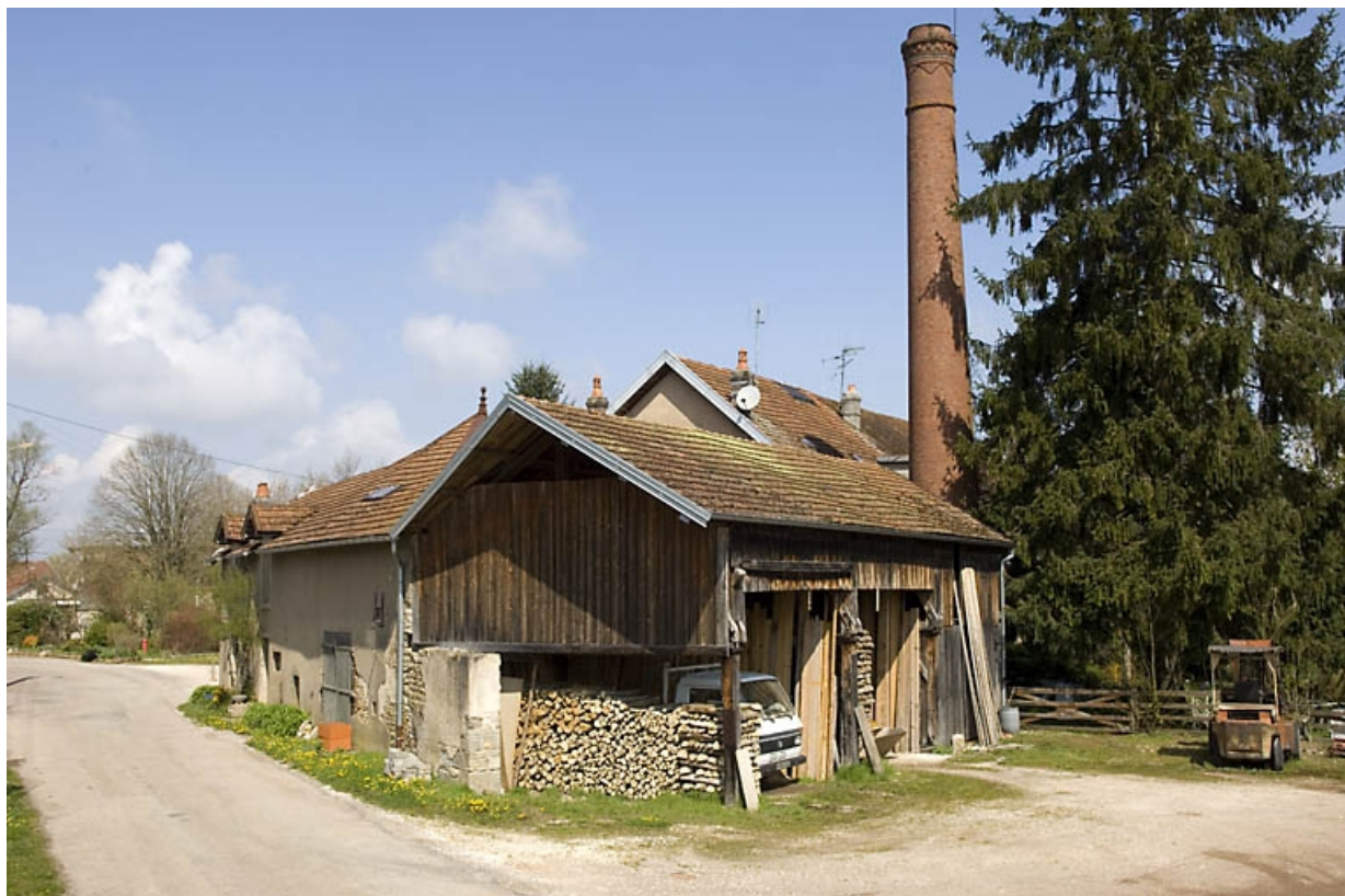
Atelier et cheminée de la scierie depuis le sud (cadrage horizontal). 70, Jussey, 25 rue de la Pêcherie