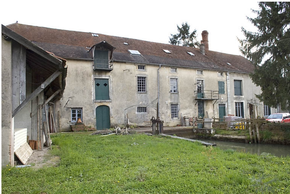
Façade antérieure depuis le nord-ouest.