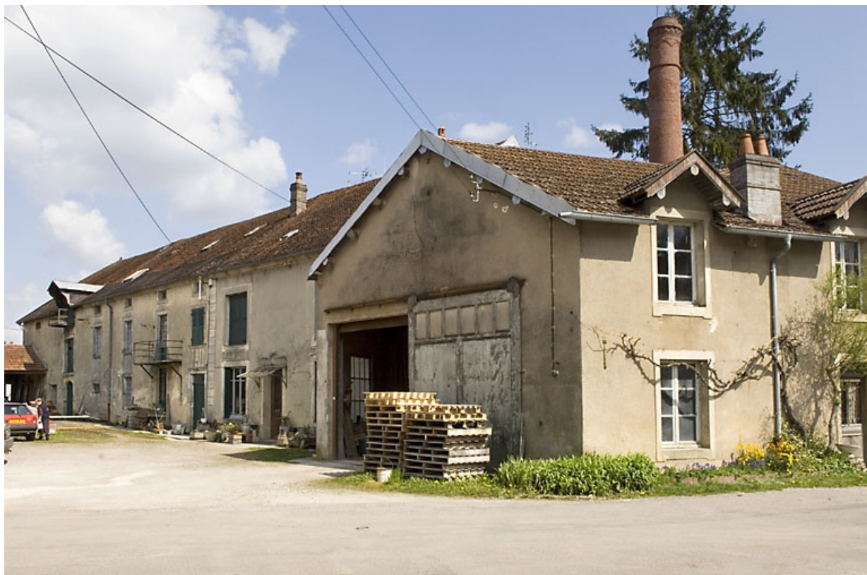
Façade antérieure du moulin vue de trois quarts.