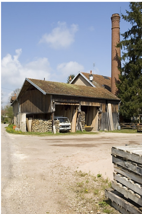
Atelier et cheminée de la scierie depuis le sud (cadrage vertical).