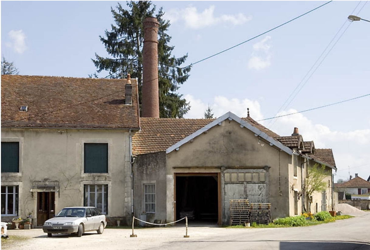
Logement du moulin et remise de la scierie.