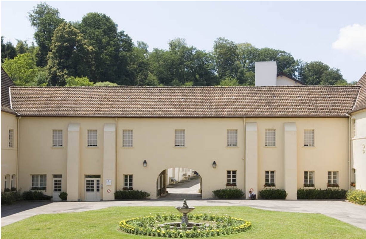
Aile ouest sur cour.

70, Polaincourt-et-Clairefontaine, lieudit : Clairefontaine