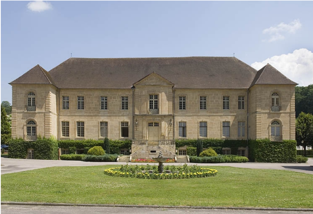
Logis abbatial. Vue de face.

70, Polaincourt-et-Clairefontaine, lieudit : Clairefontaine