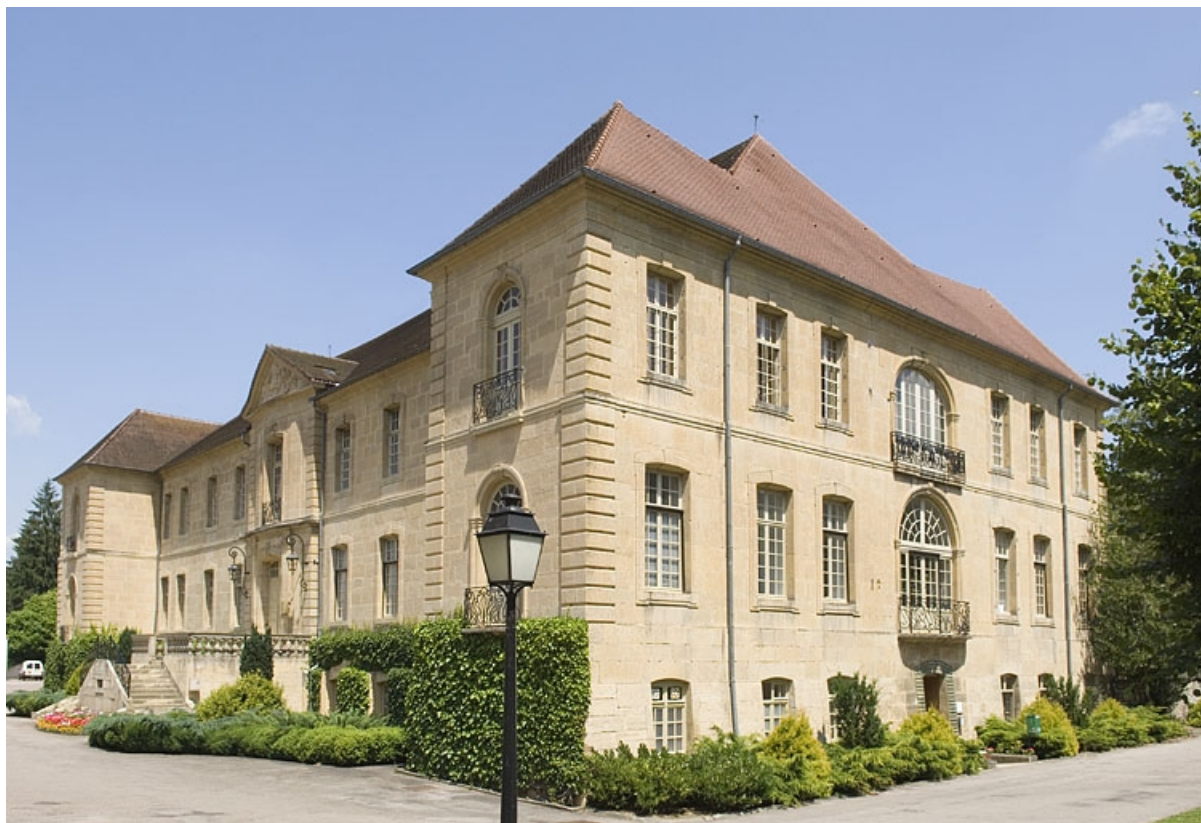
Logis abbatial. Vue de trois quarts droite.