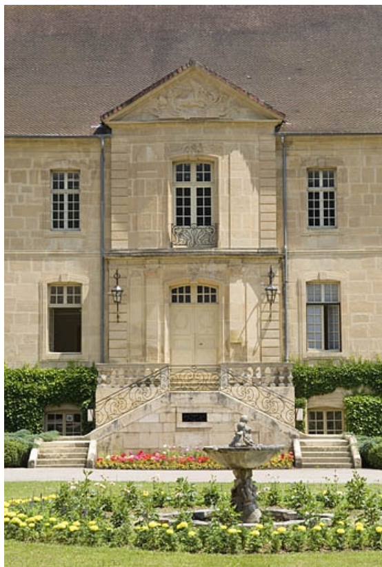
Logis abbatial. Avant-corps central.

70, Polaincourt-et-Clairefontaine, lieudit : Clairefontaine