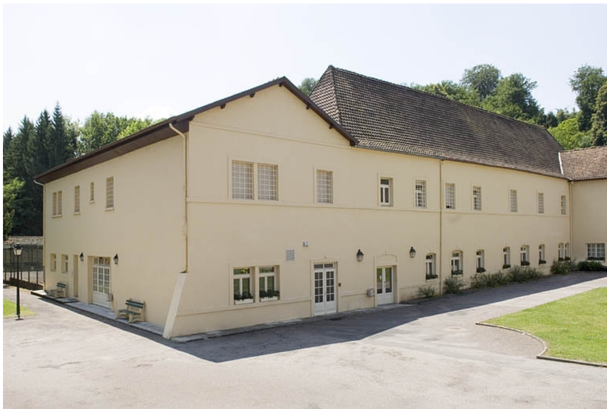
Aile sud (ancien atelier de préparation de la pâte).

70, Polaincourt-et-Clairefontaine, lieudit : Clairefontaine