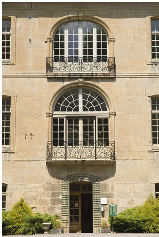
Façade sud du logis abbatial. Travée centrale.

70, Polaincourt-et-Clairefontaine, lieudit : Clairefontaine