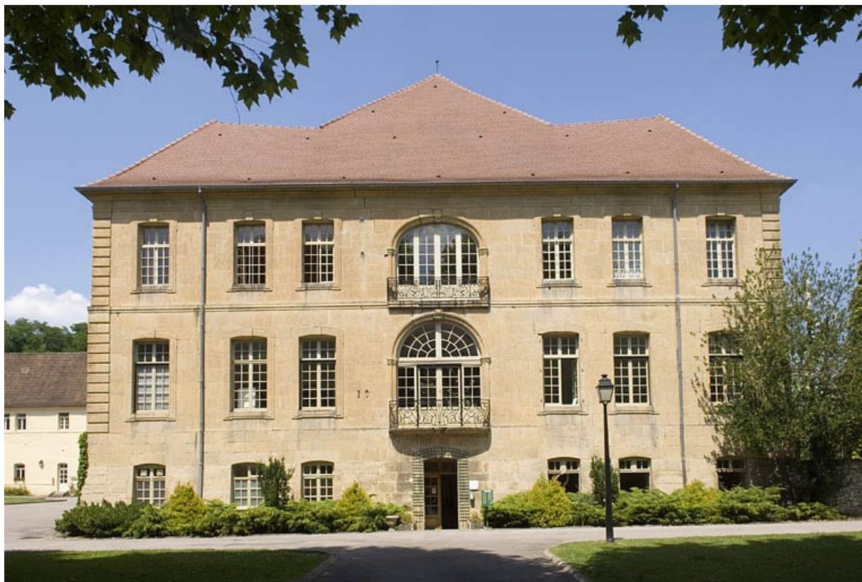
Logis abbatial. Façade sud.

70, Polaincourt-et-Clairefontaine, lieudit : Clairefontaine