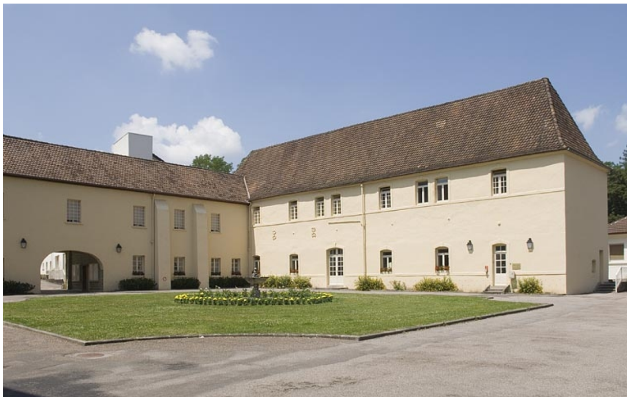
Aile nord vue de trois quarts.

70, Polaincourt-et-Clairefontaine, lieudit : Clairefontaine