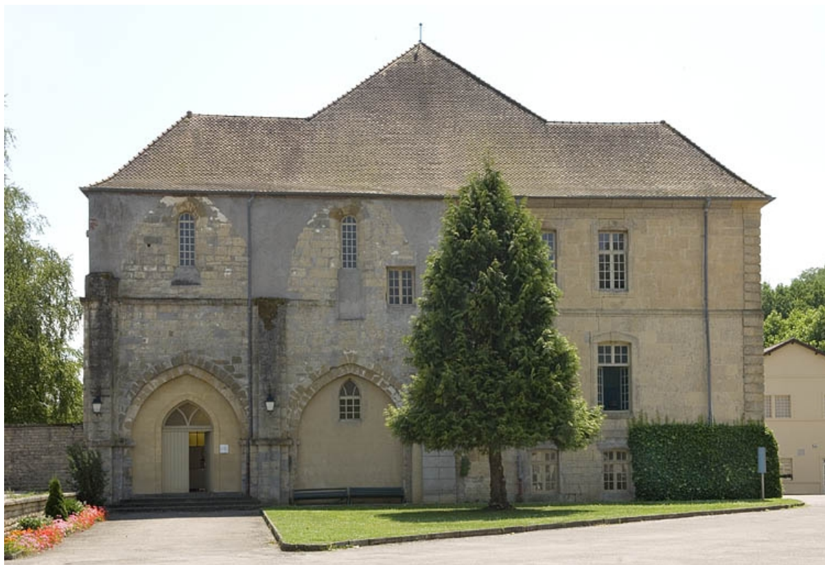
Logis abbatial. Façade nord.

70, Polaincourt-et-Clairefontaine, lieudit : Clairefontaine