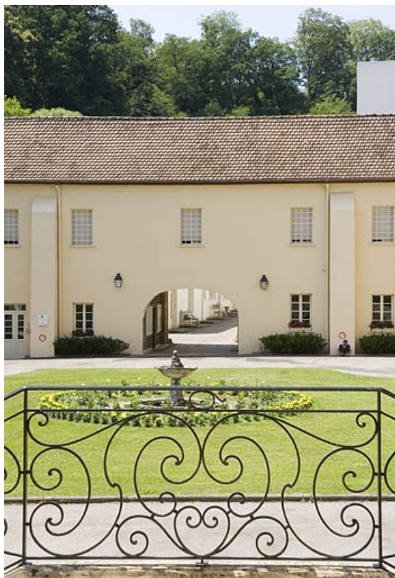
Entrée de l'abbaye depuis le logis.

70, Polaincourt-et-Clairefontaine, lieu dit : Clairefontaine