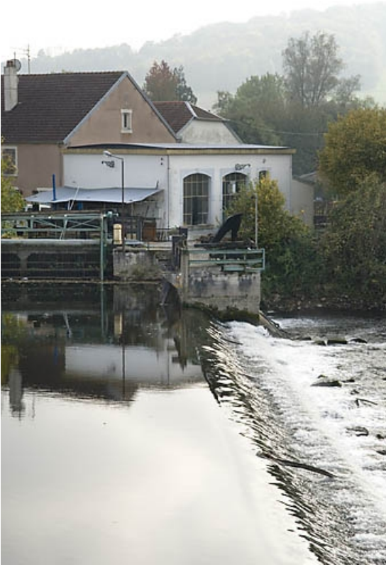
La centrale et le barrage depuis le pont.