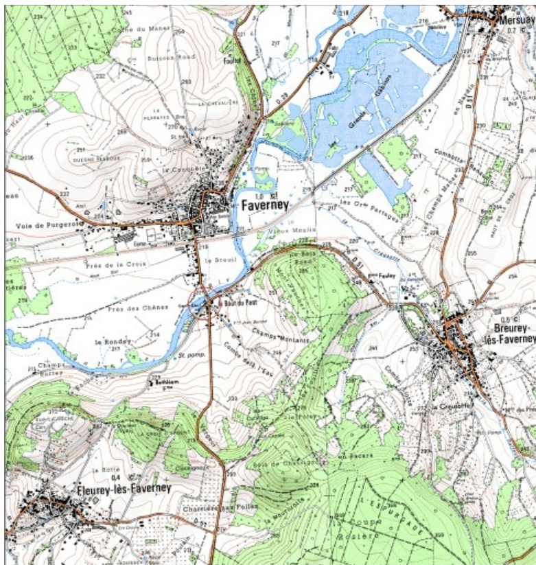
Carte de localisation. Carte topographique au 1:25000, I.G.N., Faverney, 3320 E. Licence n°2008CISE29-68. 70, Faverney, 5 route de Fleurey