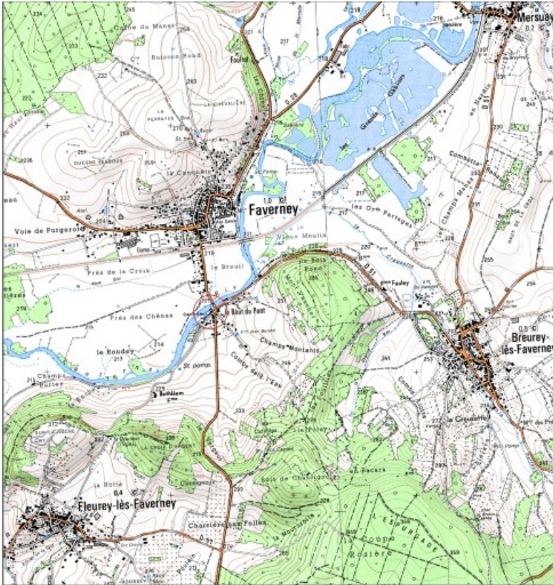
Carte de localisation. Carte topographique au 1:25000, I.G.N., Faverney, 3320 E. SCAN 25 70, Faverney, 5 route de Fleurey