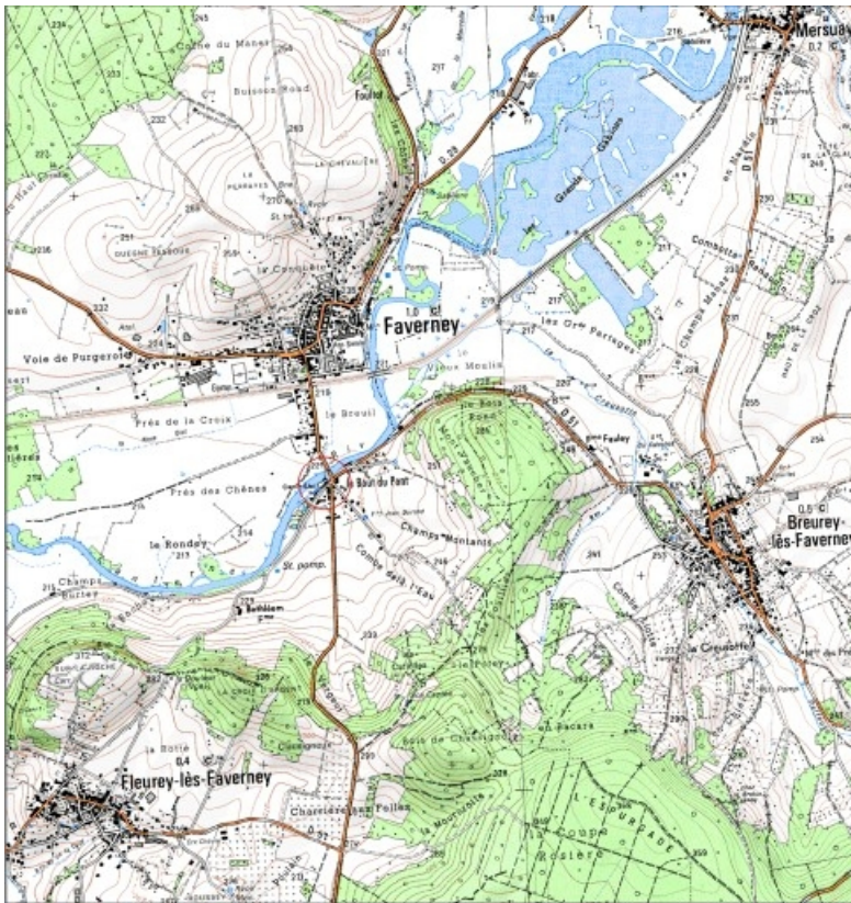
Carte de localisation. Carte topographique au 1:25000, I.G.N., Faverney, 3320 E. 70, Faverney, 5 route de Fleurey