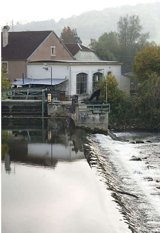
La centrale et le barrage depuis le pont.