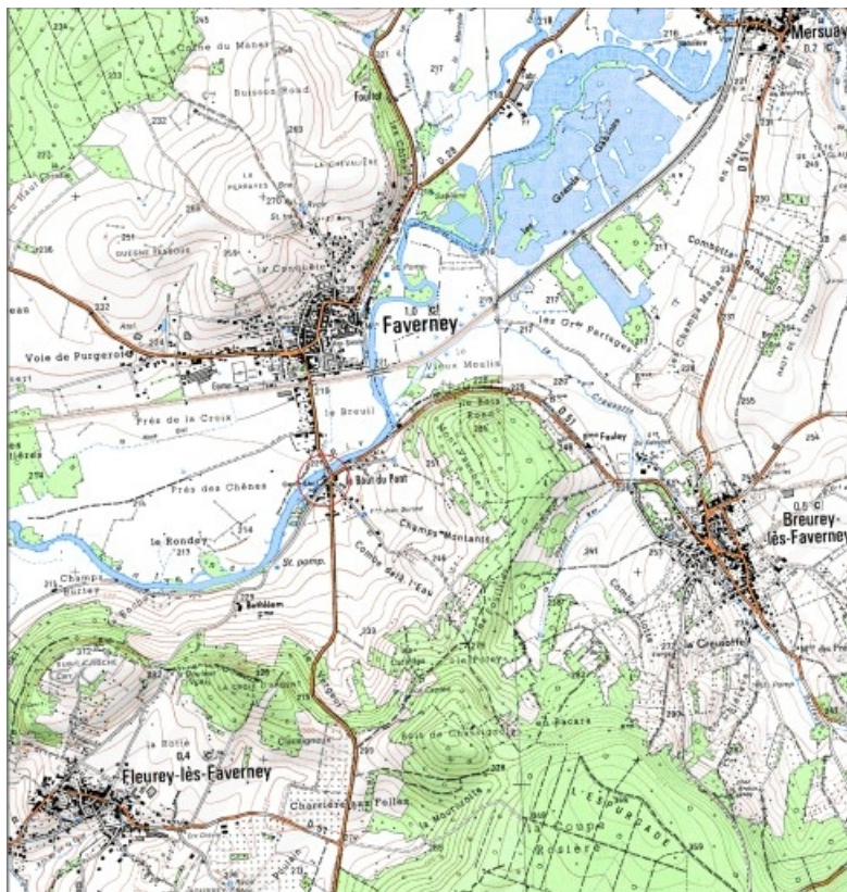
Carte de localisation. Carte topographique au 1:25000, I.G.N., Faverney, 3320 E. 70, Faverney, 5 route de Fleurey