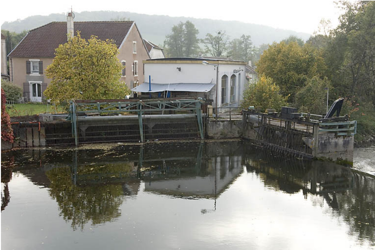
Vue d'ensemble depuis le pont.