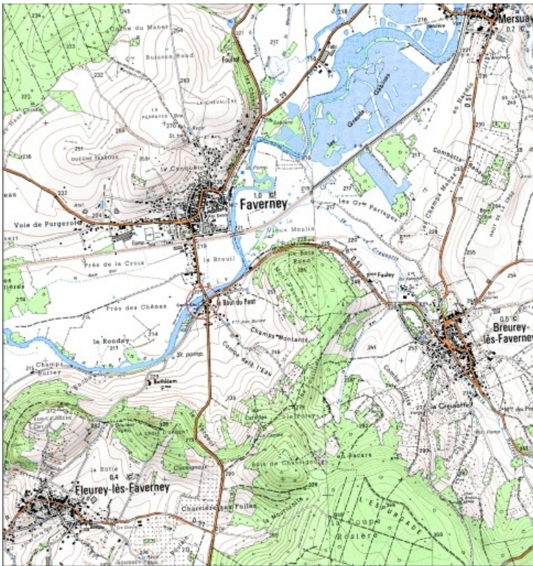
Carte de localisation. Carte topographique au 1:25000, I.G.N., Faverney, 3320 E. SCAN 25, Licence n°2008CISE29-68. 70, Faverney, 5 route de Fleurey