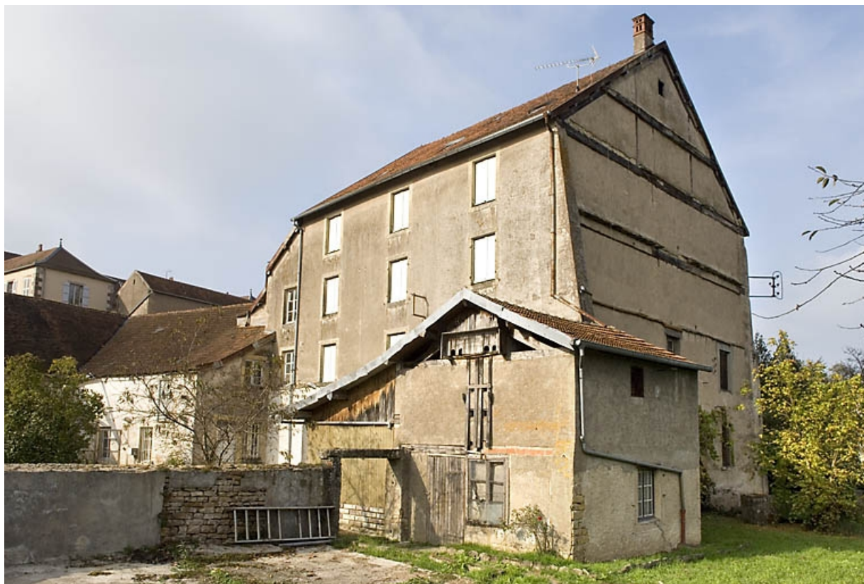
Elévation de l'atelier de minoterie.