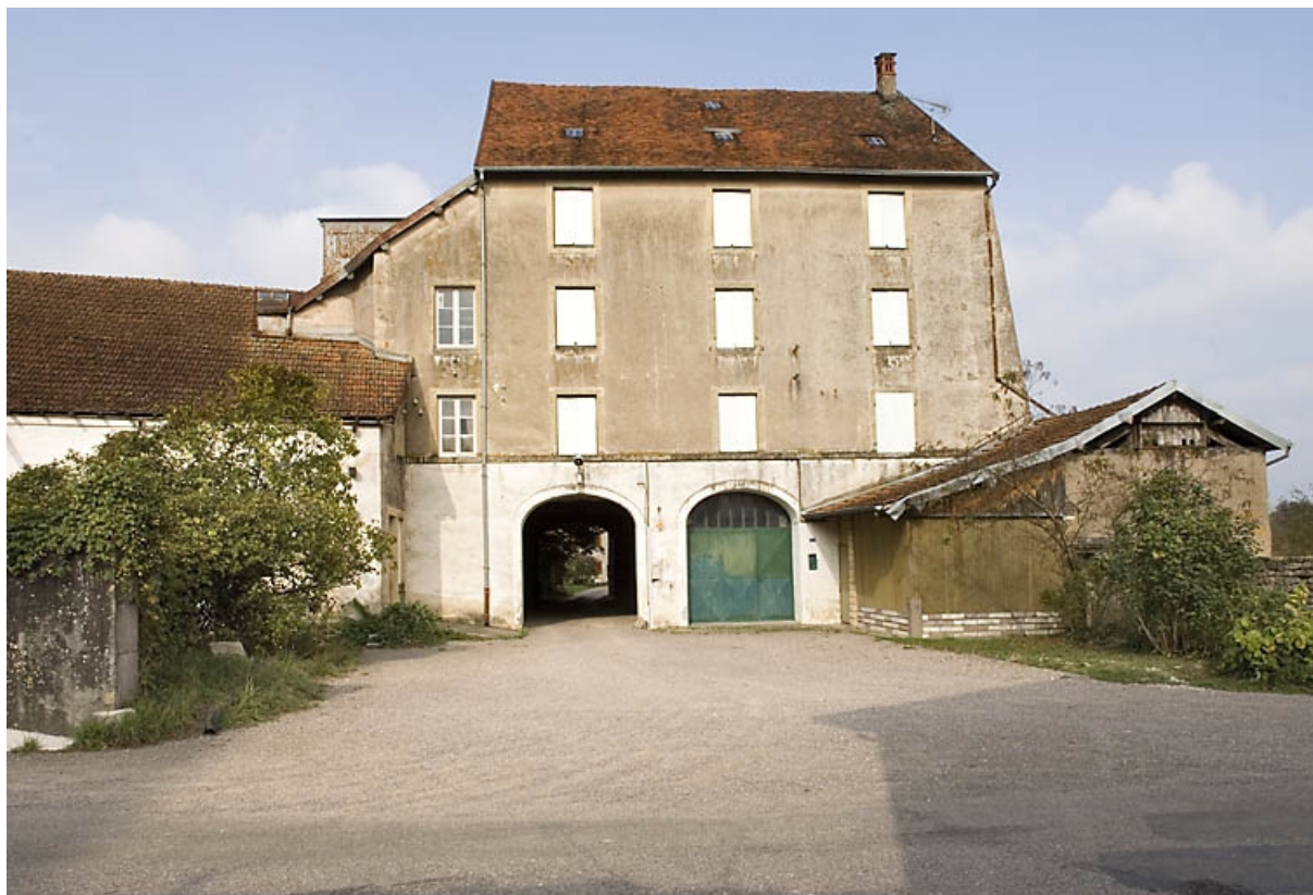
Façade antérieure vue de face.