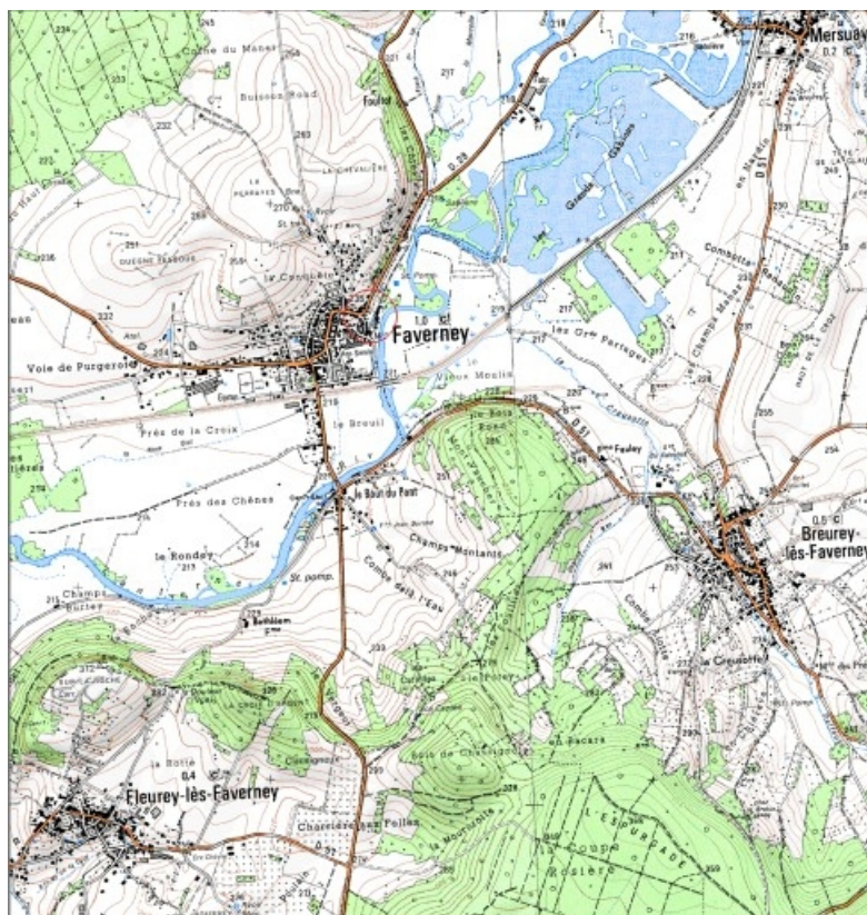
Carte de localisation. Carte topographique au 1:25000, I.G.N., Faverney, 3320 E. SCAN 25 70, Faverney, 7 rue de l' Abbaye