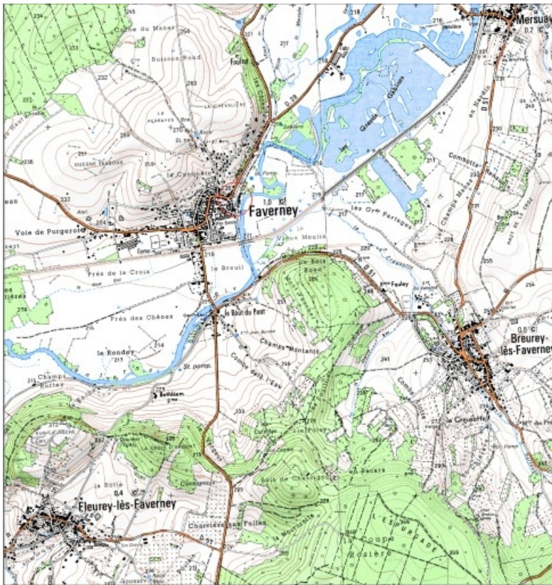
Carte de localisation. Carte topographique au 1:25000, I.G.N., Faverney, 3320 E. 70, Faverney, 7 rue de l' Abbaye