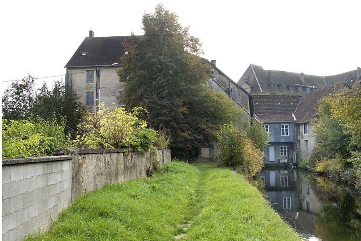
Façade postérieure depuis l'amont du bief.