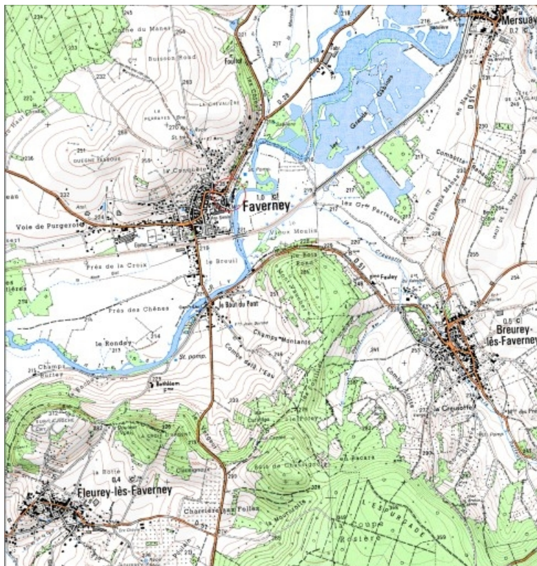
Carte de localisation. Carte topographique au 1:25000, I.G.N., Faverney, 3320 E. SCAN 25, Licence n°2008CISE29-68. 70, Faverney, 7 rue de l' Abbaye