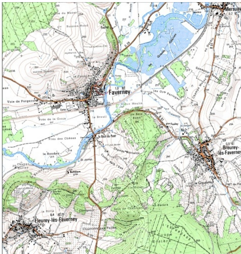
Carte de localisation. Carte topographique au 1:25000, I.G.N., Faverney, 3320 E. 70, Faverney, 7 rue de l' Abbaye