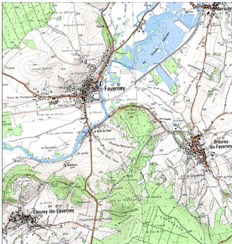
Carte de localisation. Carte topographique au 1:25000, I.G.N., Faverney, 3320 E. SCAN 25, Licence n°2008CISE29-68. 70, Faverney, 7 rue de l' Abbaye