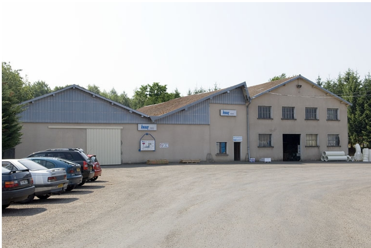
Magasin et entrepôt industriels depuis l'entrée.