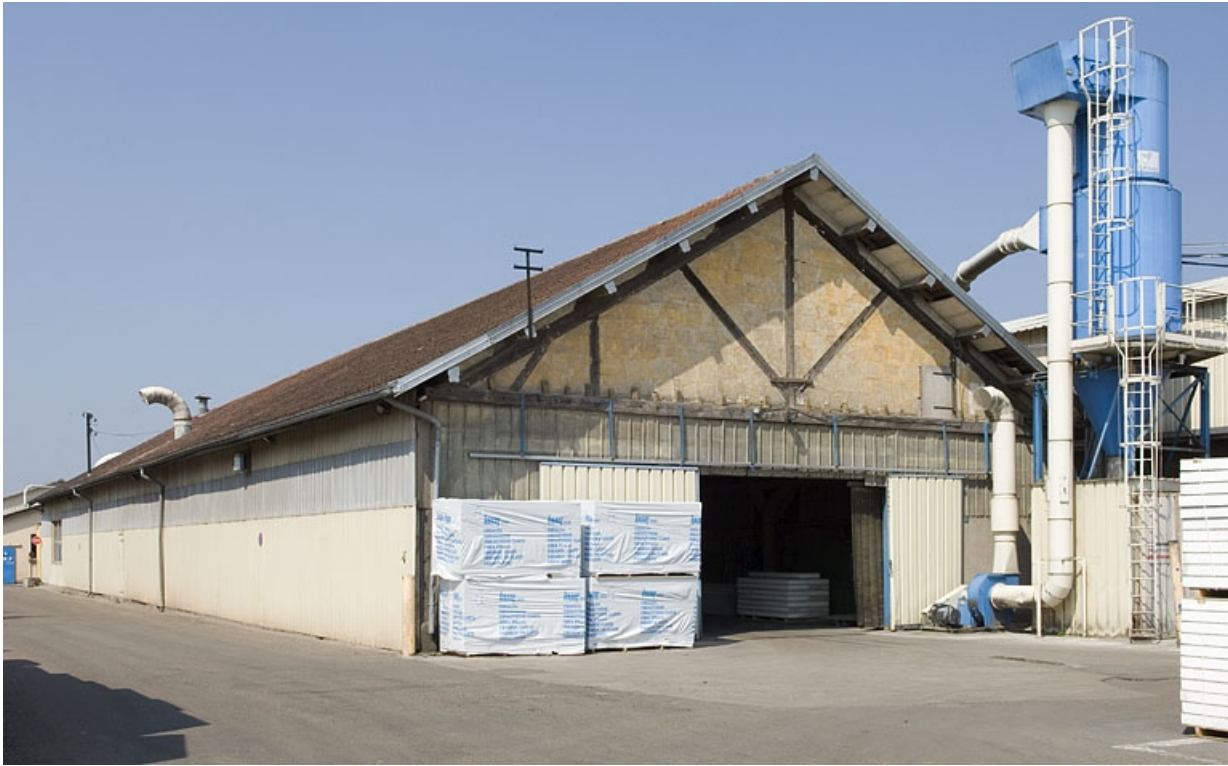
Atelier de fabrication vu de trois quarts.