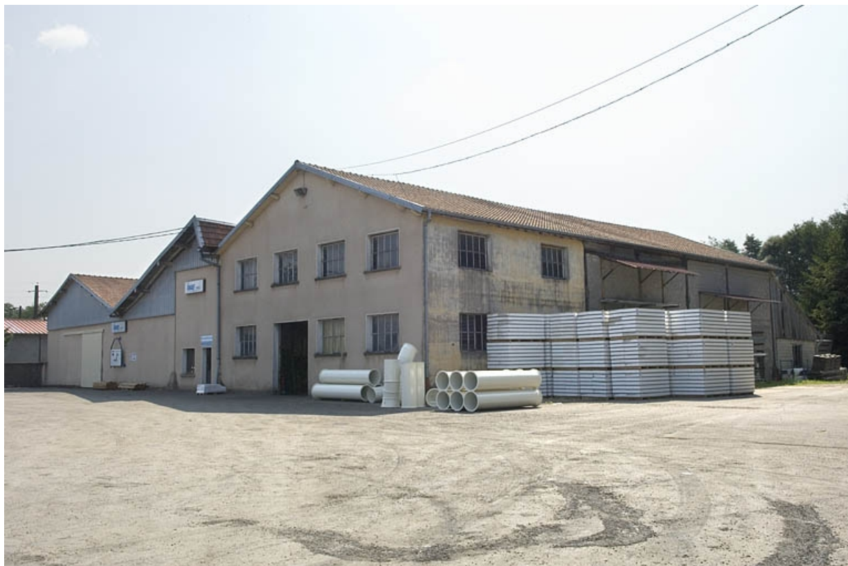
Magasin industriel (ancien four culée).