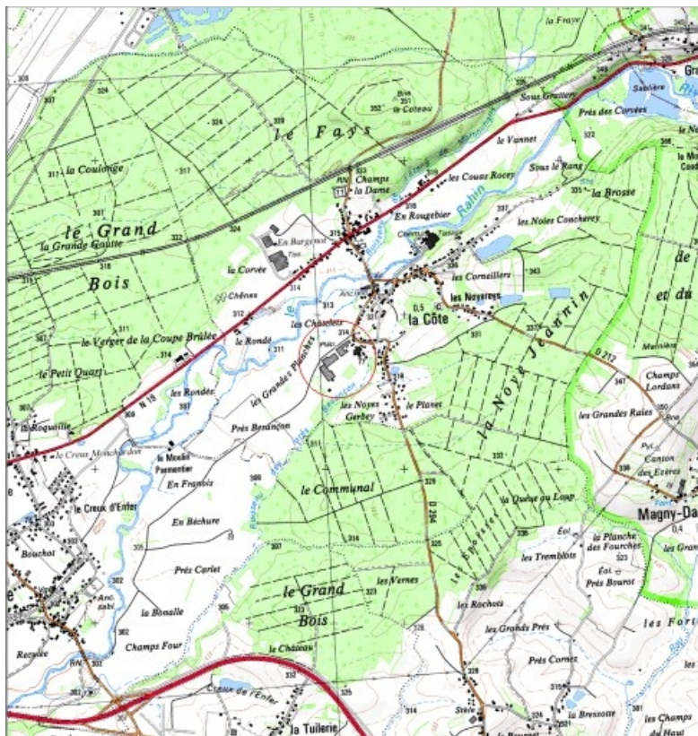
Carte de localisation. Carte topographique au 1:25000, I.G.N., Lure, 3521 O. 70, La Côte, 14 route de Palante