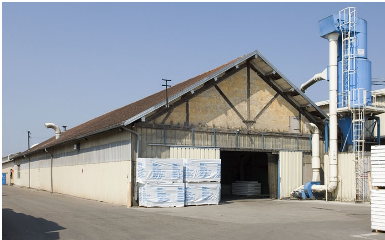
Atelier de fabrication vu de trois quarts.