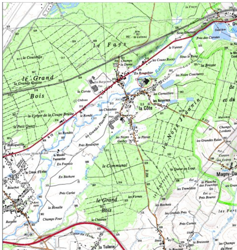
Carte de localisation. Carte topographique au 1:25000, I.G.N., Lure, 3521 O. SCAN 25, Licence n°2008CISE29-68. 70, La Côte rue du Tissage