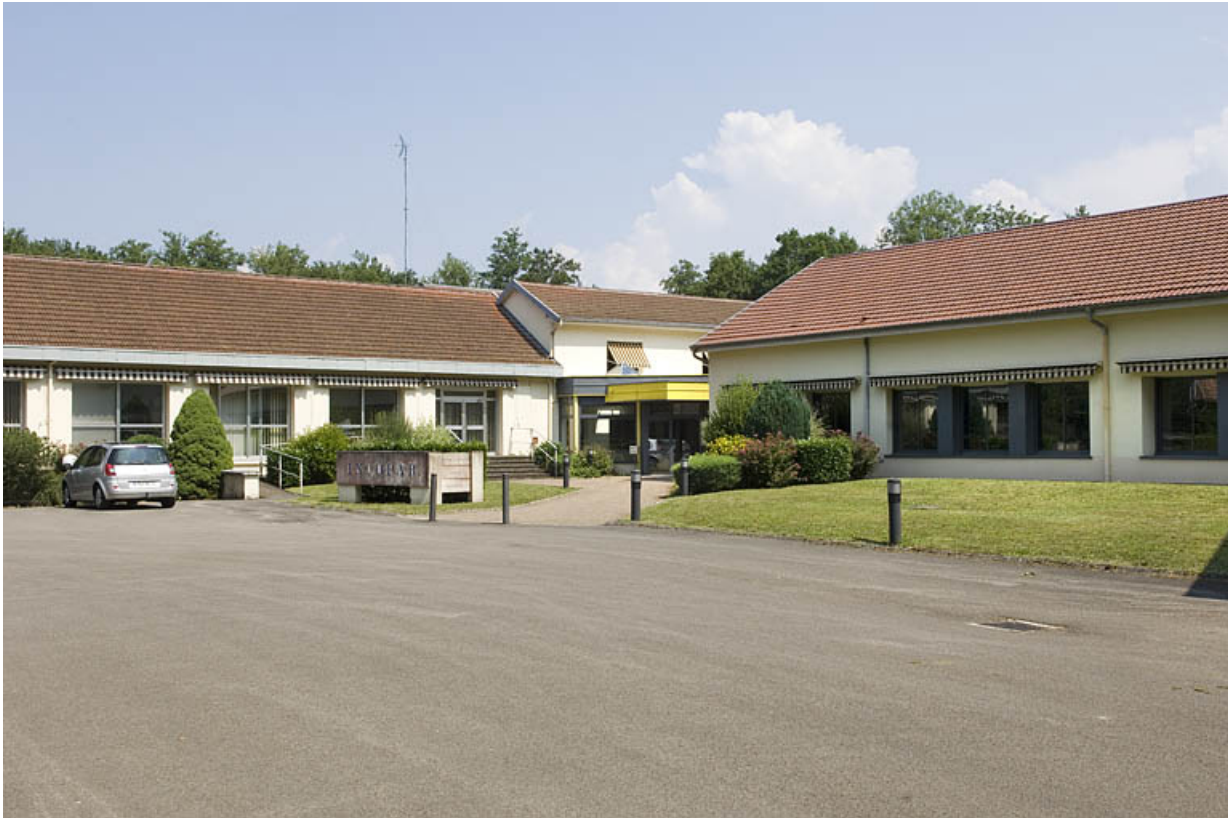
Vue d'ensemble depuis l'entrée.