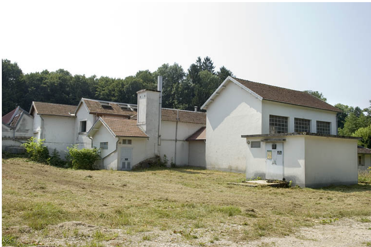
Salle des machines et bâtiment d'eau vus de trois quarts arrière. 70, La Côte rue du Tissage