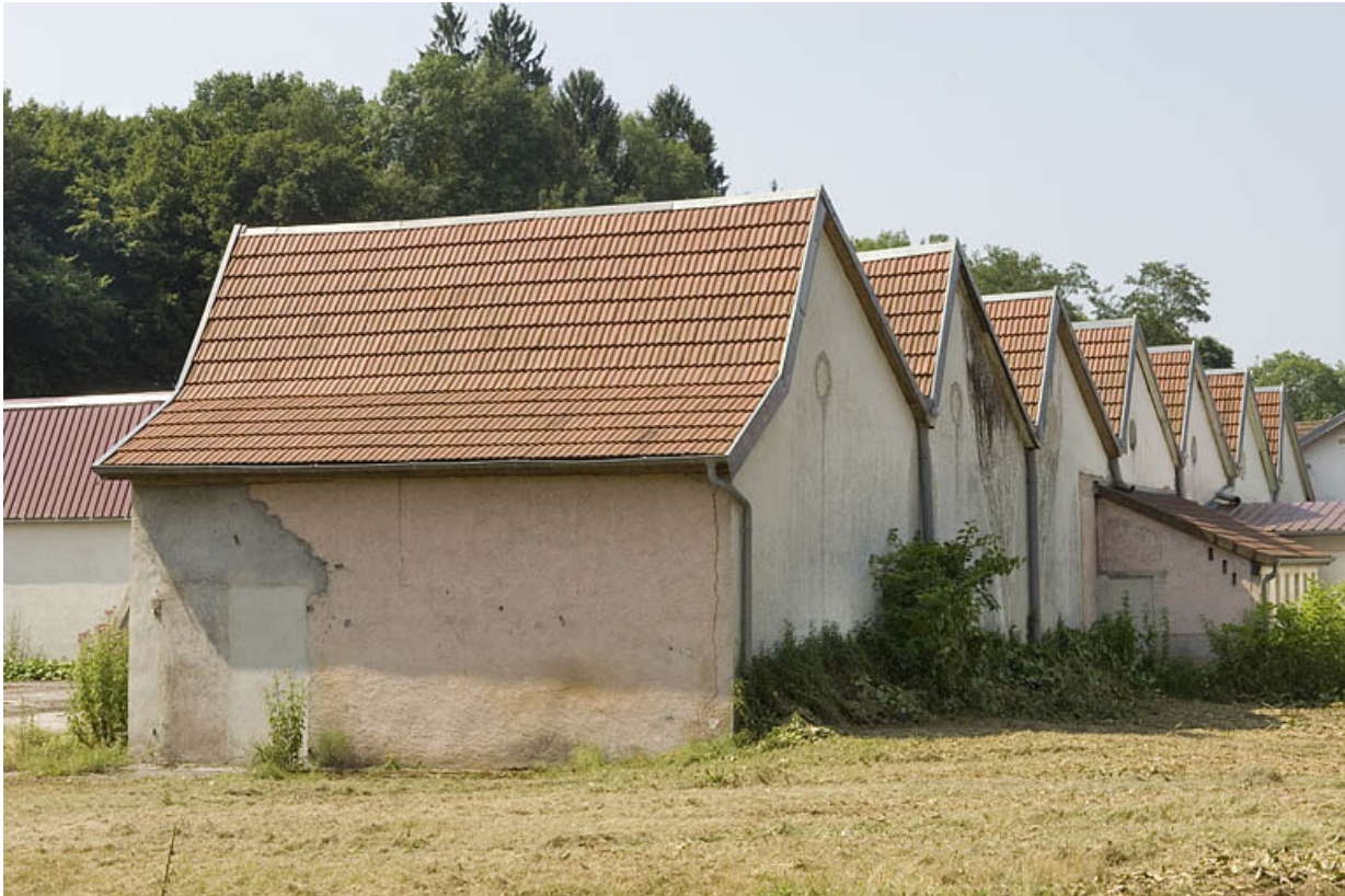
Atelier de fabrication couvert de sheds.