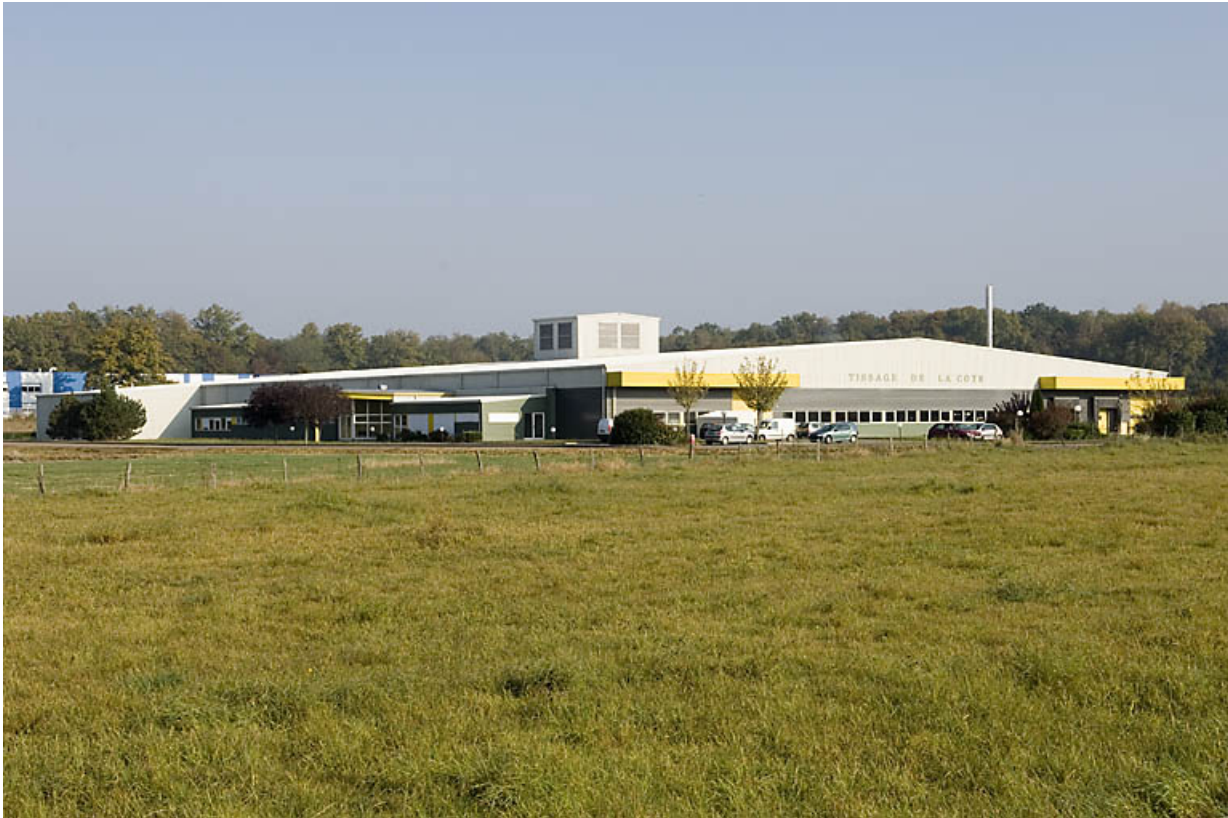
Vue d'ensemble du nouveau tissage (R.N. 19).