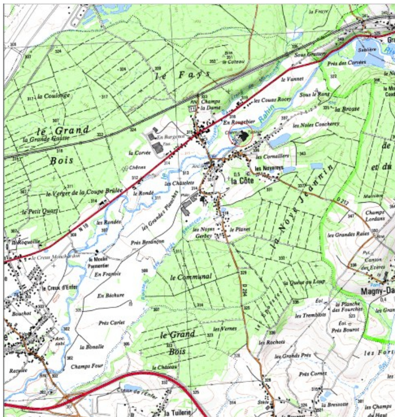
Carte de localisation. Carte topographique au 1:25000, I.G.N., Lure, 3521 O. SCAN 25 70, La Côte rue du Tissage