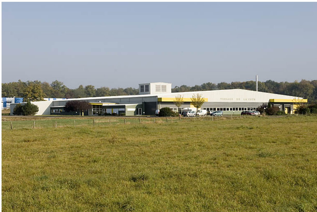
Vue d'ensemble du nouveau tissage (R.N. 19). 70, La Côte rue du Tissage