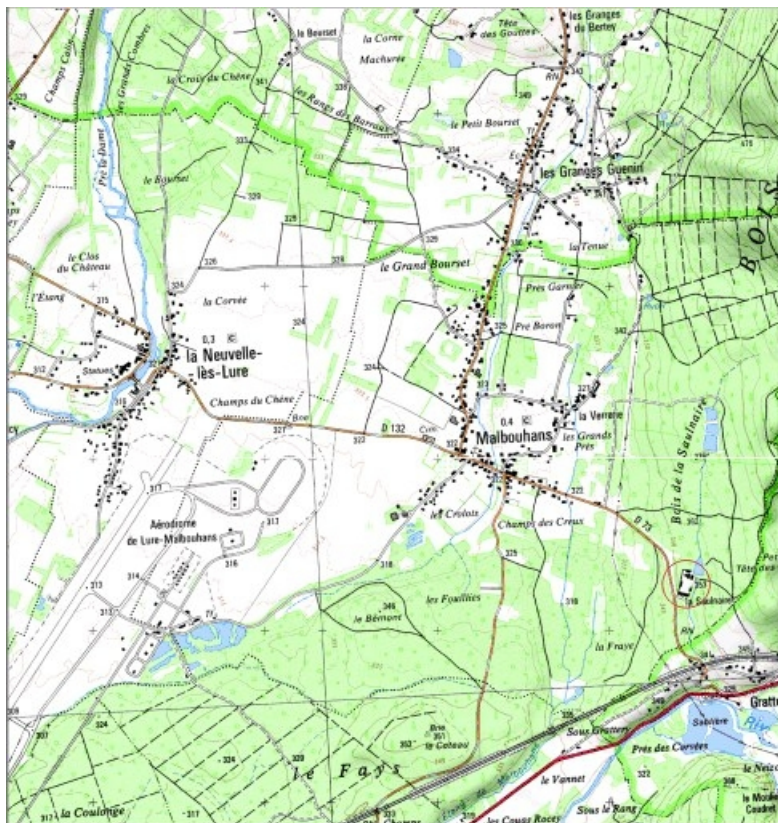
Carte de localisation. Carte topographique au 1:25000, I.G.N., Mélisey, 3520 O. SCAN 25, Licence n°2008CISE29-68. 70, Malbouhans, lieu-dit : la Saulnaire