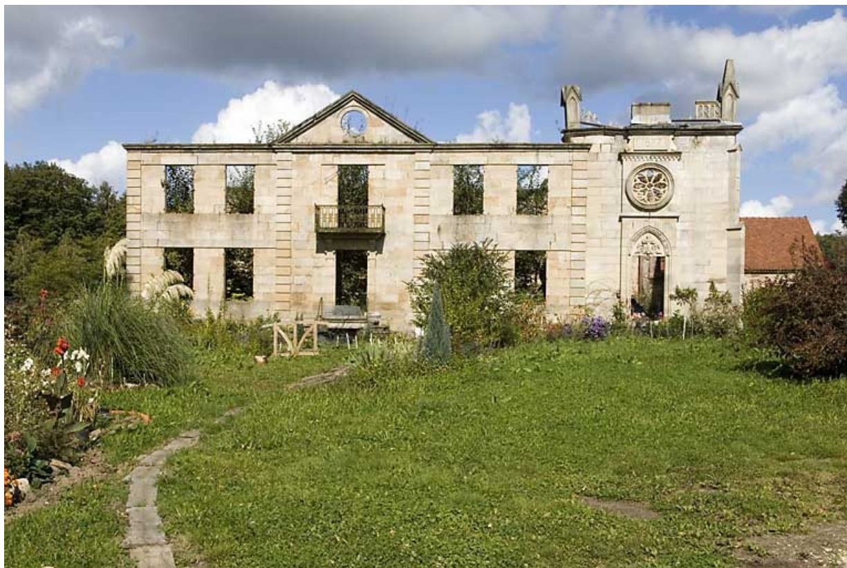
Logement patronal et chapelle. Façade antérieure.