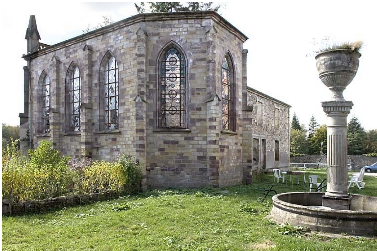
La chapelle, vue de trois quarts arrière. 70, Malbouhans, lieudit : la Saulnaire