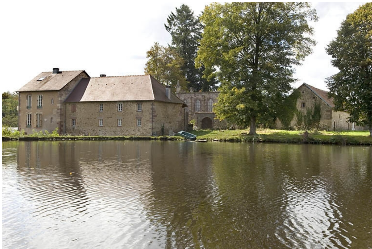
Logements est et chapelle. Vue depuis le nord-est.