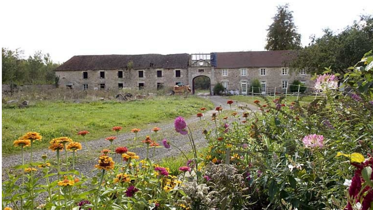
Corps de bâtiment des logements. Vue depuis le nord.