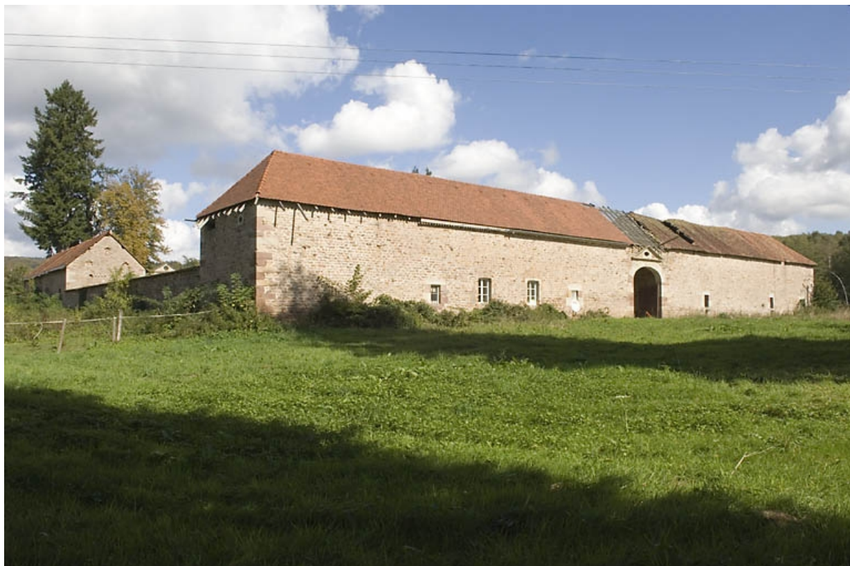
Vue d'ensemble depuis le sud-ouest.