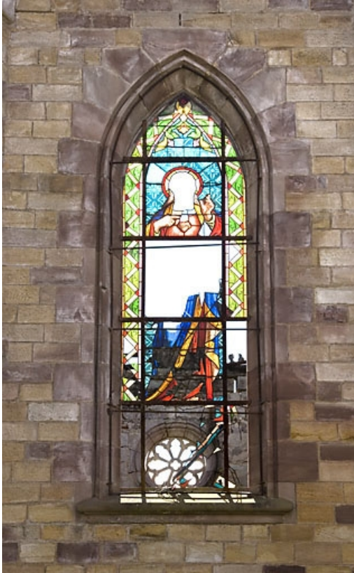
Verrière de la chapelle.