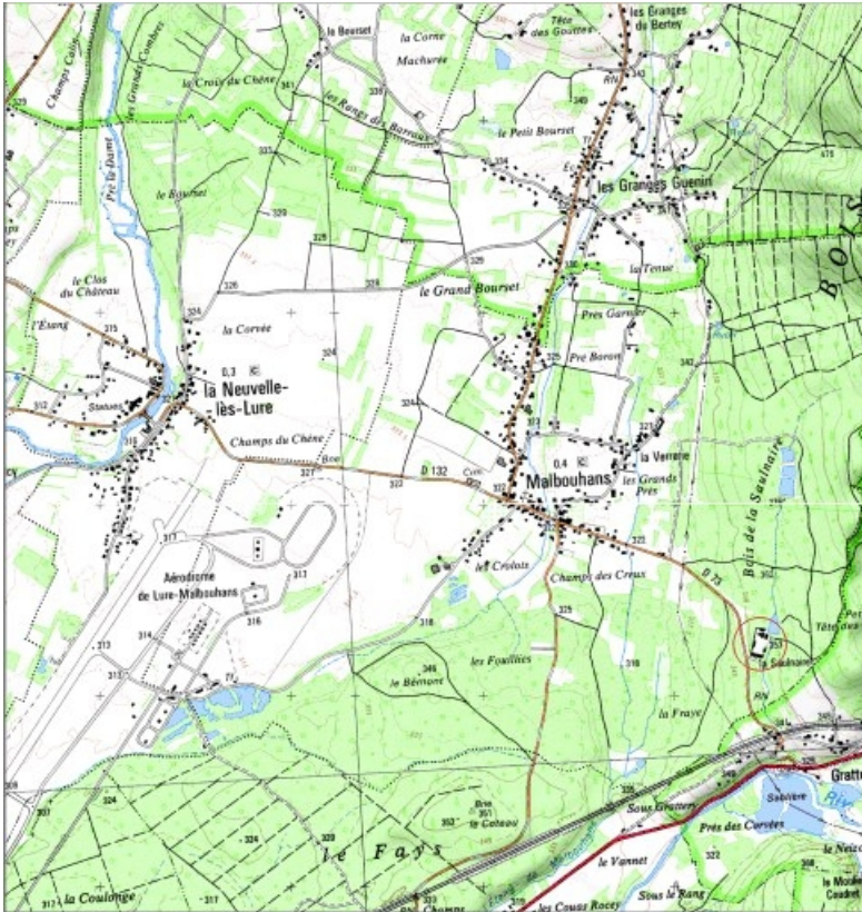
Carte de localisation. Carte topographique au 1:25000, I.G.N., Mélisey, 3520 O. SCAN 25, Licence n°2008CISE29-68. 70, Malbouhans, lieu-dit : la Saulnaire