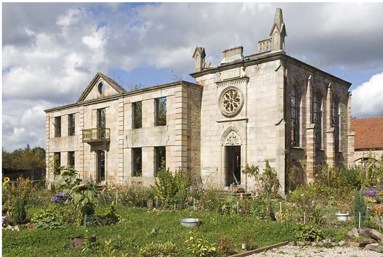
Logement patronal et chapelle. Vue de trois quarts.