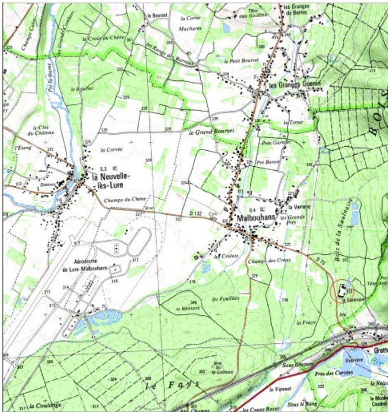
Carte de localisation. Carte topographique au 1:25000, I.G.N., Mélisey, 3520 O. 70, Malbouhans, lieu-dit : la Saulnaire