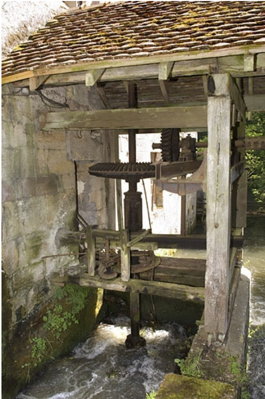
Local de la turbine.

70, Vy-lès-Lure, lieudit : le Moulin Blanc