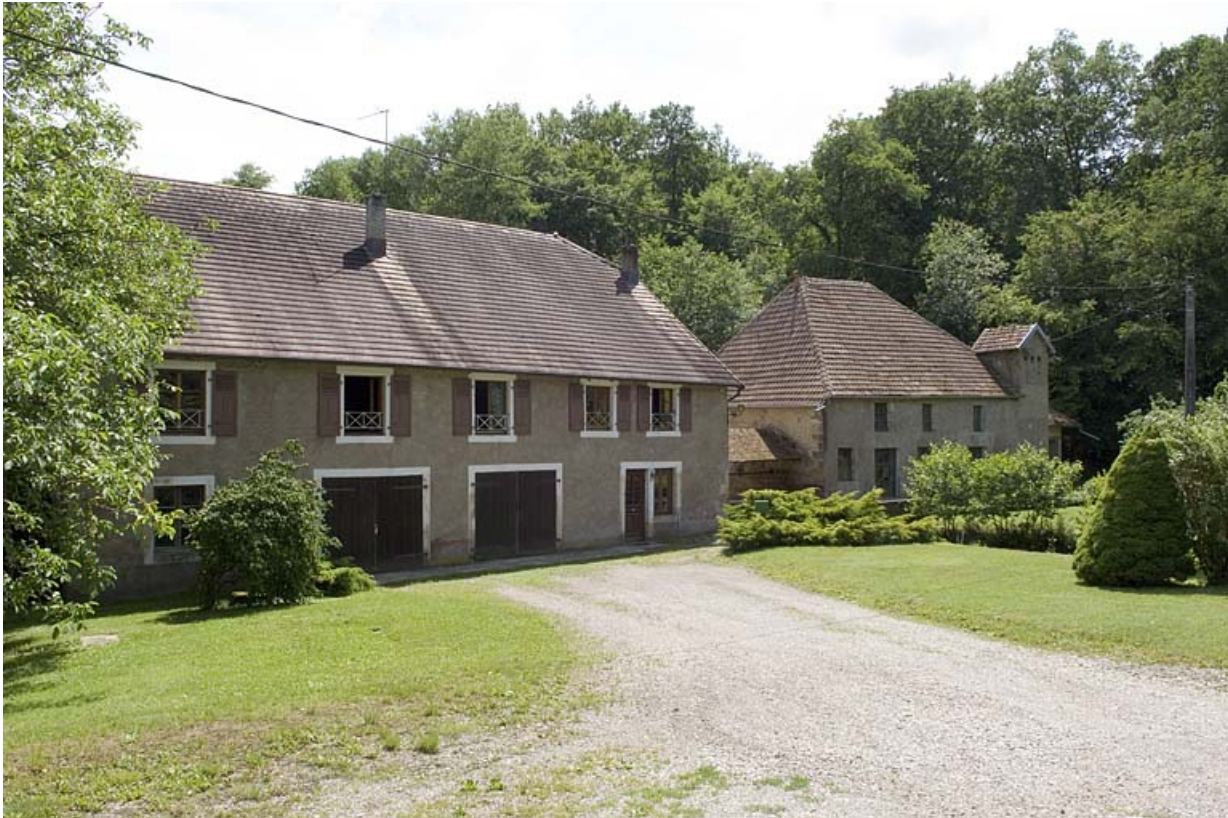
Logement et atelier de fabrication depuis le nord-est.

70, Vy-lès-Lure, lieudit : le Moulin Blanc