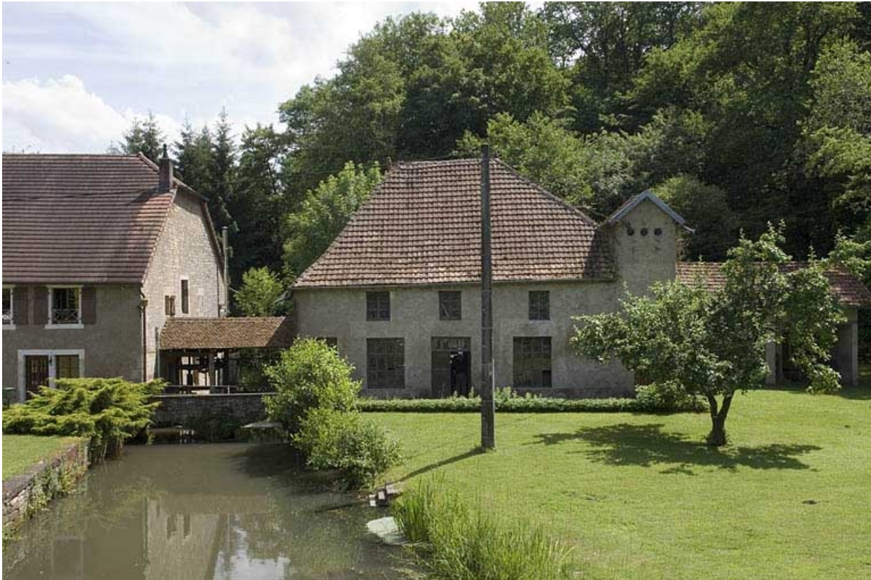
Le bief d'amenée et l'atelier de fabrication depuis le nord.

70, Vy-lès-Lure, lieudit : le Moulin Blanc