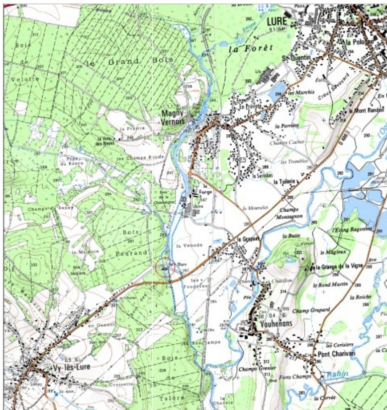
Carte de localisation. Carte topographique au 1:25000, I.G.N., Villersexel, 3421 E. SCAN 25, Licence n°2008CISE29-68. 70, Vy-lès-Lure, lieudit : le Moulin Blanc