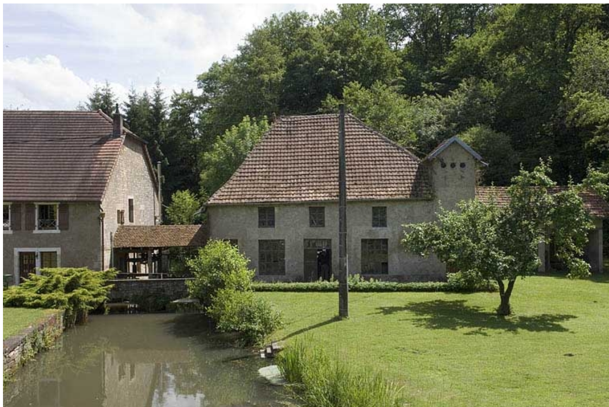
Le bief d'amenée et l'atelier de fabrication depuis le nord.

70, Vy-lès-Lure, lieudit : le Moulin Blanc