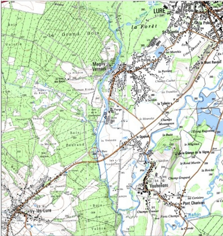
Carte de localisation. Carte topographique au 1:25000, I.G.N., Villersexel, 3421 E. Licence n°2008CISE29-68. 70, Vy-lès-Lure, lieudit : le Moulin Blanc