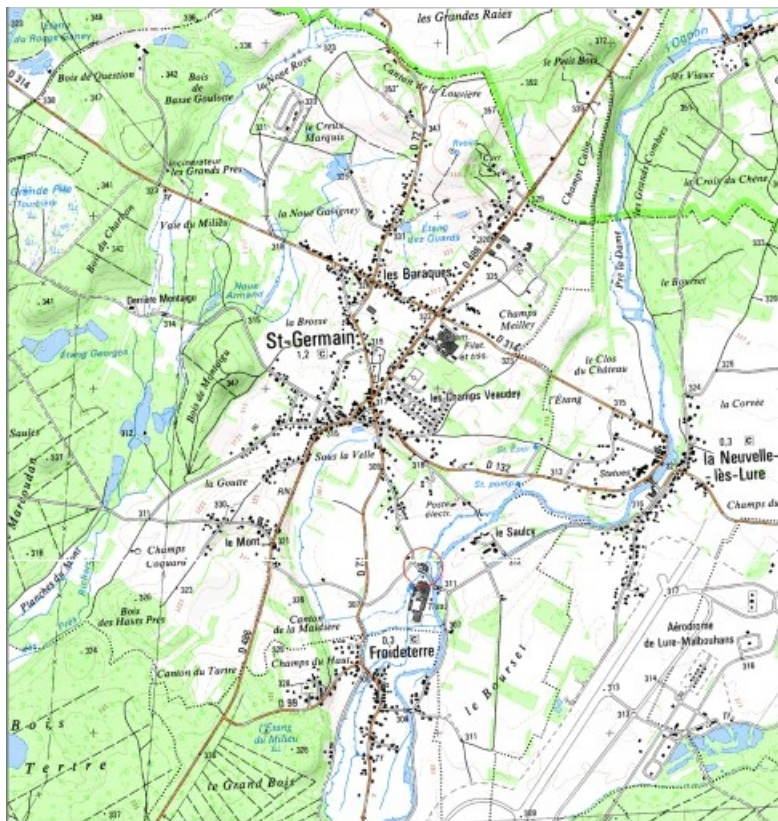
Carte de localisation. Carte topographique au 1:25000, I.G.N., Lure, 3520 O. 70, Saint-Germain, lieu-dit : le Saulcy