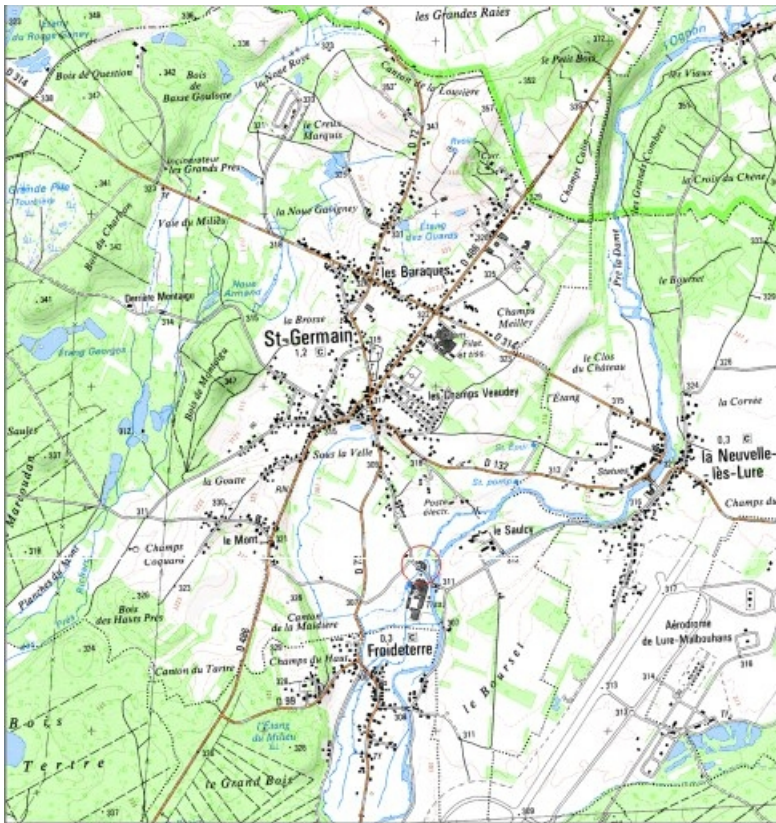
Carte de localisation. Carte topographique au 1:25000, I.G.N., Lure, 3520 O. 70, Saint-Germain, lieudit : le Saulcy