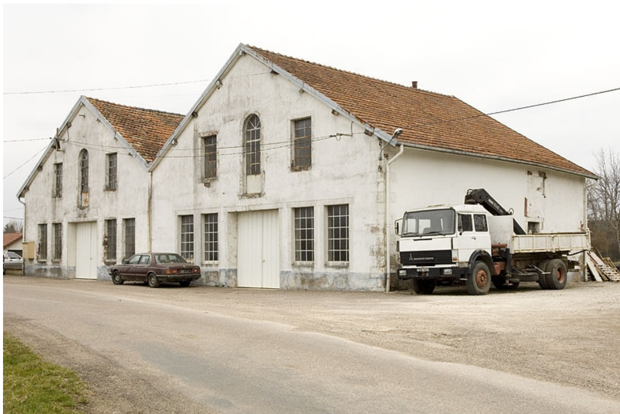
Les ateliers de fabrication vus de trois quarts.