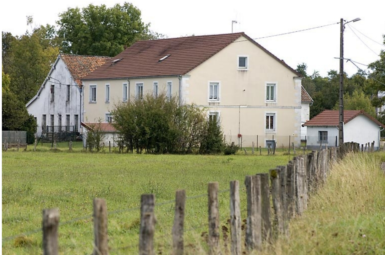
Vue rapprochée depuis le nord-ouest.