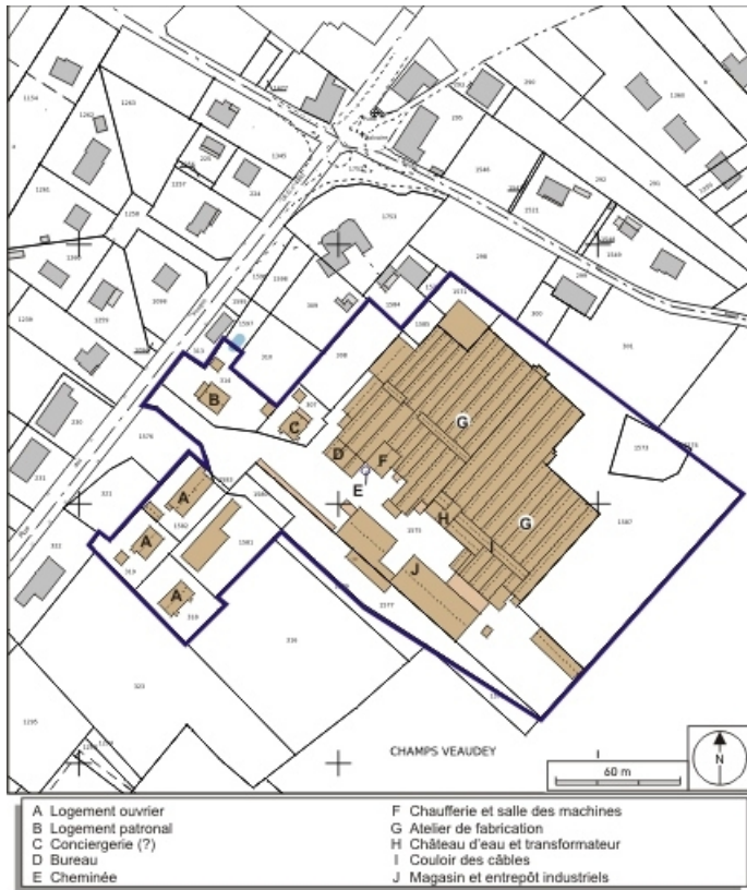
Plan-masse et de situation. Extrait du plan cadastral numérisé, 2008, section C, 1:1250 réduit à 1:2000. Source : Direction générale des Finances Publiques - Cadastre ; mise à jour : 2008.