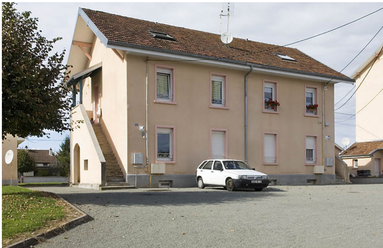
Logement ouvrier. Vue de trois quarts. 70, Saint-Germain, 38 rue des Vosges