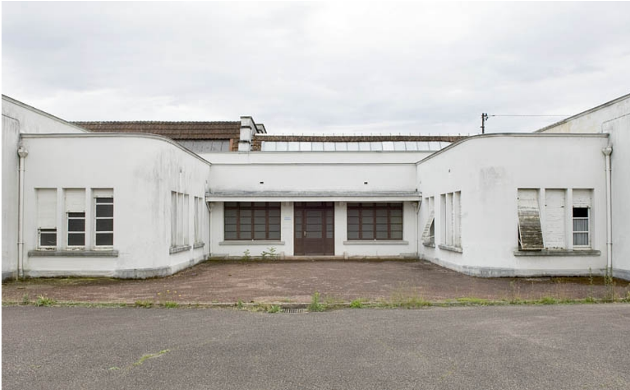
Les bureaux. Vue de face.