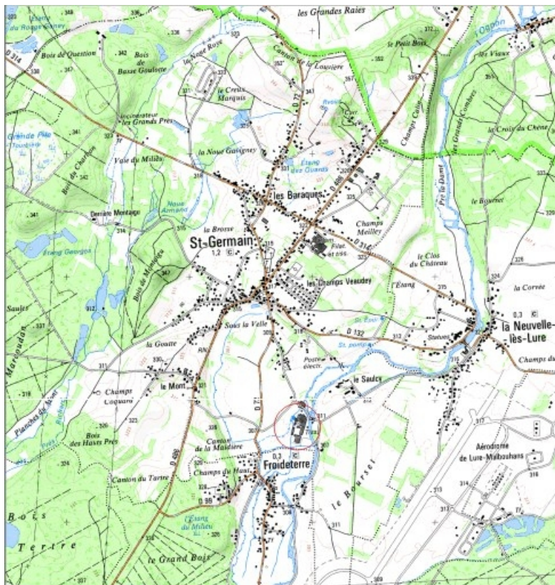
Carte de localisation. Carte topographique au 1:25000, I.G.N., Lure, 3520 O. SCAN 25 70, Saint-Germain, lieu-dit : le Saulcy