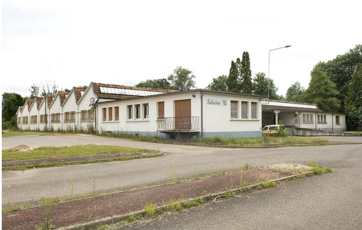
Atelier de fabrication sud. Vue de trois quarts.