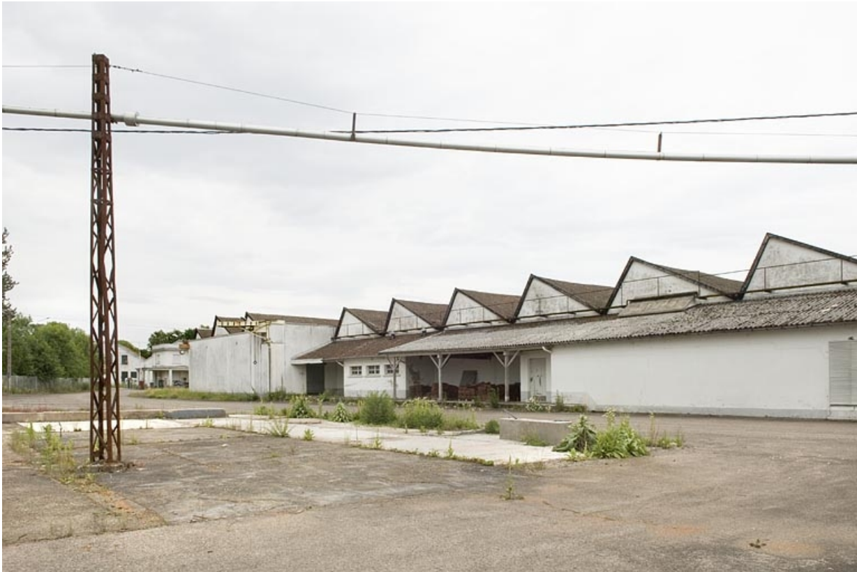
Atelier de fabrication depuis le sud-est.