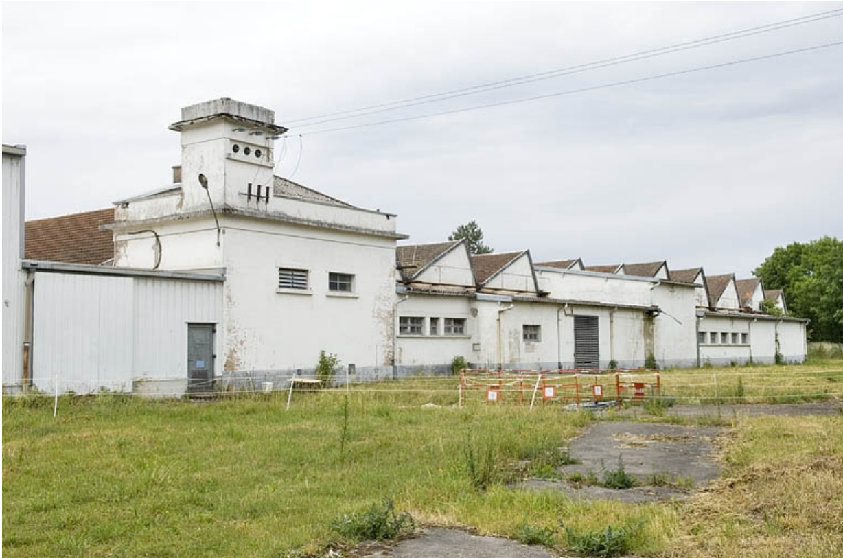
Façade est de l'atelier de fabrication.