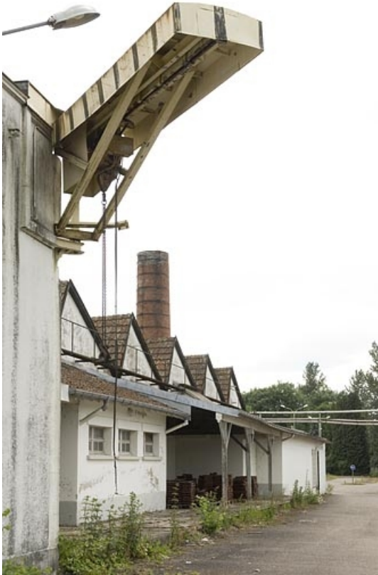
Pignons ouest de l'atelier de tissage.