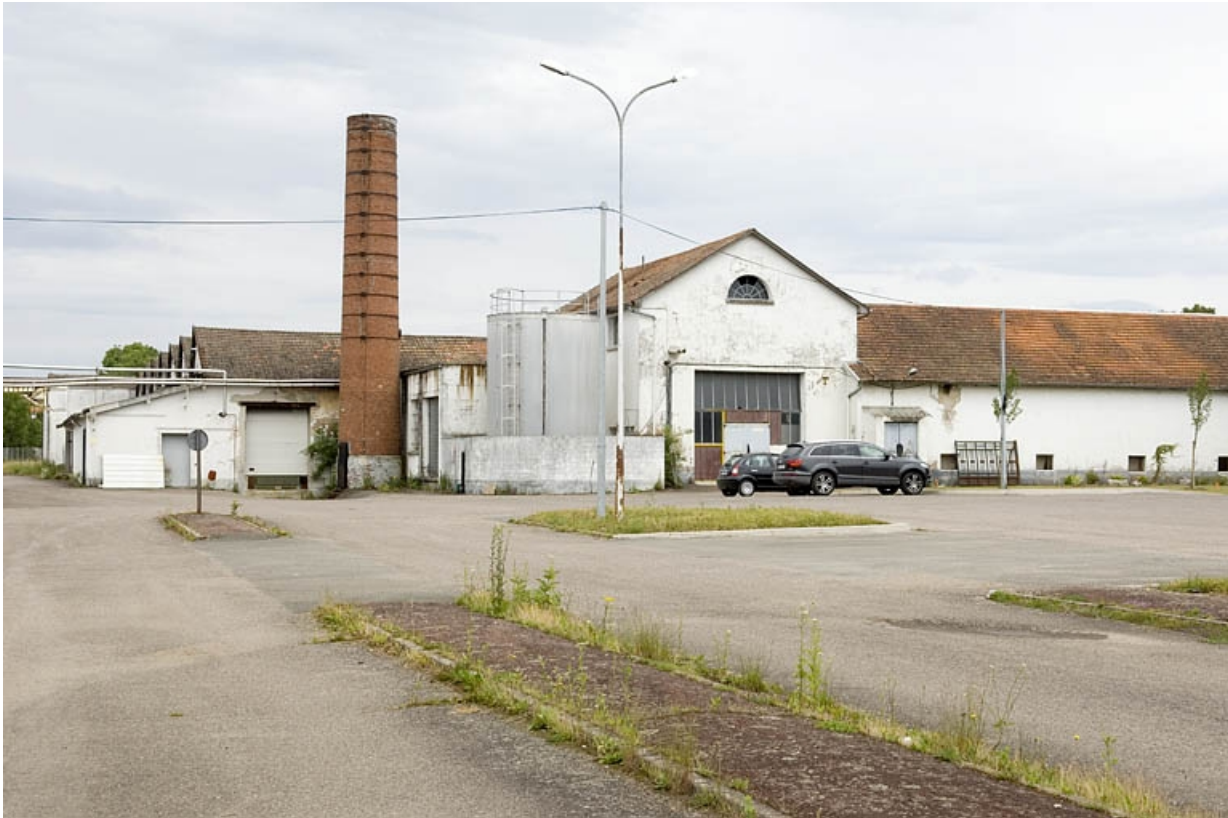
Atelier de fabrication, cheminée et salle des machine depuis le sud-ouest. 70, Saint-Germain, lieudit : le Saulcy