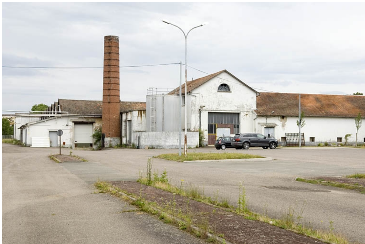
Atelier de fabrication, cheminée et salle des machine depuis le sud-ouest. 70, Saint-Germain, lieudit : le Saulcy