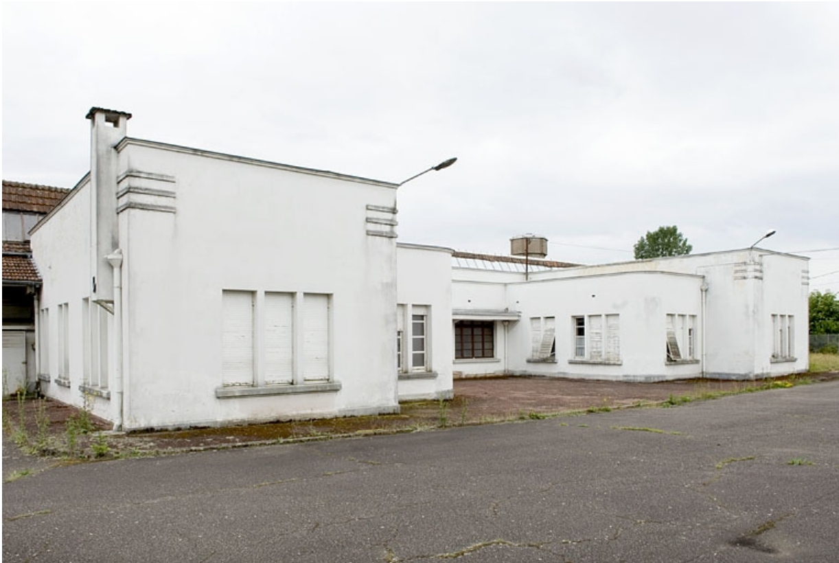
Les bureaux. Vue de trois quarts gauche.