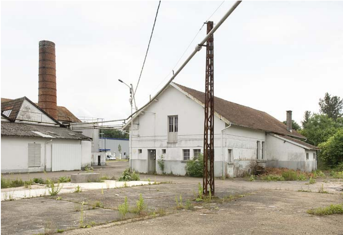
Cheminée et garage à camions.