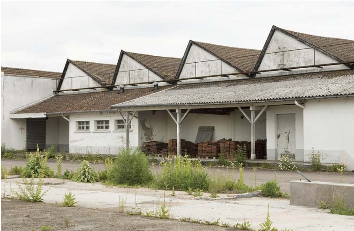
Détail des pignons des sheds de l'atelier de fabrication.