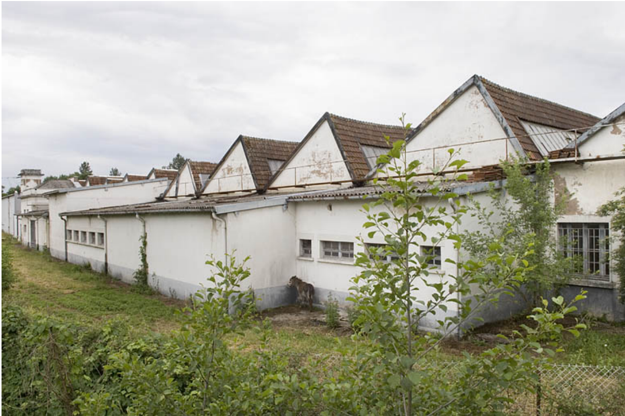
Façade est vue de trois quarts.