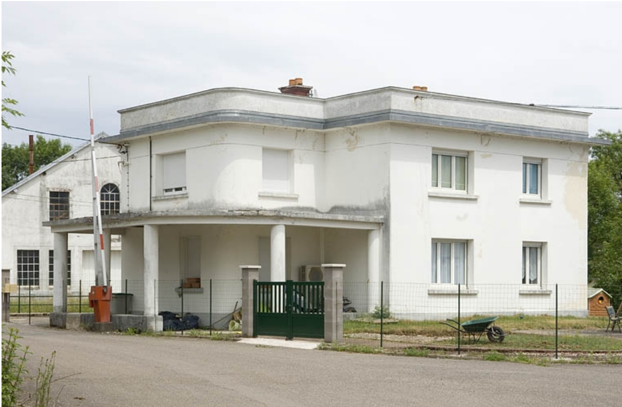
La conciergerie vue depuis la cour.