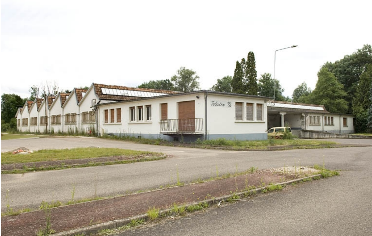
Atelier de fabrication sud. Vue de trois quarts.