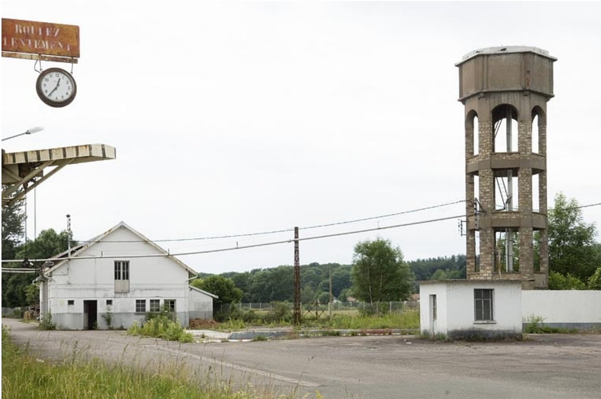
Garage à camions et château d'eau.